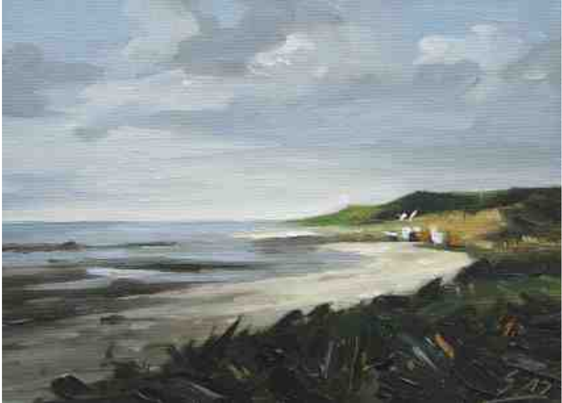
Blick zum Strand 2015 | Öl/Lw./Holz | 13 x 18 cm