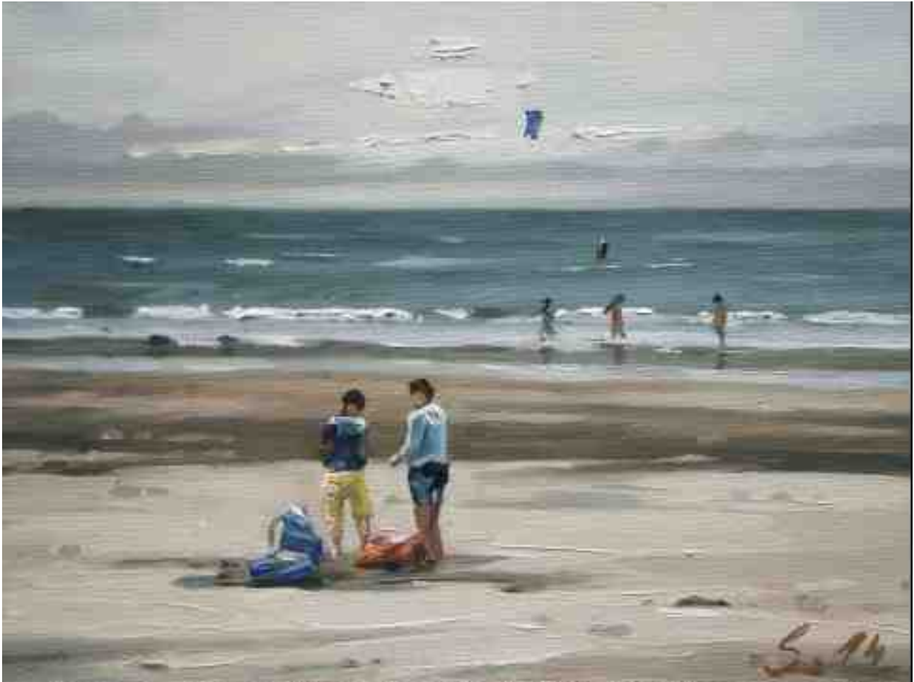
Begegnungen am Strand II 2014 | Öl/Lw./Holz | 15 x 20 cm