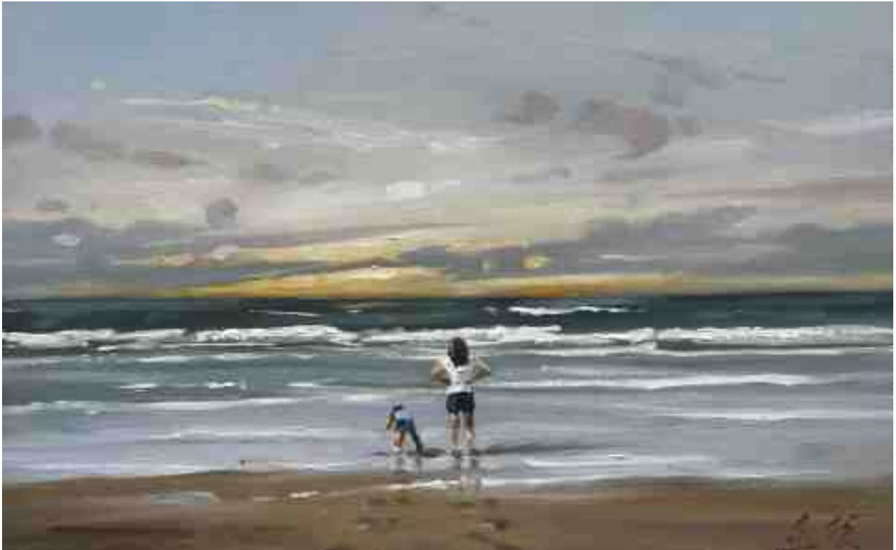
Abends am Strand 2015 | Öl/Holz | 18.5 x 30 cm