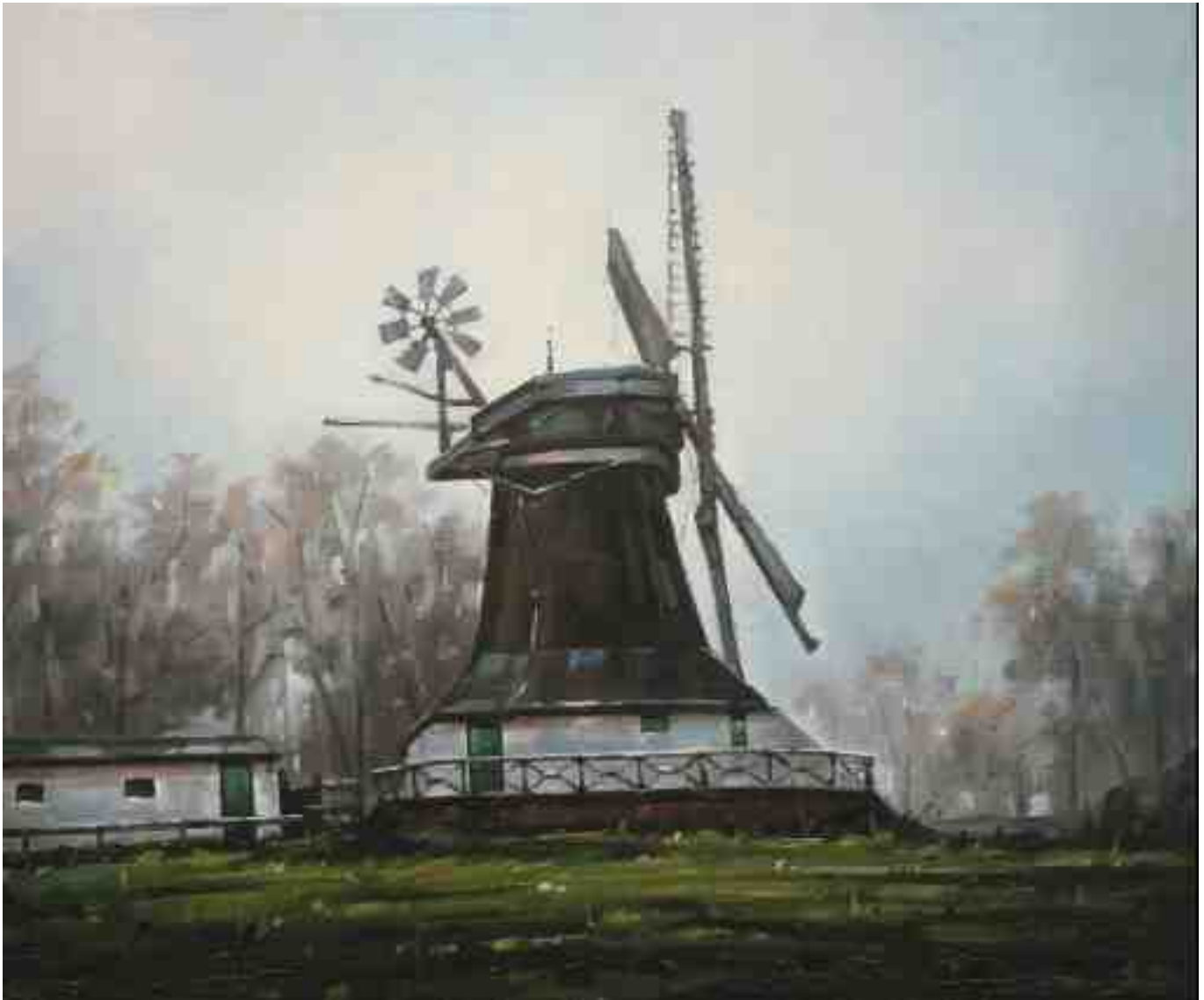
Windmühle bei Worpswede 2015 | Öl/Lw. | 50 x 60 cm