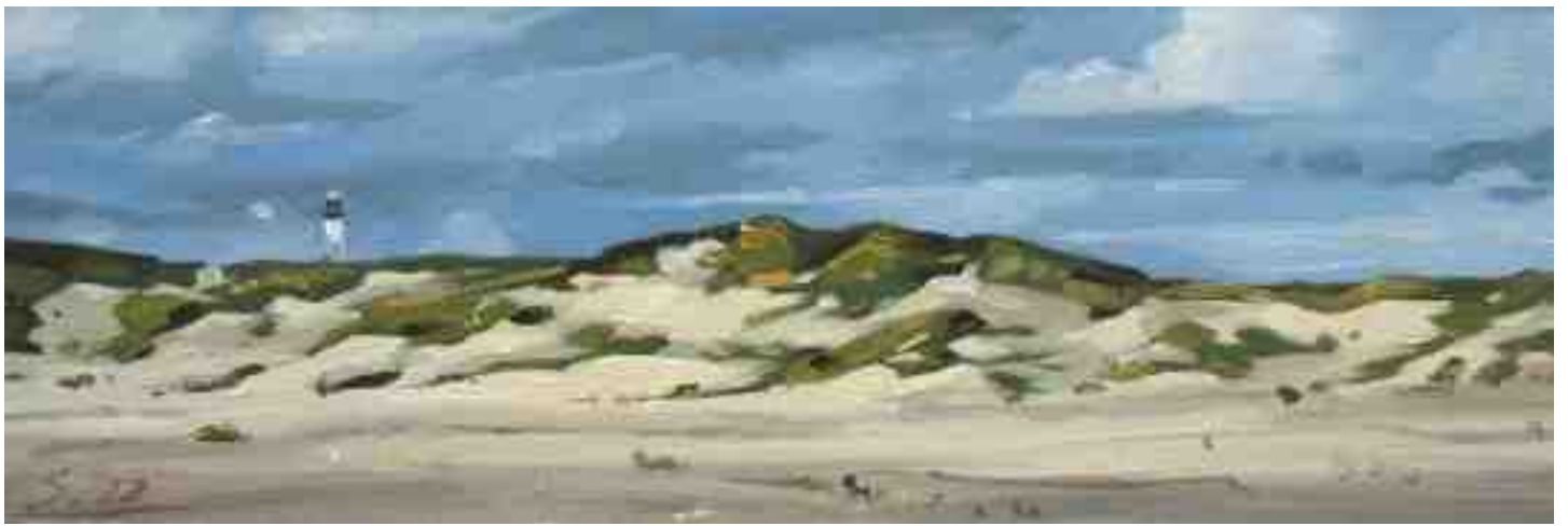
Dünen auf Amrum 2011 | Öl/Holz | 10 x 30 cm