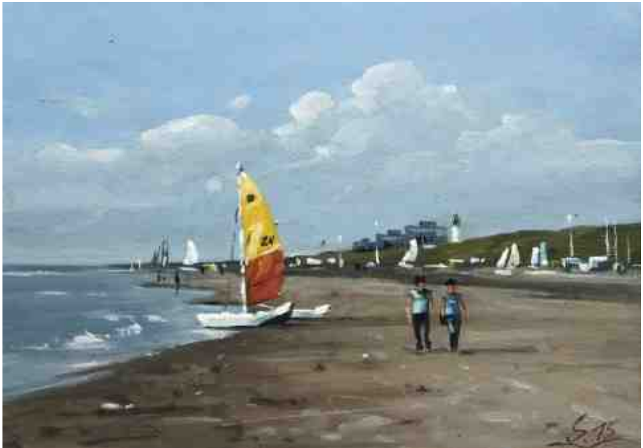
Am Strand V 2015 | Öl/Karton | 14 x 20 cm