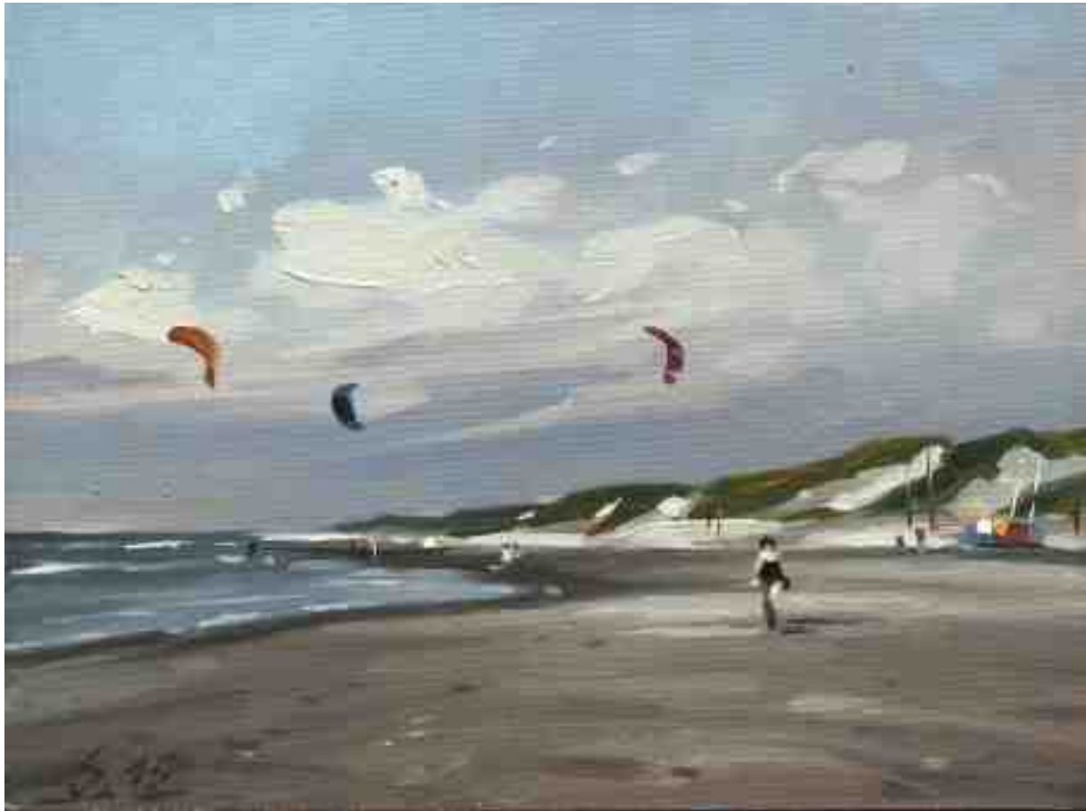
Am Strand von Egmond II 2015 | Öl/Lw./Holz | 15 x 20 cm