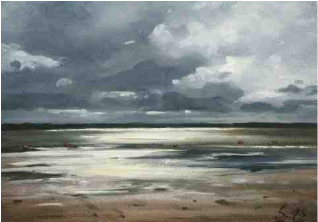
Reflektionen im Watt 2015 | Öl/Karton | 14 x 20 cm