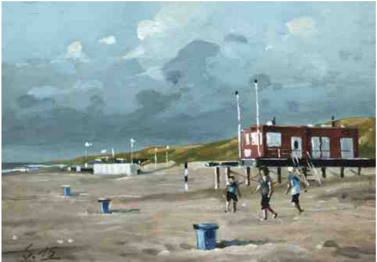
Am Strand I 2015 | Öl/Karton | 14 x 20 cm