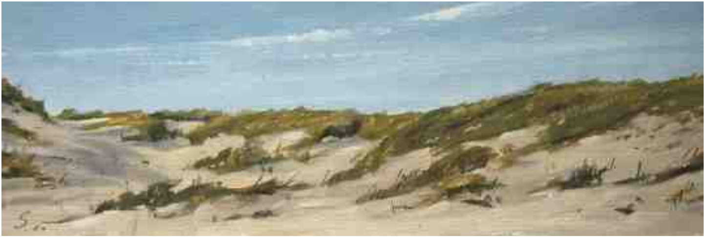
Dünen Nordsee II 2011 | Öl/Karton | 10 x 30 cm