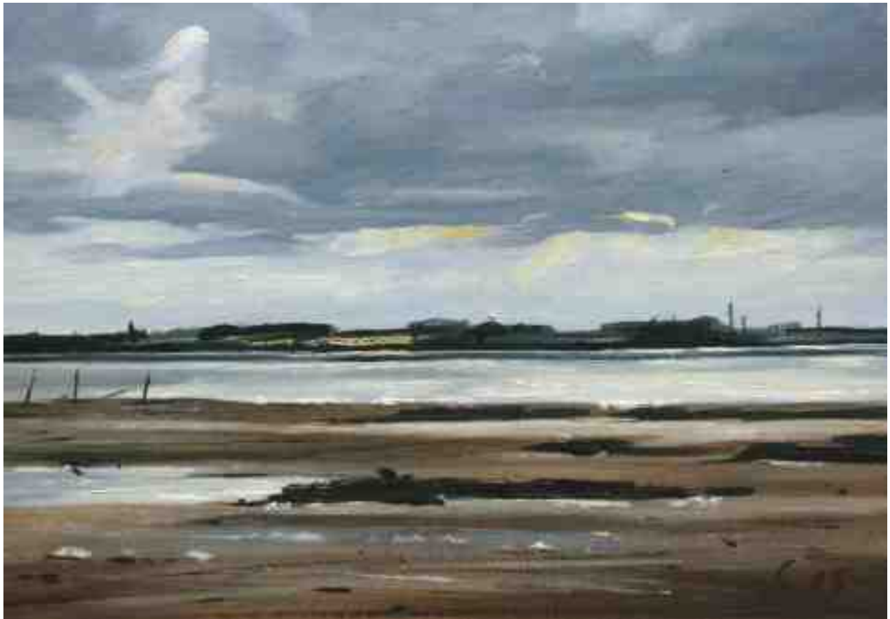
Amrum Odde Nordspitze 2015 | Öl/Karton | 14 x 20 cm