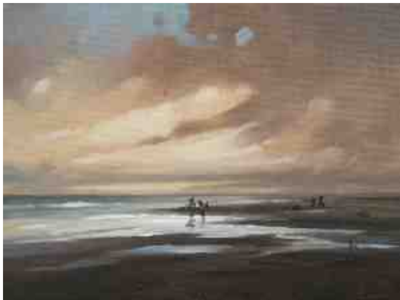
Nordlichter XI Abends 2015 | Öl/Lw. | 18 x 24 cm