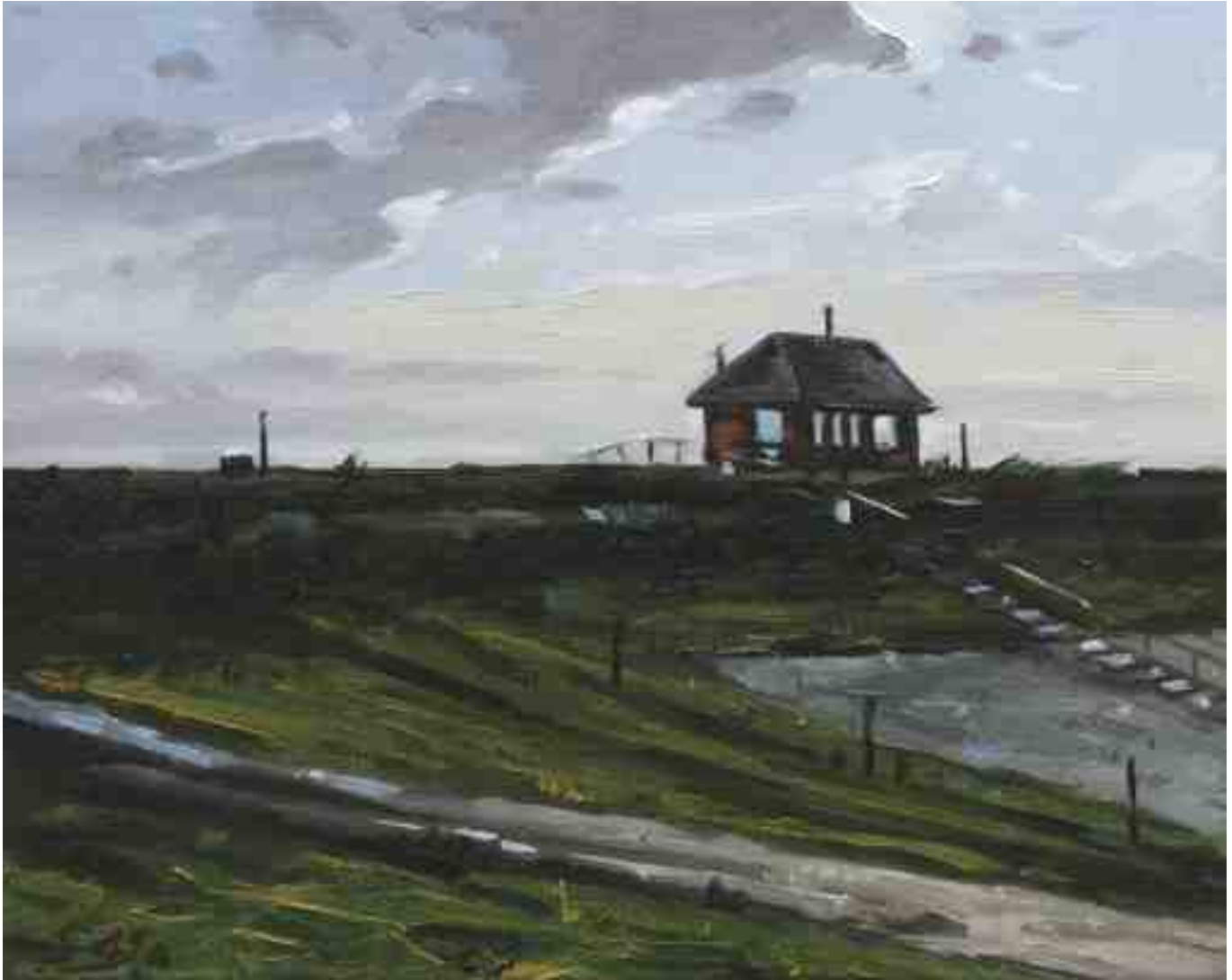
Hinterm Deich Nordstrand 2015 | Öl/Lw. | 24 x 30 cm