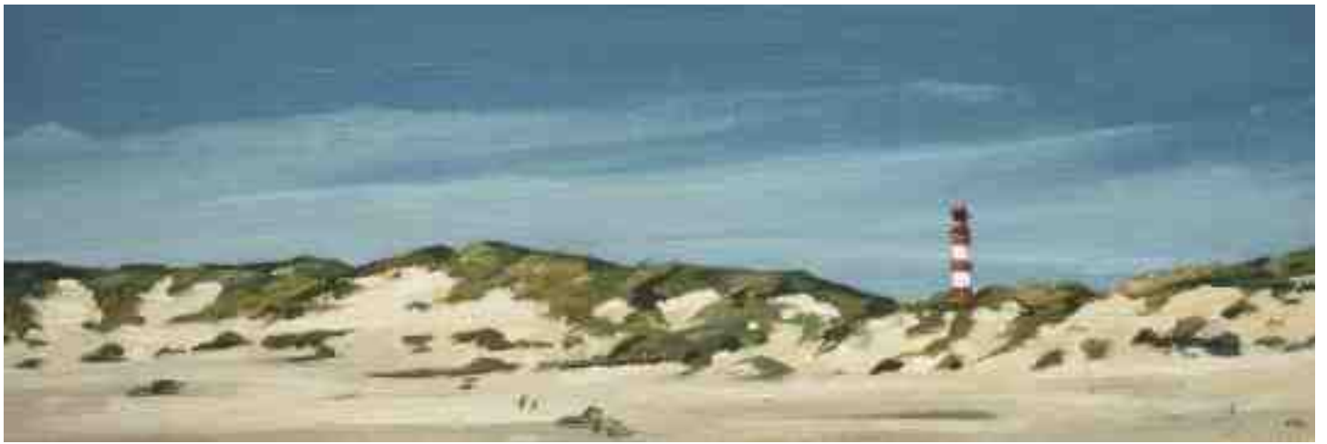
Dünen mit Leuchtturm auf Amrum 2011 | Öl/Holz | 10 x 30 cm