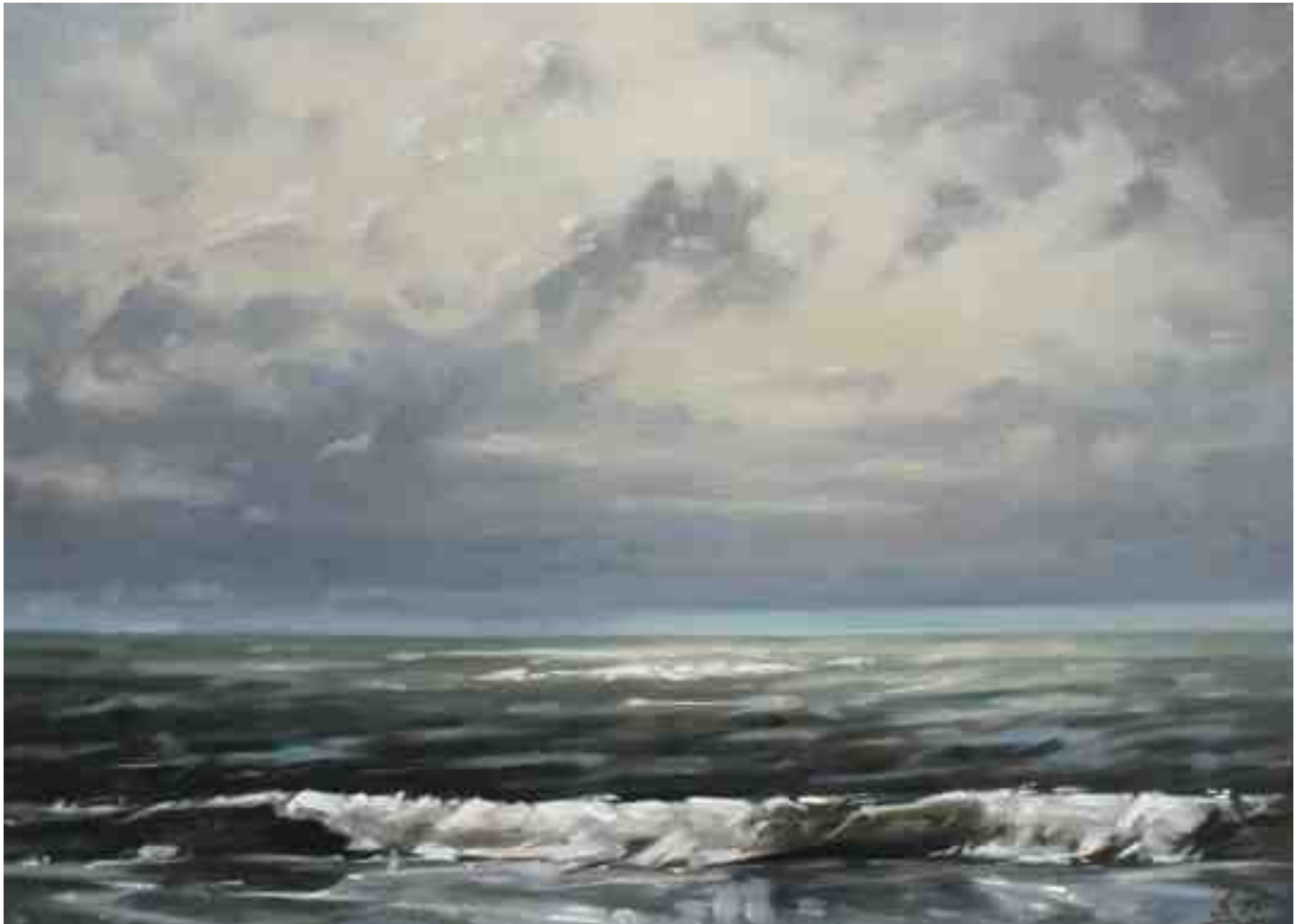
Seestück I 2015 | Öl/Lw. | 50 x 70 cm