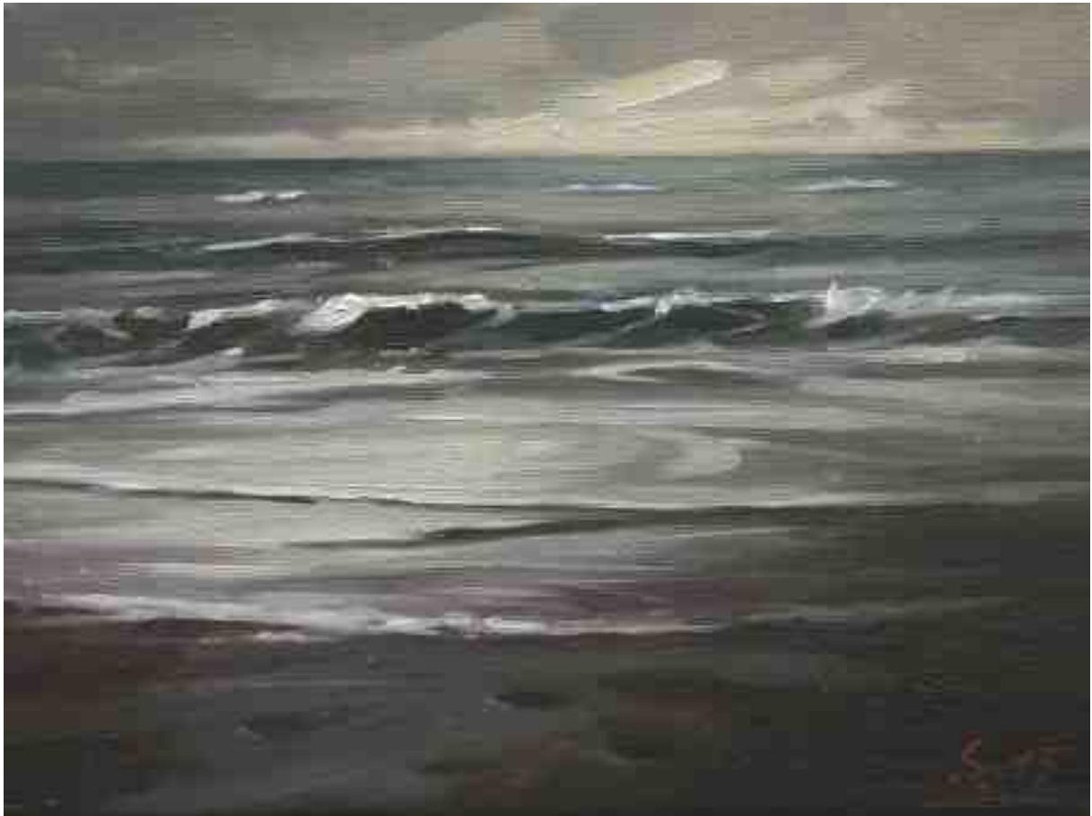
Nordlichter X Brandung 2015 | Öl/Lw. | 18 x 24 cm