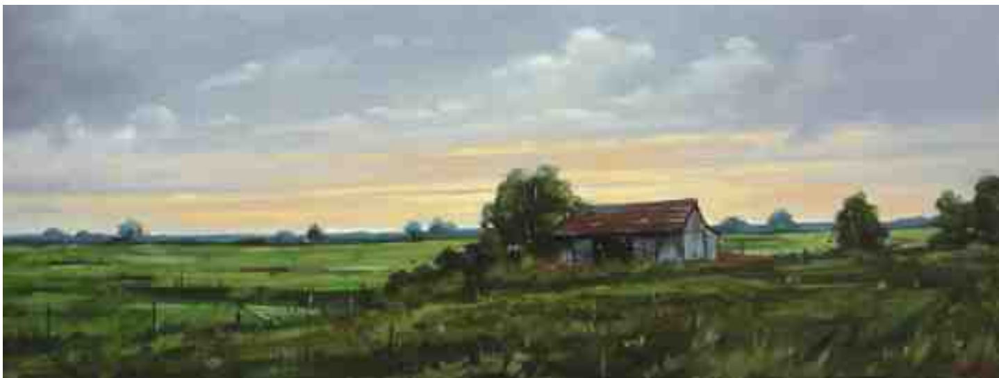
Abendstimmung bei Worpswede 2015 | Öl/Lw. | 30 x 80 cm