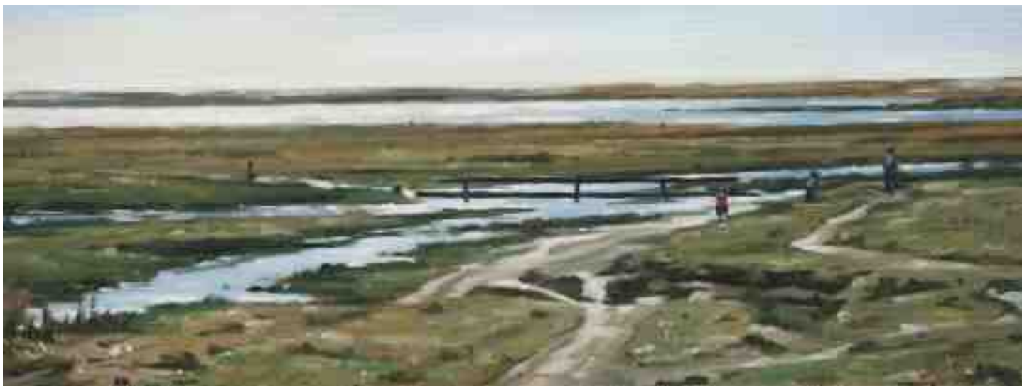
Deichvorland bei St. Peter Ording 2012 | Öl/Lw./Holz | 15 x 40 cm