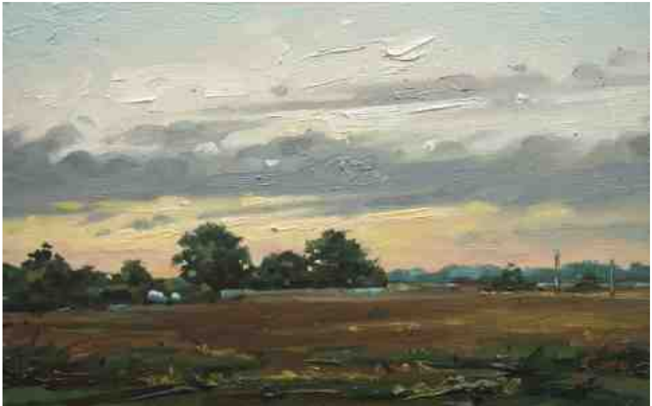
Worpsweder Licht V 2014 | Öl/Holz | 15 x 24 cm