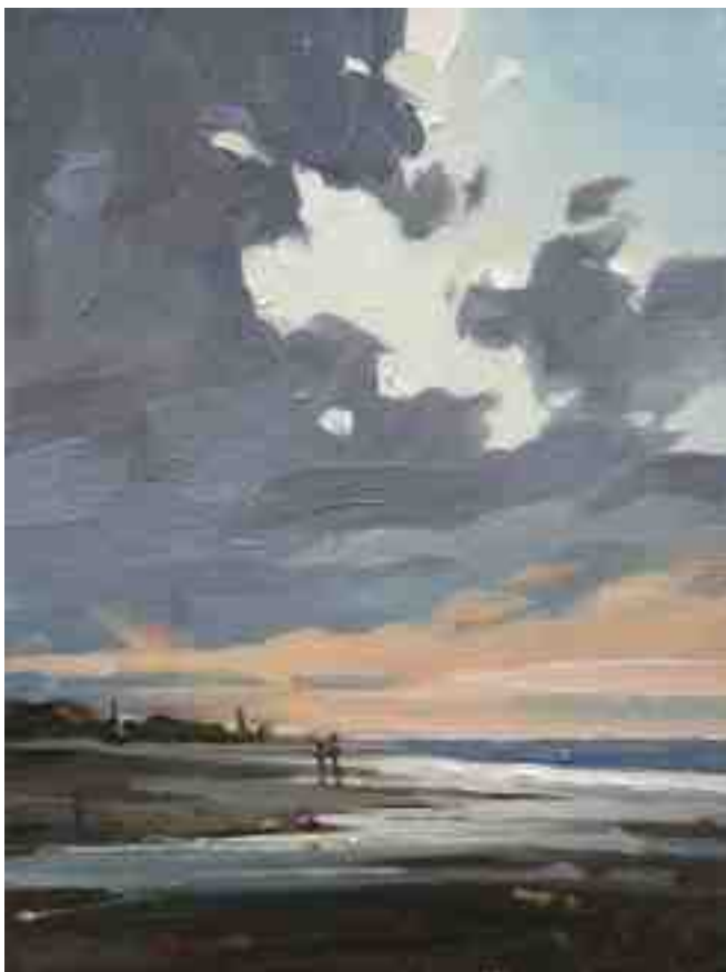
Nordlichter II Gegen Abend 2015 | Öl/Lw. | 24 x 18 cm