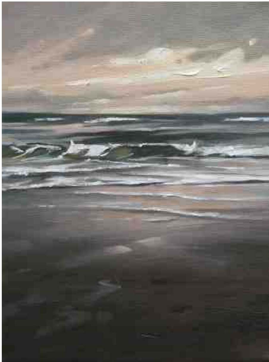
Nordlichter VIII Brandung 2015 | Öl/Lw. | 24 x 18 cm