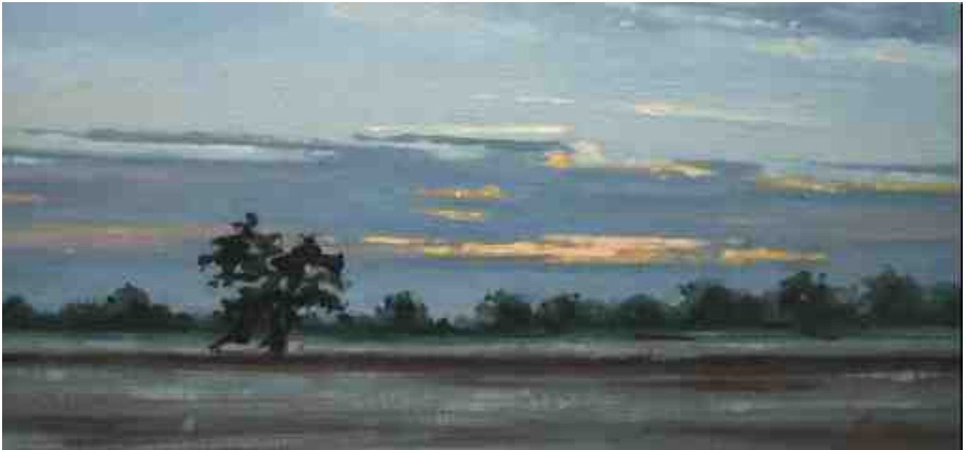
Bei Worpswede abends 2014 | Öl/Karton | 14 x 30 cm