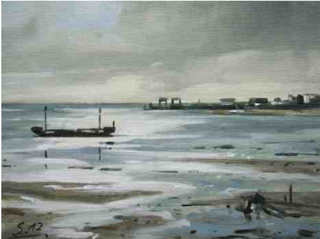
Amrum Watt im Gegenlicht 2012 | Öl/Lw./Holz | 18 x 24 cm