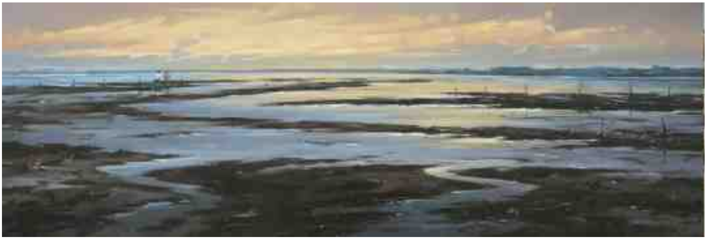
Anbrechende Nacht im Watt 2015 | Öl/Lw. | 40 x 120 cm