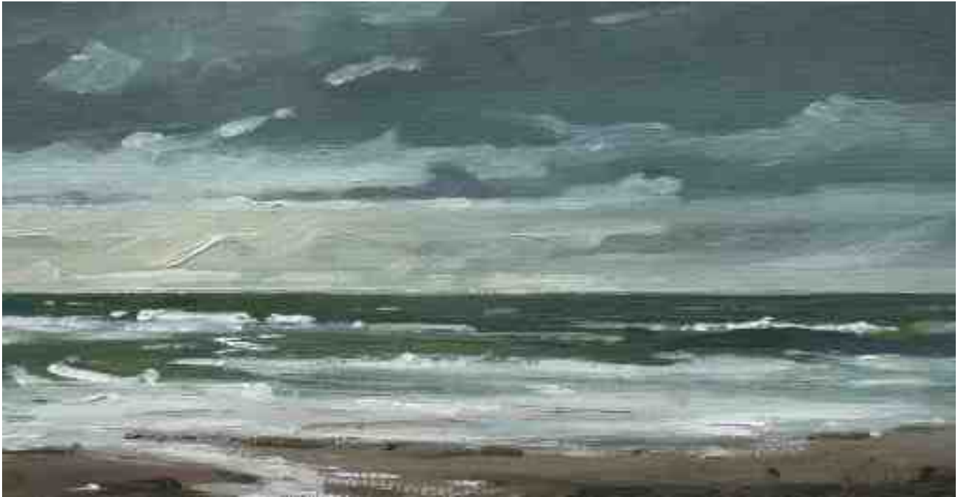
Brandung Nordsee 2011 | Öl/Karton | 13 x 25 cm