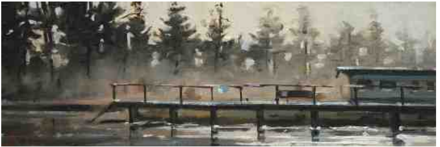
Bootssteg an der Hamme 2014 | Öl/Karton | 10 x 30 cm