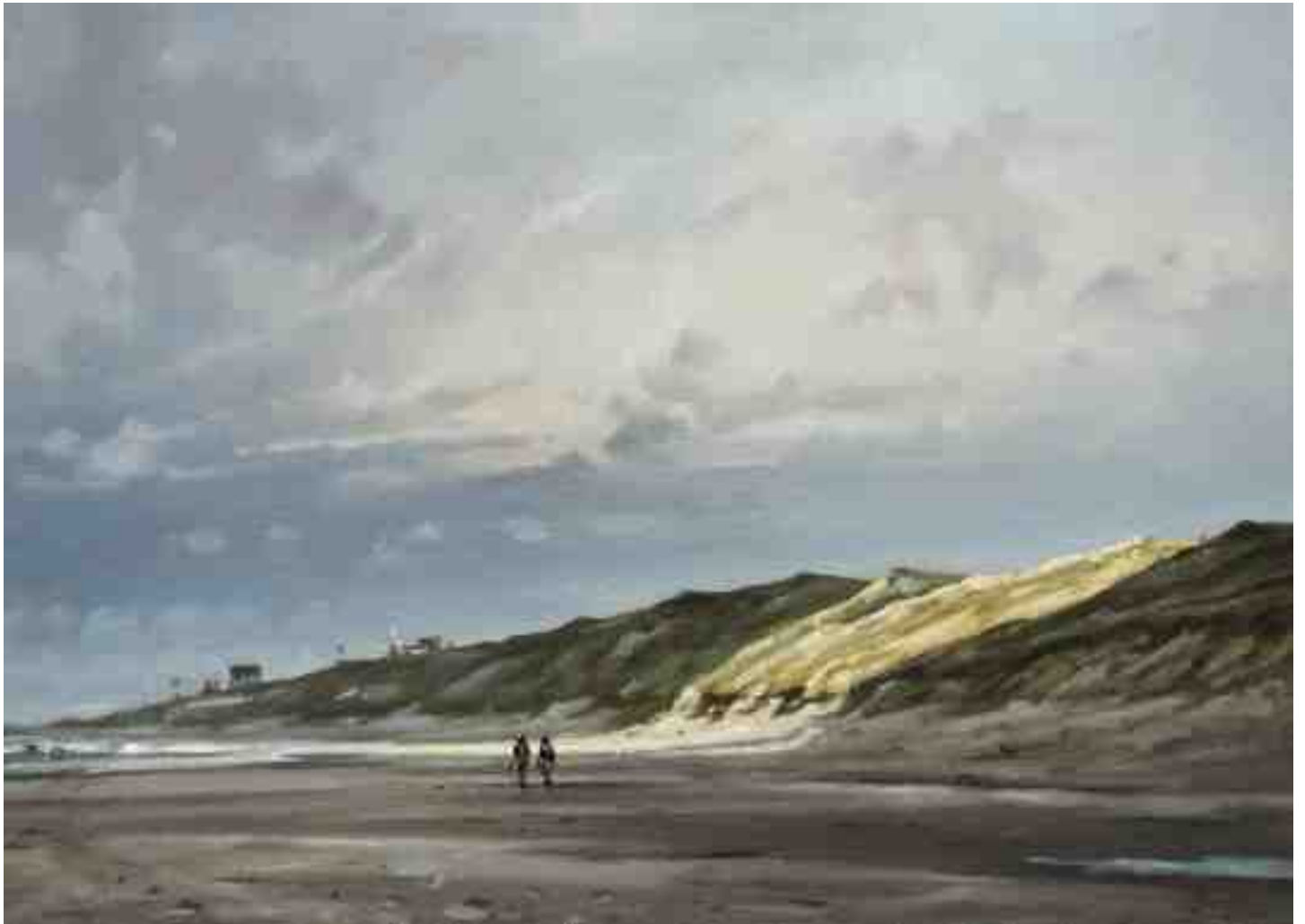
Spaziergang Richtung Bergen aan Zee 2015 | Öl/Lw. | 50 x 70 cm