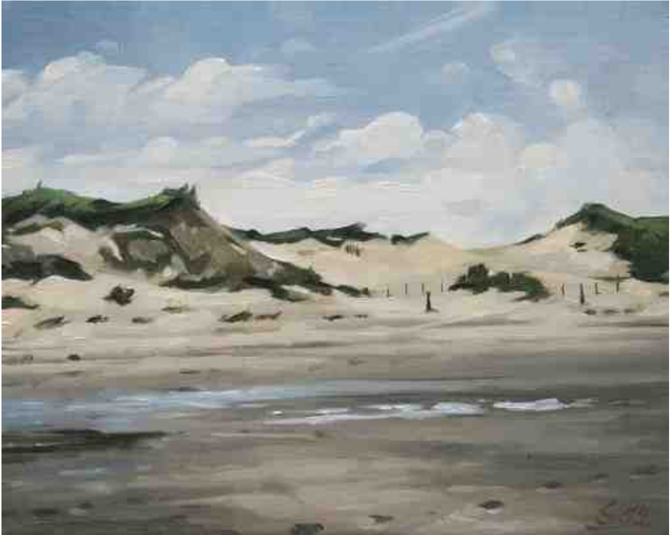
Blick auf die Dünen I 2014 | Öl/Lw. | 24 x 30 cm