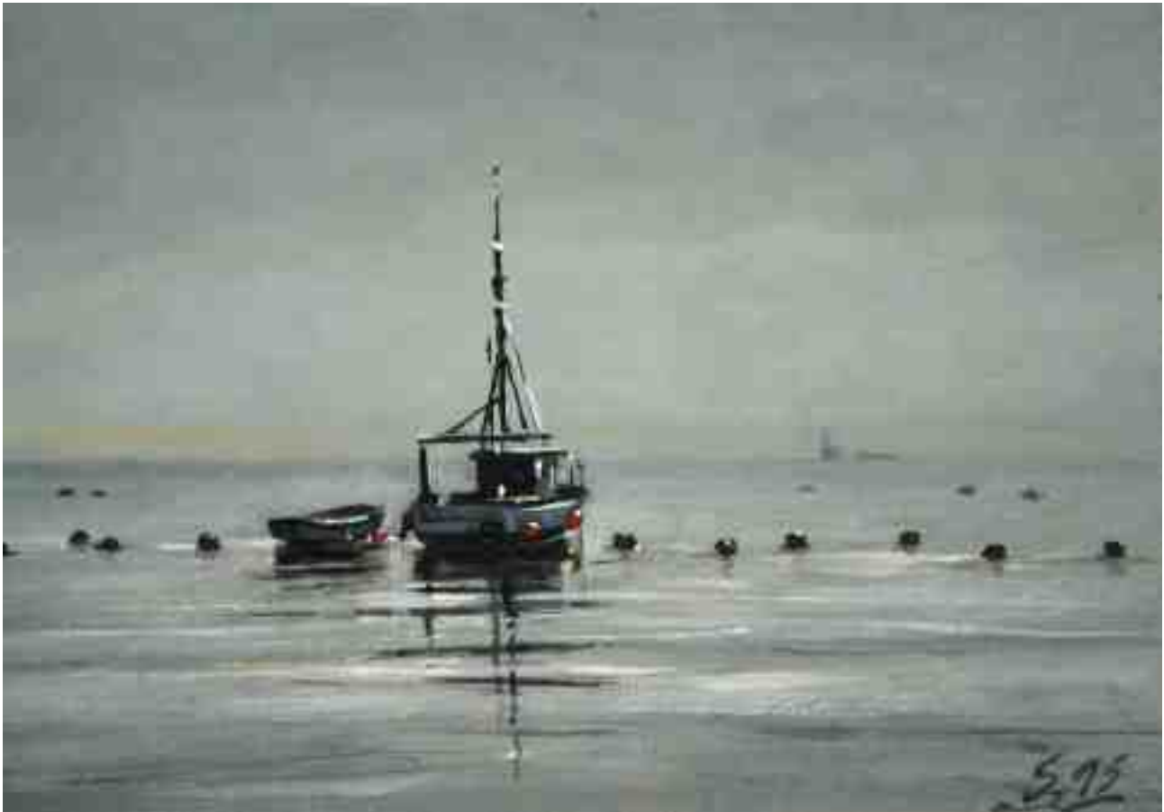
Kutter im Nebel 2015 | Öl/Karton | 14 x 20 cm