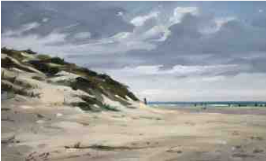
Dünen und Strand St. Peter Ording I 2012 | Öl/Holz | 15 x 24 cm