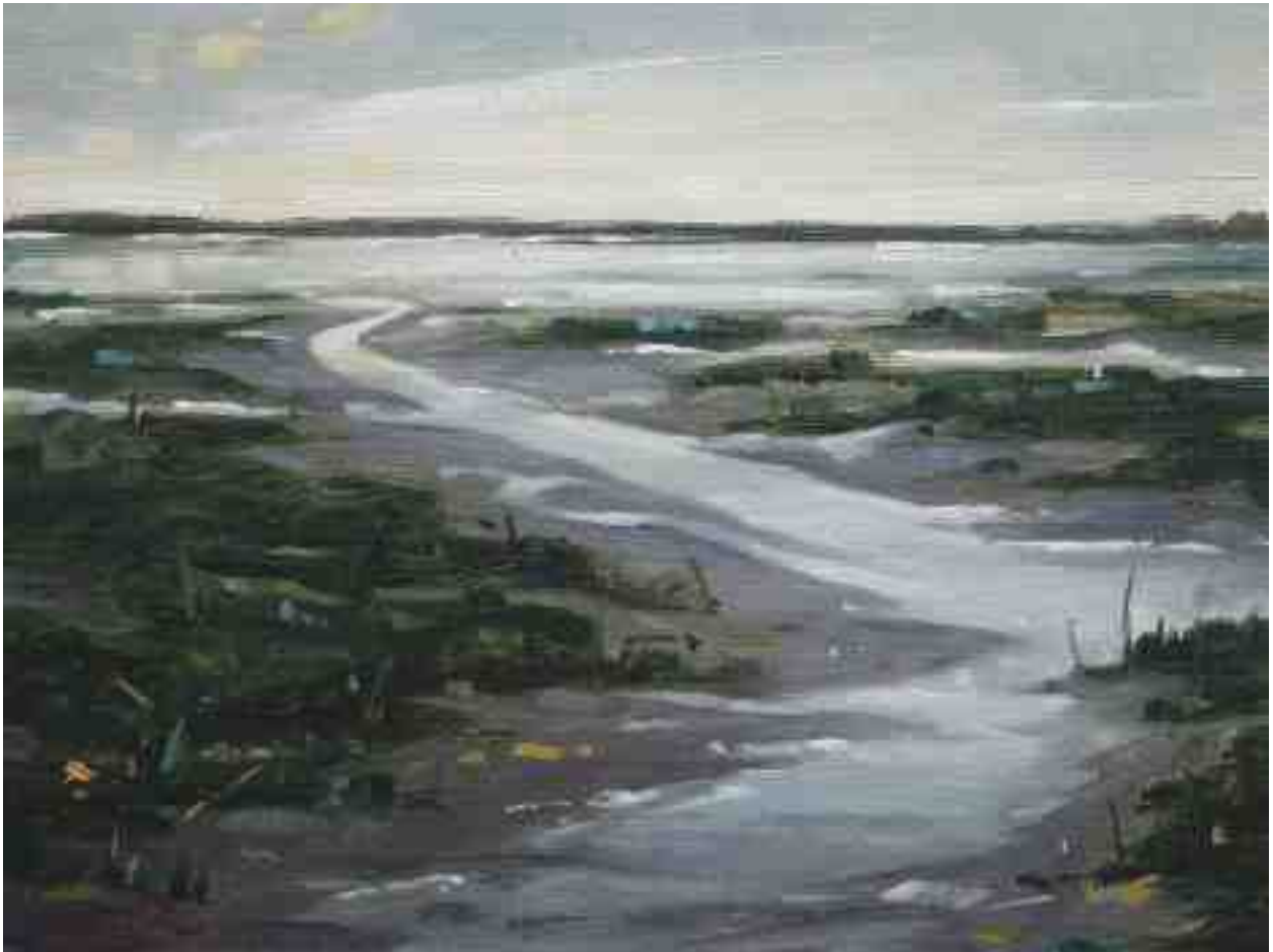
Wattszene bei St. Peter 2012 | Öl/Lw./Holz | 18 x 24 cm