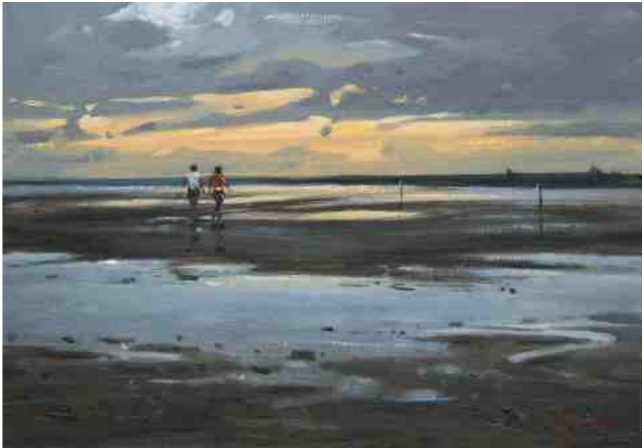
Watt abends II 2015 | Öl/Karton | 14 x 20 cm