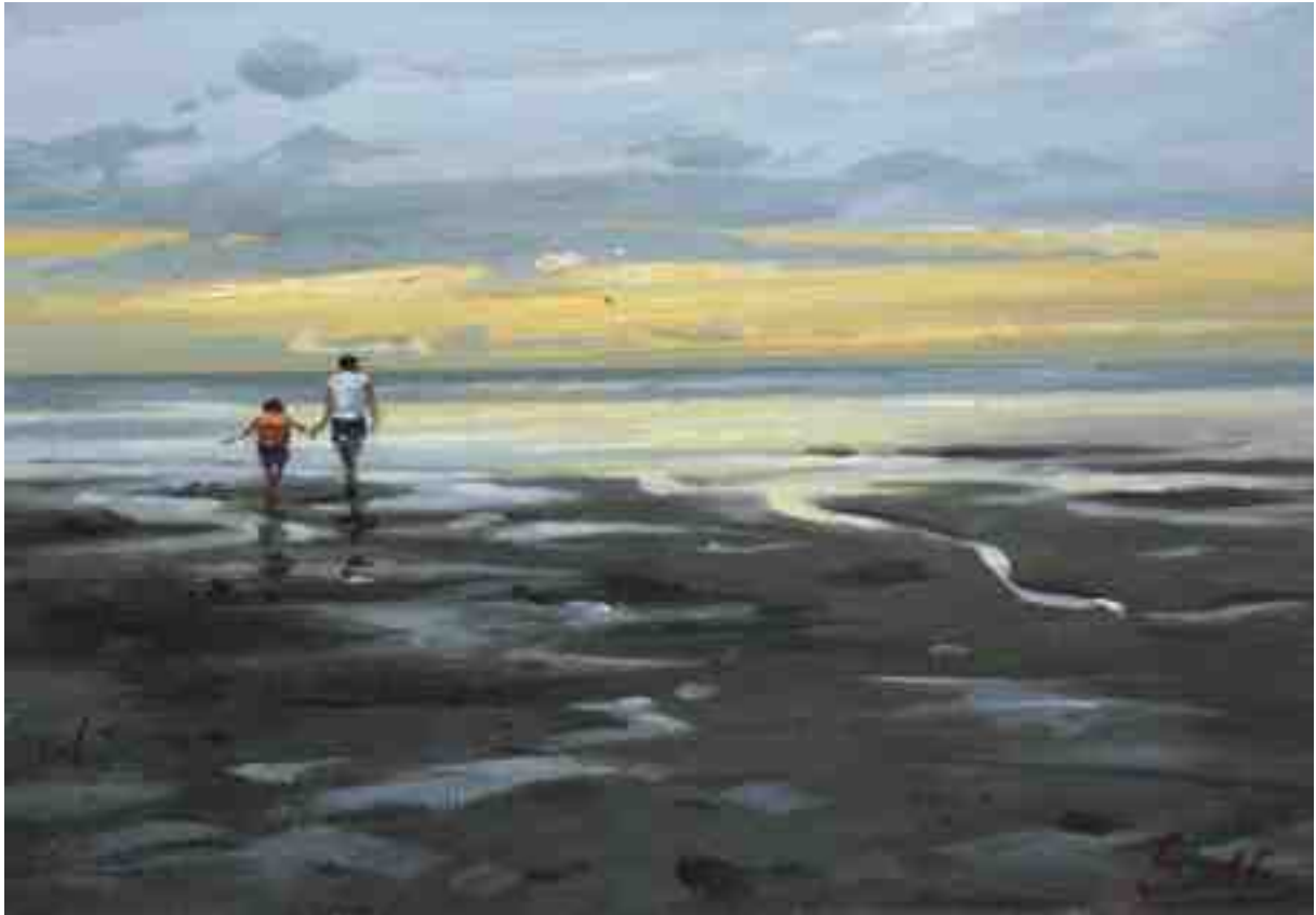
Wattstück abends 2015 | Öl/Karton | 14 x 20 cm