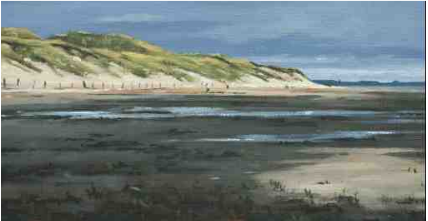
Amrum Odde Nordspitze 2011 | Öl/Karton | 13 x 25 cm