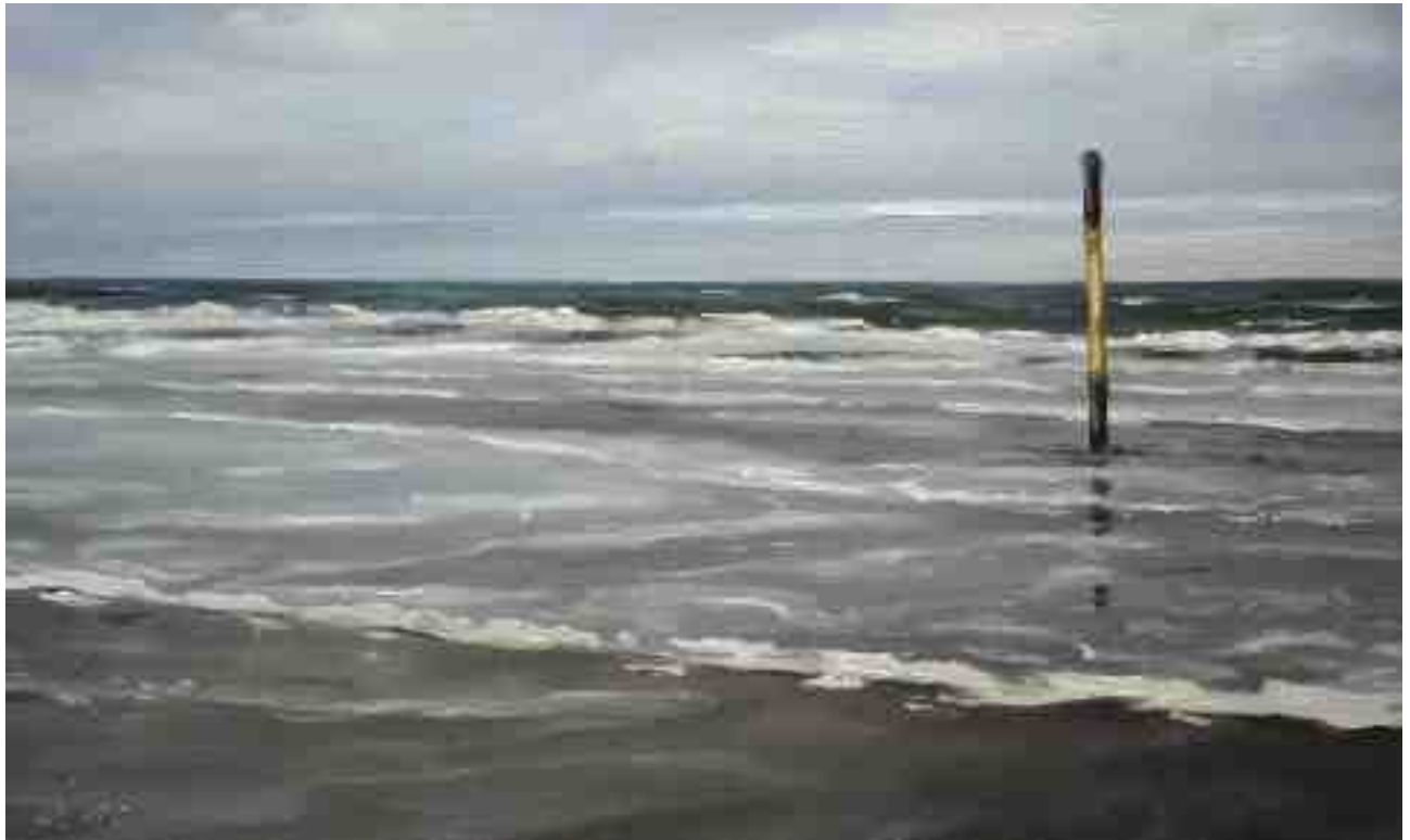
Brandung St. Peter Ordung 2011 | Öl/Holz | 15 x 25 cm