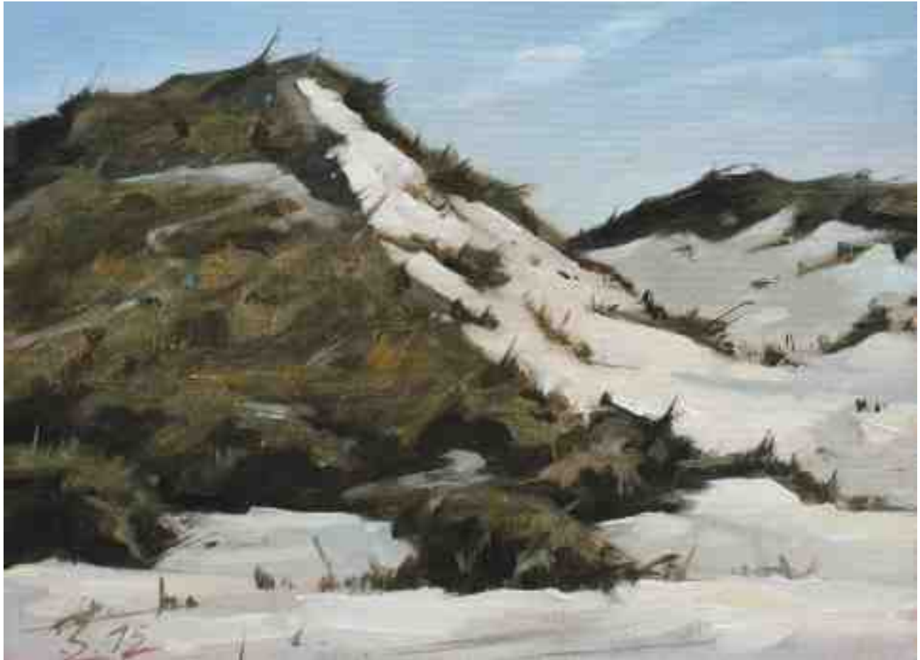
Düne bei Bergen aan Zee I 2015 | Öl/Lw./Holz | 18 x 24 cm