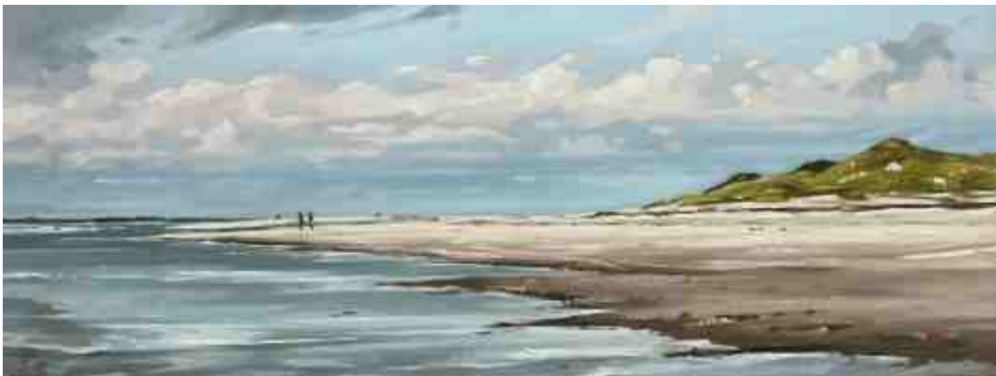
Amrum Odde Nordspitze II 2015 | Öl/Holz | 30 x 80 cm