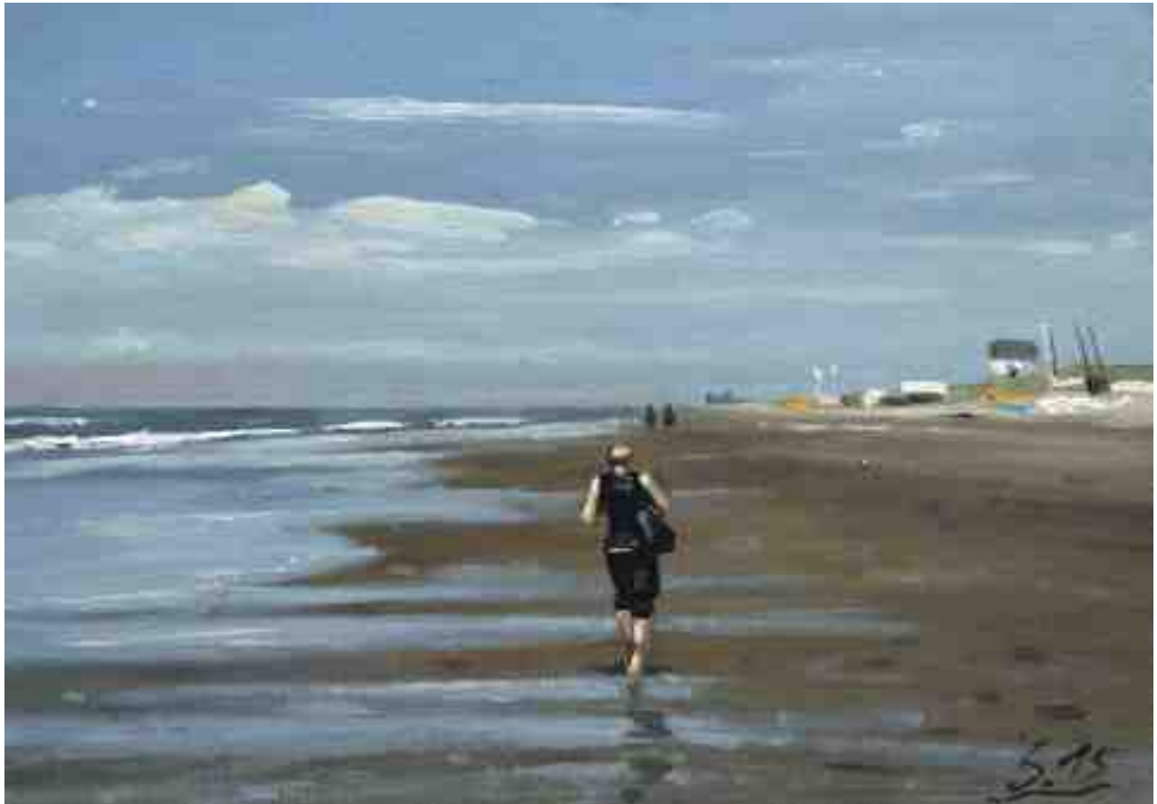
Strandspaziergang 2015 | Öl/Karton | 14 x 20 cm