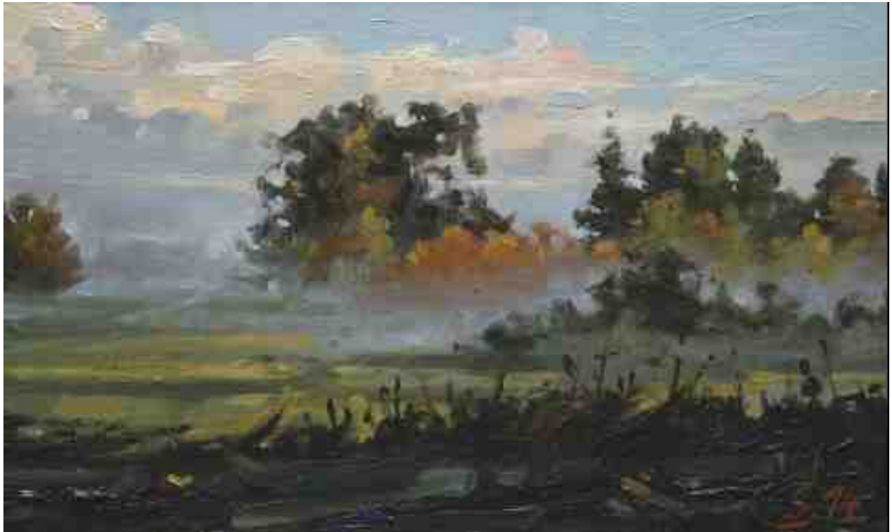
Landschaft im Nebel 2014 | Öl/Karton | 15 x 25 cm