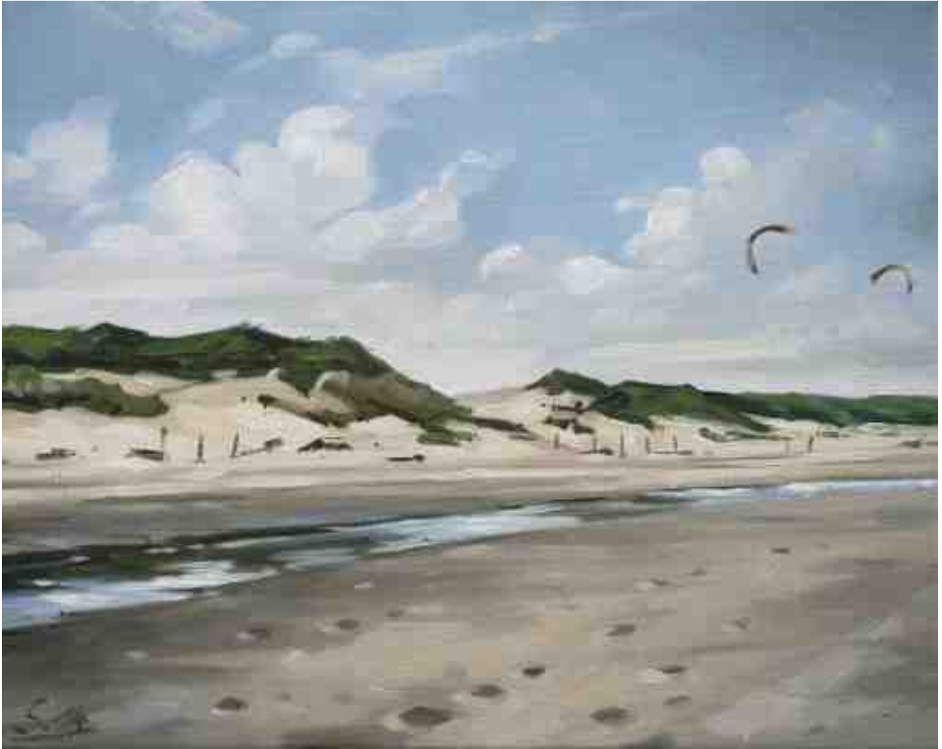
Blick auf die Dünen II 2014 | Öl/Lw. | 24 x 30 cm