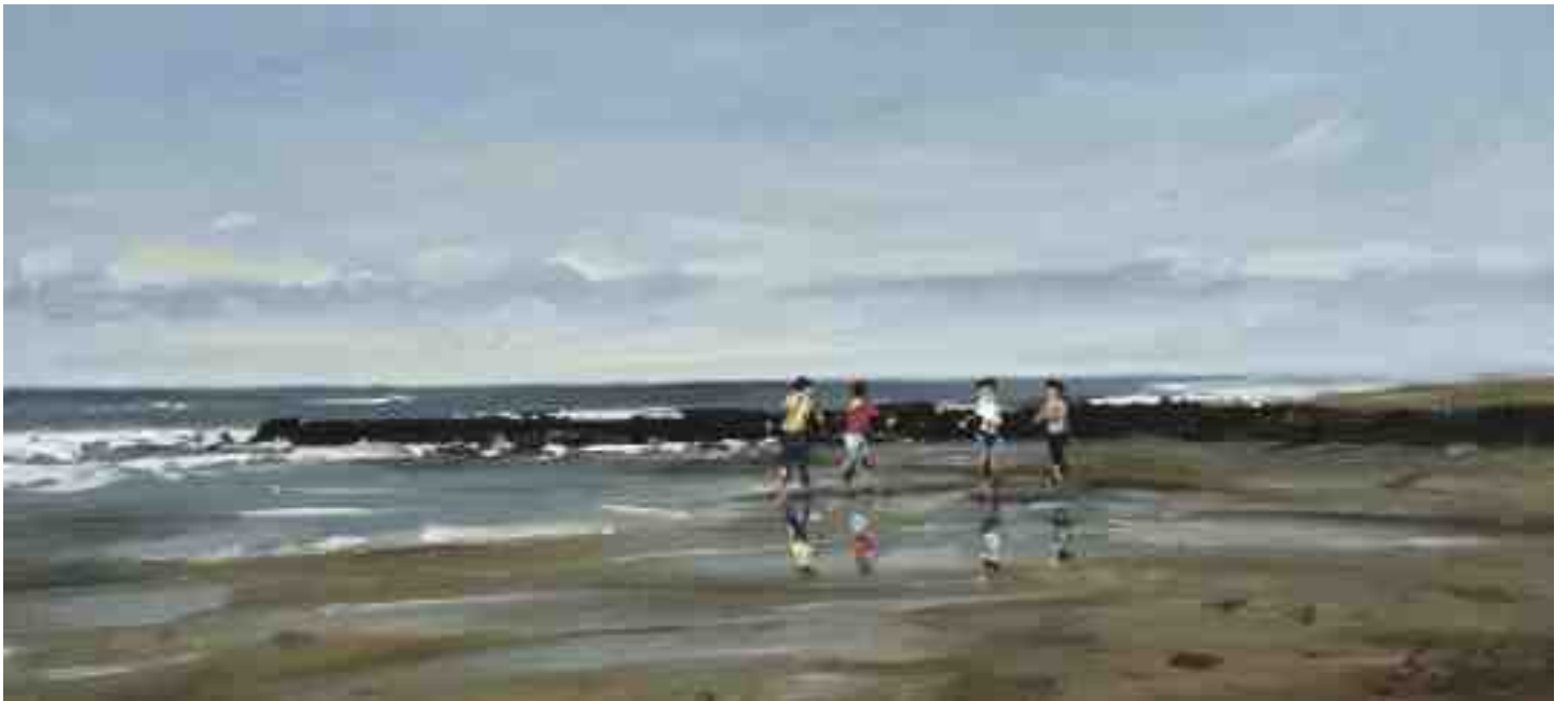
Strandbegegnung 2015 | Öl/Holz | 18 x 40 cm