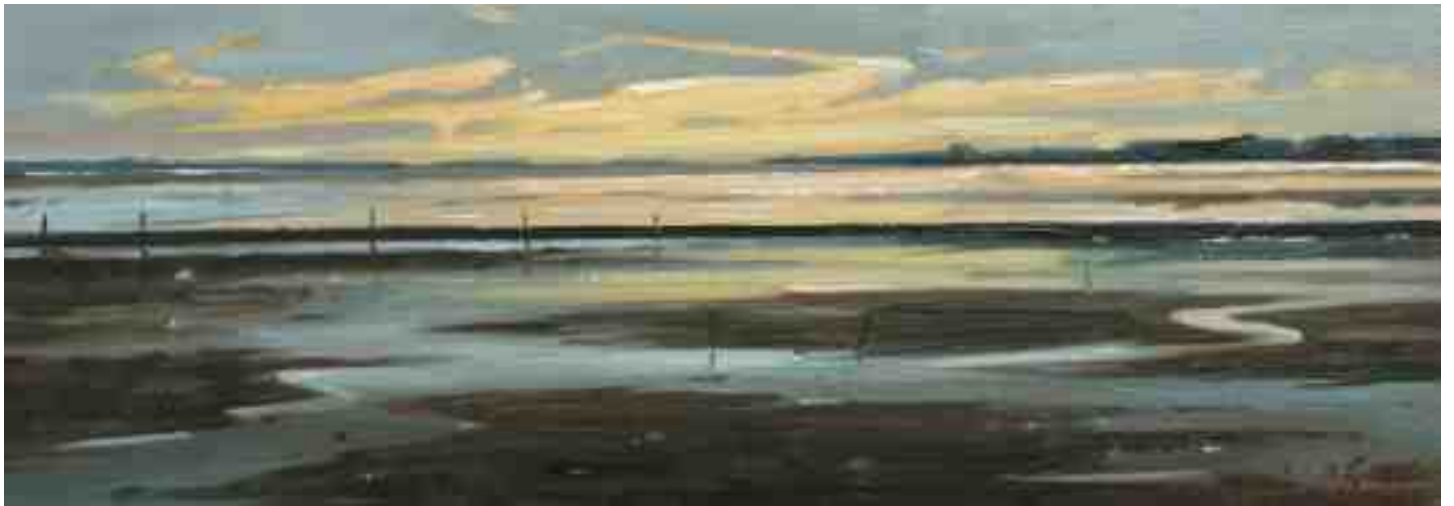
Amrum Watt abends I 2015 | Öl/Holz | 14 x 40 cm