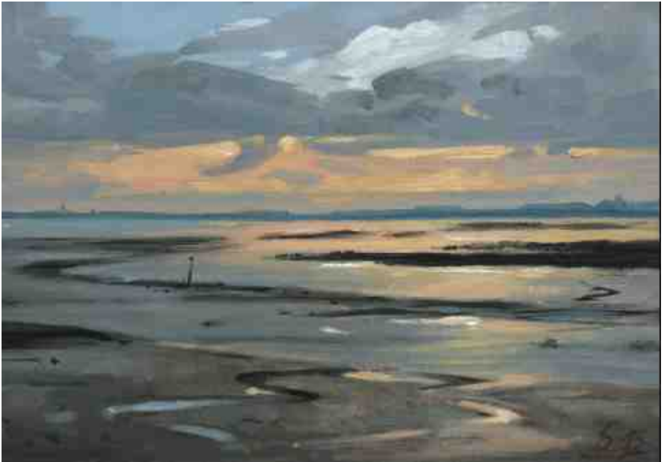
Watt abends I 2015 | Öl/Karton | 14 x 20 cm