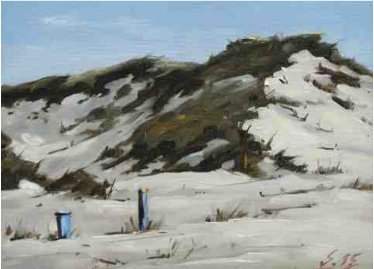
Düne bei Bergen aan Zee II 2015 | Öl/Lw./Holz | 18 x 24 cm