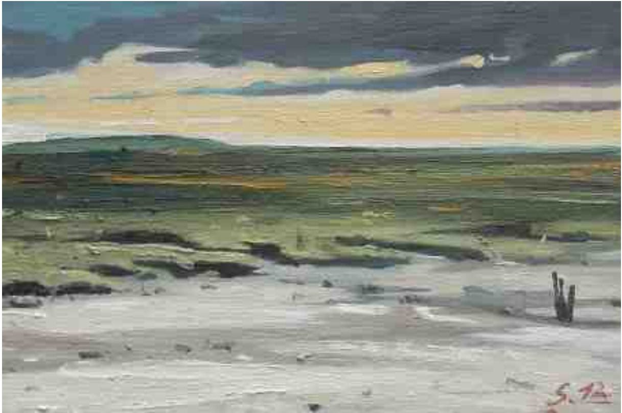
Bei Westerhever 2012 | Öl/Karton | 13 x 19.5 cm