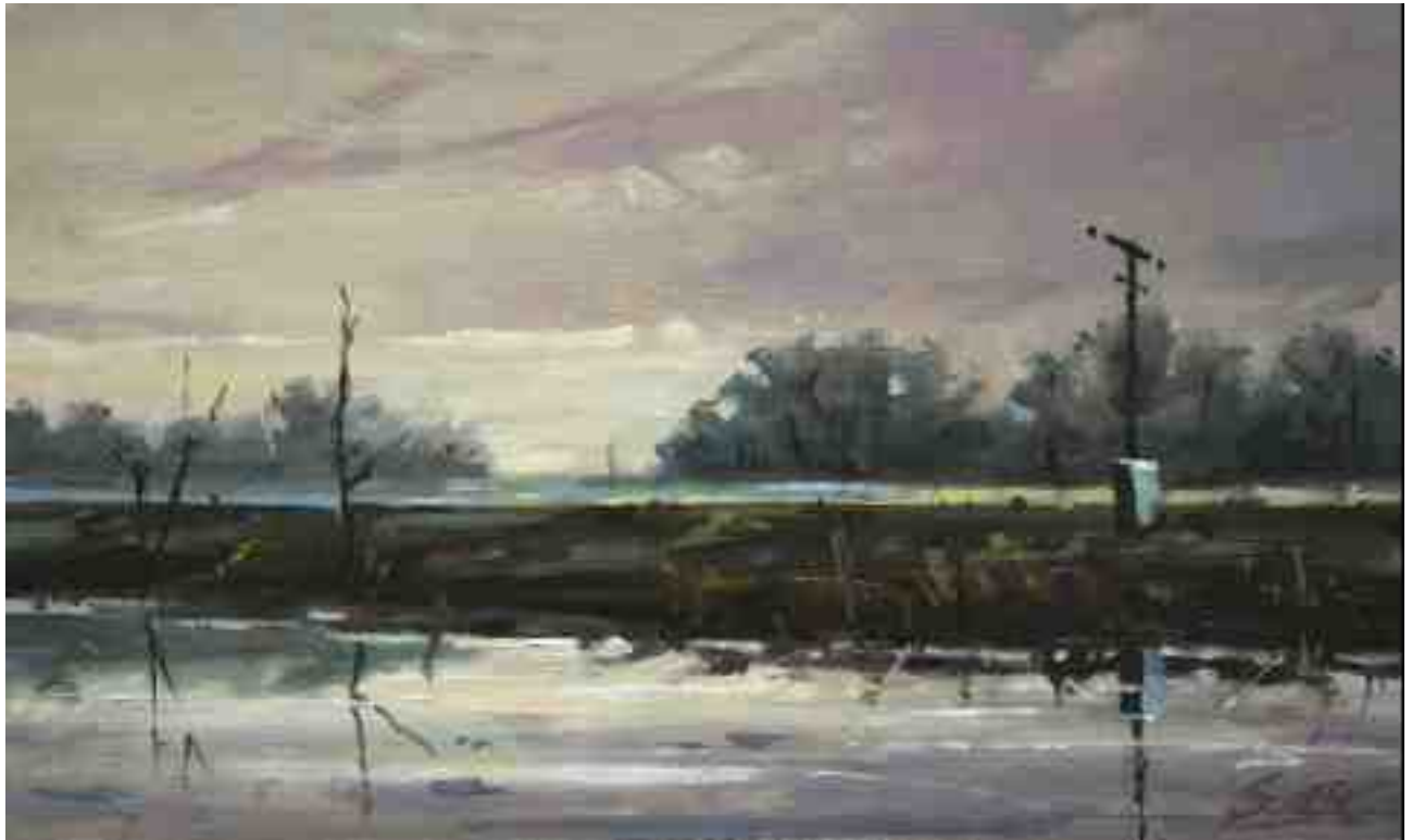
Bahndamm Richtung Osterholz 2014 | Öl/Karton | 15 x 25 cm