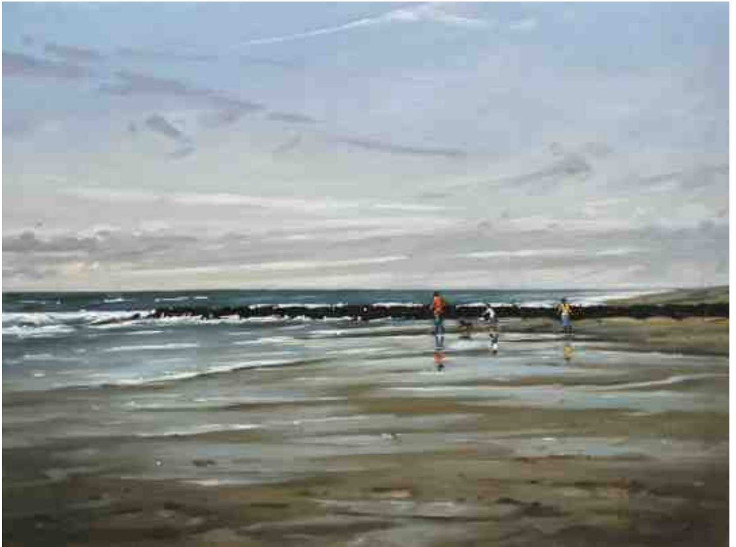
Spaziergang am Strand 2015 | Öl/Lw. | 60 x 80 cm