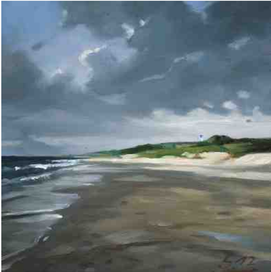
Strand St. Peter abends III 2012 | Öl/Holz | 15 x 15 cm