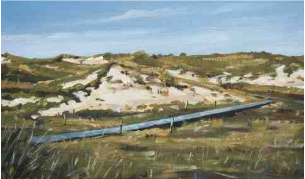
In den Dünen 2011 | Öl/Karton | 13 x 22 cm