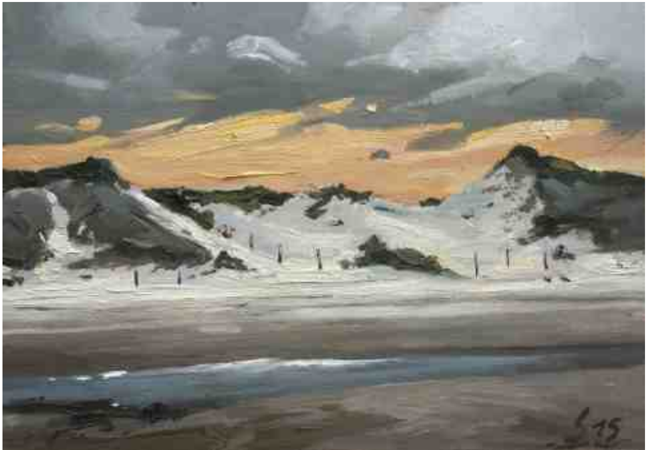
Bergen aan Zee Stranddünen abends 2015 | Öl/Karton | 14 x 20 cm