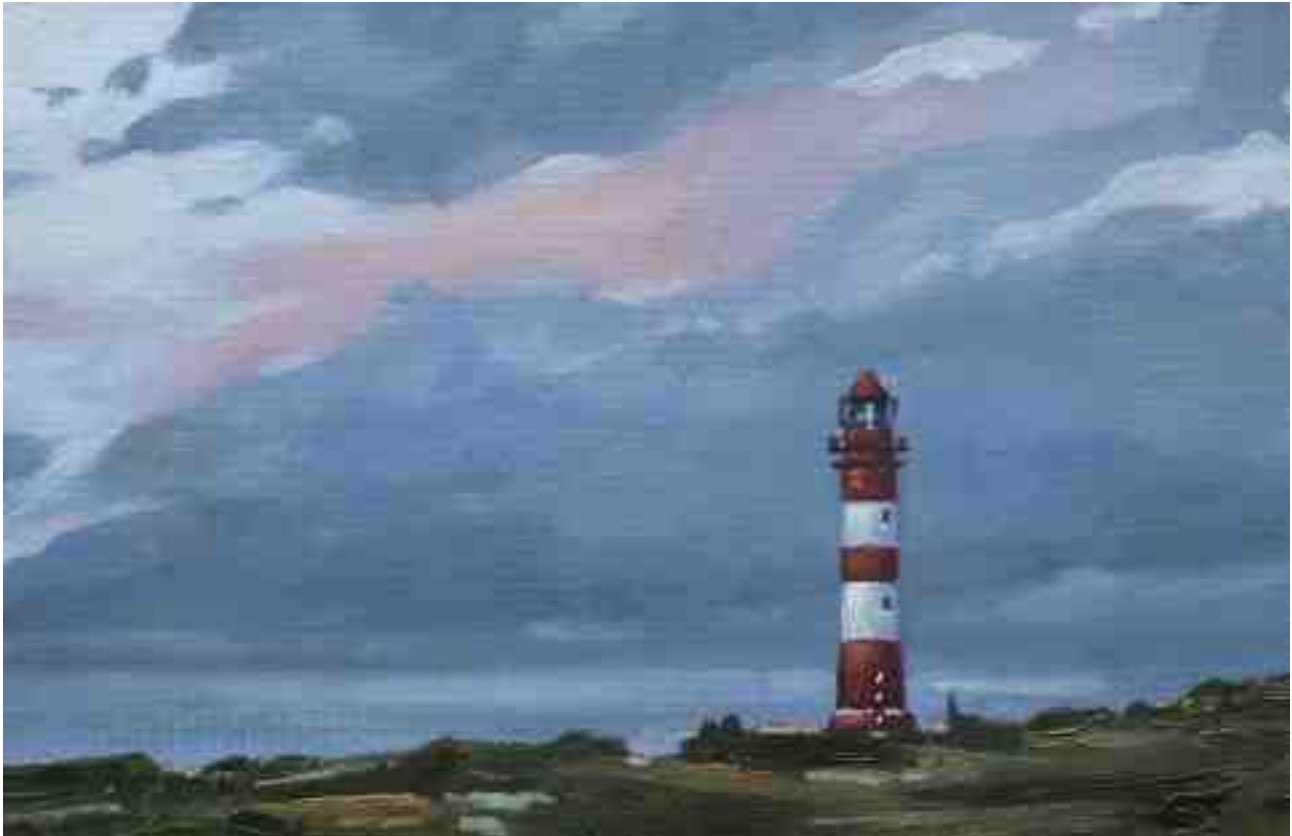
Amrum Leuchtturm abends 2011 | Öl/Karton | 13 x 20 cm