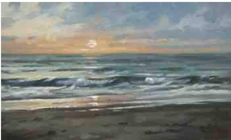
Bergen aan Zee Brandung II 2014 | Öl/Karton | 15 x 25 cm