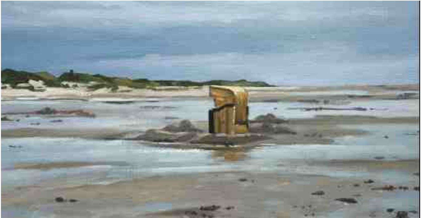
Strandkorb auf Amrum bei trüben Wetter 2011 | Öl/Karton | 13 x 25 cm