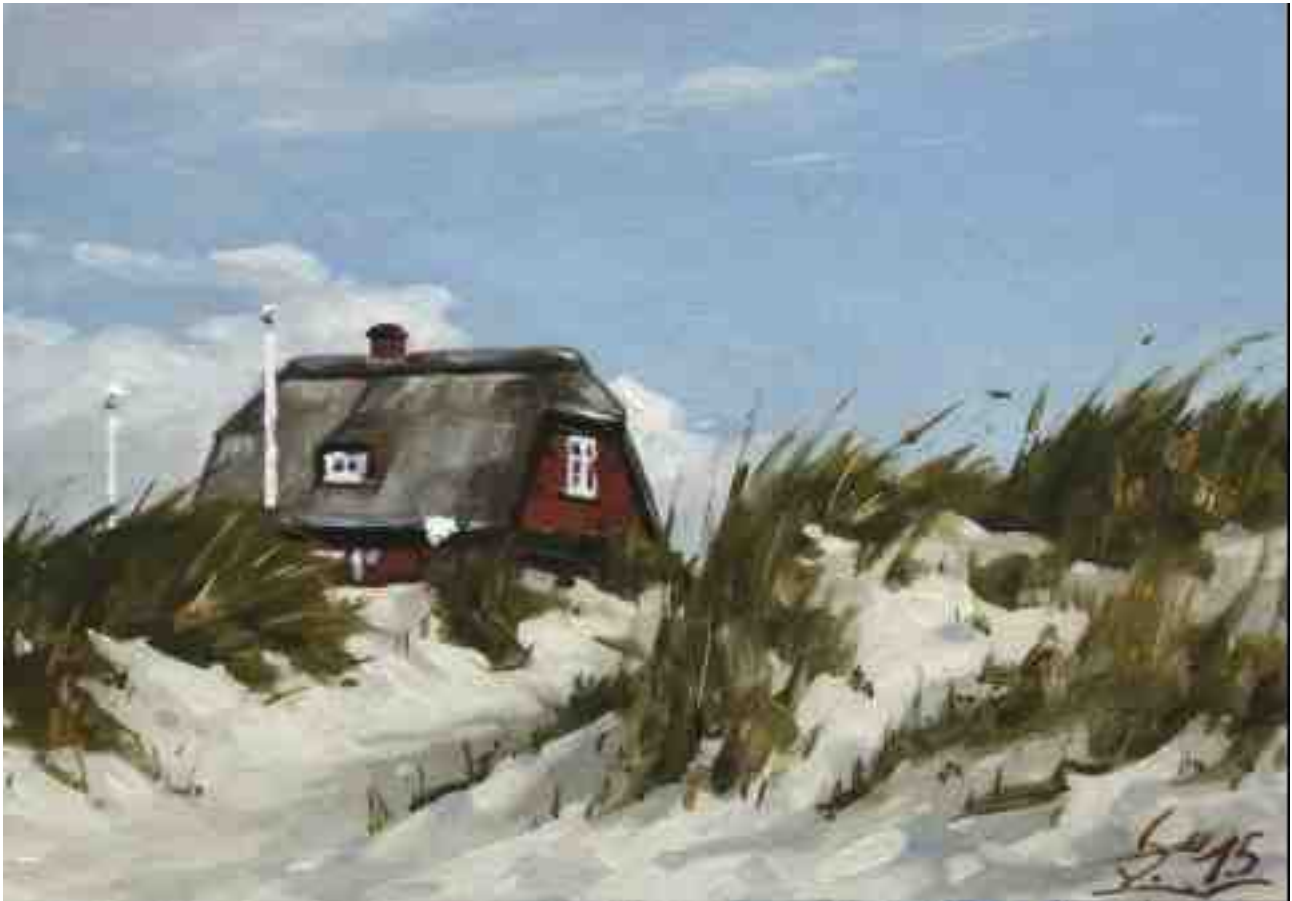
Amrum Haus in den Dünen 2015 | Öl/Karton | 14 x 20 cm