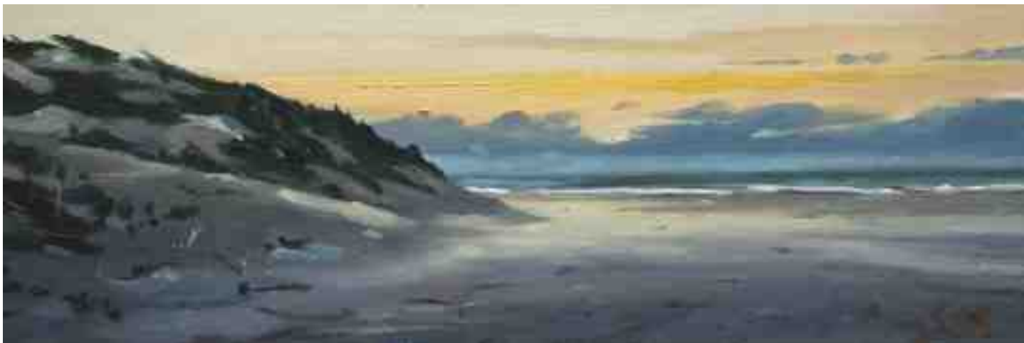
Sonnenuntergang St. Peter Ording 2012 | Öl/Holz | 10 x 30 cm