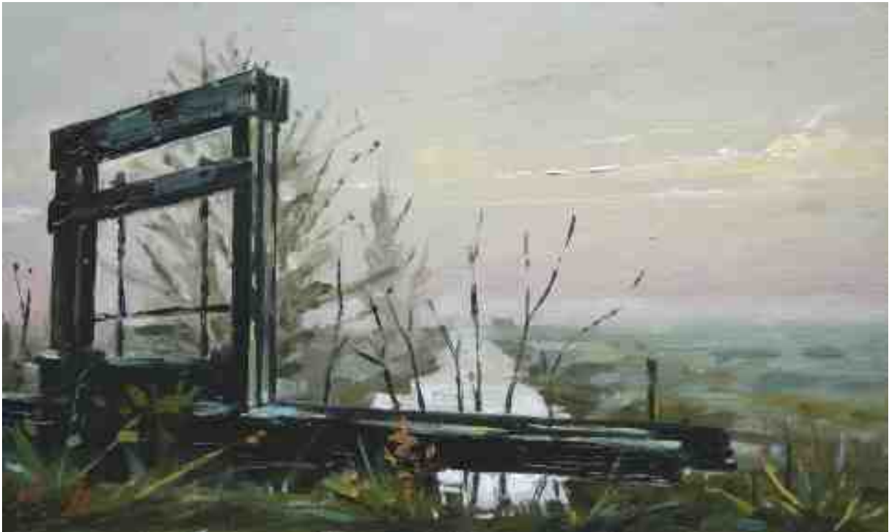
Landschaft im Dunst bei Worpswede 2014 | Öl/Karton | 15 x 25 cm