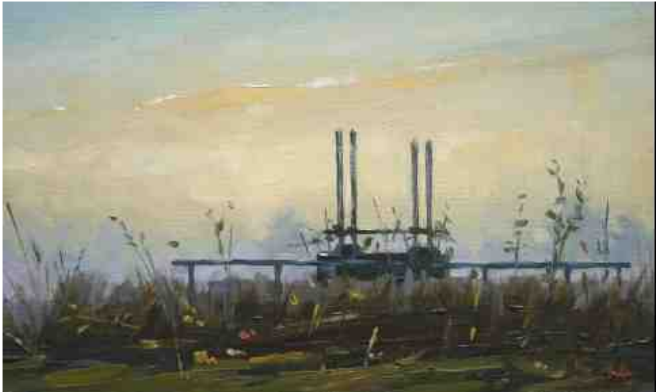
Worpsweder Landschaft im Dunst 2014 | Öl/Karton | 15 x 25 cm