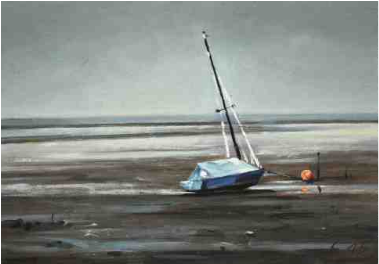
Segelboot im Watt 2015 | Öl/Karton | 14 x 20 cm