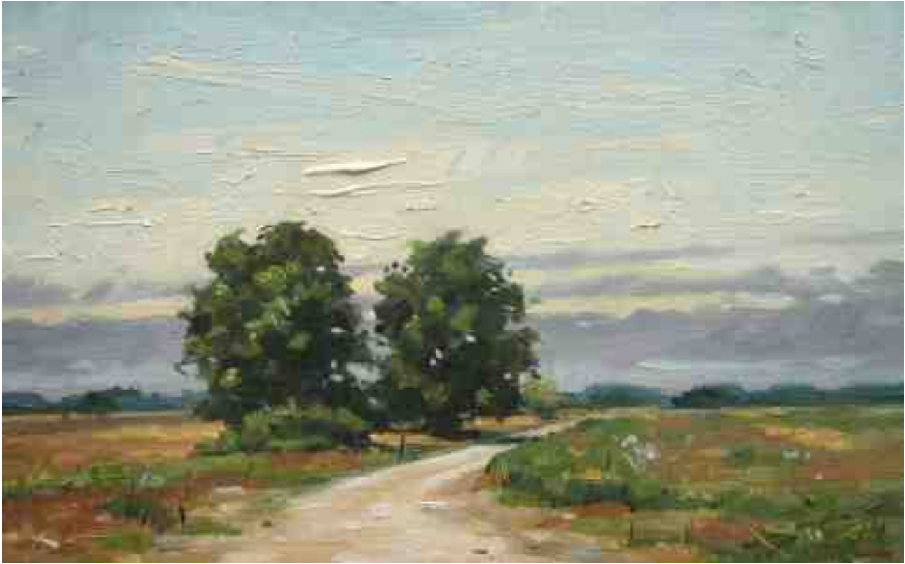
Worpsweder Licht VI 2014 | Öl/Holz | 15 x 24 cm