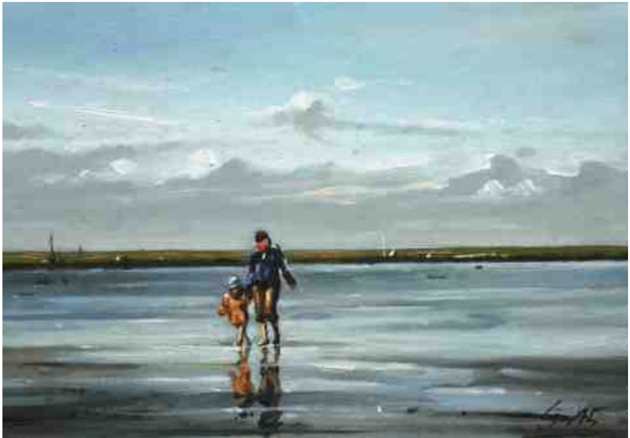
Spaziergang im Watt 2015 | Öl/Karton | 14 x 20 cm