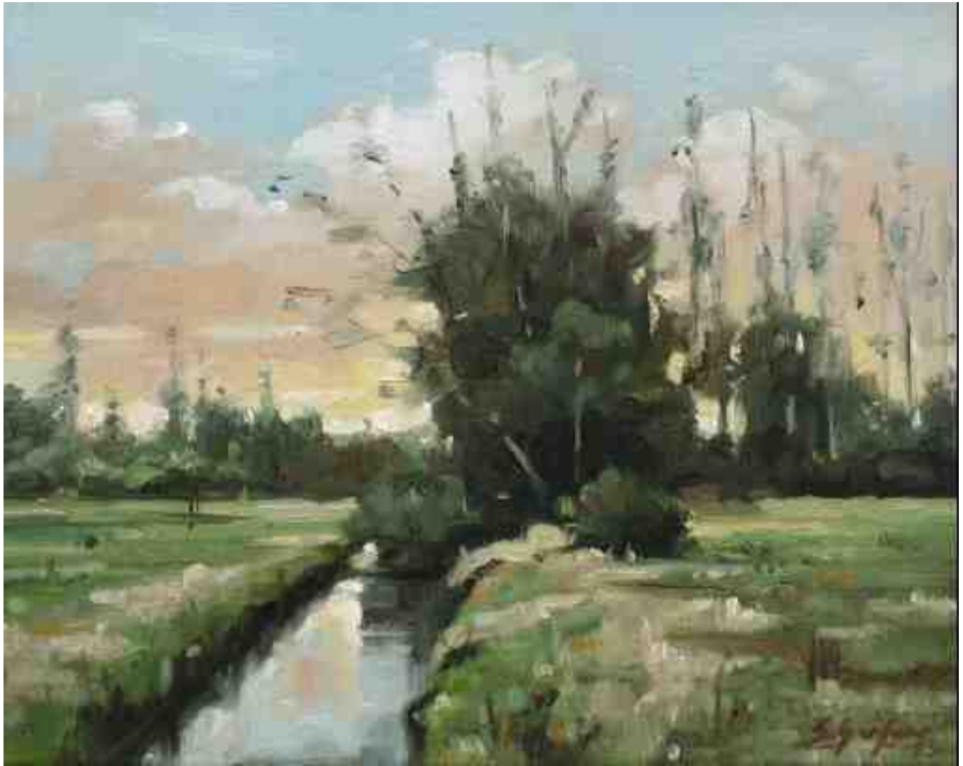
Früher Abend bei Worpswede 2015 | Öl/Lw. | 24 x 30 cm