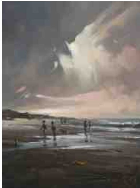
Nordlichter XIII Am Strand