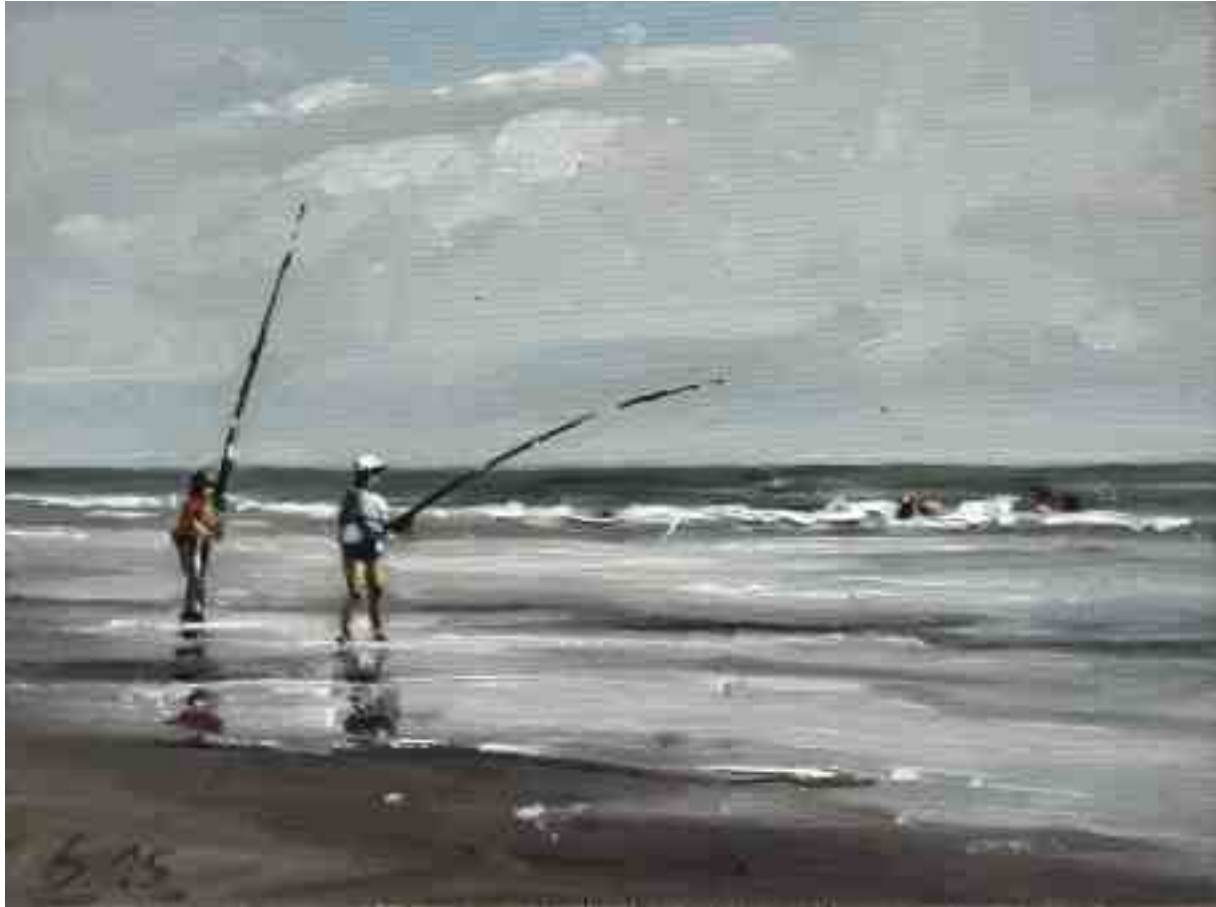
Am Strand von Egmond I 2015 | Öl/Lw./Holz | 15 x 20 cm