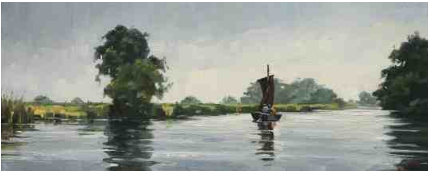
Torfkahn auf der Hamme 2014 | Öl/Lw. | 20 x 50 cm