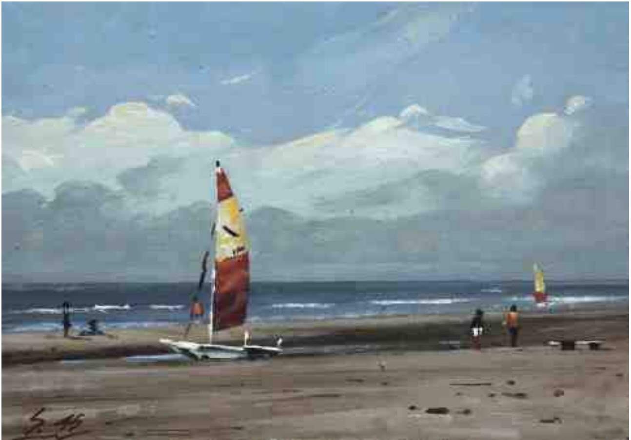
Am Strand VII 2015 | Öl/Karton | 14 x 20 cm