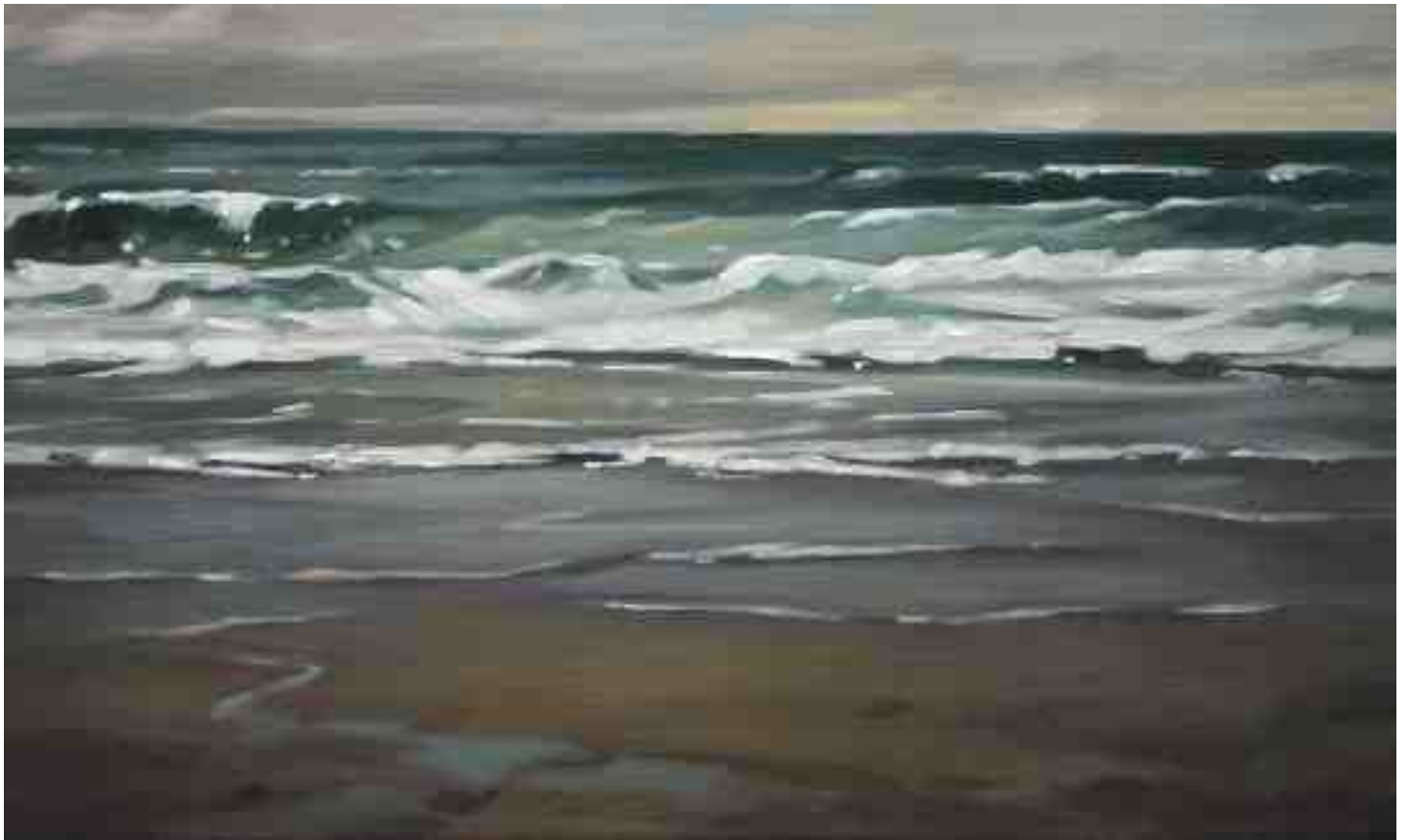
Brandung abends 2012 | Öl/Lw. | 30 x 50 cm