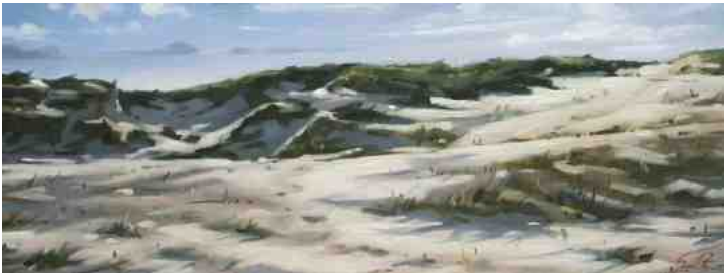
Dünenlandschaft bei St. Peter Ording II 2012 | Öl/Lw./Holz | 15 x 40 cm