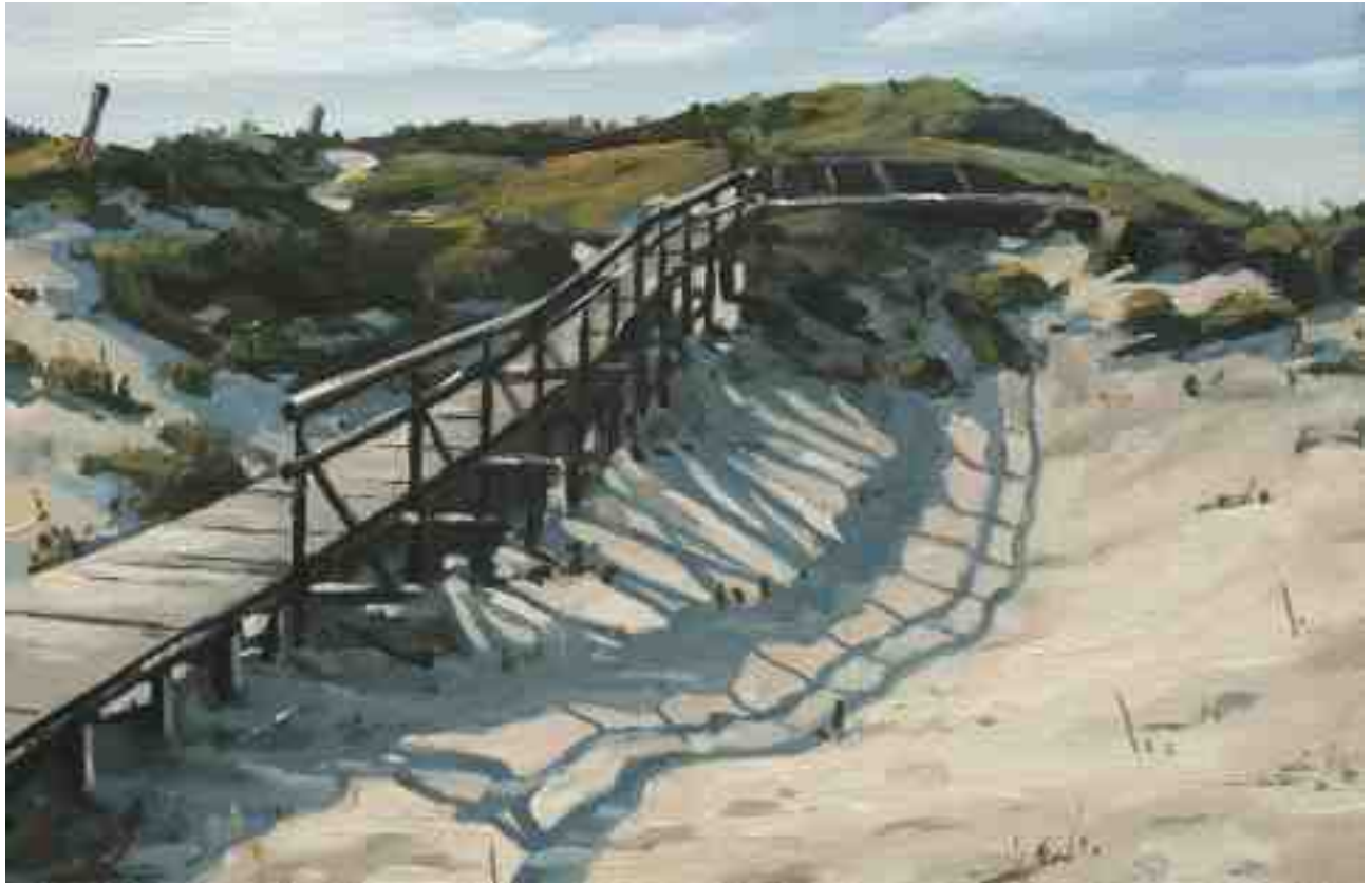
Bohlenweg auf Amrum 2011 | Öl/Karton | 13 x 20 cm