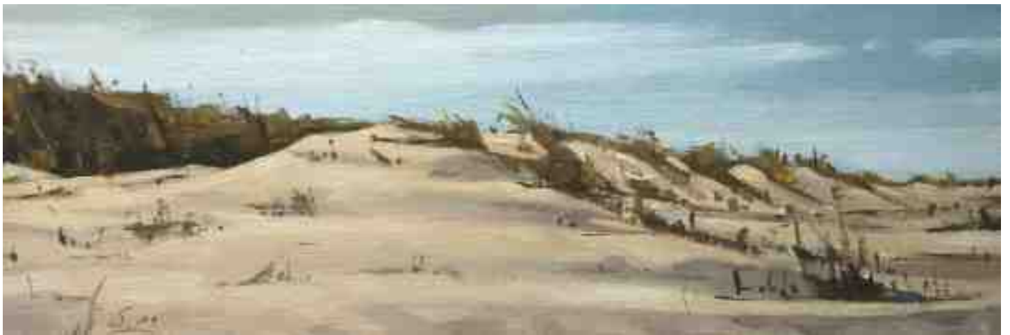
Dünen Nordsee I 2011 | Öl/Karton | 10 x 30 cm