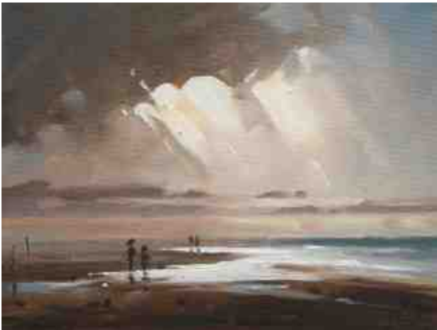
Nordlichter I Im Watt