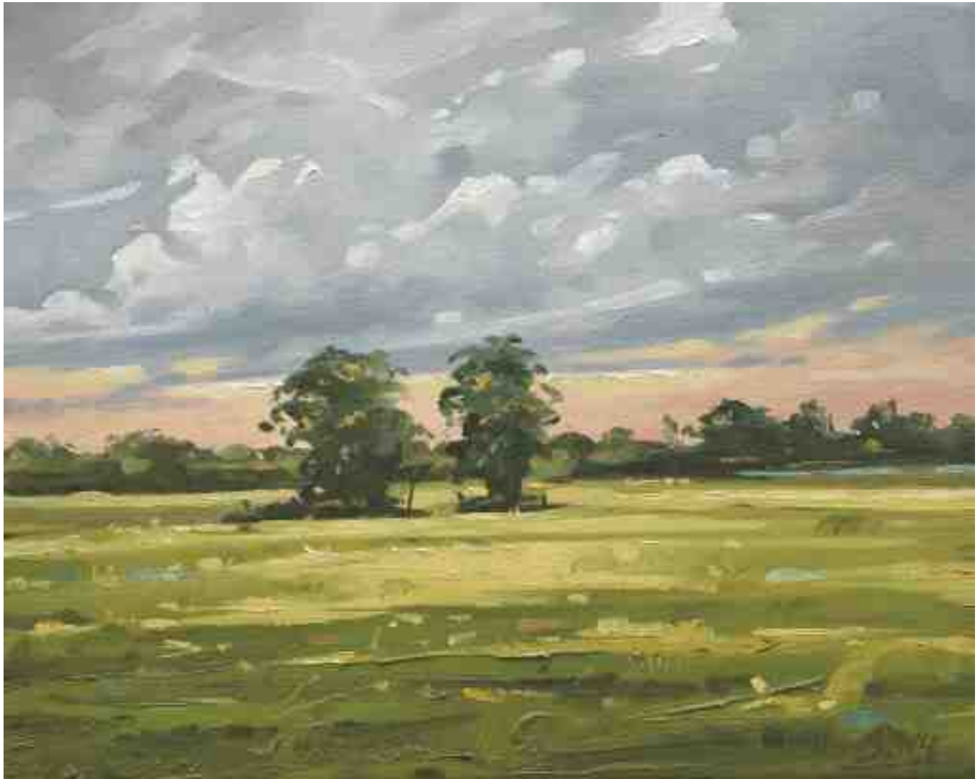
Worpsweder Licht I 2014 | Öl/Lw. | 24 x 30 cm