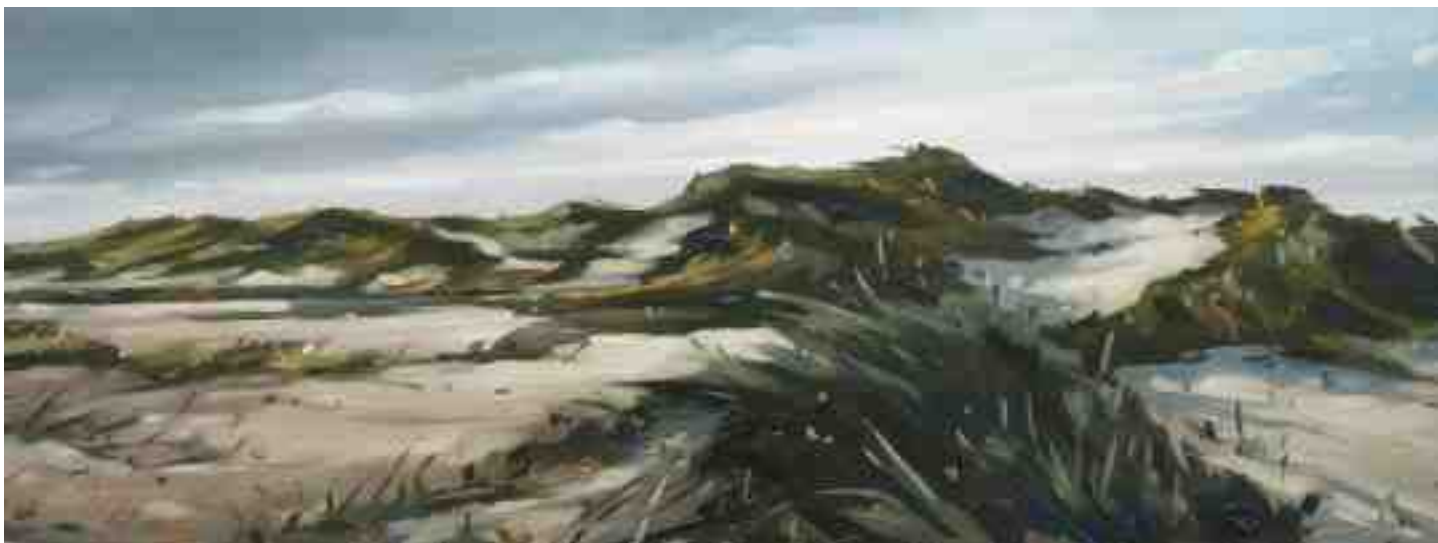
Nordseedünen Amrum 2012 | Öl/Holz | 15 x 40 cm