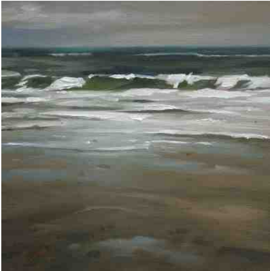
Brandung St. Peter Ording 2012 | Öl/Holz | 15 x 15 cm