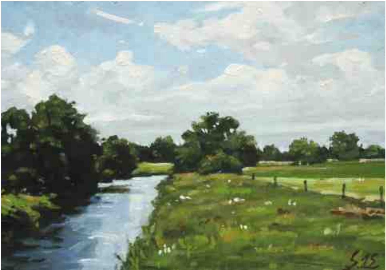
An der Wümme 2015 | Öl/Karton | 14 x 20 cm