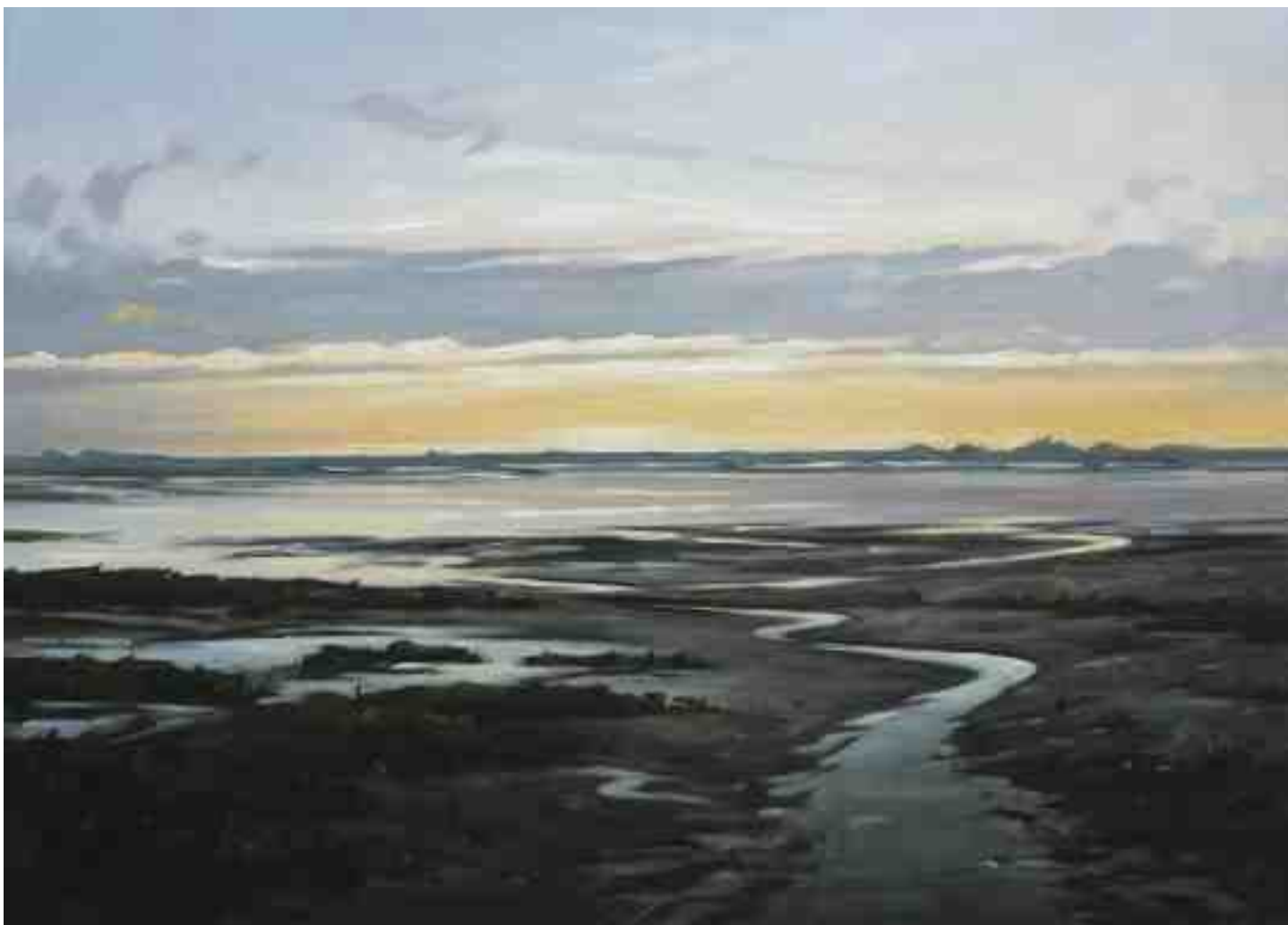
Abends im Watt auf Nordstrand 2015 | Öl/Lw. | 50 x 70 cm