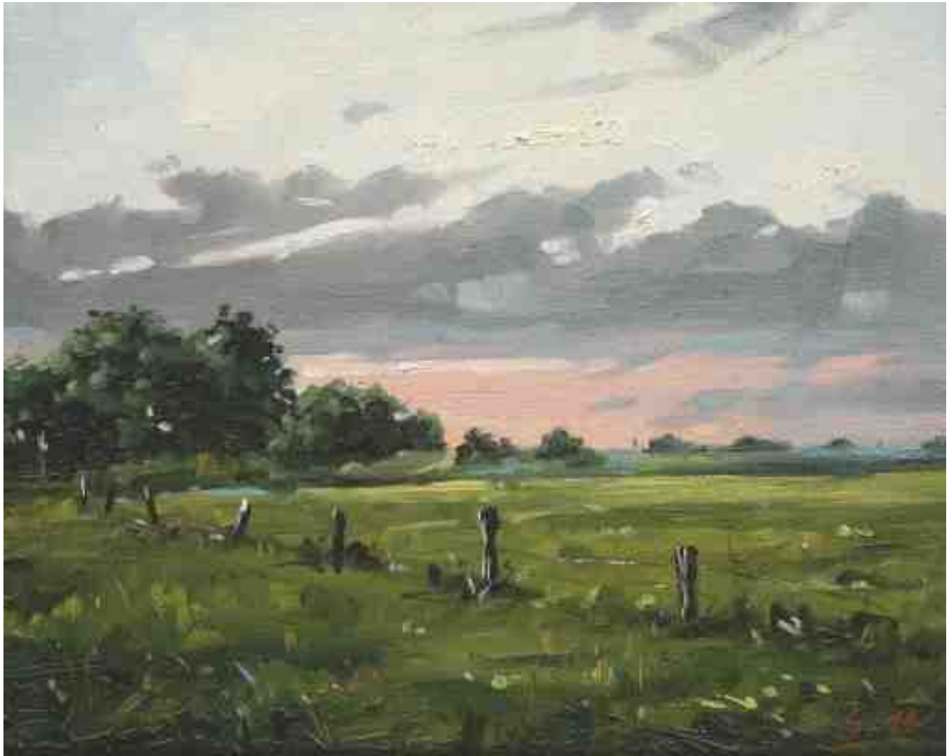
Worpsweder Licht III 2014 | Öl/Lw. | 24 x 30 cm