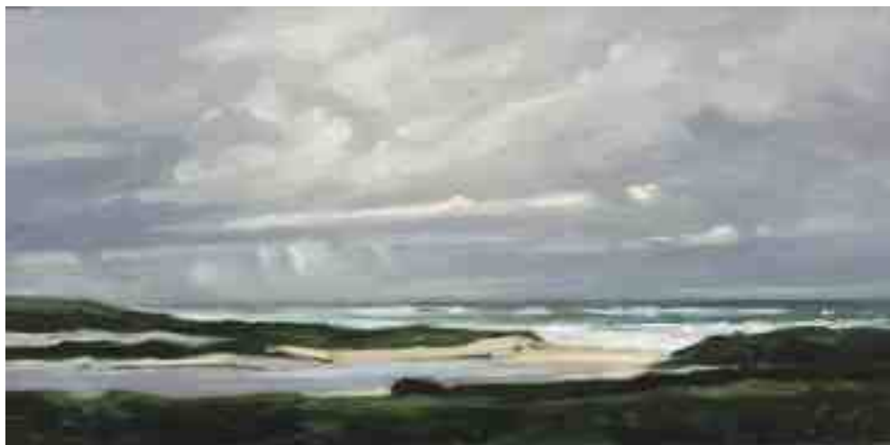
Dünenlandschaft Nordholland 2015 | Öl/Holz | 15 x 30 cm