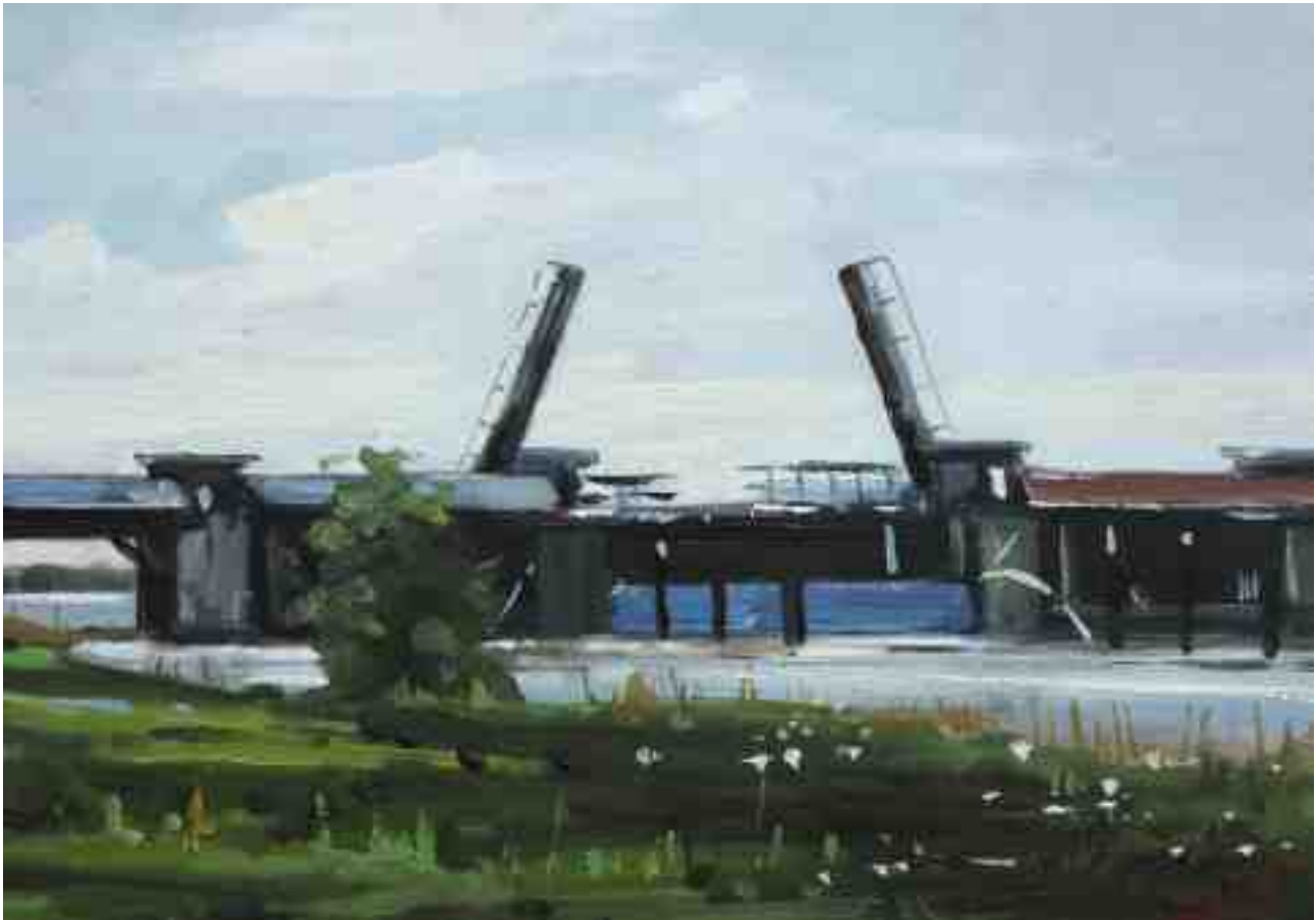
Sperrwerk an der Oste 2015 | Öl/Karton | 14 x 20 cm