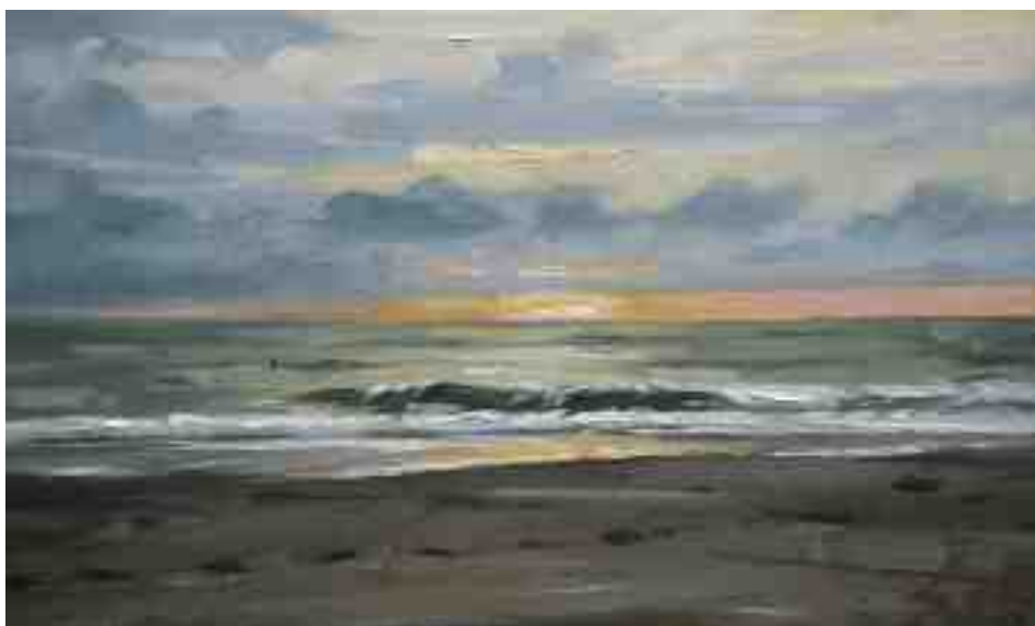
Bergen aan Zee Brandung VI 2014 | Öl/Karton | 15 x 25 cm