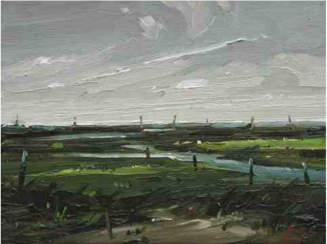
Im Hinterland bei Husum 2015 | Öl/Lw. | 18 x 24 cm