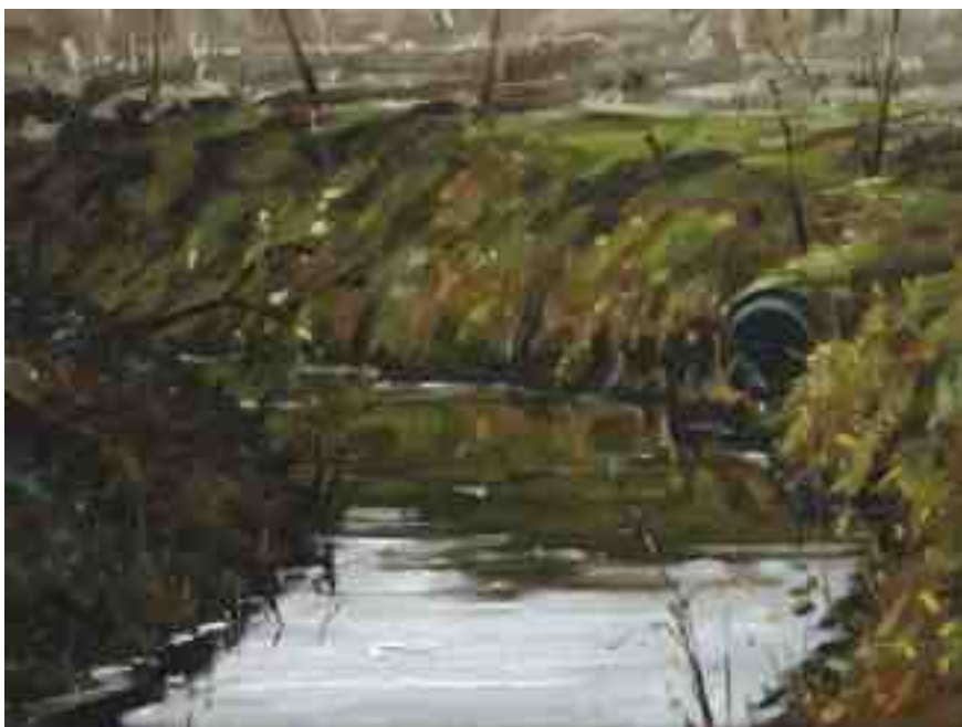
Wassergraben bei Worpswede