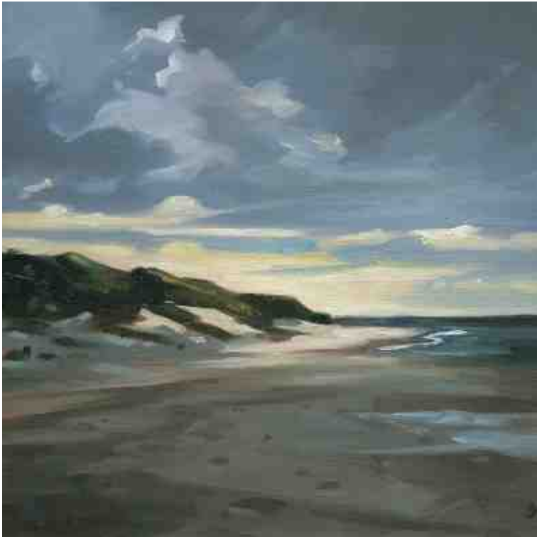
Strand St. Peter Ording abends 2012 | Öl/Holz | 15 x 15 cm