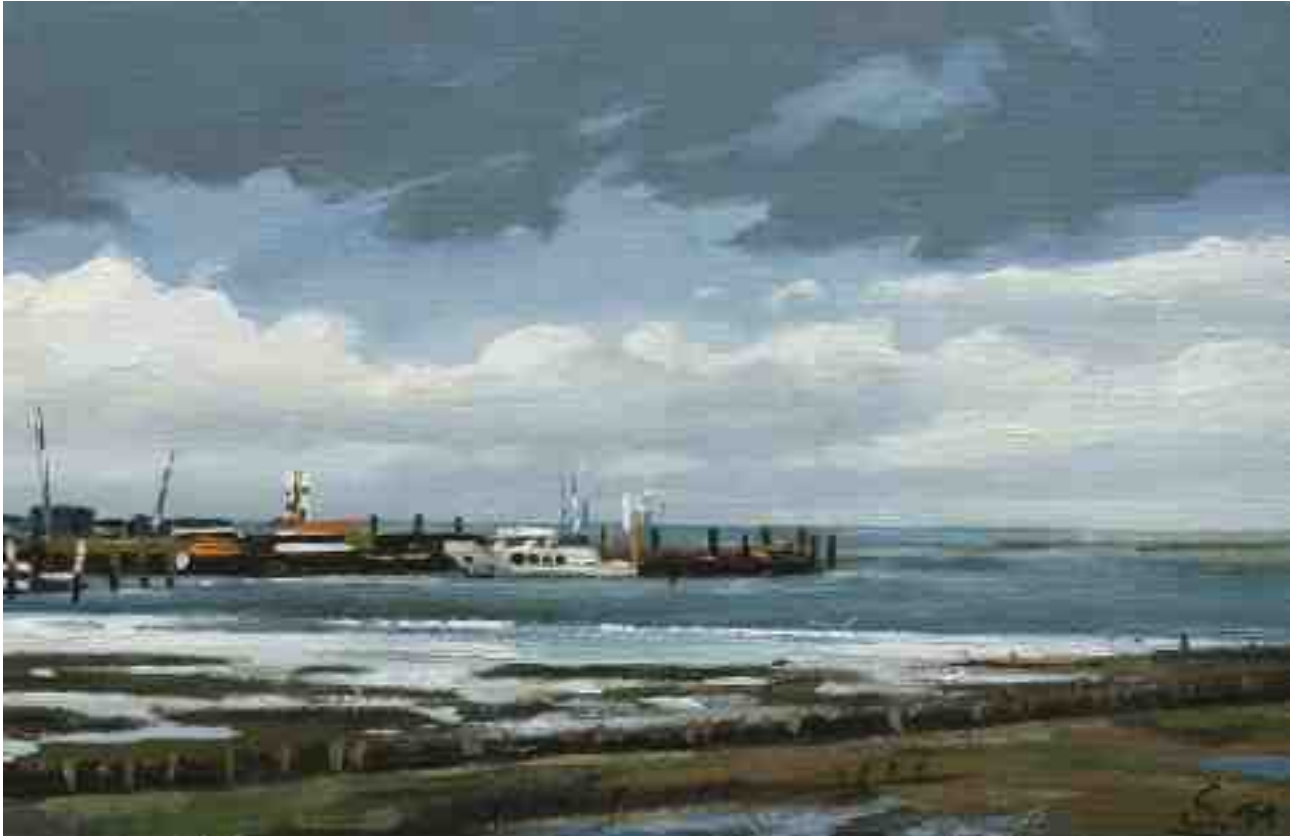
Watt Amrum 2011 | Öl/Karton | 13 x 20 cm