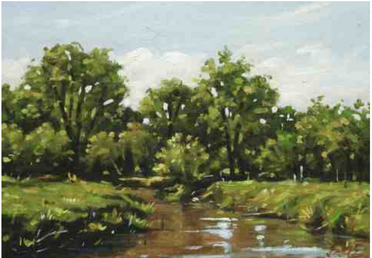
An der Oste 2015 | Öl/Karton | 14 x 20 cm