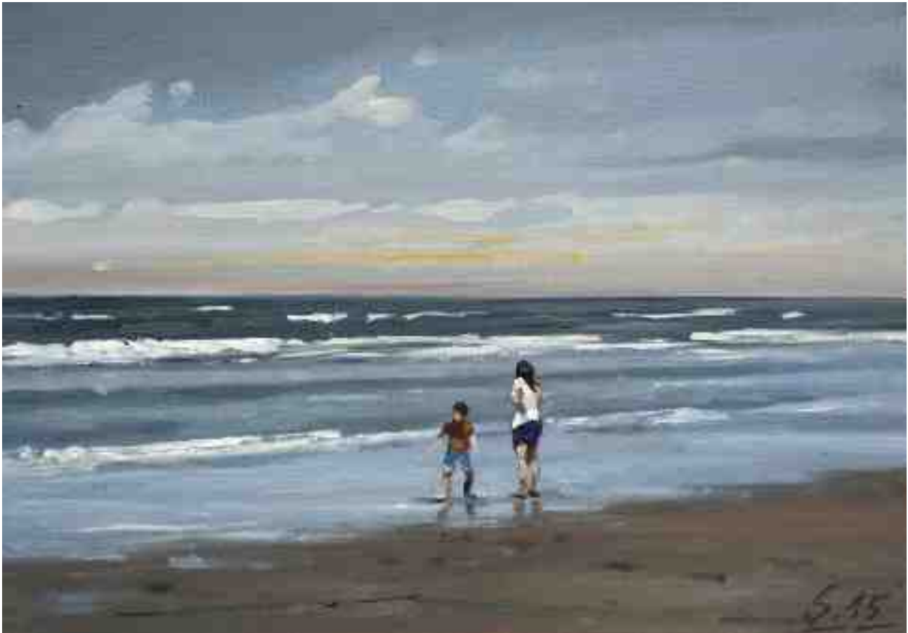
Am Strand von Bergen aan Zee 2015 | Öl/Karton | 14 x 20 cm