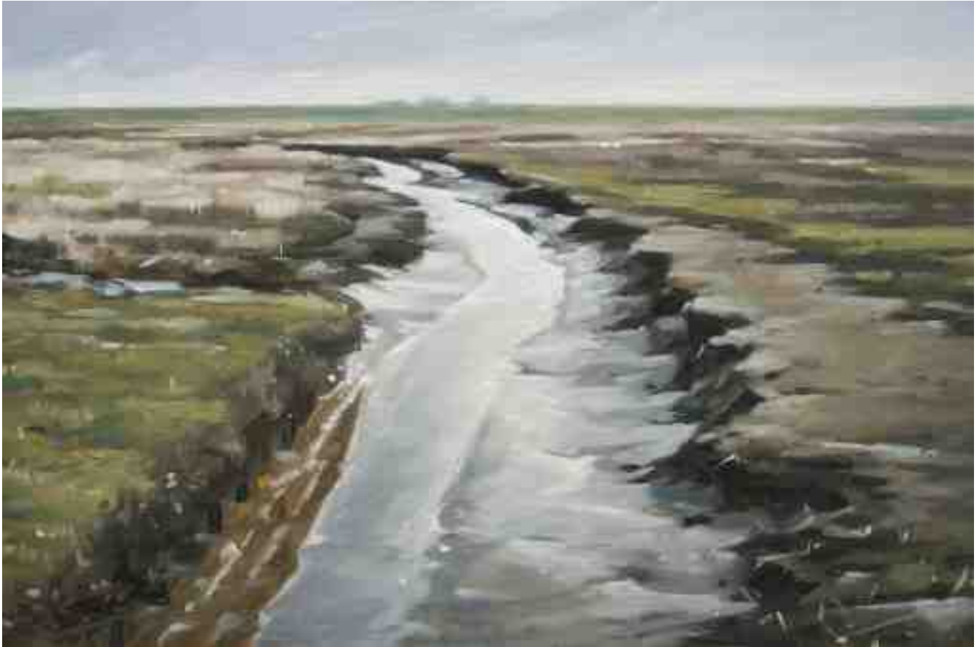
Priel bei Westerhever 2012 | Öl/Holz | 20 x 30 cm