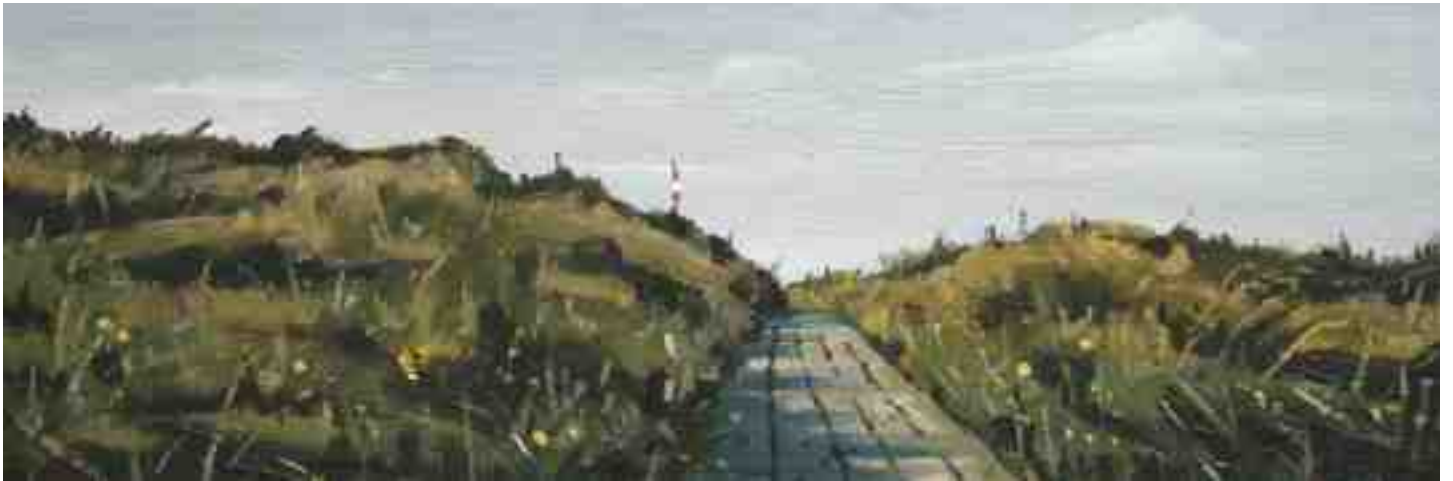
Bohlenweg auf Amrum 2011 | Öl/Karton | 10 x 30 cm