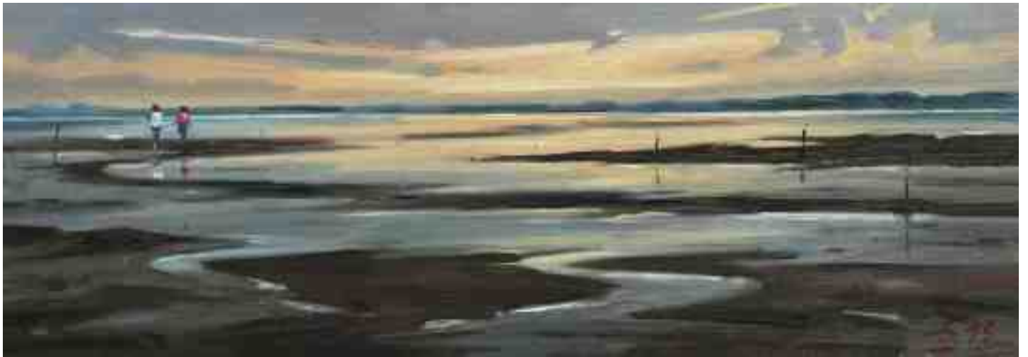
Amrum Watt abends II 2015 | Öl/Holz | 14 x 40 cm