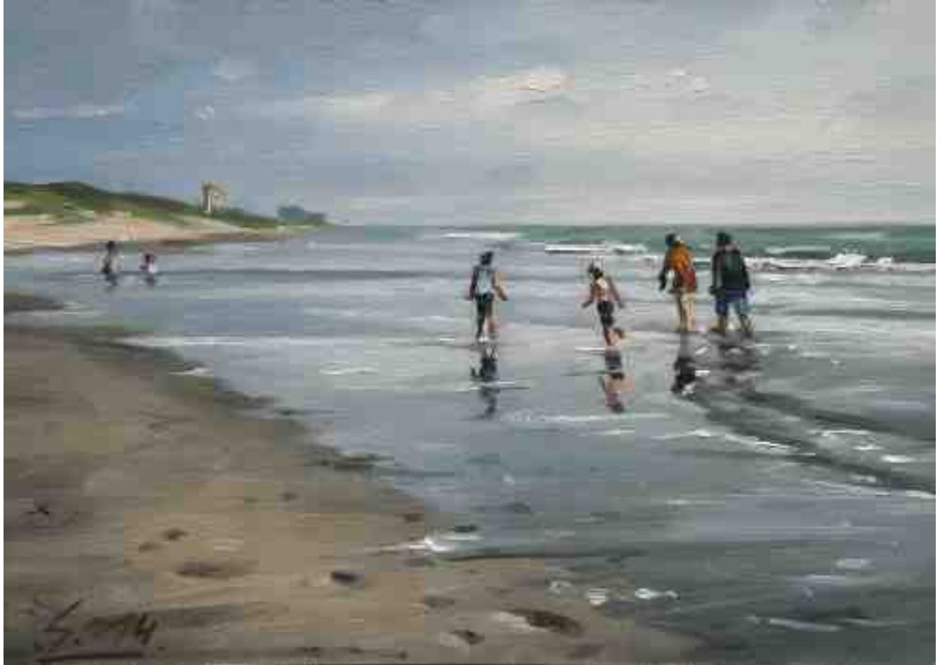
Strandspaziergang Richtung Egmond 2014 | Öl/Lw./Holz | 15 x 21 cm