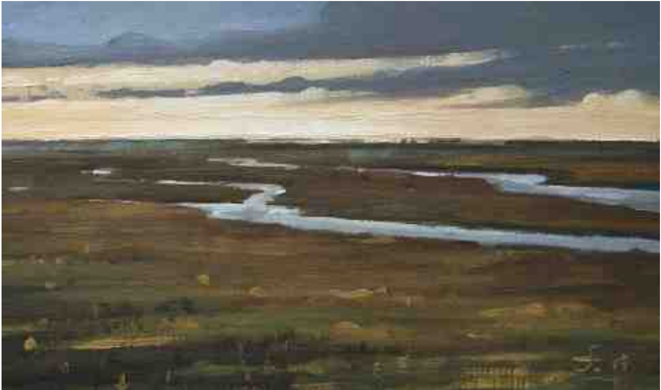
Deichvorland abends 2011 | Öl/Karton | 13 x 22 cm