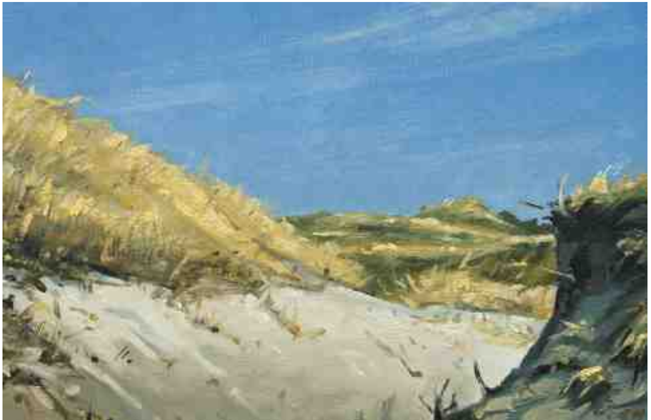
Dünen auf Amrum 2011 | Öl/Karton | 13 x 20 cm