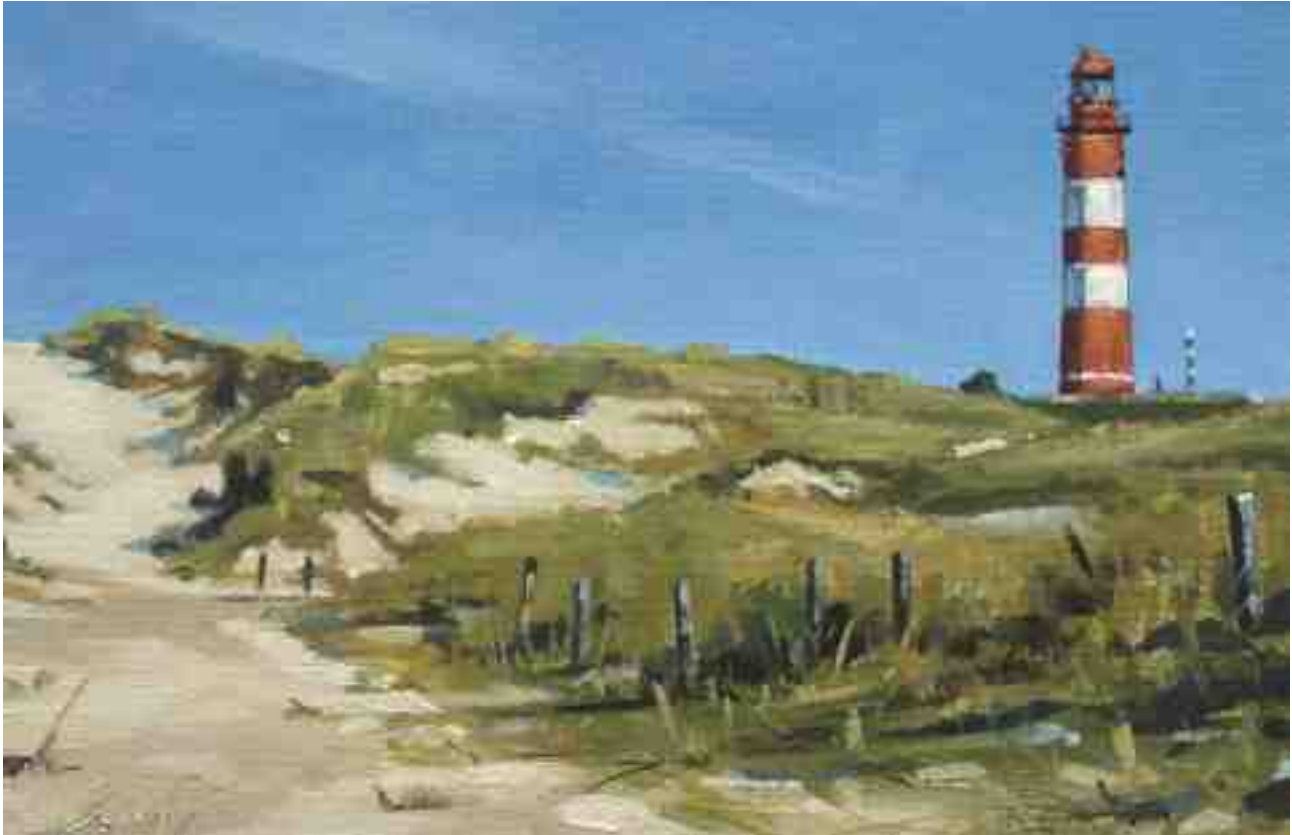
Leuchtturm Amrum 2011 | Öl/Karton | 13 x 20 cm