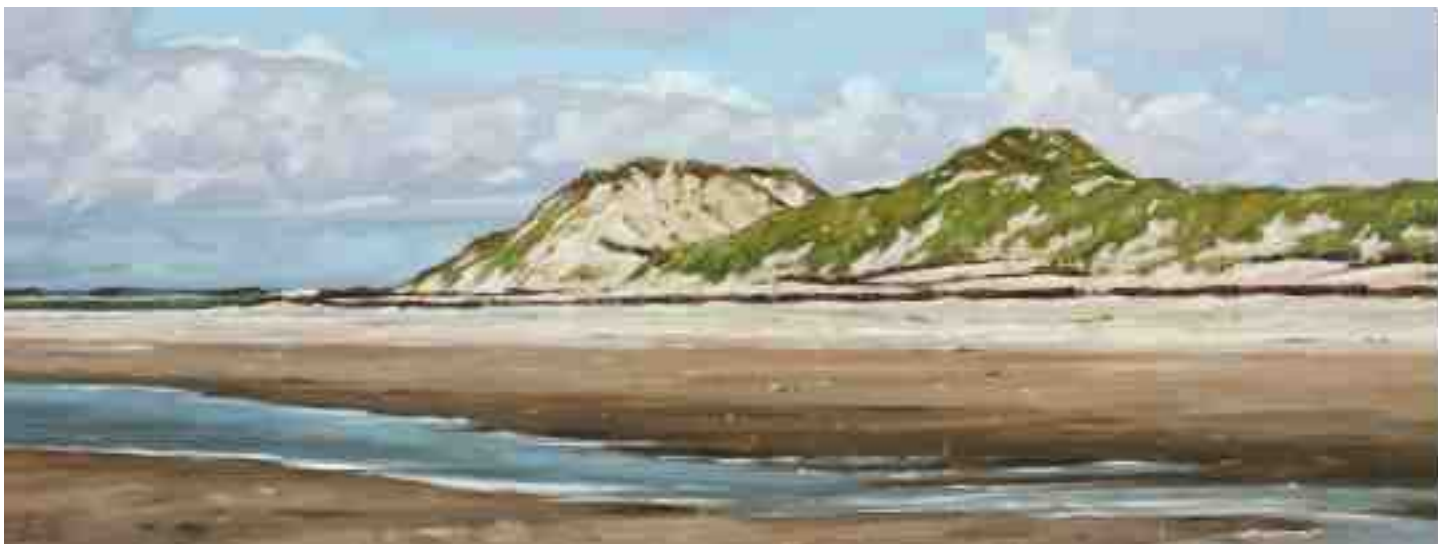
Amrum Odde Nordspitze I 2015 | Öl/Holz | 30 x 80 cm