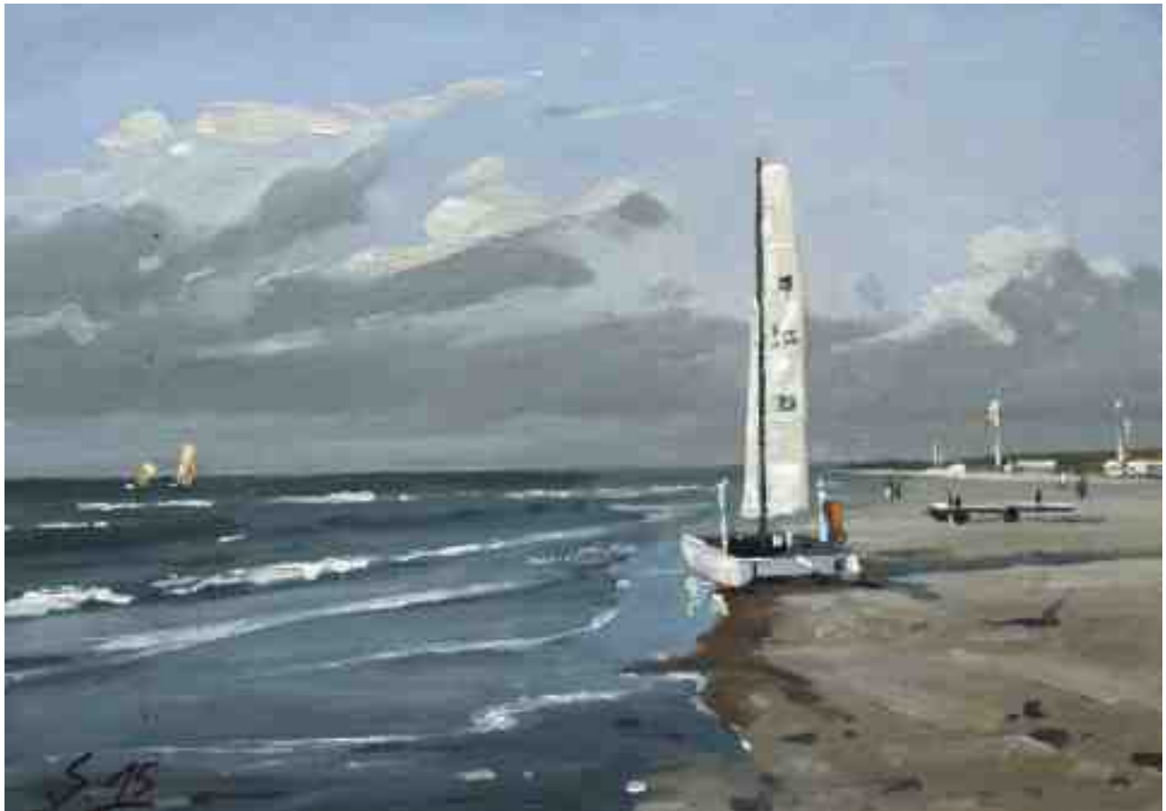
Am Strand VIII 2015 | Öl/Karton | 14 x 20 cm