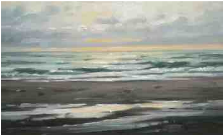
Bergen aan Zee Brandung I 2014 | Öl/Karton | 15 x 25 cm