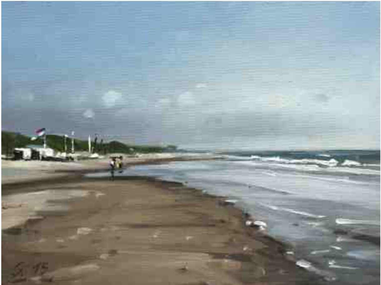
Am Strand von Bergen aan Zee I 2015 | Öl/Lw./Holz | 15 x 20 cm