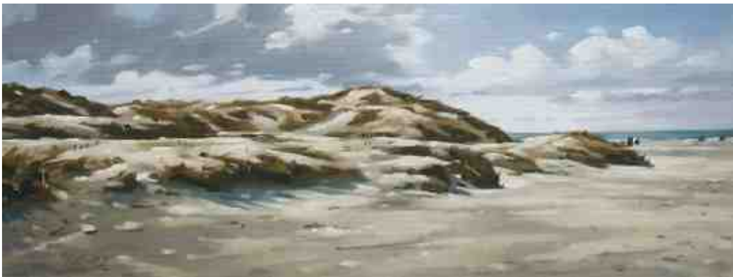
Dünenlandschaft bei St. Peter Ording I 2012 | Öl/Lw./Holz | 15 x 40 cm