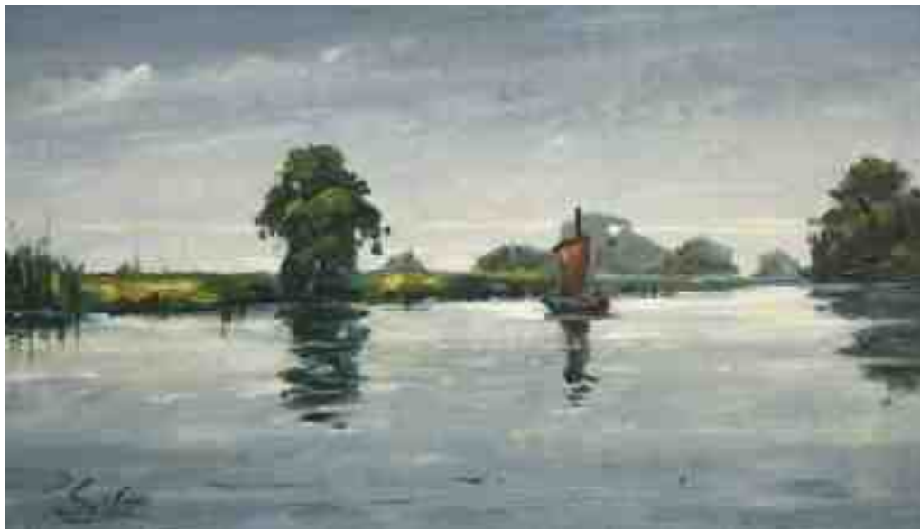
Torfkahn auf der Hamme 2014 | Öl/Karton | 12 x 21 cm