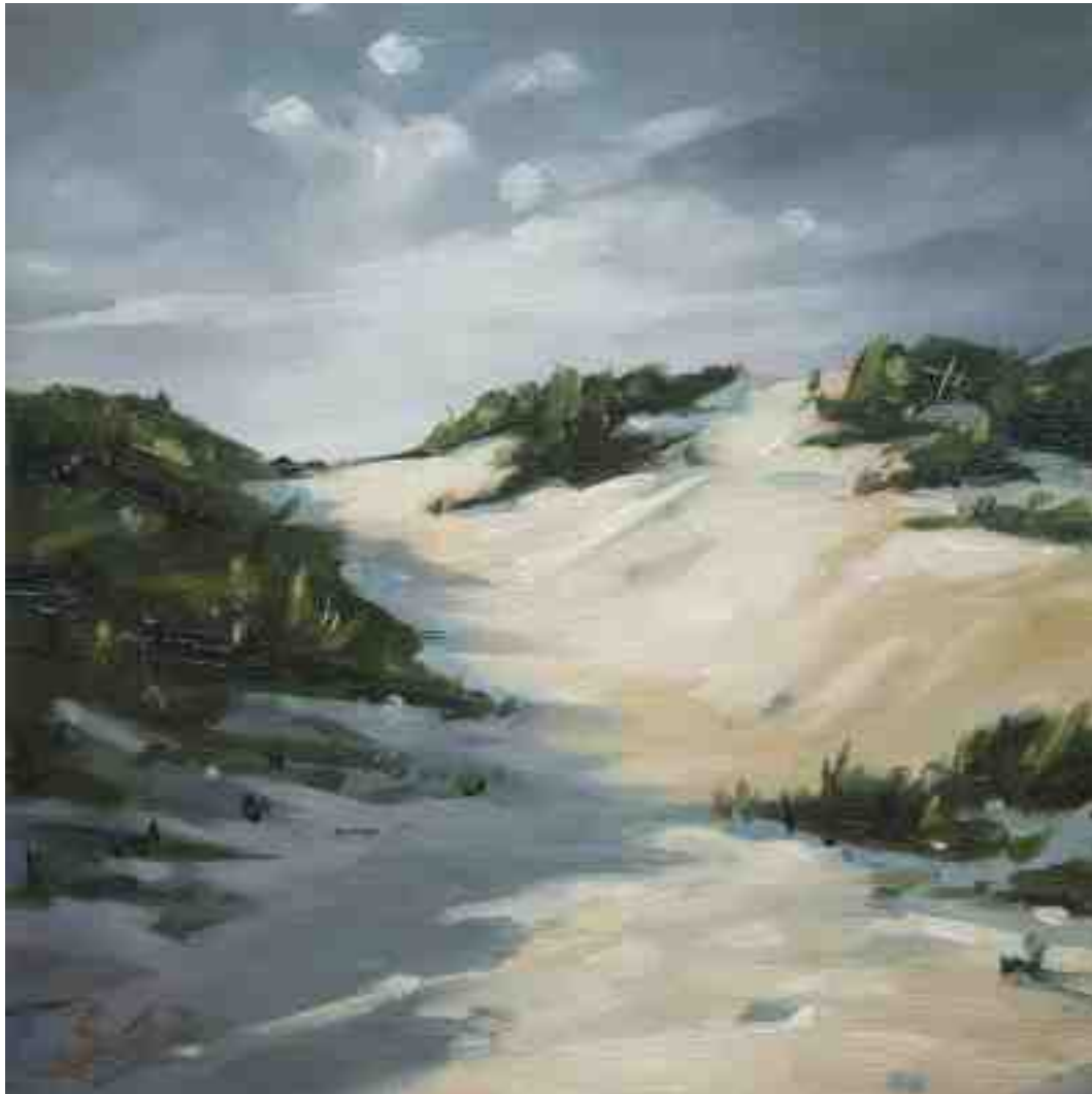
Düne St. Peter Ording 2012 | Öl/Holz | 15 x 15 cm