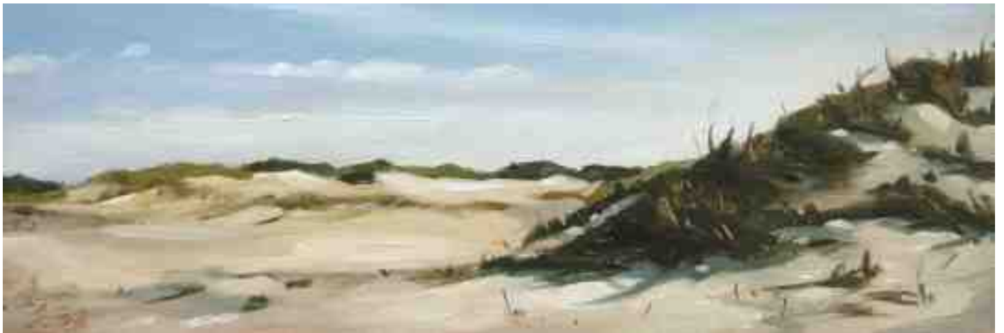
Vorsommer in den Dünen St. Peter Ording 2012 | Öl/Holz | 10 x 30 cm