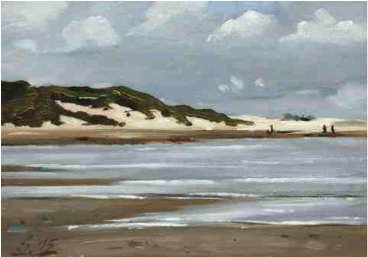
Bewölkerter Himmel Amrum Odde 2015 | Öl/Karton | 14 x 20 cm