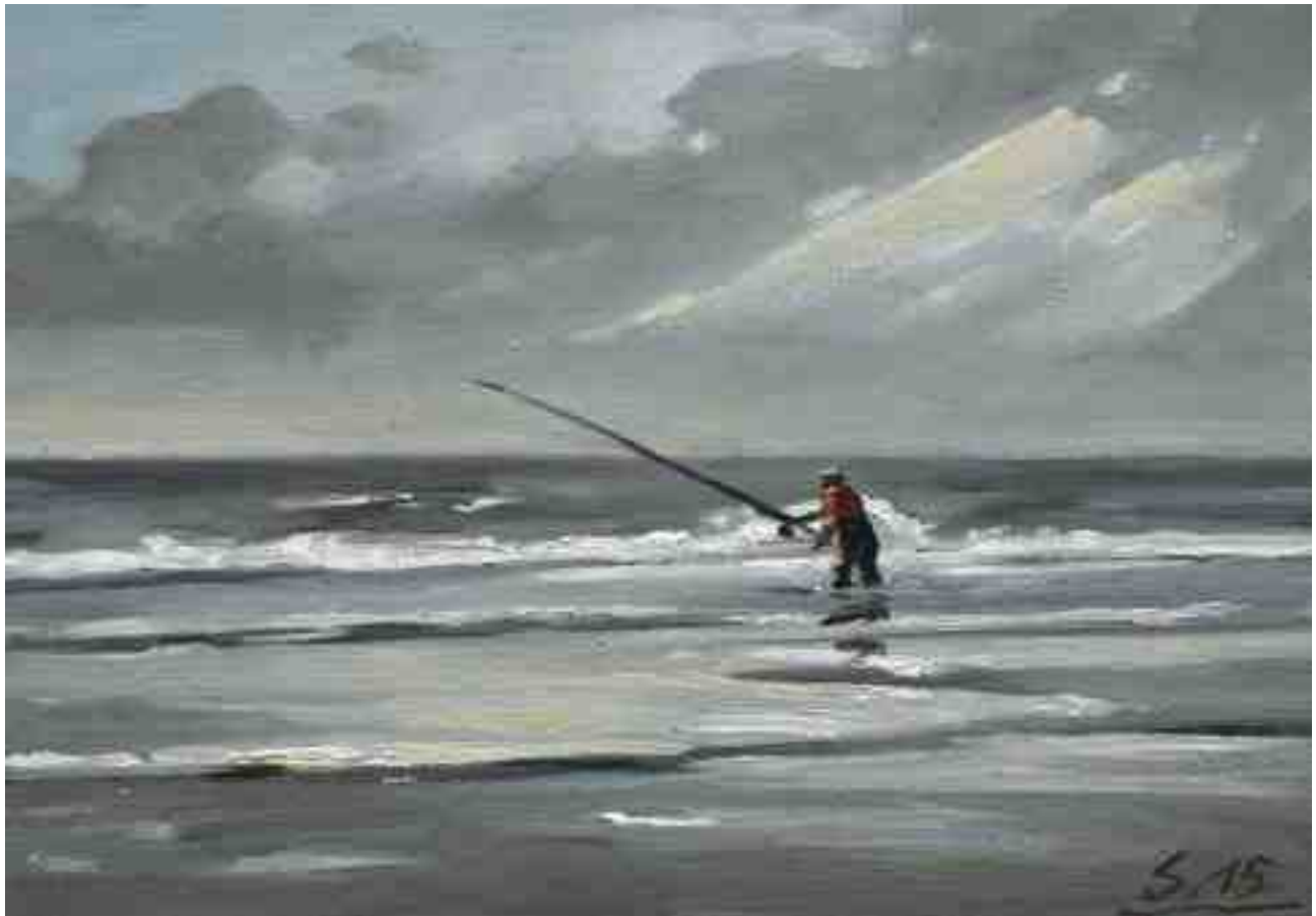
Brandungsangler 2015 | Öl/Karton | 14 x 20 cm