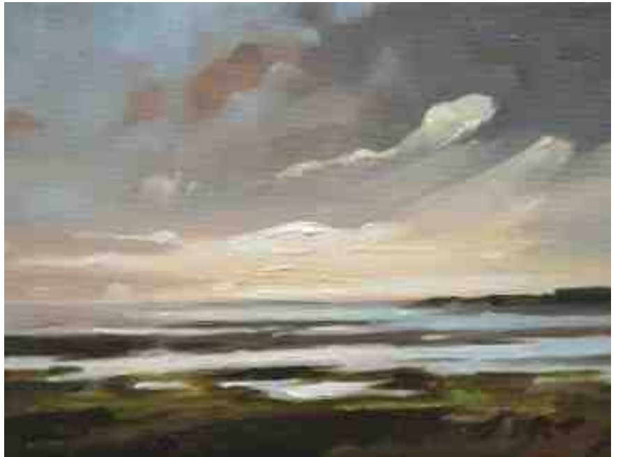
Nordlichter XII Watt bei Husum 2015 | Öl/Lw. | 18 x 24 cm