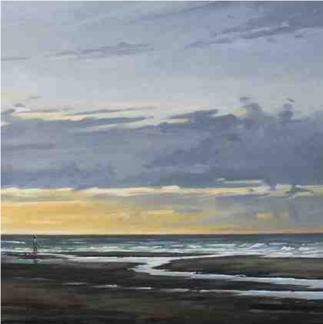
Sonnenuntergang an der Nordsee 2014 | Öl/Lw. | zweiteilig 60 x 120 cm