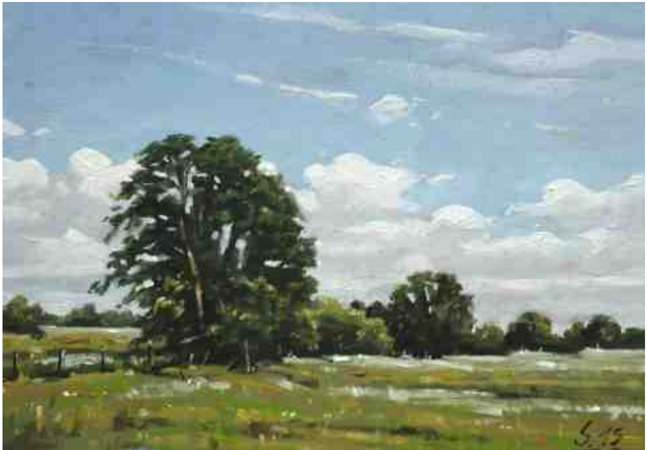
Wümmelandschaft 2015 | Öl/Karton | 14 x 20 cm