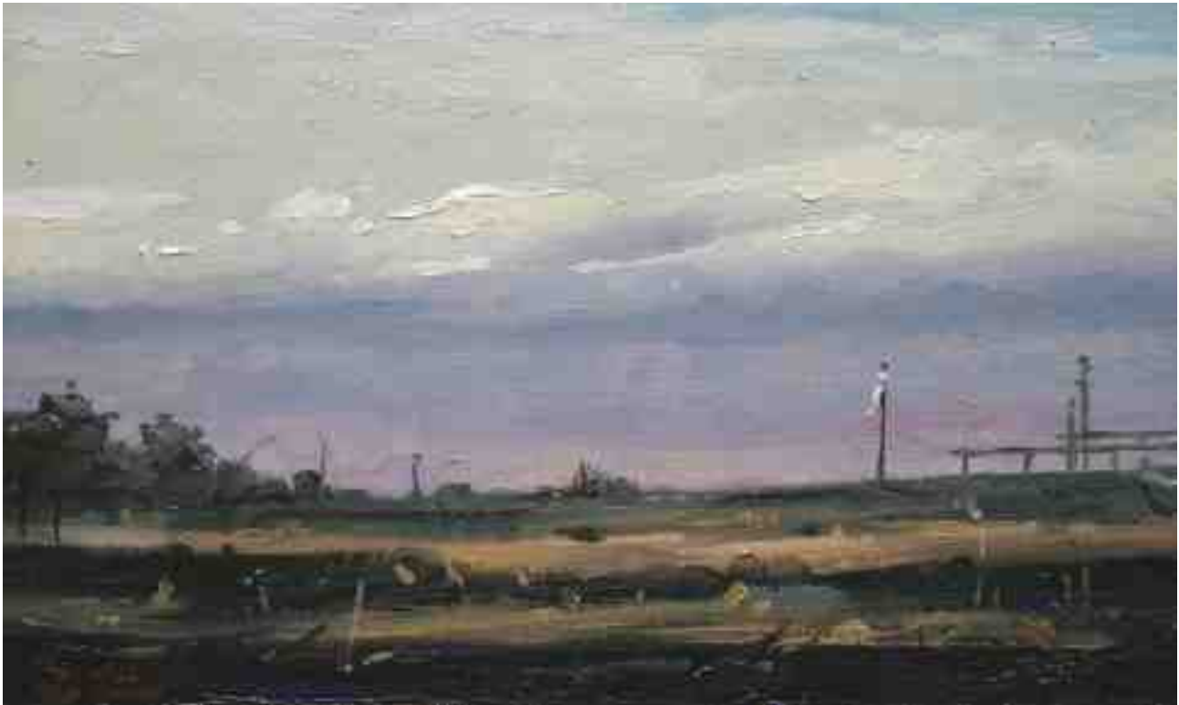
Blick Richtung Teufelsmoor 2014 | Öl/Karton | 15 x 25 cm