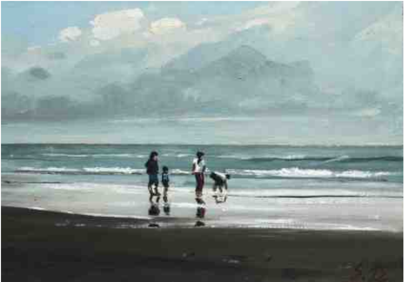
Am Strand II 2015 | Öl/Karton | 14 x 20 cm