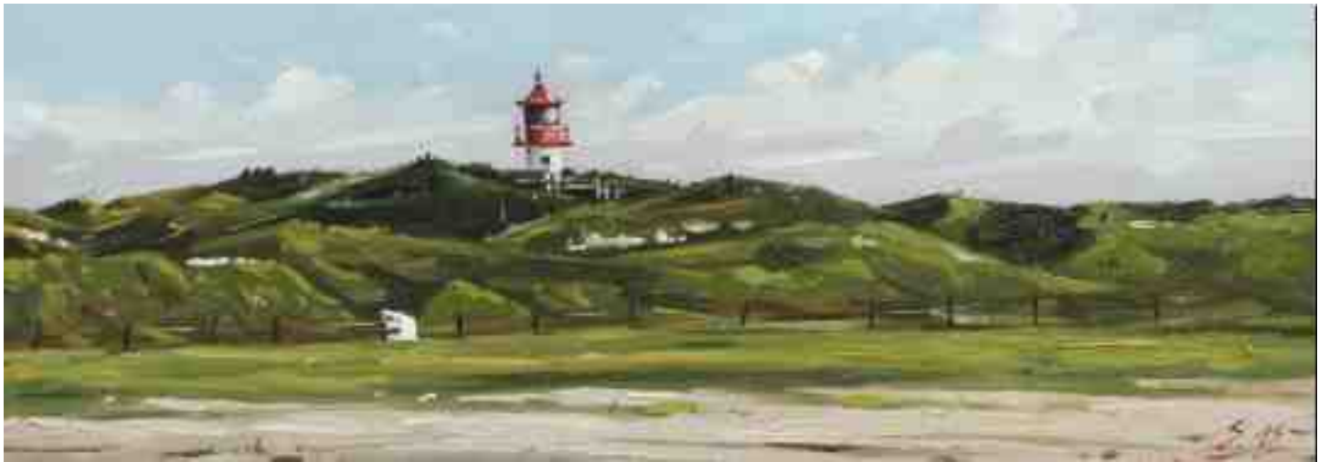
Amrum Quermarkenfeuer 2015 | Öl/Holz | 14 x 40 cm