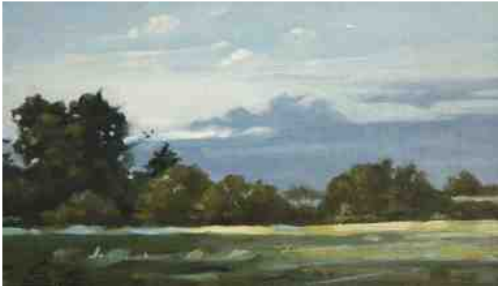
Abendstimmung Worpswede 2014 | Öl/Karton | 12 x 21 cm