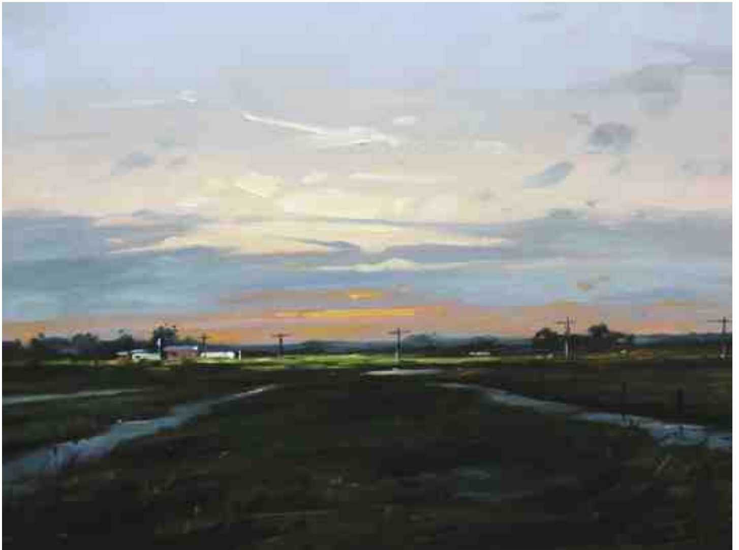
Abends auf Nordstrand 2015 | Öl/Holz | 30 x 40 cm