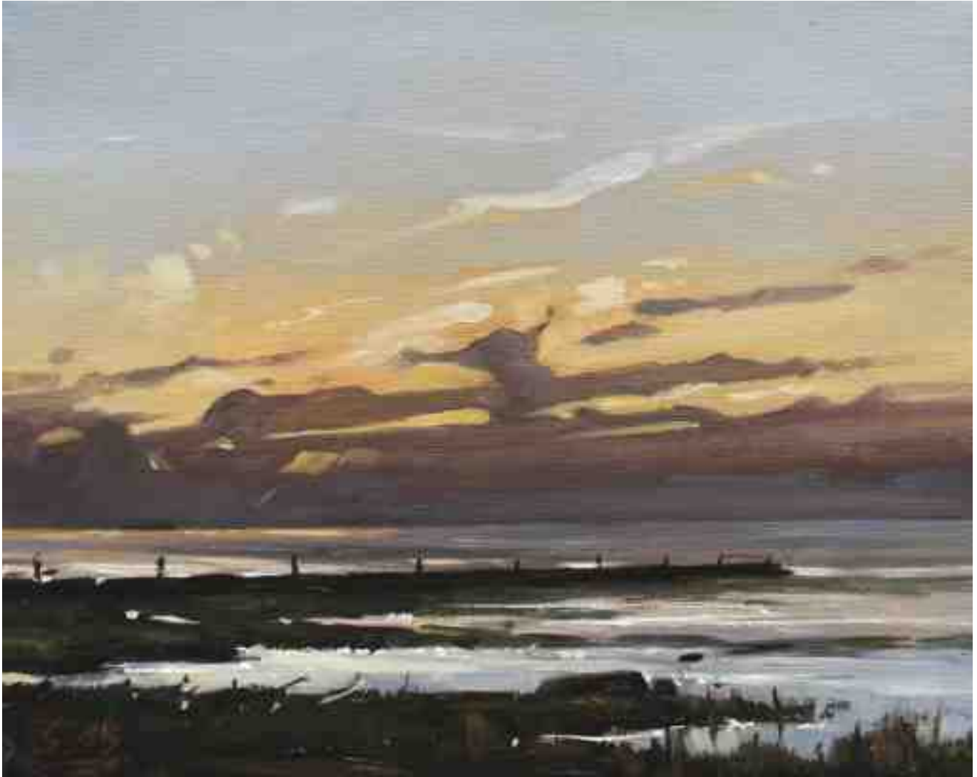
Abendstimmung Watt Nordstrand 2015 | Öl/Lw. | 24 x 30 cm