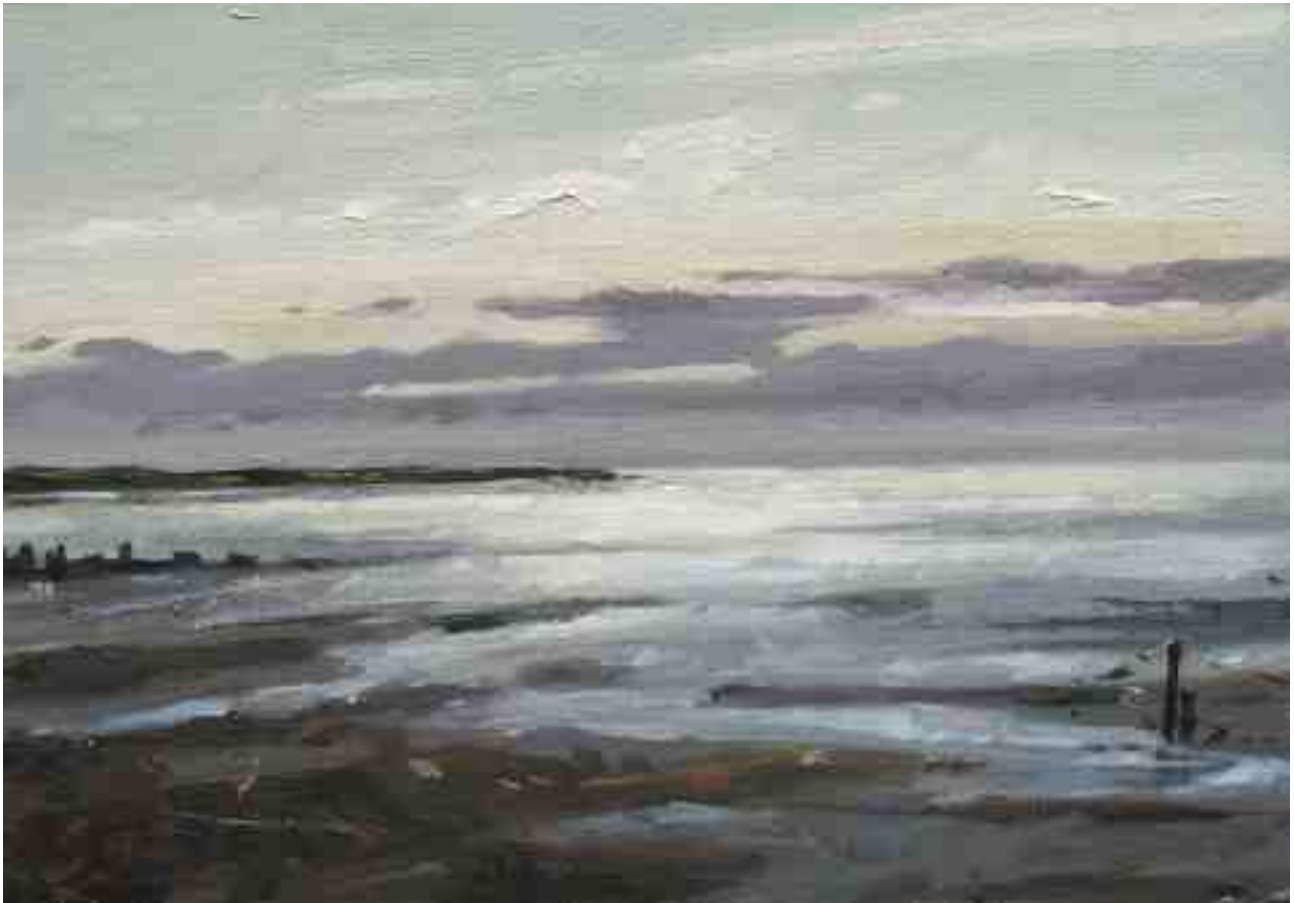
Watt bei Westerhever abends 2012 | Öl/Karton | 14 x 20 cm