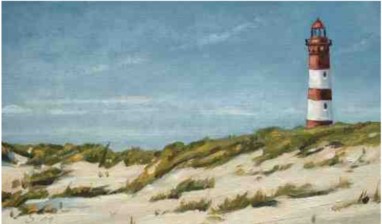
Leuchtturm mit Dünen auf Amrum 2011 | Öl/Karton | 13 x 20 cm