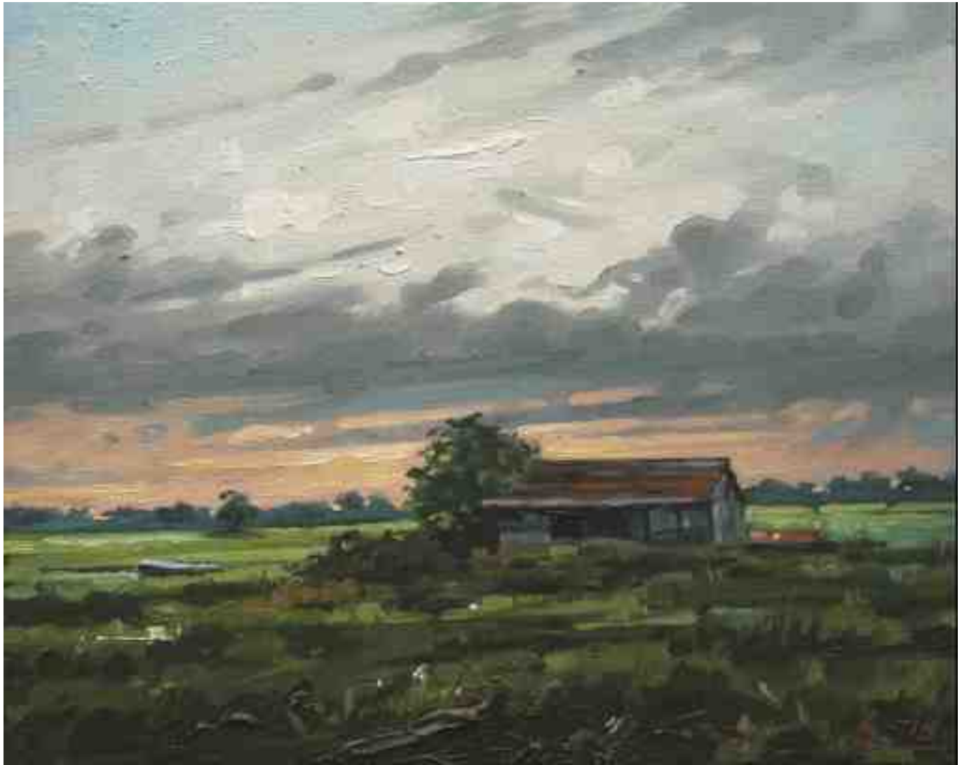
Worpsweder Licht IV 2014 | Öl/Lw. | 24 x 30 cm