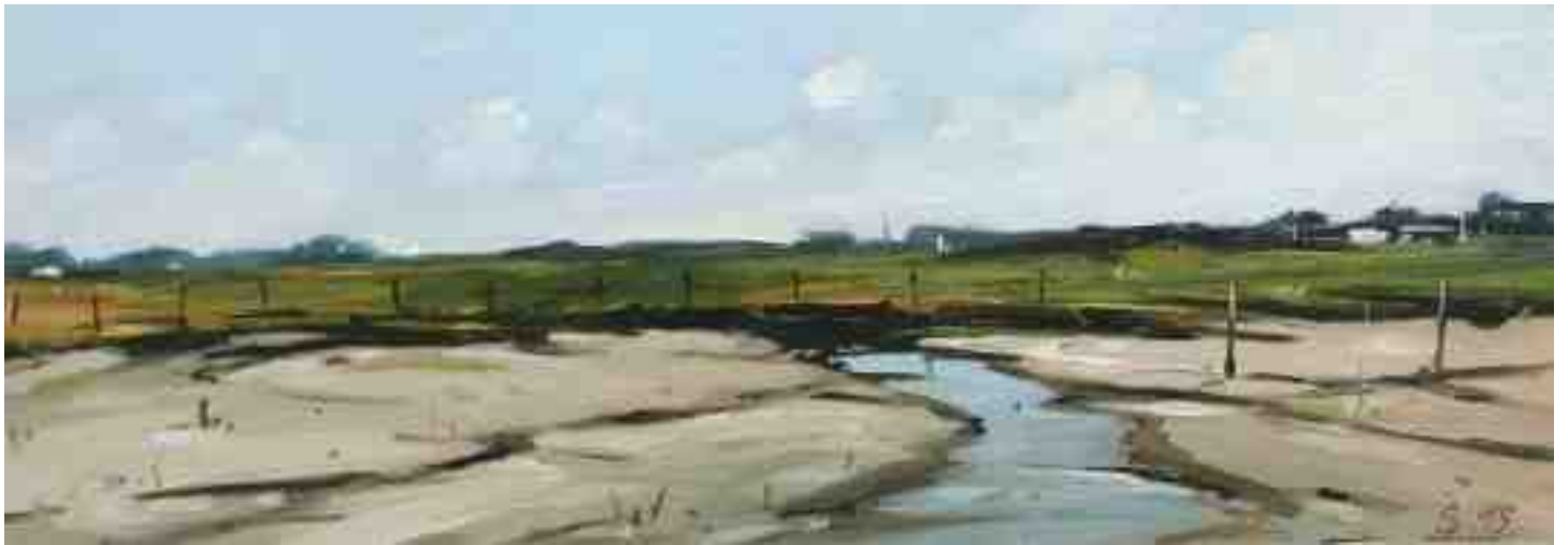
Auf Amrum 2015 | Öl/Holz | 14 x 40 cm