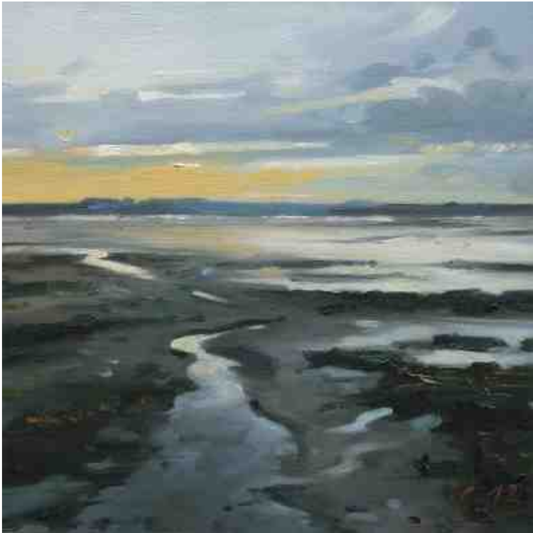
Watt bei Halebüll 2012 | Öl/Holz | 15 x 15 cm