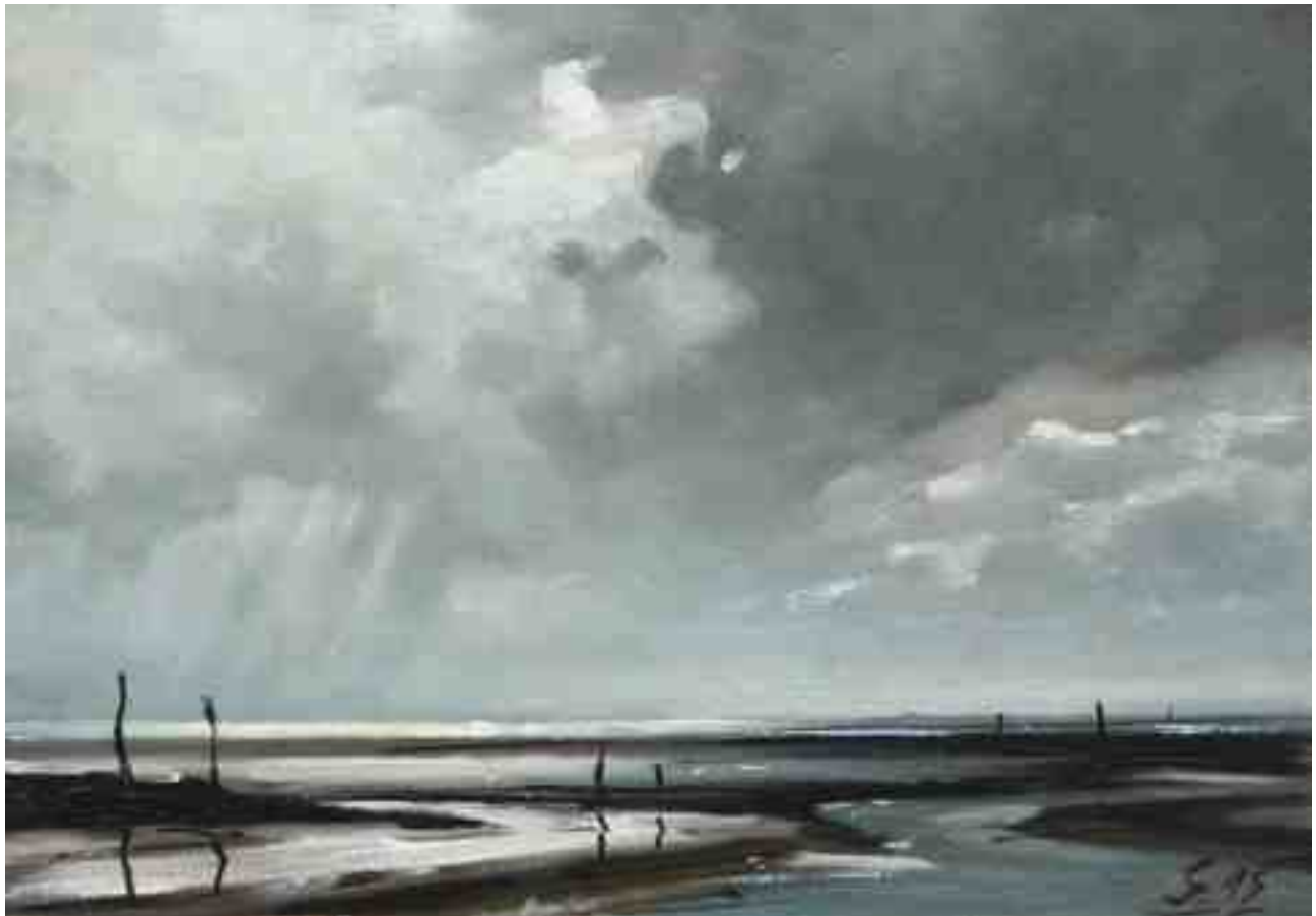
Watt Gegenlicht 2015 | Öl/Karton | 14 x 20 cm