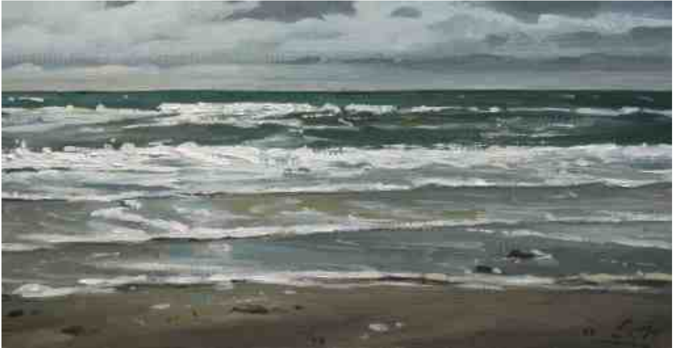
Brandungsstudie Nordsee 2011 | Öl/Karton | 13 x 25 cm