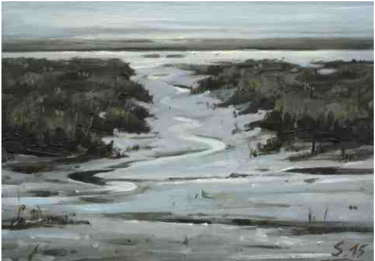
Im Watt 2015 | Öl/Karton | 14 x 20 cm