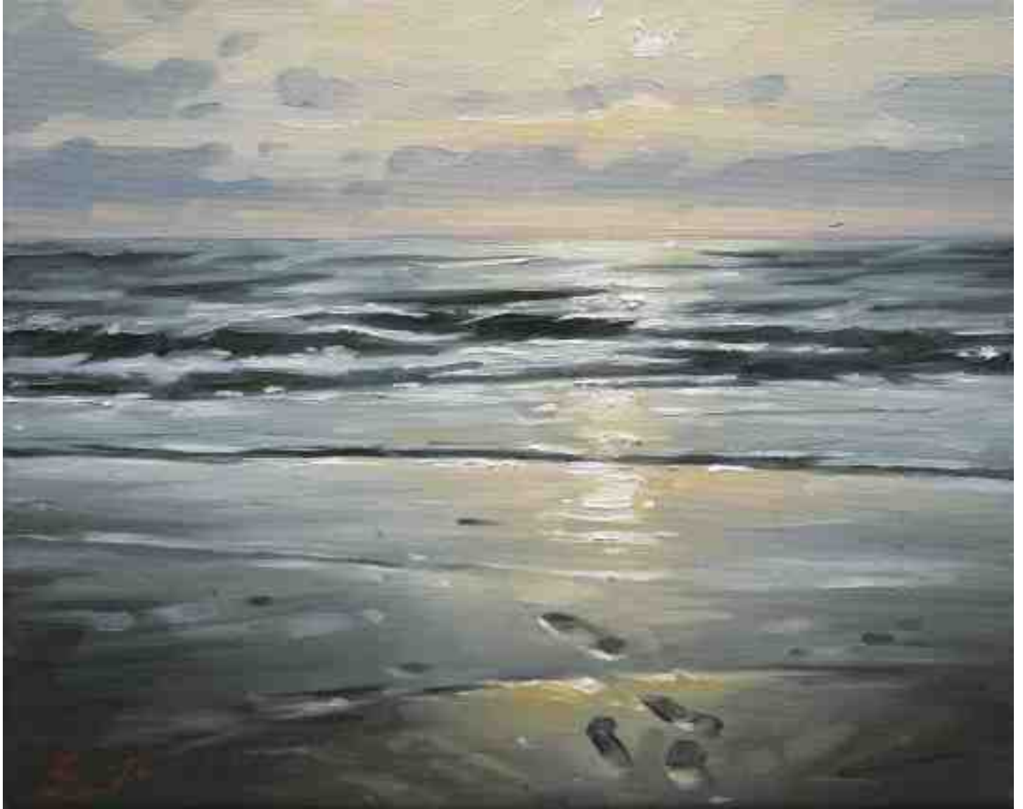
Spätes Licht II 2014 | Öl/Lw. | 24 x 30 cm