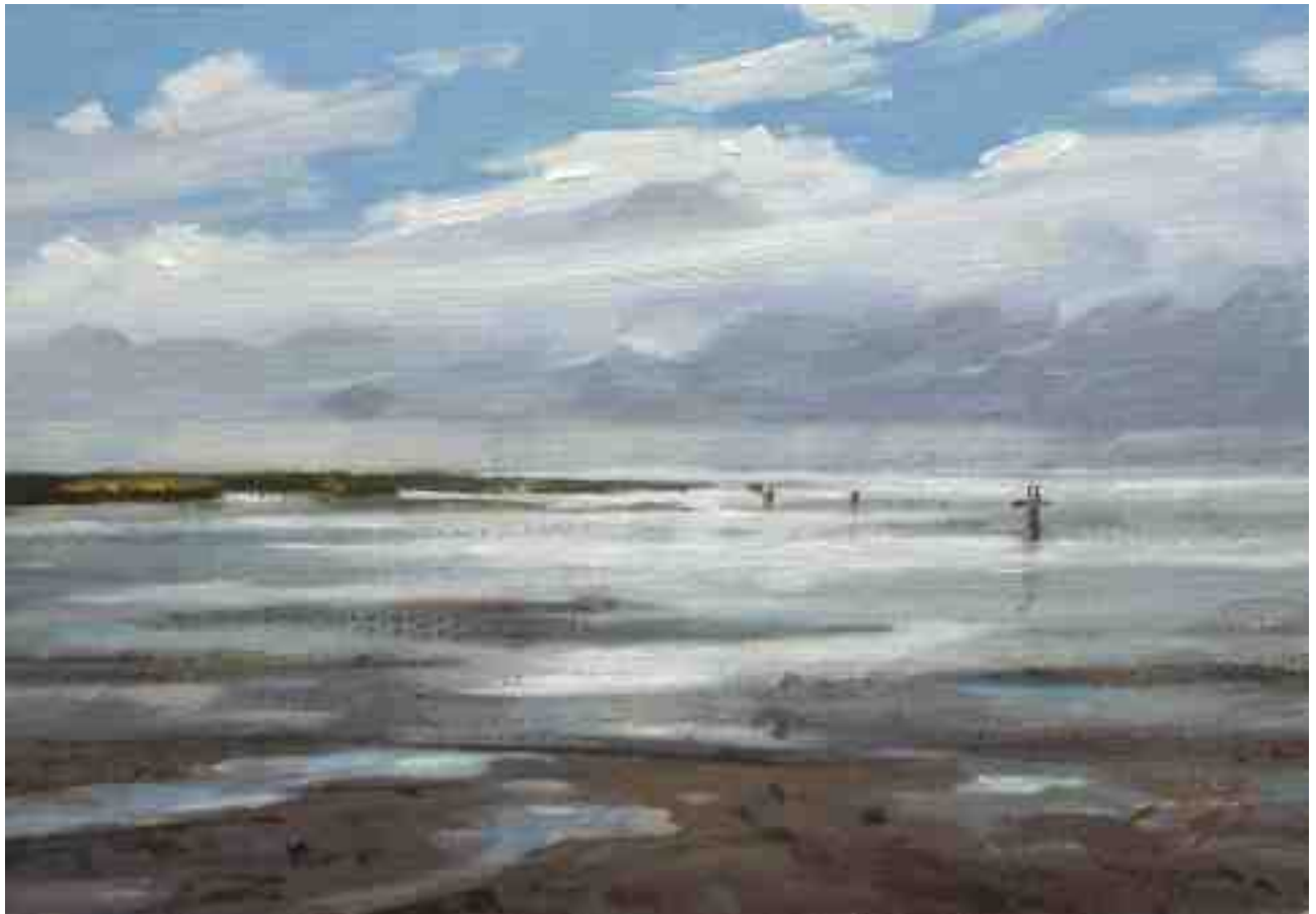
Watt bei Westerhever 2012 | Öl/Karton | 14 x 20 cm