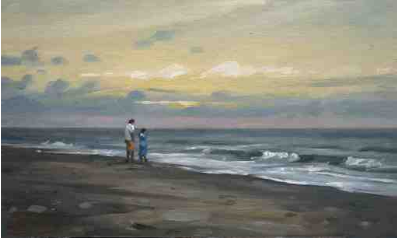
Abends am Strand 2014 | Öl/Karton | 15 x 25 cm