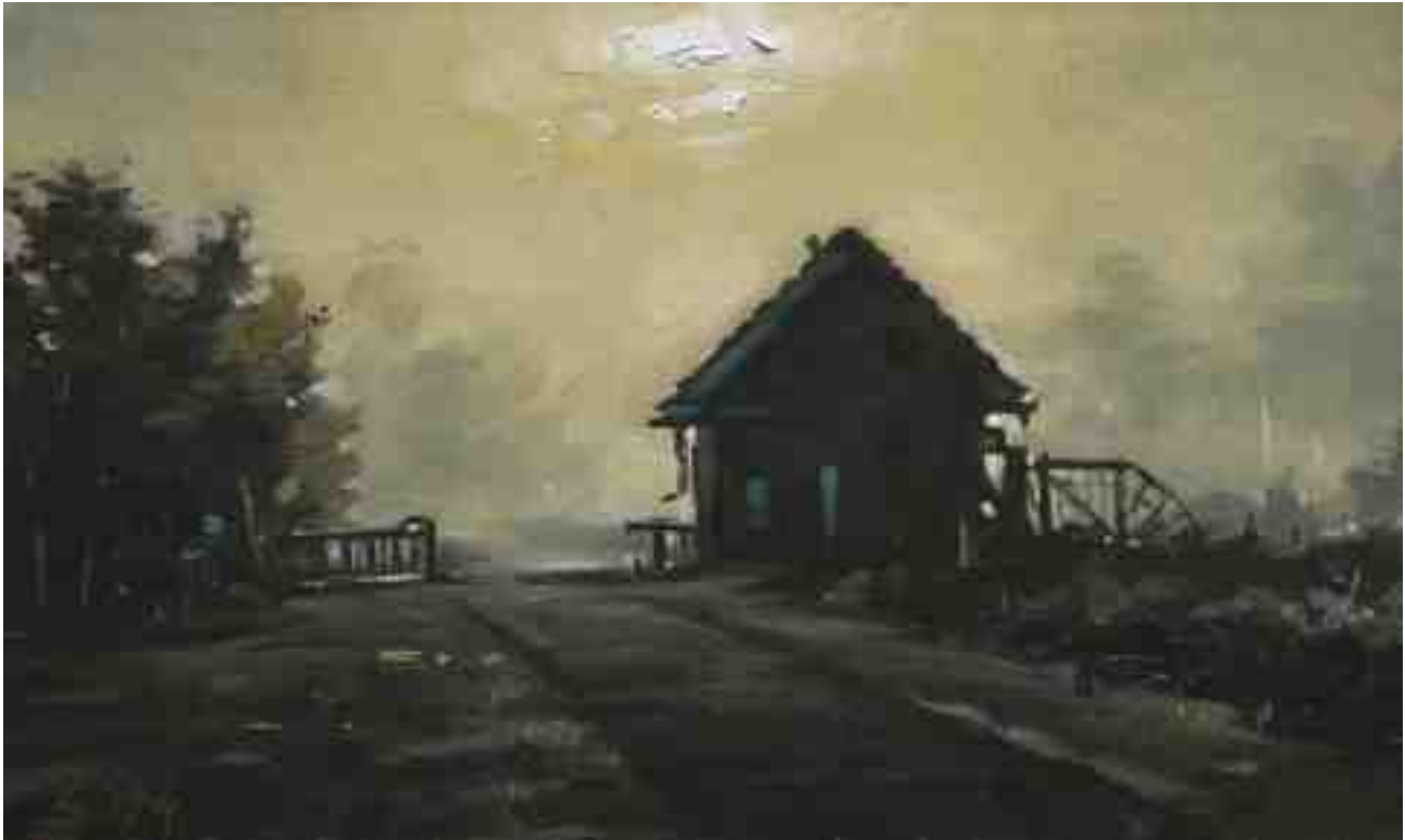
Haus am Moor 2014 | Öl/Karton | 15 x 25 cm