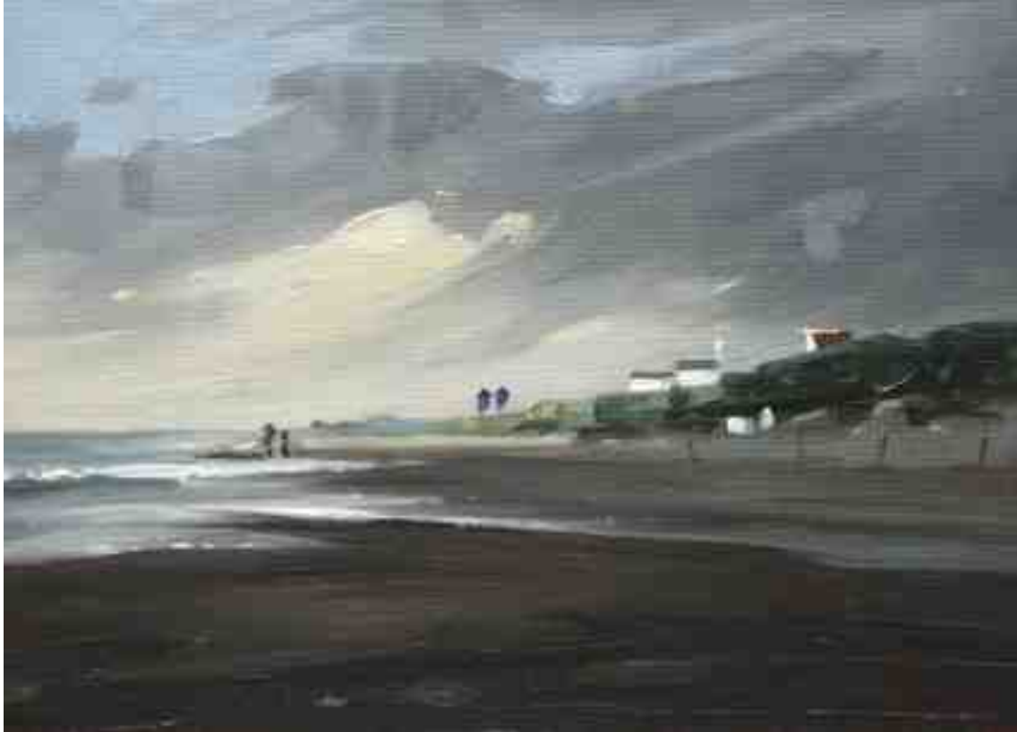
Abziehender Regen 2015 | Öl/Lw./Holz | 13 x 18 cm