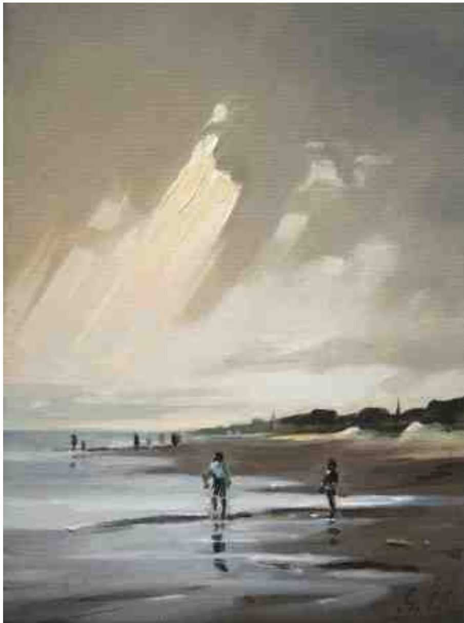
Nordlichter V Am Strand 2015 | Öl/Lw. | 24 x 18 cm