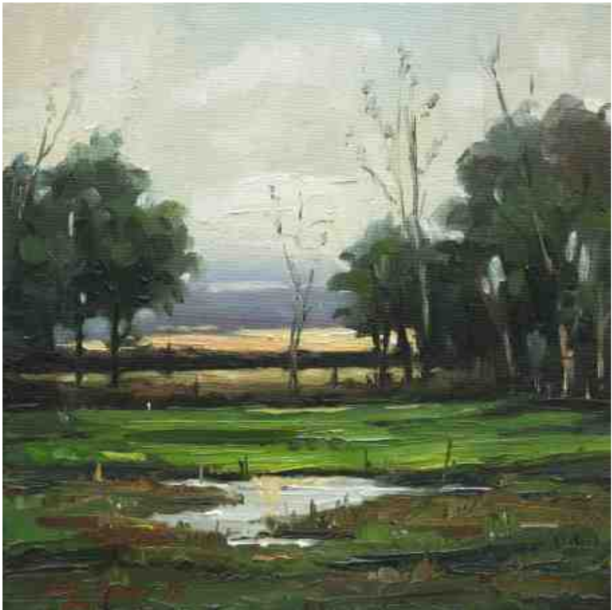
Letztes Licht im Teufelsmoor 2015 | Öl/Lw. | 30 x 30 cm