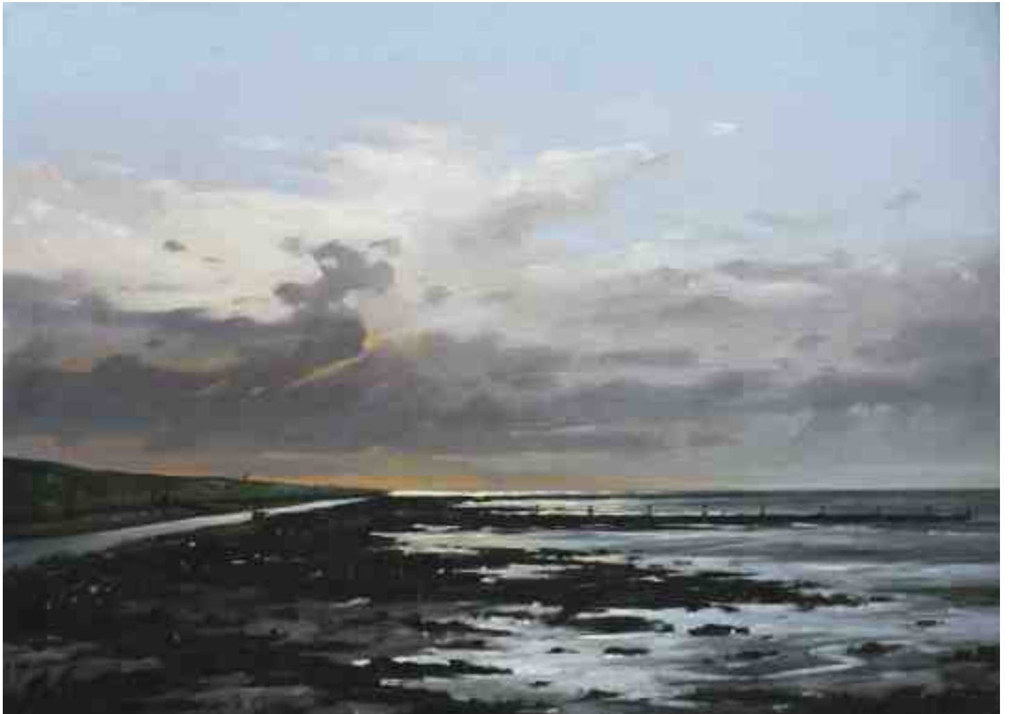
Watt abends auf Nordstrand 2015 | Öl/Lw. | 50 x 70 cm