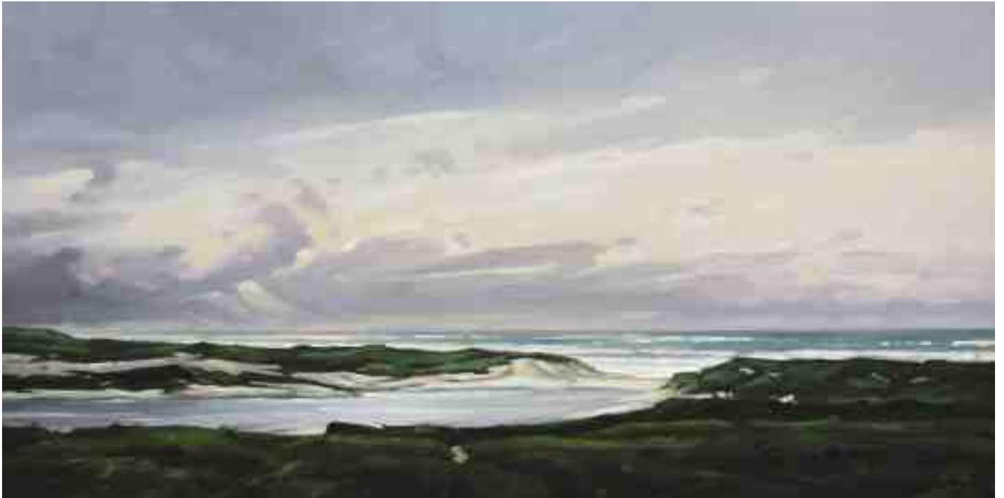
Dünenlandschaft Nordholland 2015 | Öl/Lw. | 40 x 80 cm