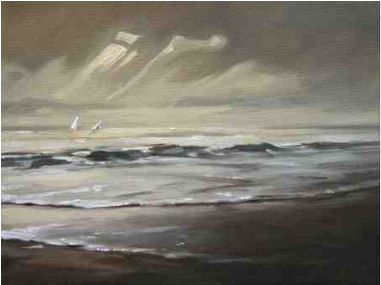
Nordlichter VII Brandung 2015 | Öl/Lw. | 18 x 24 cm