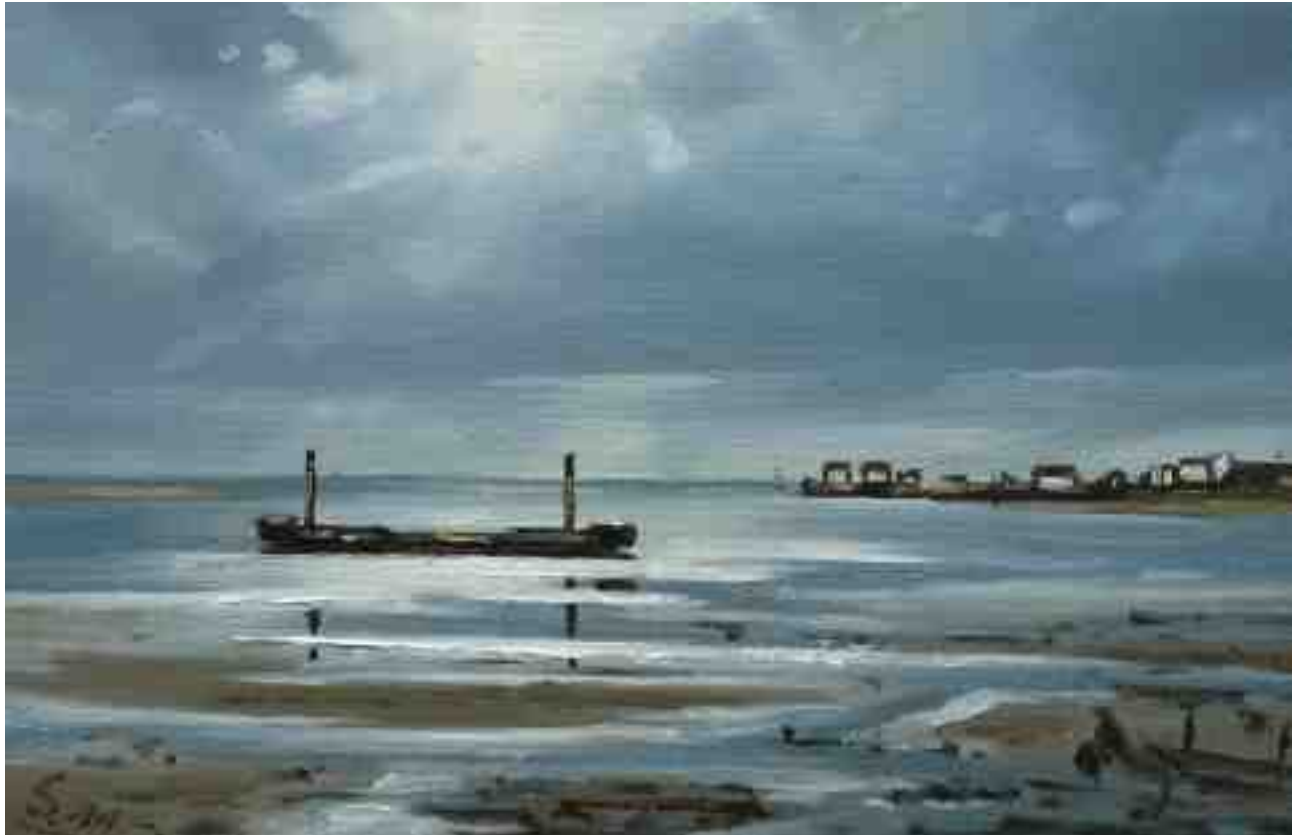
Watt Amrum Gegenlicht 2011 | Öl/Karton | 13 x 20 cm