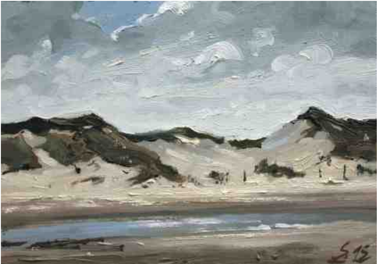
Bergen aan Zee Stranddünen 2015 | Öl/Karton | 14 x 20 cm