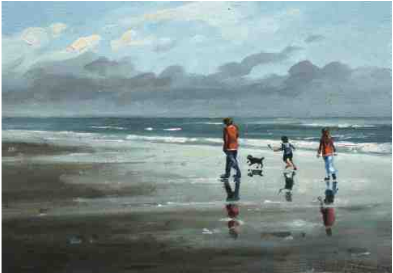
Am Strand III 2015 | Öl/Karton | 14 x 20 cm