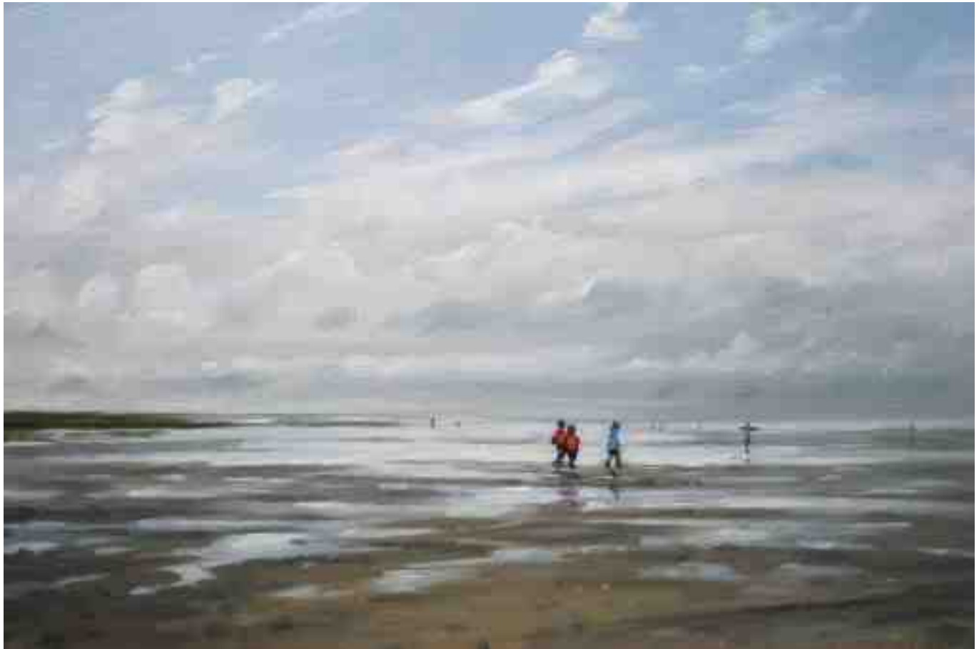
Wattwanderer bei Westerhever 2012 | Öl/Holz | 20 x 30 cm