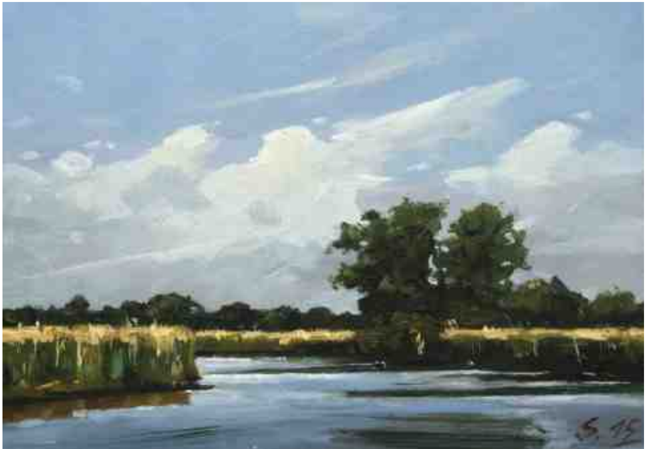
An der Oste 2015 | Öl/Karton | 14 x 20 cm