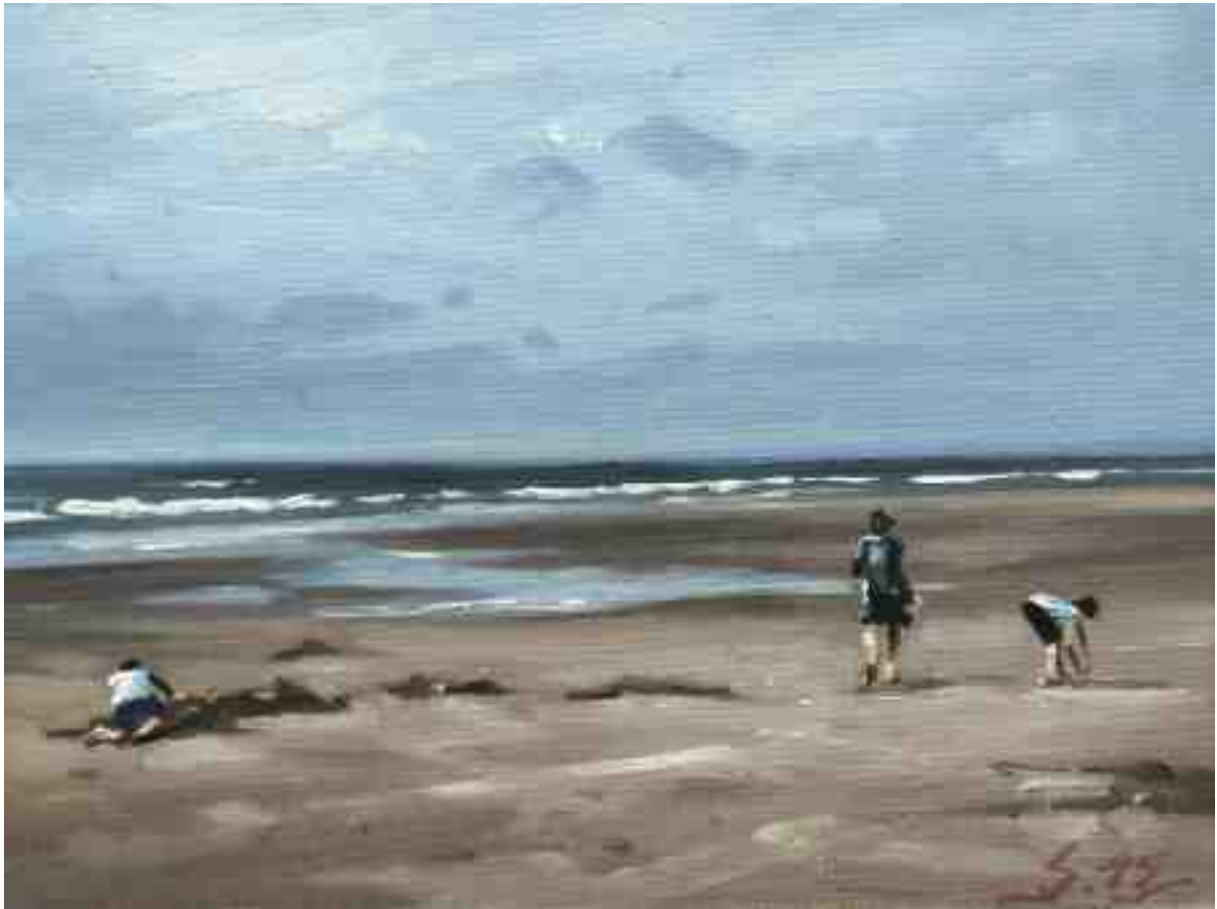
Am Strand von Bergen aan Zee II 2015 | Öl/Lw./Holz | 15 x 20 cm