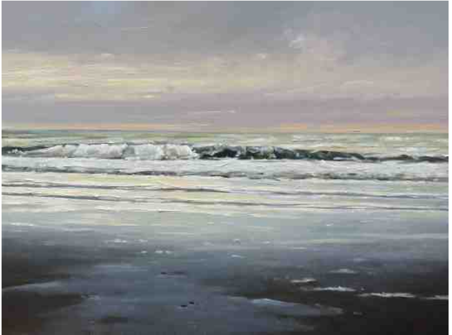
Brandung abends 2015 | Öl/Lw. | zweiteilig jeweils 60 x 80 cm