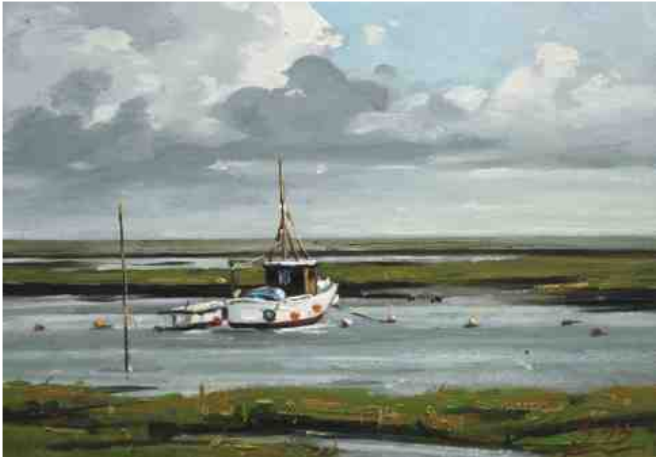
Kutter im Wattenmeer 2015 | Öl/Karton | 14 x 20 cm