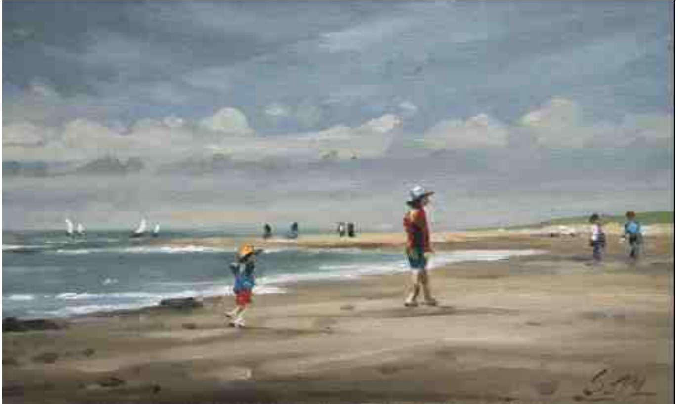
Am Strand von Schoorl 2014 | Öl/Karton | 15 x 25 cm