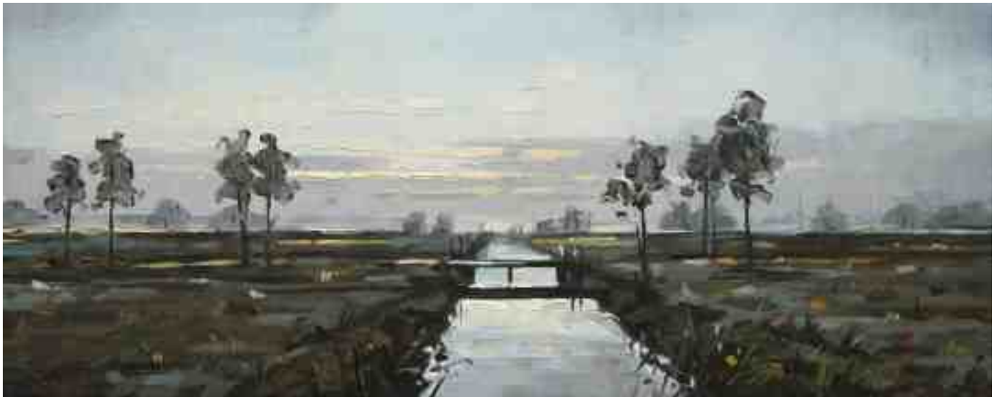
Torfgraben Abendstimmung Worpswede 2014 | Öl/Lw. | 20 x 50 cm