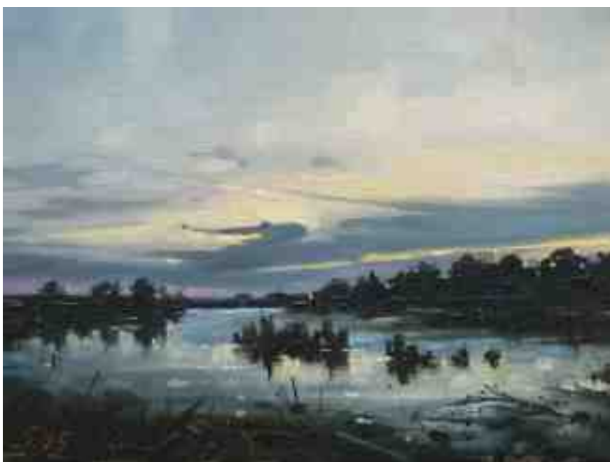
Abends bei Worpswede