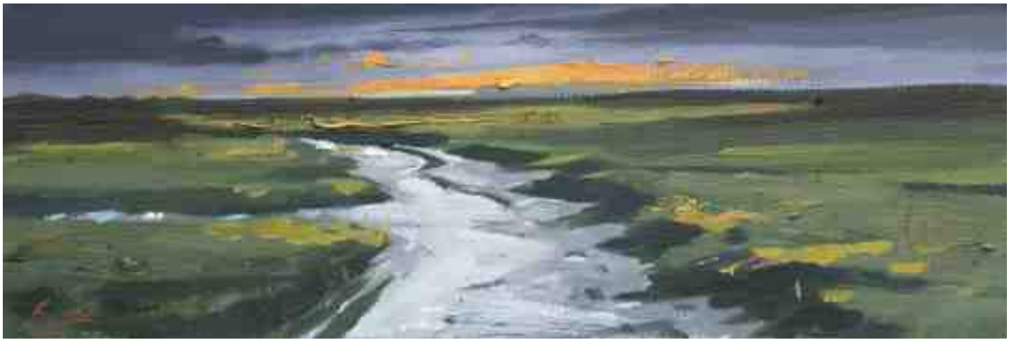
Abendstimmung bei St. Peter Ording 2012 | Öl/Karton | 10 x 30 cm