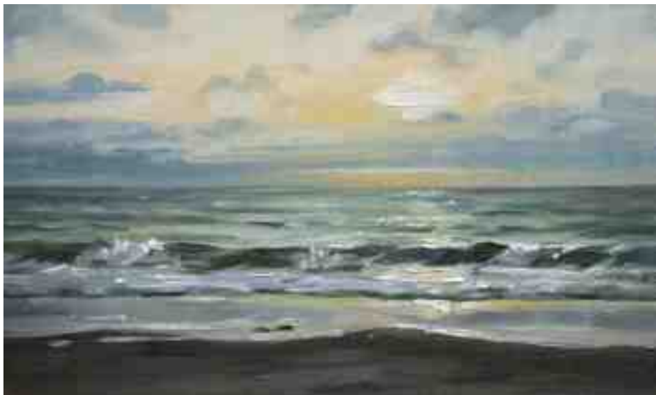
Bergen aan Zee Brandung III 2014 | Öl/Karton | 15 x 25 cm