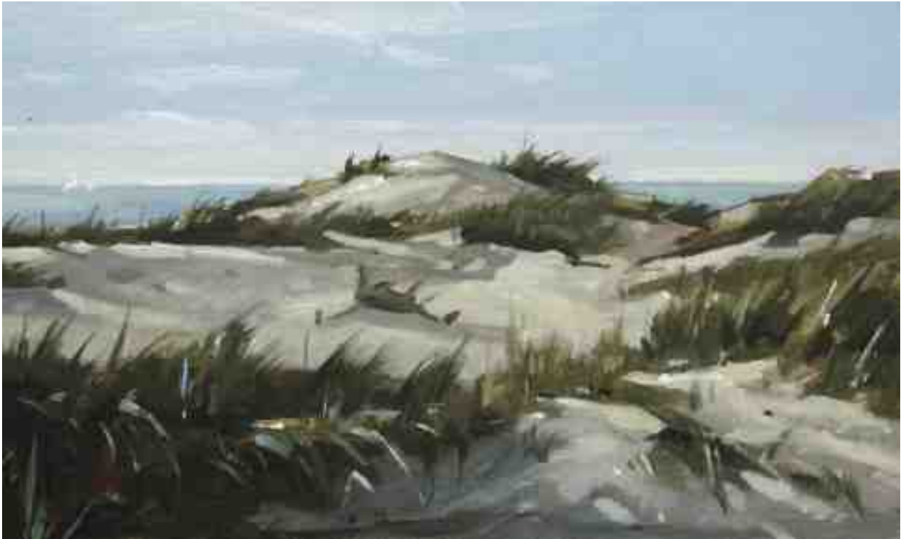
Dünenblick 2015 | Öl/Karton | 12 x 20 cm