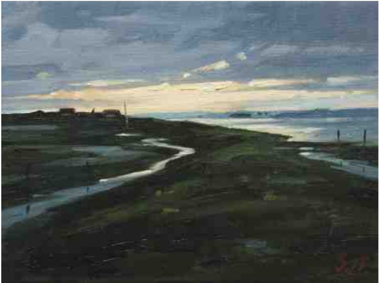
Abends am Deich 2015 | Öl/Lw. | 18 x 24 cm