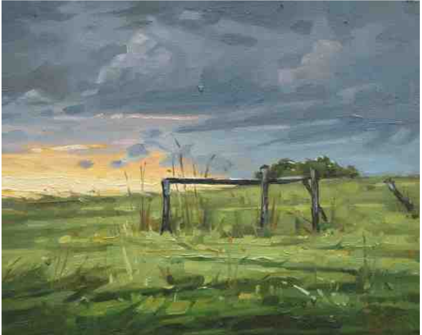
Worpsweder Licht II 2014 | Öl/Lw. | 24 x 30 cm