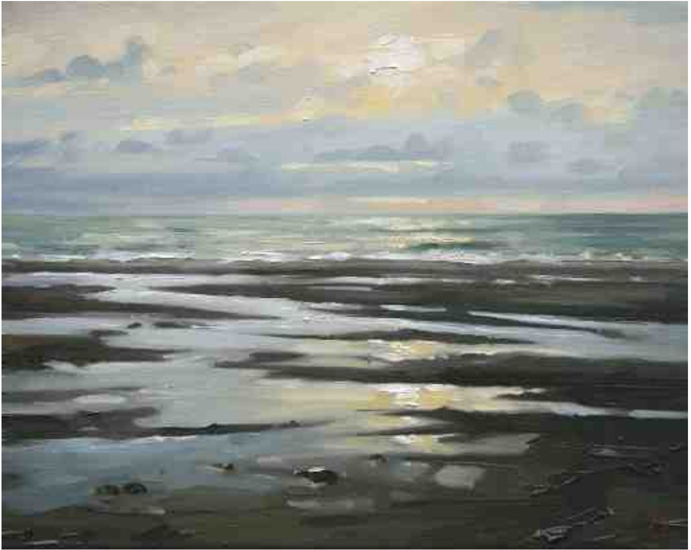
Spätes Licht I 2014 | Öl/Lw. | 24 x 30 cm