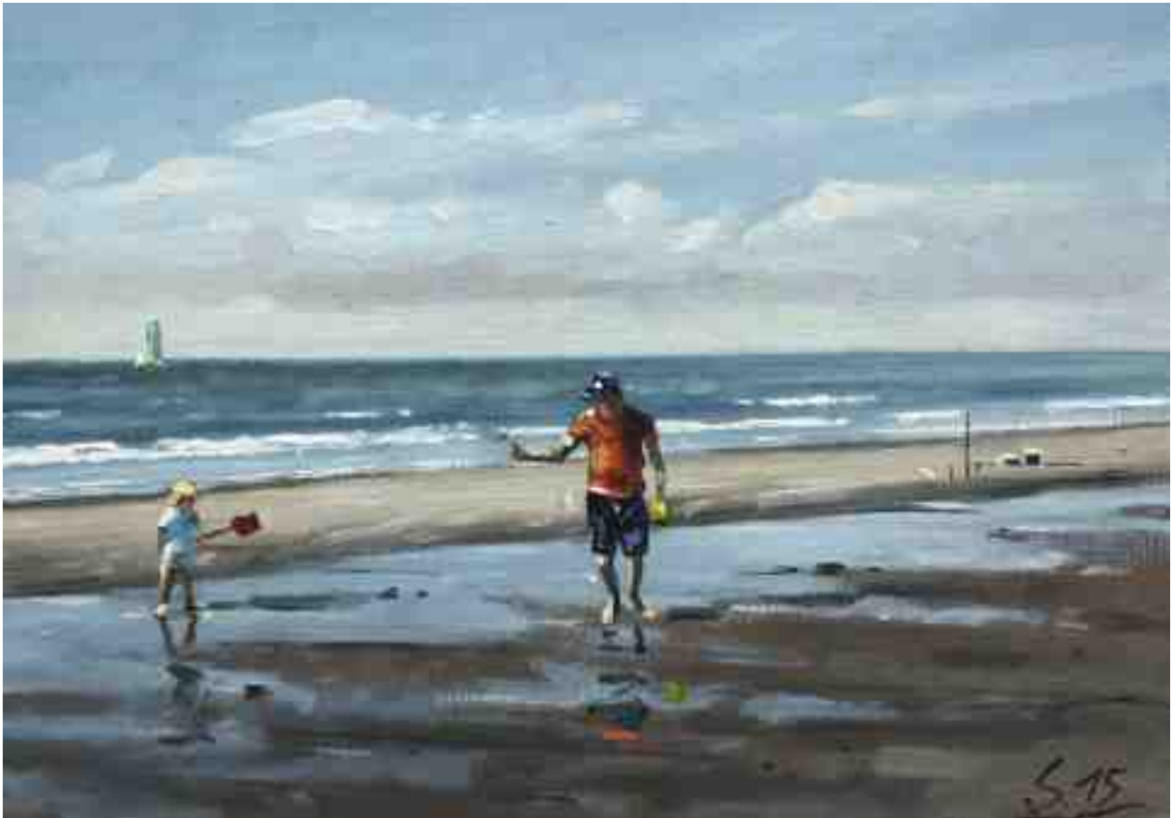
Am Strand VI 2015 | Öl/Karton | 14 x 20 cm