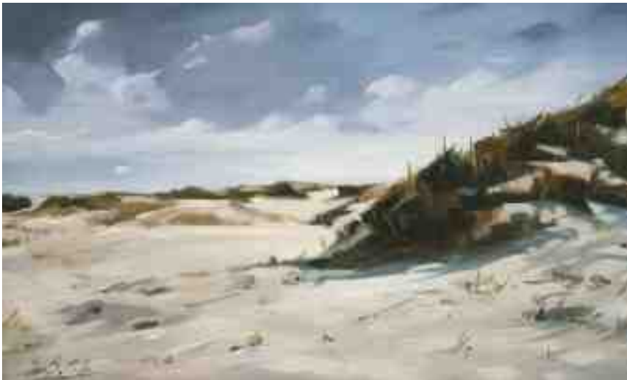
Dünen und Strand St. Peter Ording II 2012 | Öl/Holz | 15 x 24 cm