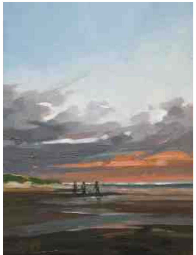
Nordlichter VI Abends 2015 | Öl/Lw. | 24 x 18 cm