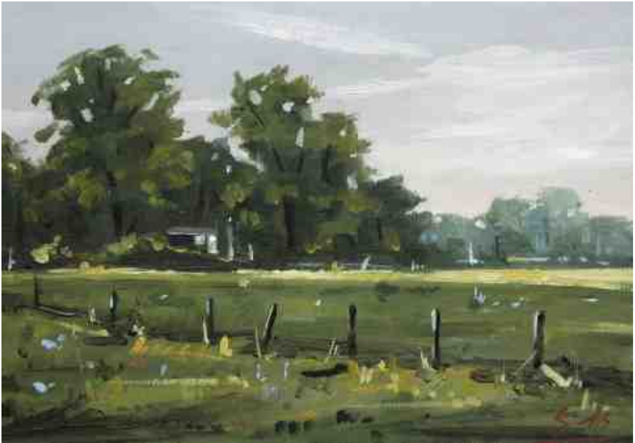
Bei Fischerhude 2015 | Öl/Karton | 14 x 20 cm