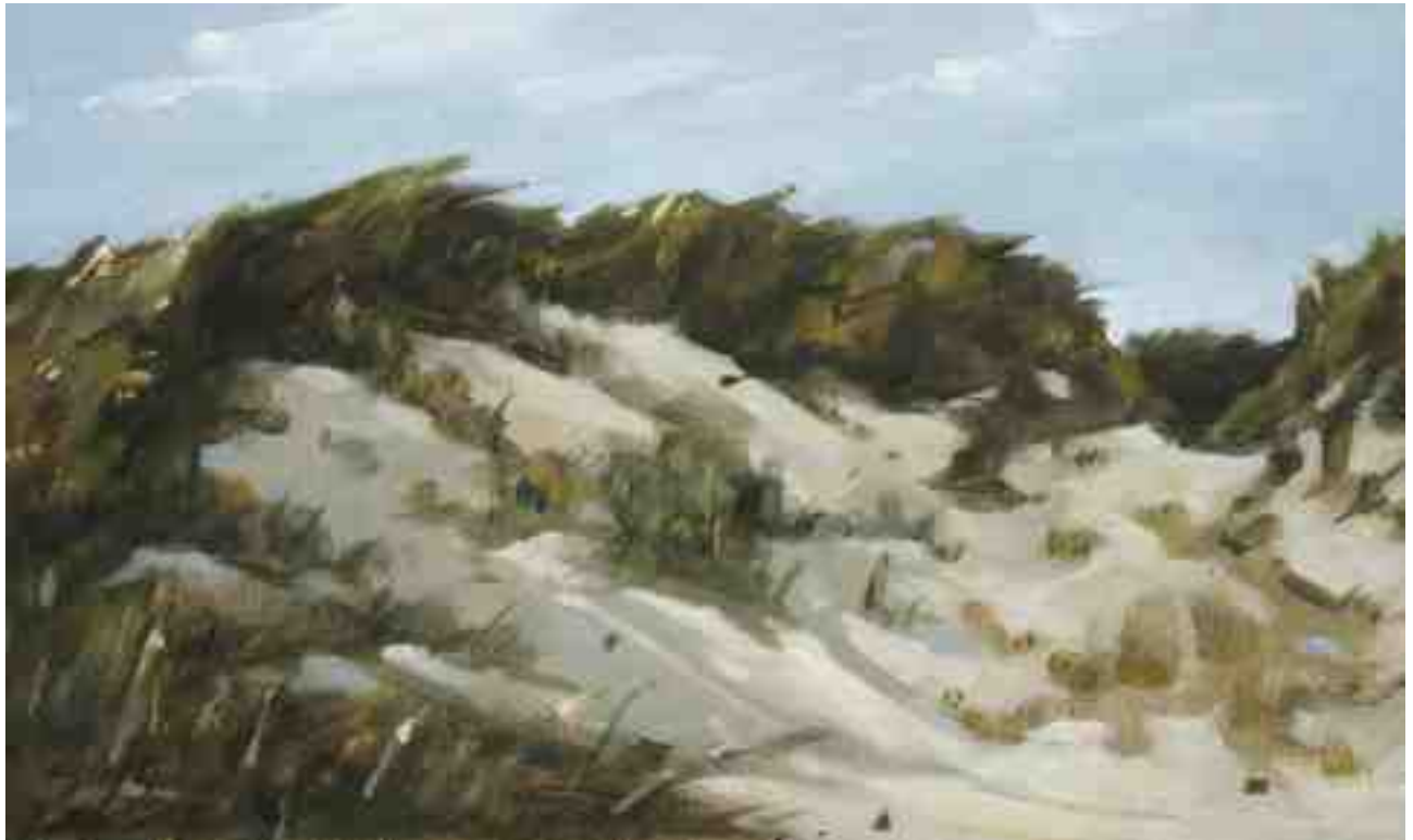
Düne 2015 | Öl/Karton | 12 x 20 cm