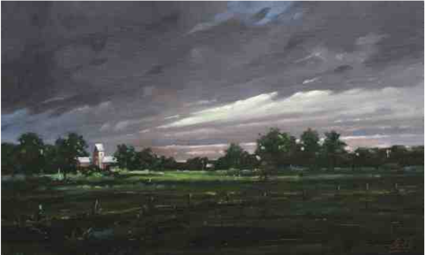
Letztes Licht I 2015 | Öl/Lw. | 30 x 50 cm