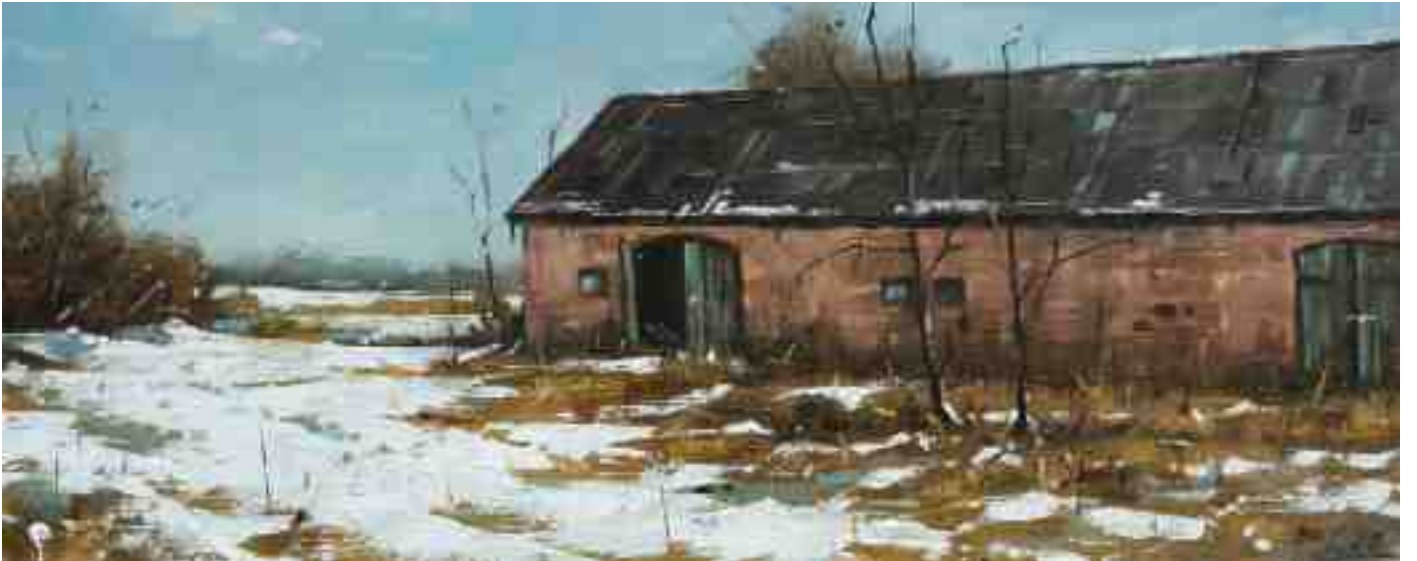
Alte Scheune im Winter III 2020 | Öl/Holz | 18 x 45 cm