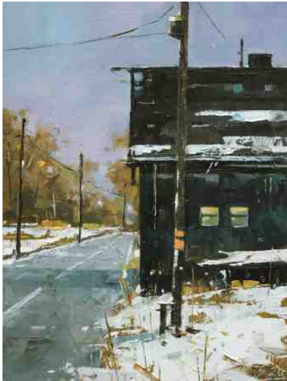
Am Straßenrand 2020 | Öl/Holz | 24 x 18 cm