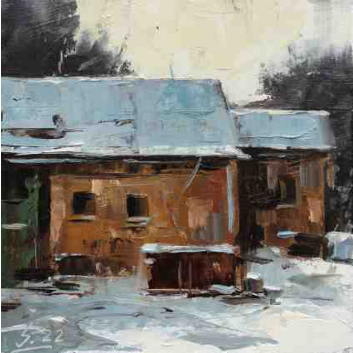
Alter Anbau 2022 | Öl/Kt | 15 x 15 cm