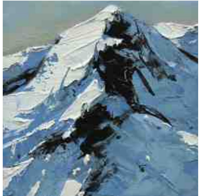
Bergwelten 040 2021 | Öl/Holz | 15 x 15 cm