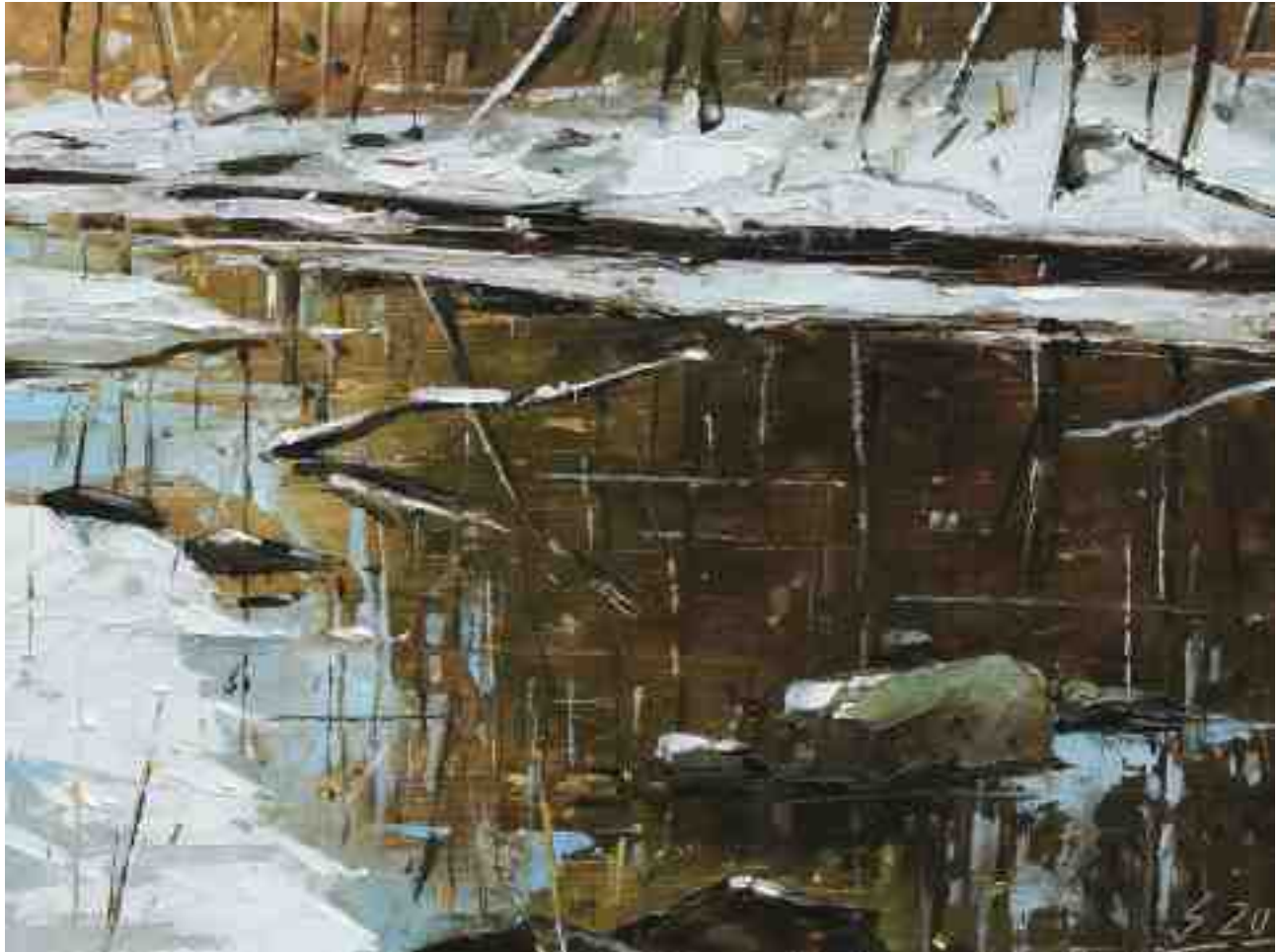
Am Bach IV 2020 | Öl/Holz | 18 x 24 cm