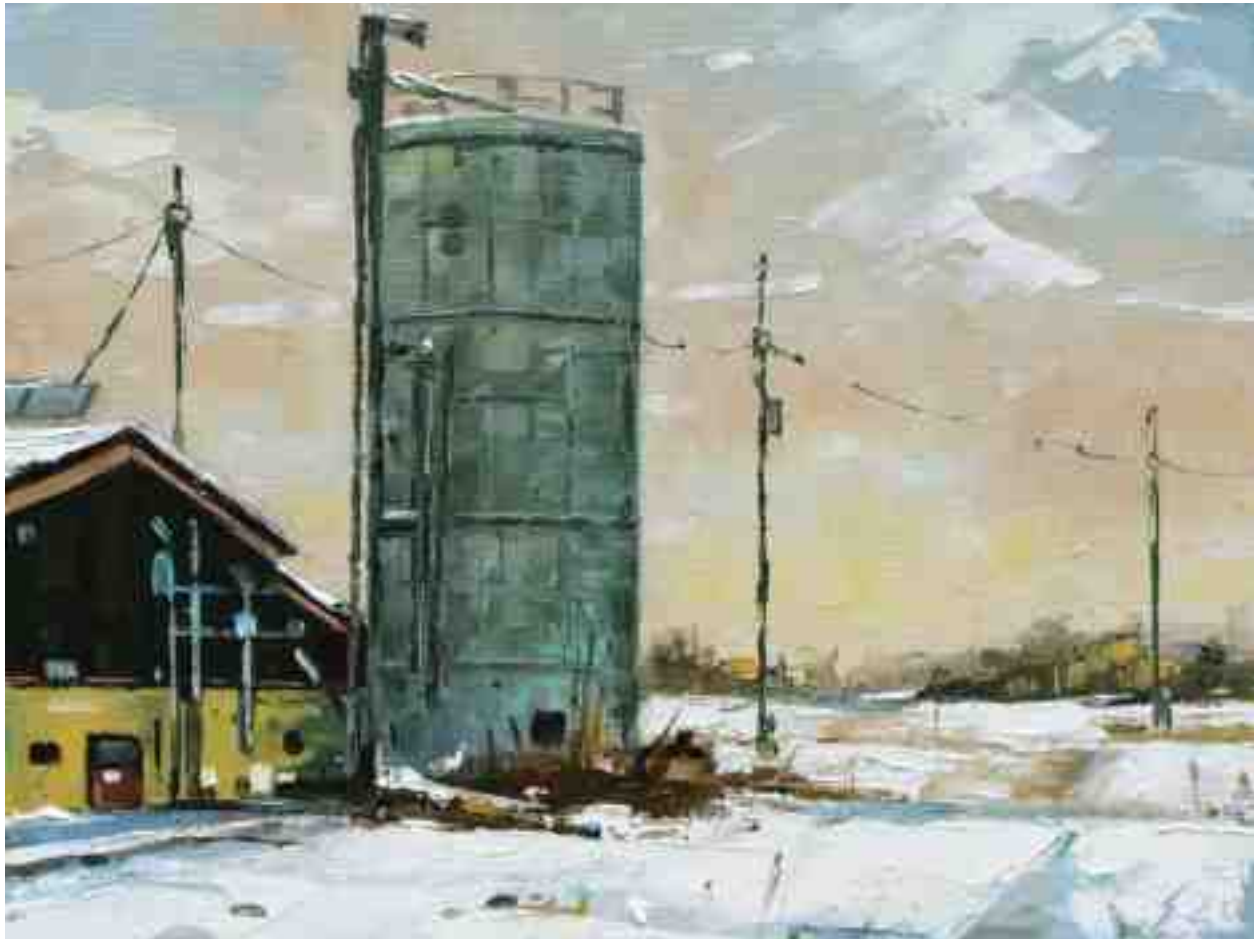
Silo 2020 | Öl/Holz | 18 x 24 cm