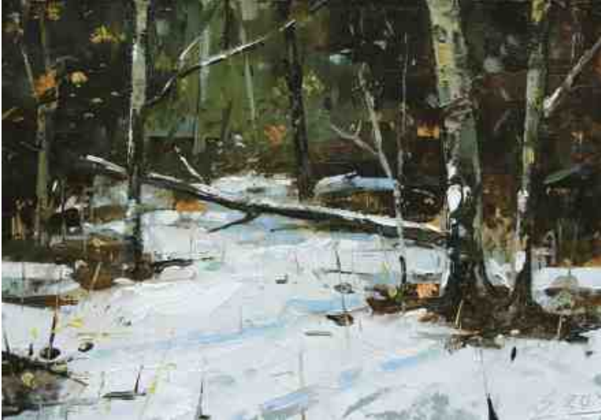
Schnee im Wald VI 2020 | Öl/Kt | 14 x 20 cm