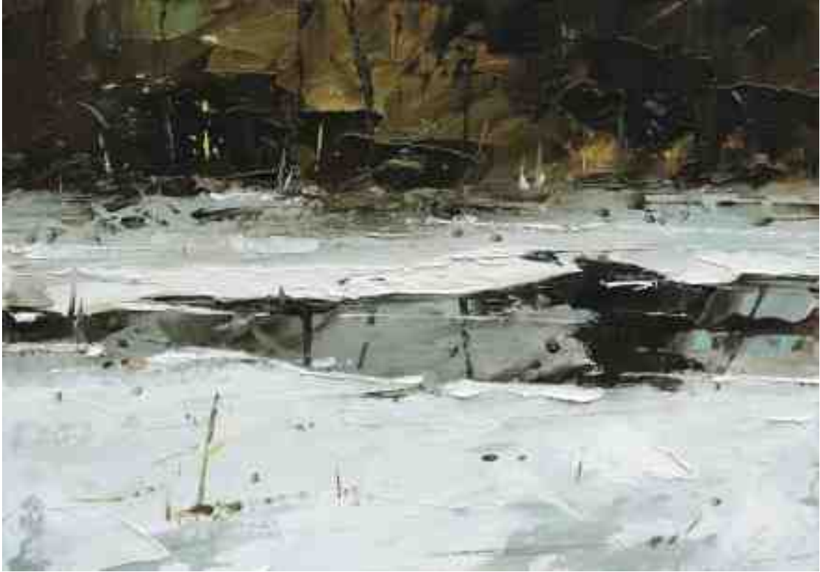
Winterstudie V 2020 | Öl/Kt | 14 x 20 cm