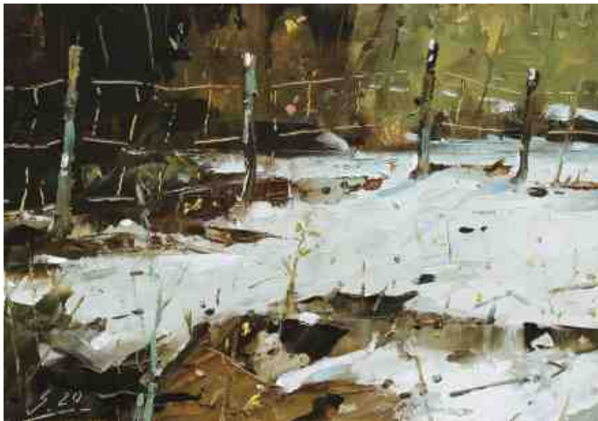
Im Schnee II 2020 | Öl/Kt | 14 x 20 cm