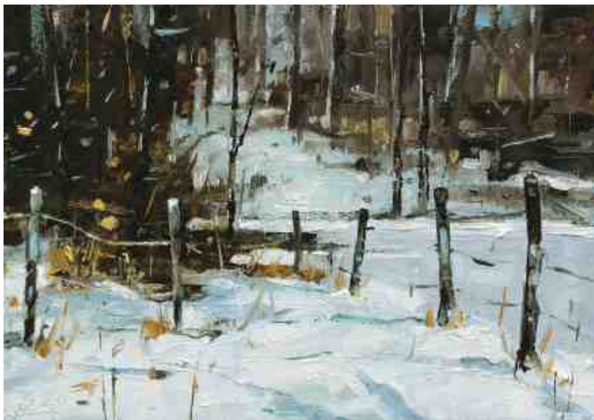
Im Wald II 2020 | Öl/Kt | 14 x 20 cm