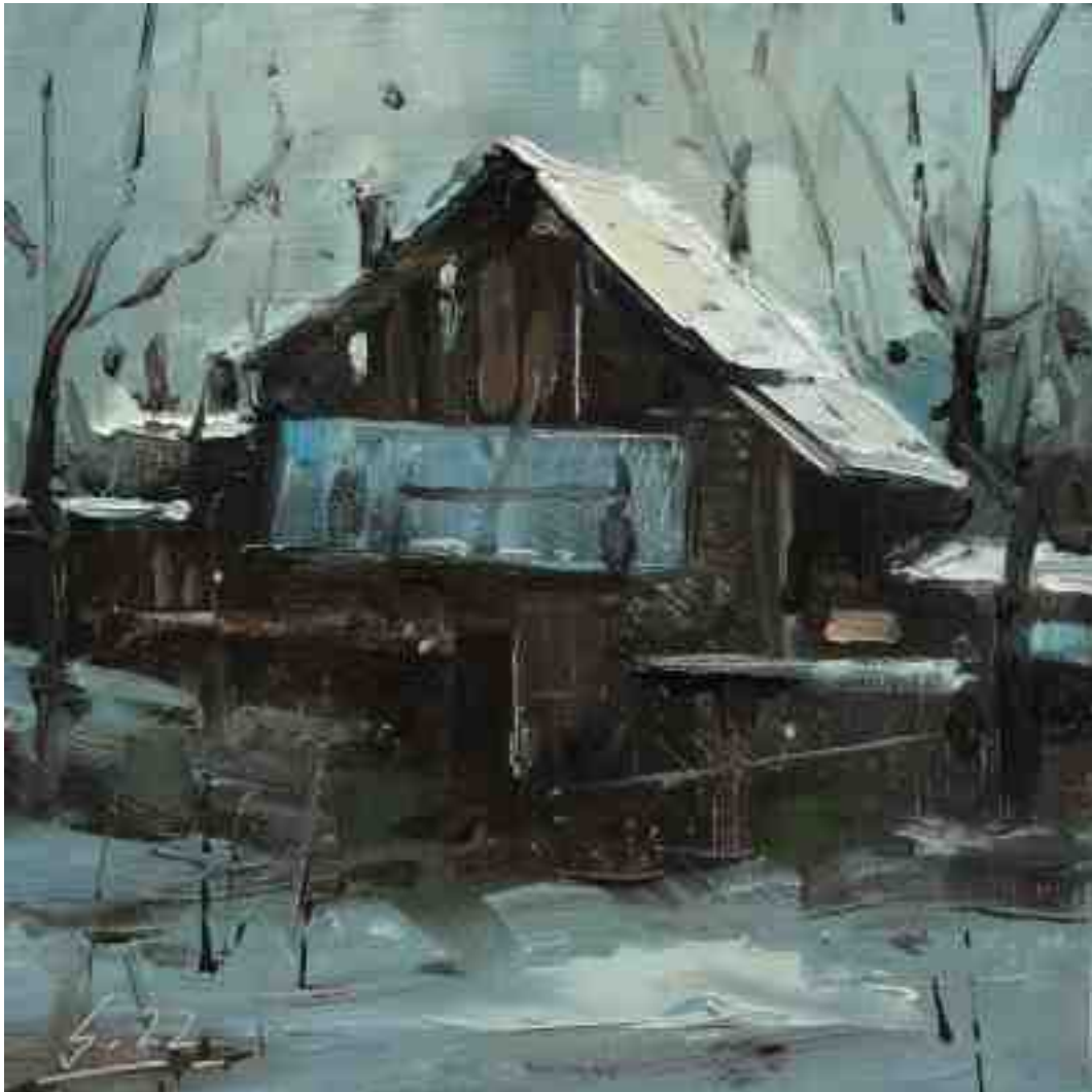
Nachts 2022 | Öl/Holz | 15 x 15 cm