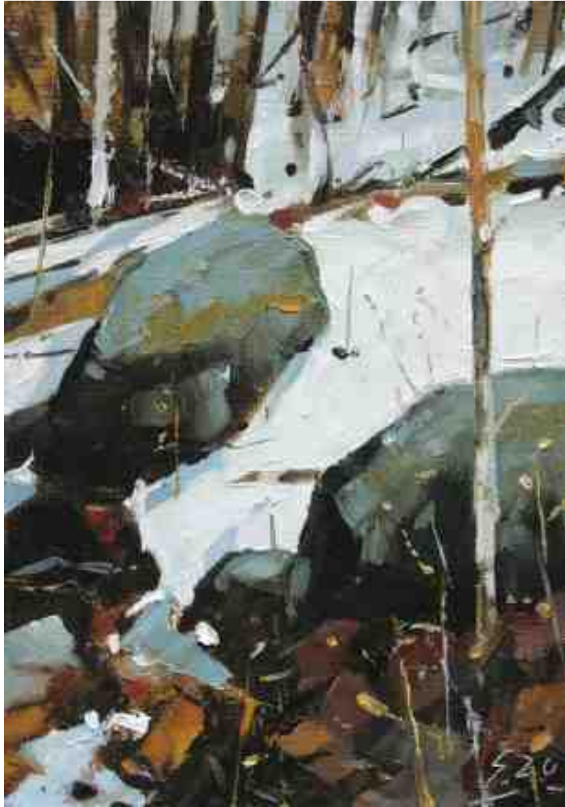
Steine am Hang II 2020 | Öl/Lw/Holz | 20 x 14 cm