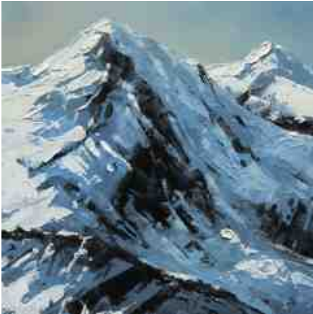
Bergwelten 029 2021 | Öl/Holz | 20 x 20 cm