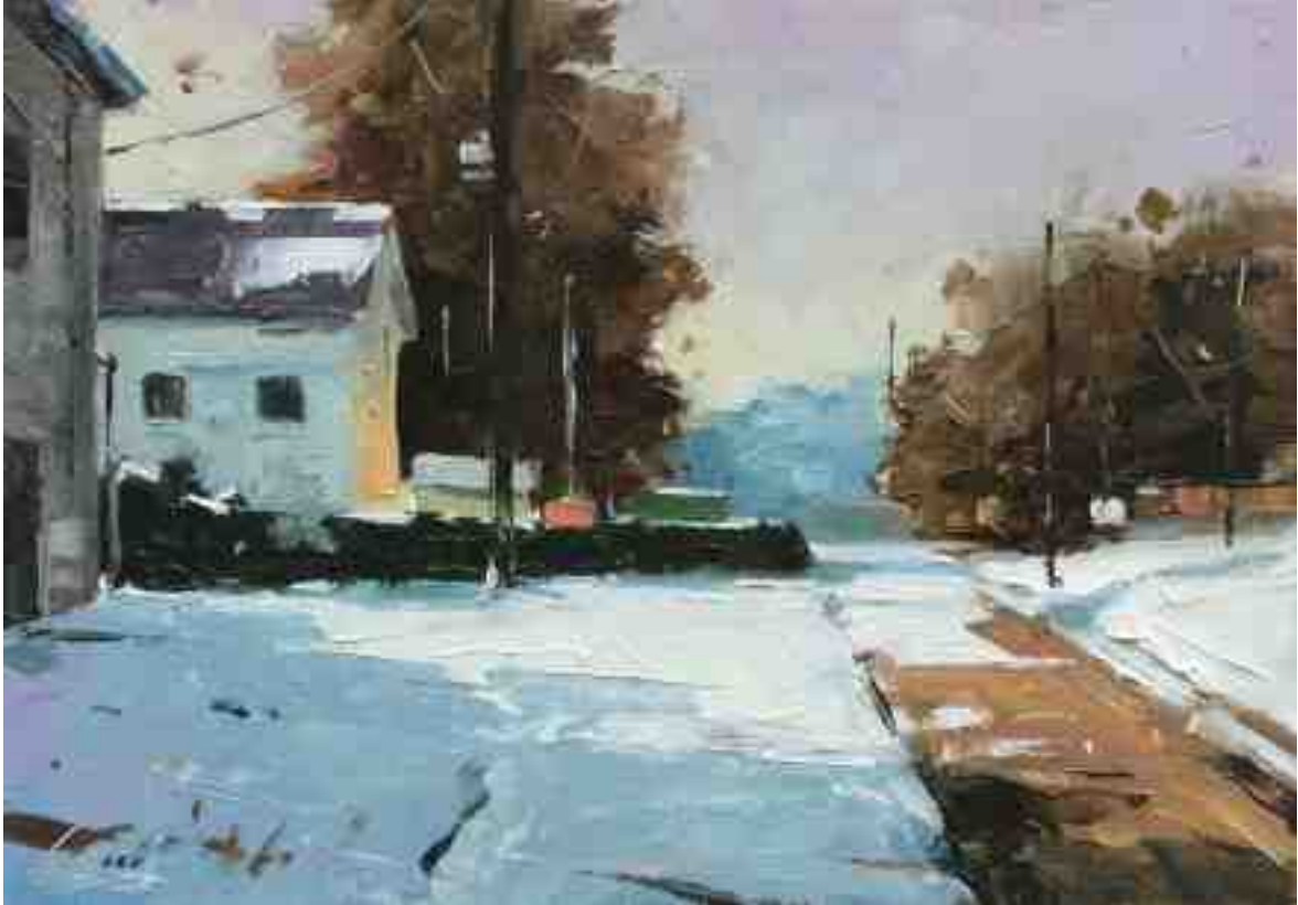
Am Dorfrand 2020 | Öl/Kt | 14 x 20 cm