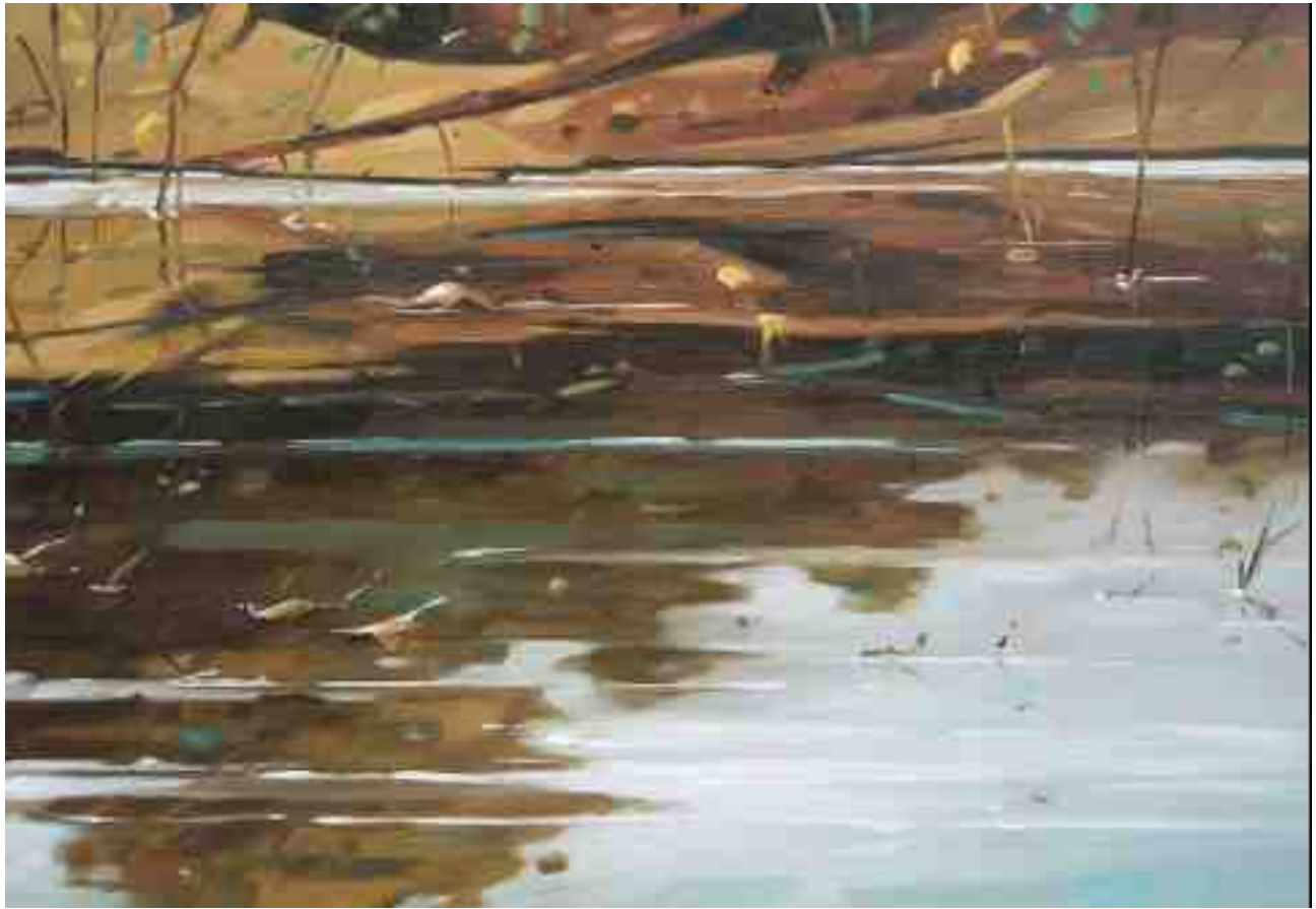
Winterszene Spiegelungen 2011 | Öl/Holz | 36 x 52 cm