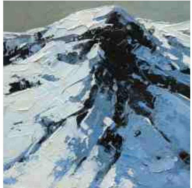
Bergwelten 026 2021 | Öl/Holz | 15 x 15 cm