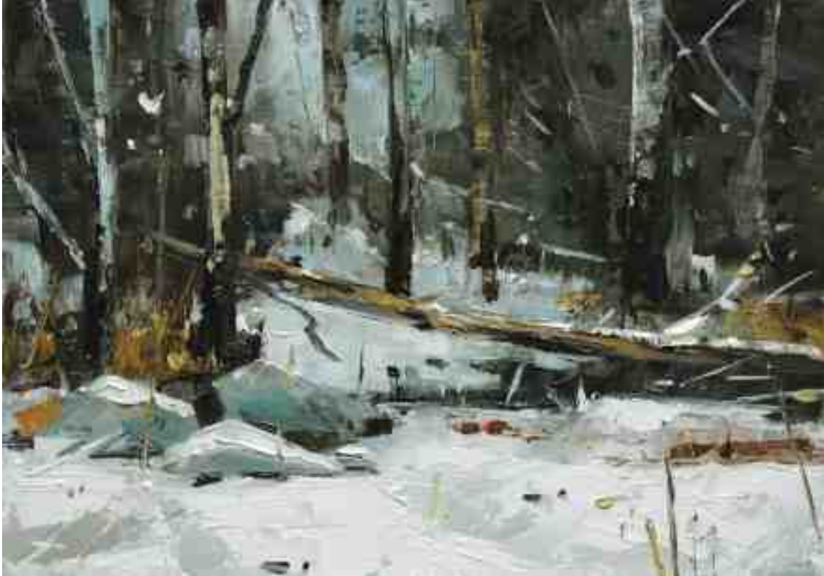
Schnee im Wald IV 2020 | Öl/Holz | 14 x 20 cm