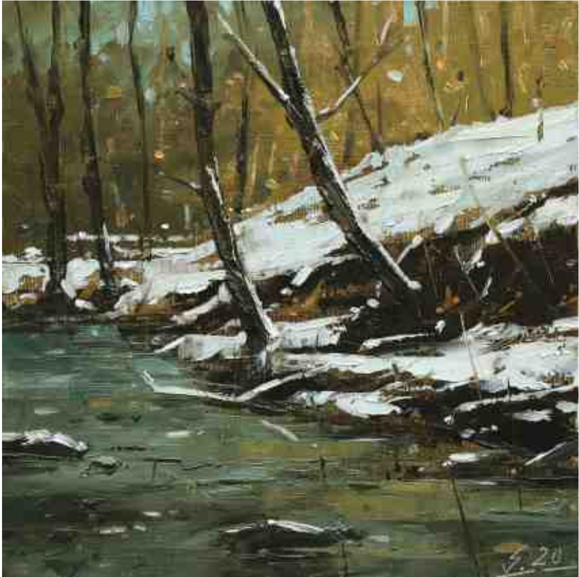
Am Bach II 2020 | Öl/Holz | 18 x 18 cm