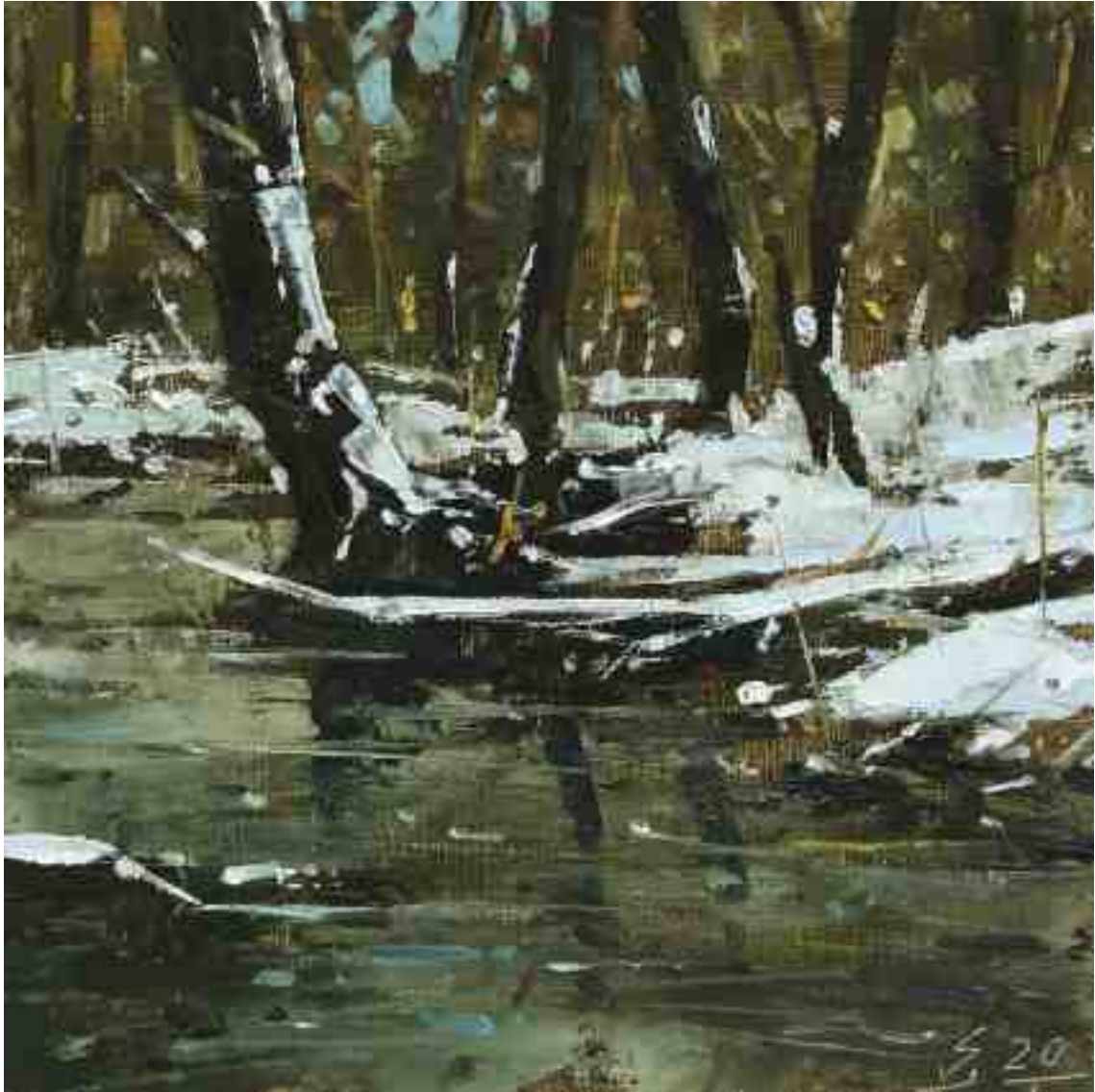
Am Bach I 2020 | Öl/Holz | 18 x 18 cm