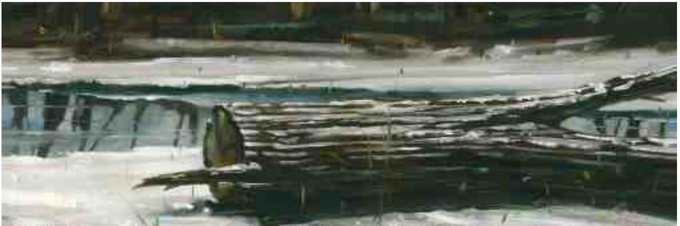
Winterszenen XII 2010 | Öl/Holz | 10 x 30 cm