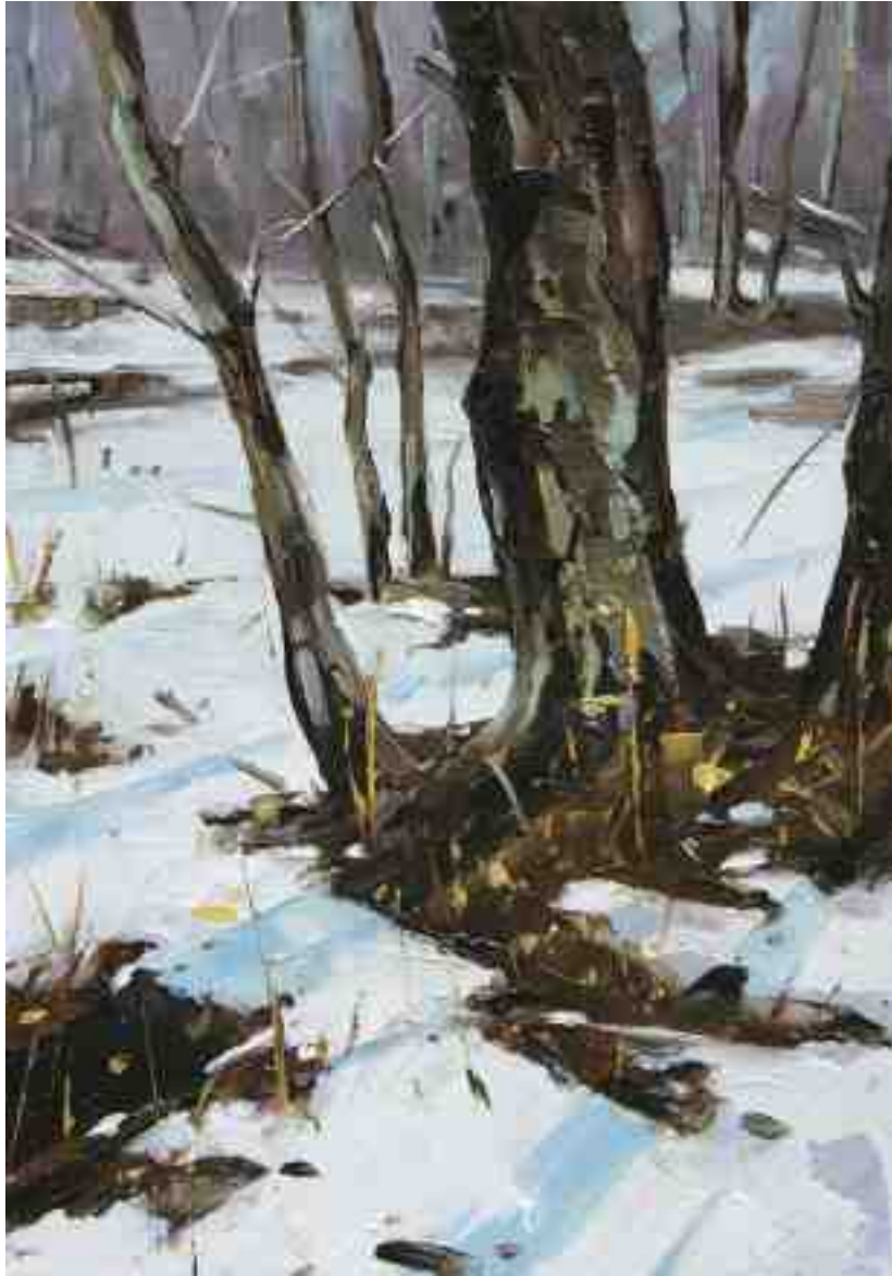
Lichtspiel I 2020 | Öl/Kt | 20 x 14 cm