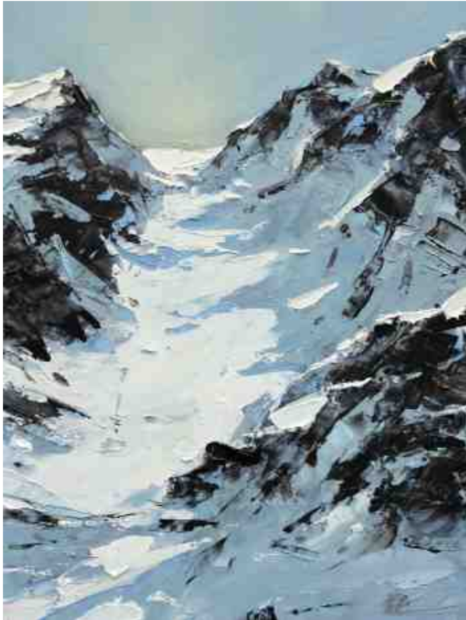
Bergwelten 033 2021 | Öl/Holz | 24 x 18 cm