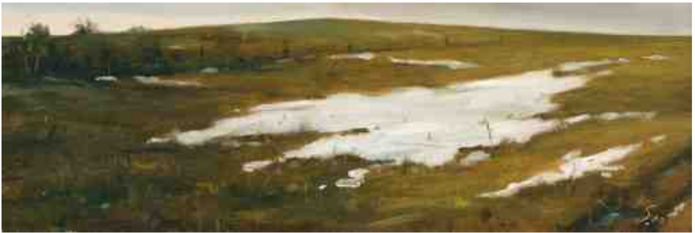
Winterszenen X 2010 | Öl/Holz | 10 x 30 cm