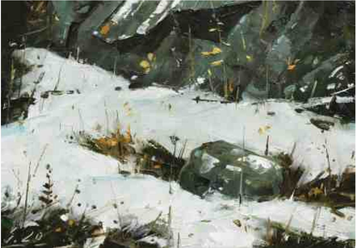
Im Wald I 2020 | Öl/Kt | 14 x 20 cm