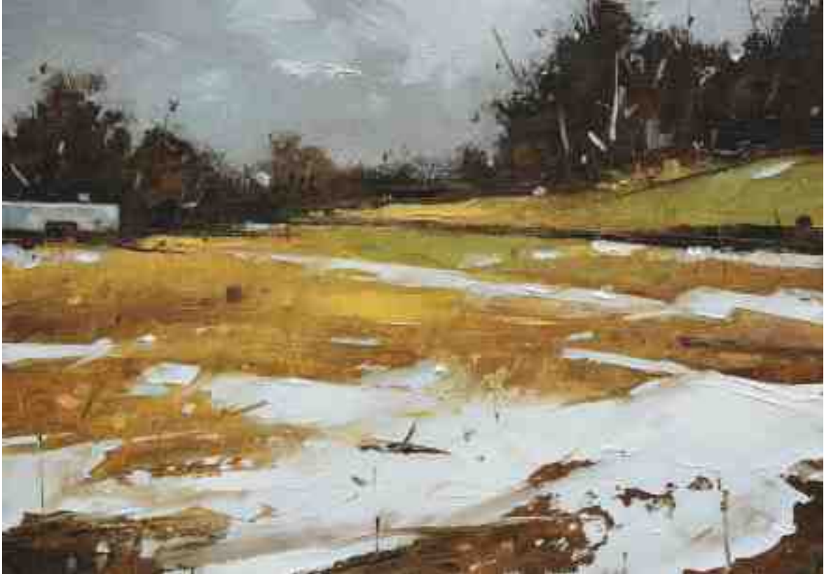
Studie Landschaft 080 2019 | Öl/Kt | 14 x 20 cm