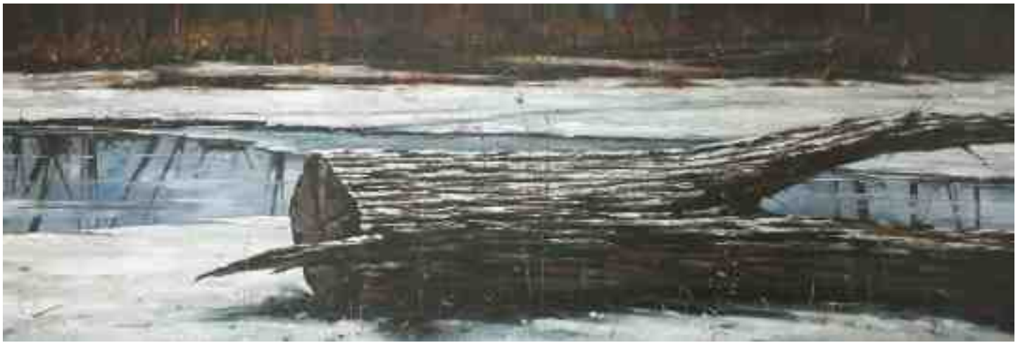
Frost 2013 | Öl/Lw. | 50 x 150 cm