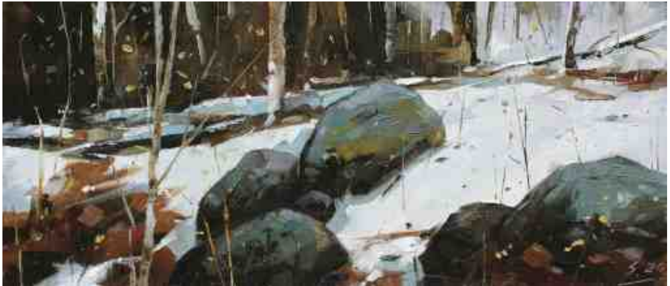
Steine am Hang III 2020 | Öl/Lw/Holz | 15 x 35 cm