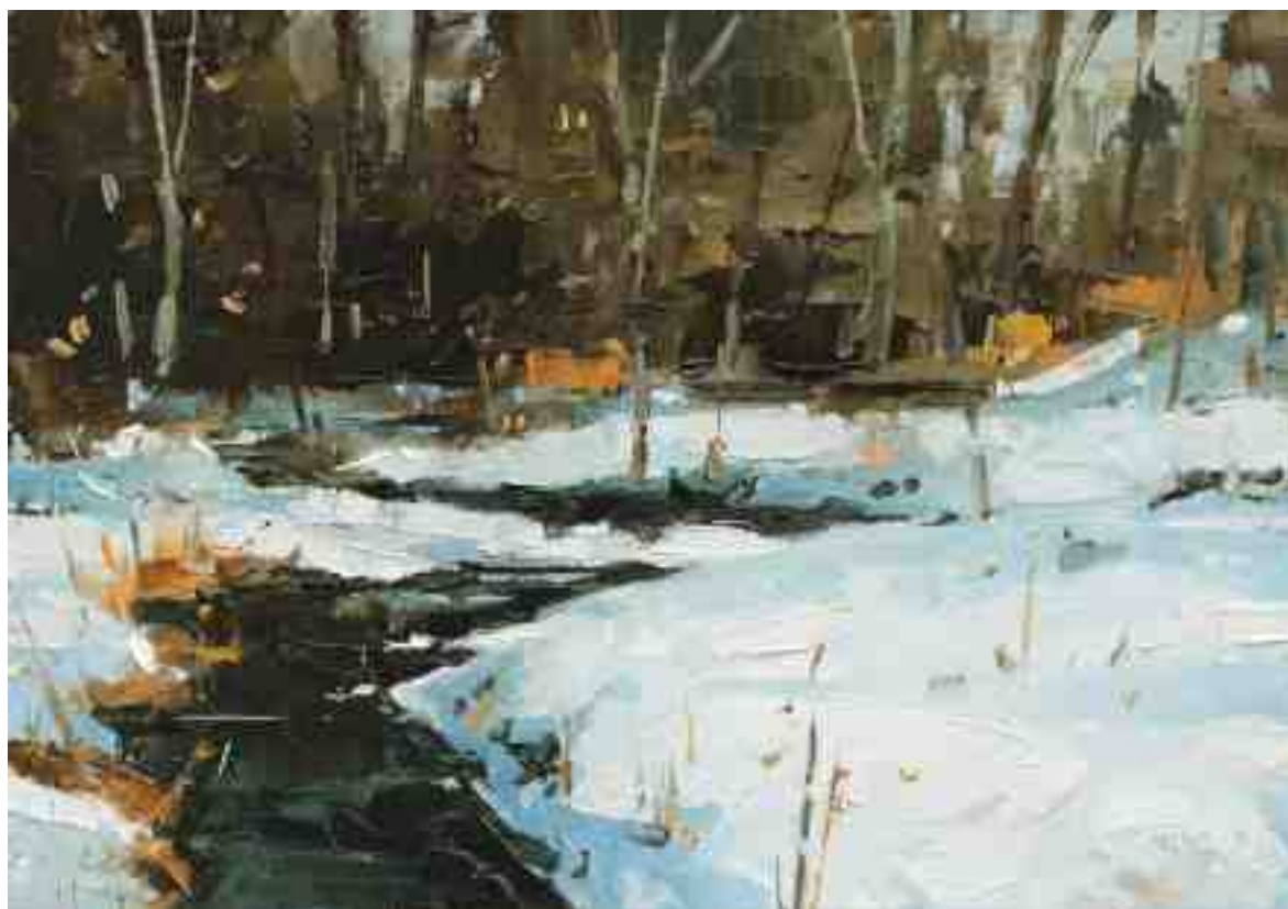
Am Bach VII 2020 | Öl/Kt | 14 x 20 cm