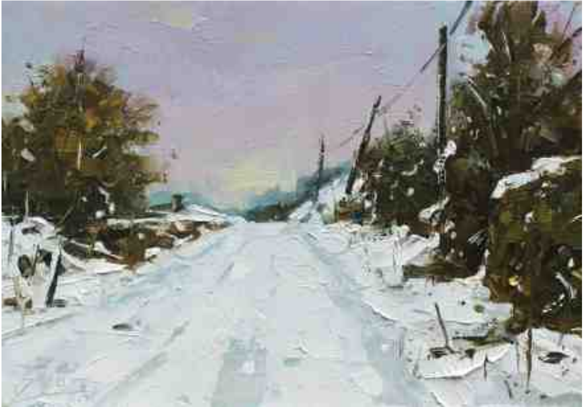
Straße im Schnee 2020 | Öl/Kt | 14 x 20 cm