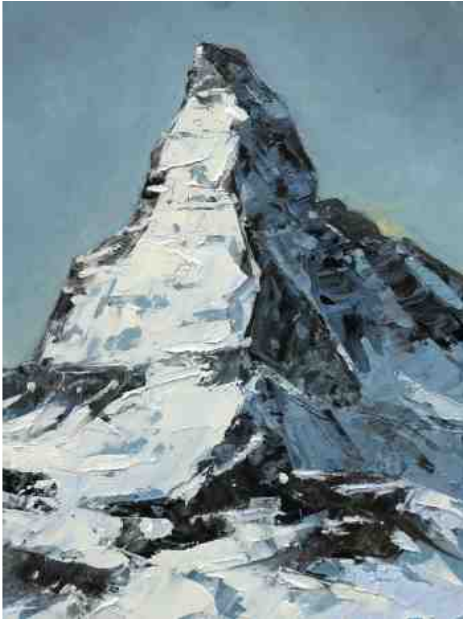
Bergwelten 023 2021 | Öl/Holz | 24 x 18 cm