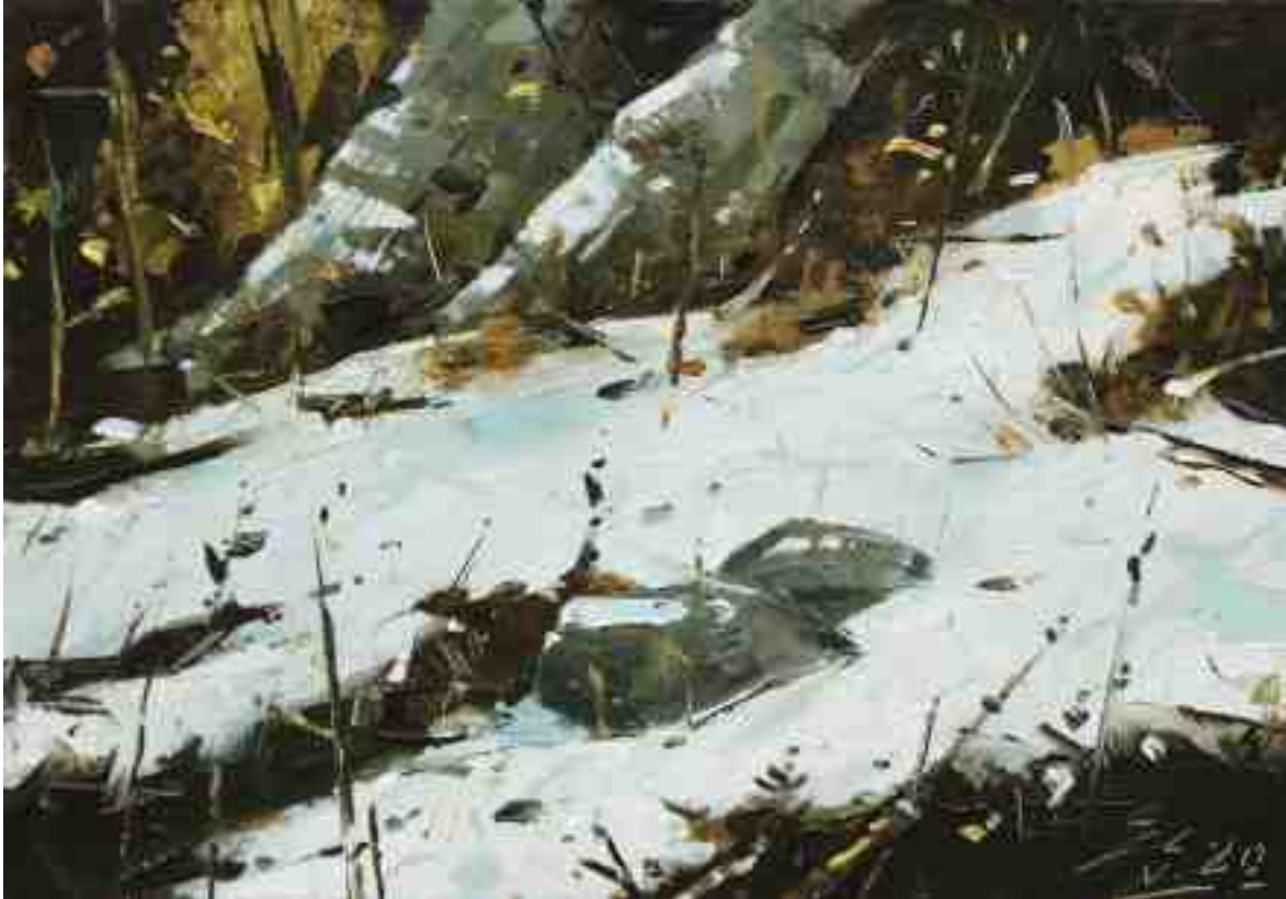
Im Schnee I 2020 | Öl/Kt | 14 x 20 cm