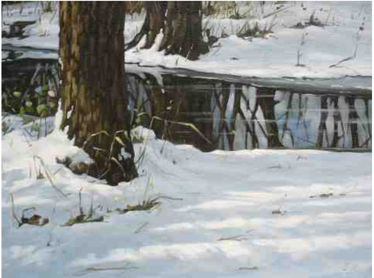
Winterimpression 2010 | Öl/Lw. | 45 x 60 cm