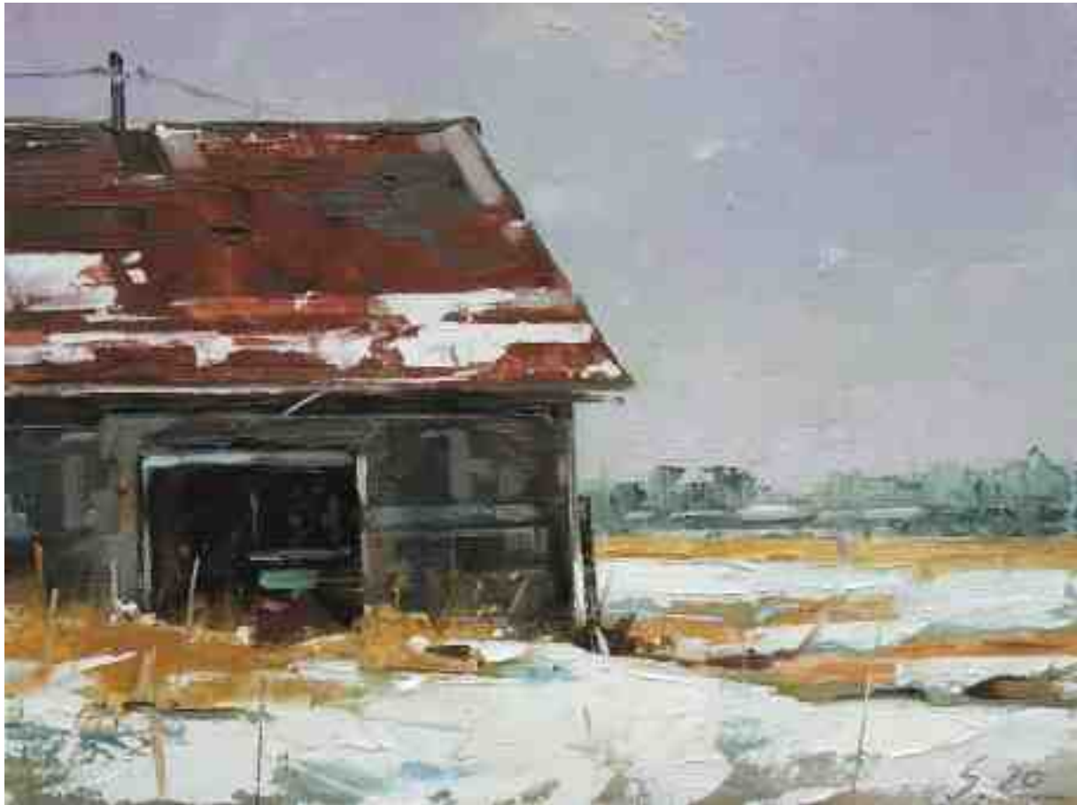
Alte Scheune im Winter II 2020 | Öl/Holz | 18 x 24 cm