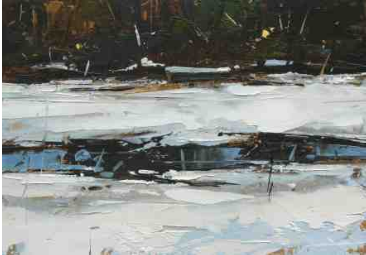
Studie Landschaft 090 2019 | Öl/Kt | 14 x 20 cm