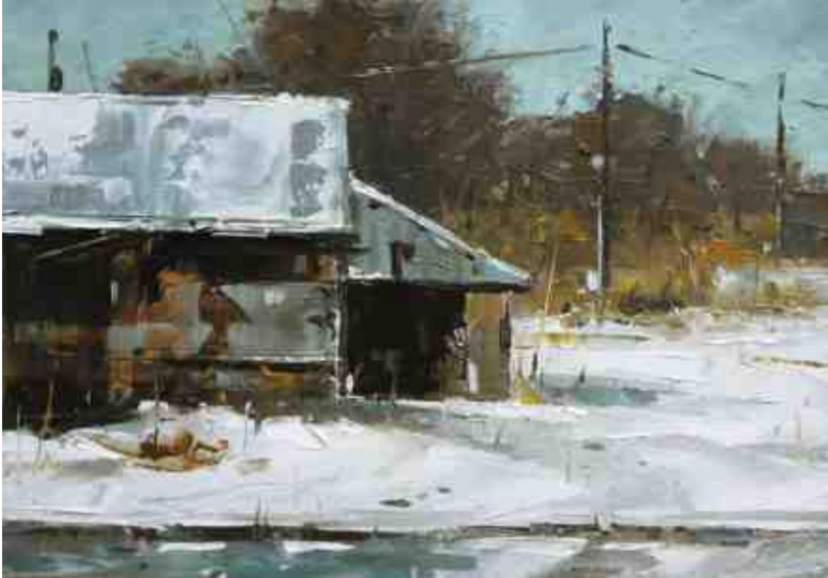
Scheune im Winter I 2020 | Öl/Kt | 14 x 20 cm