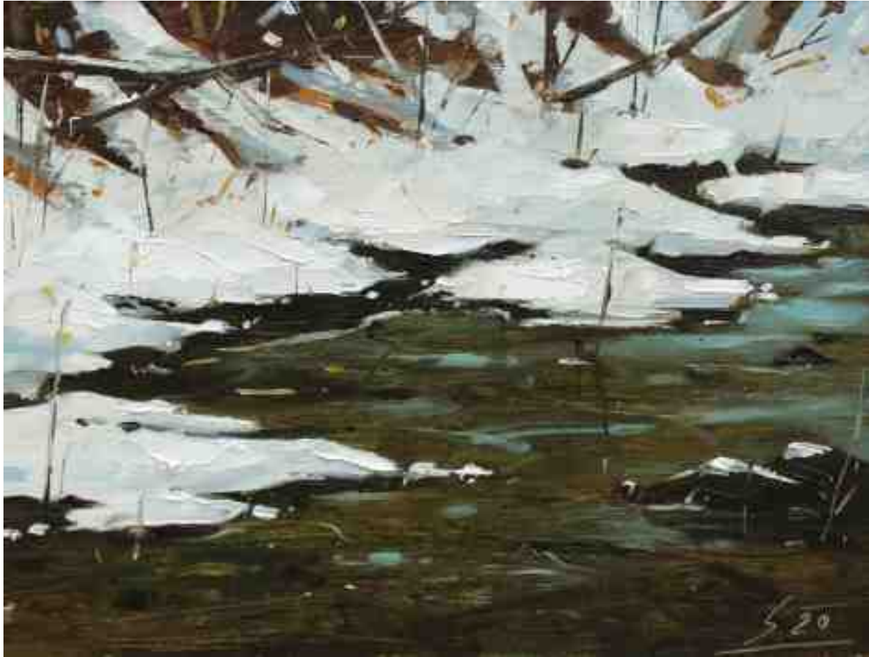
Eis und Schnee I 2020 | Öl/Holz | 19 x 25 cm