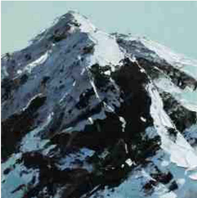
Bergwelten 002 2021 | Öl/Kt | 20 x 20 cm