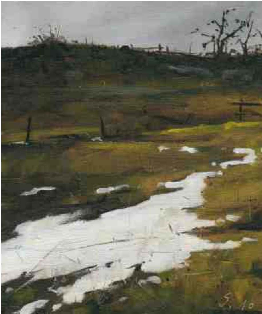
Winterszenen II 2010 | Öl/Holz | 15 x 12.5 cm