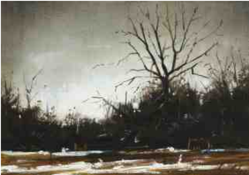
Winter im Januar