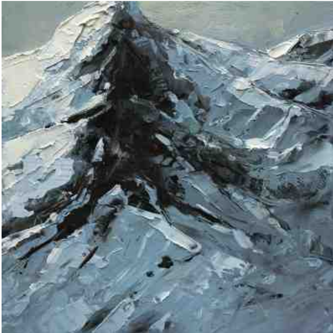
Bergwelten 016 2021 | Öl/Holz | 15 x 15 cm