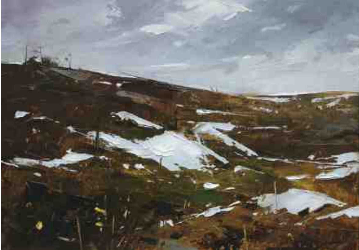
Studie Landschaft 095 2019 | Öl/Kt | 14 x 20 cm