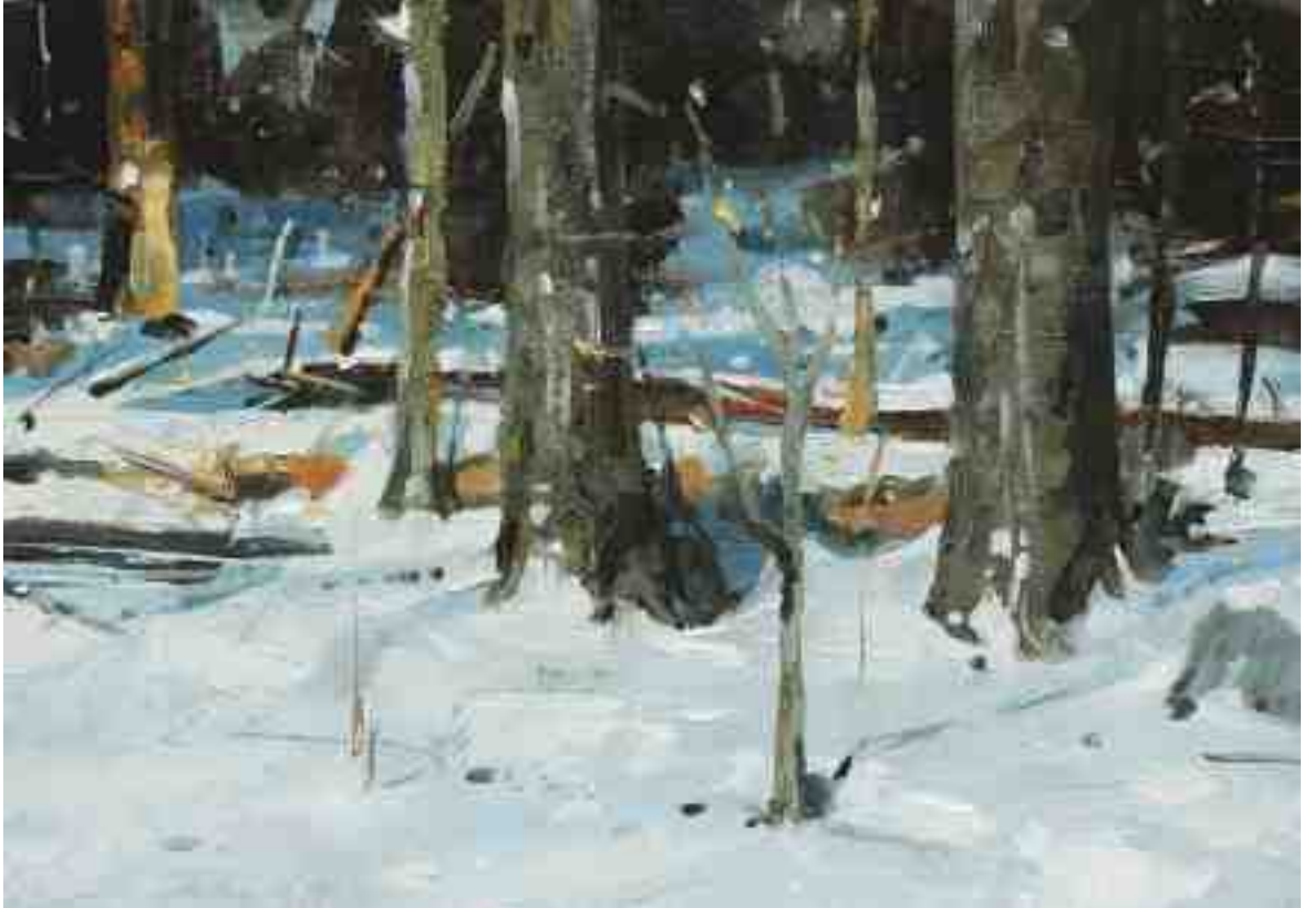
Lichtspiel II 2020 | Öl/Kt | 14 x 20 cm