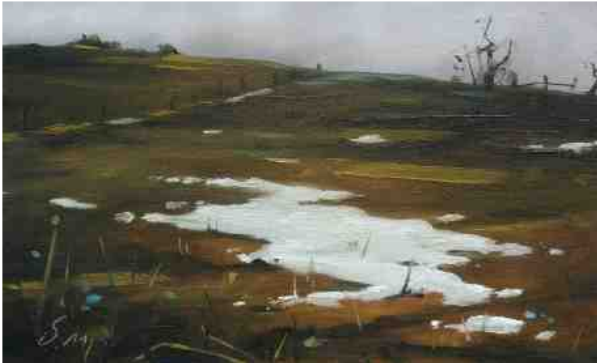
Winterszenen XXVII 2014 | Öl/Holz | 11 x 18 cm