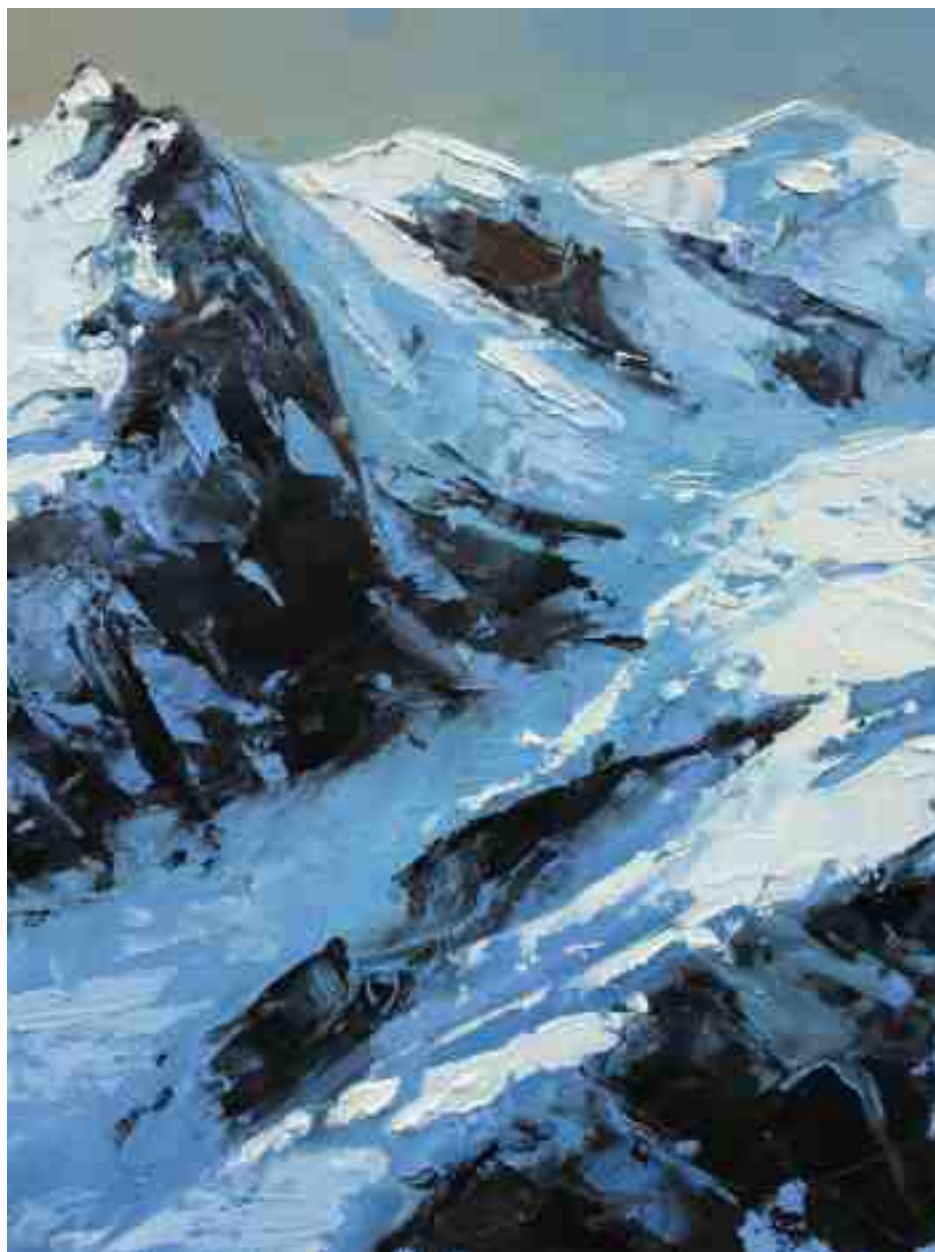
Bergwelten 028 2021 | Öl/Holz | 24 x 18 cm