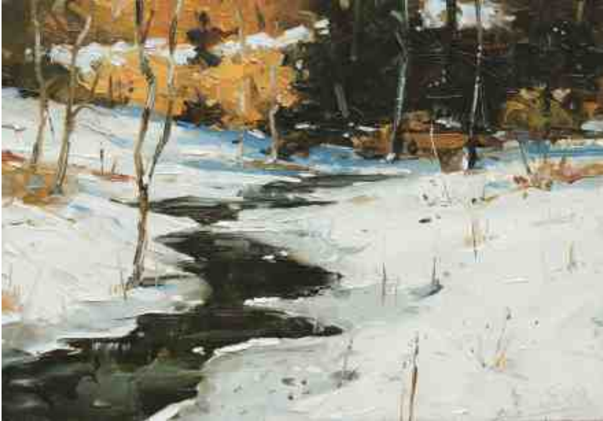
Am Bach VIII 2020 | Öl/Kt | 14 x 20 cm