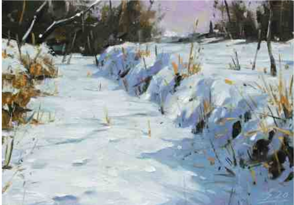
Im Sonnenlicht IV 2020 | Öl/Kt | 14 x 20 cm