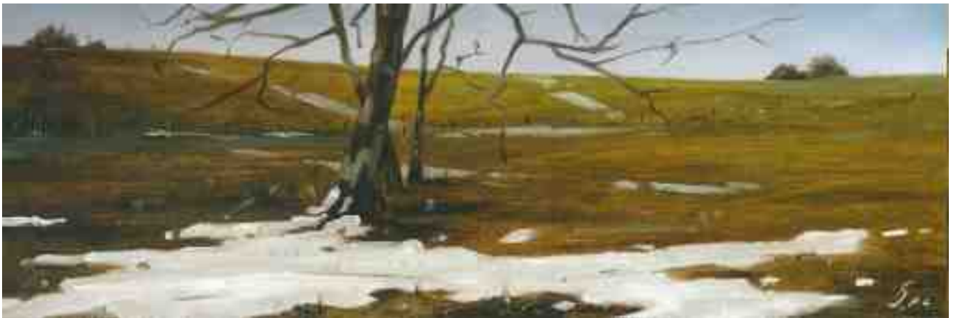
Winterszenen XI 2010 | Öl/Holz | 10 x 30 cm