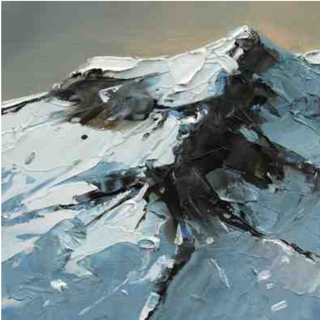
Bergwelten 015 2021 | Öl/Holz | 15 x 15 cm