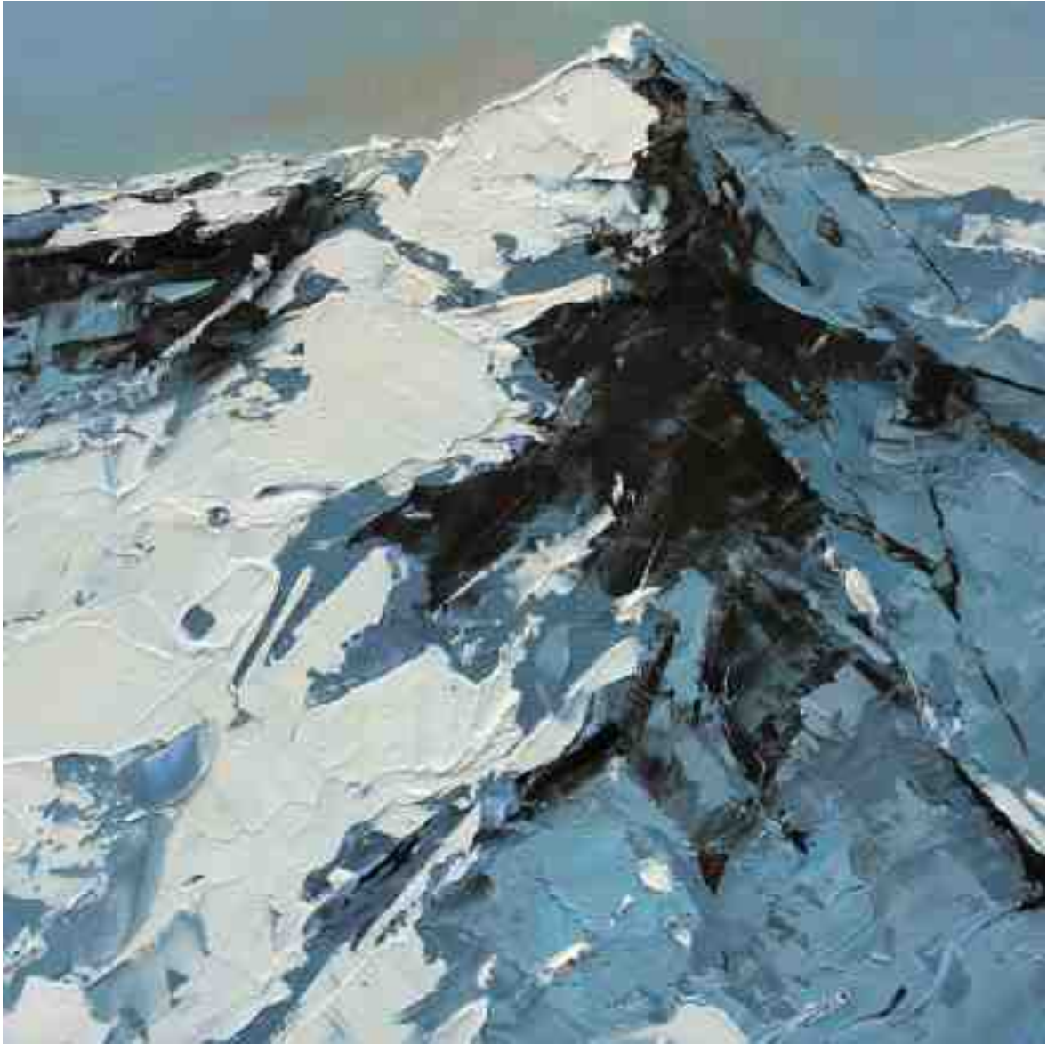
Bergwelten 035 2021 | Öl/Holz | 20 x 20 cm