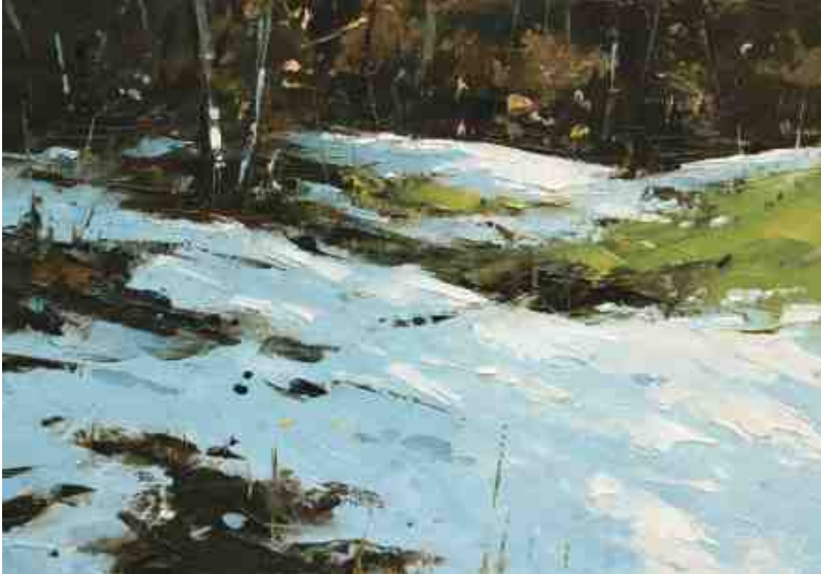
Schneereste II 2020 | Öl/Kt | 14 x 20 cm