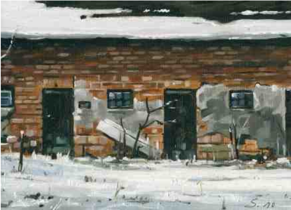
Alter Stall im Winter 2010 | Öl/Lw./Holz | 13 x 18 cm