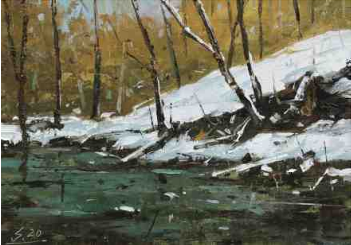
Am Bach VI 2020 | Öl/Kt | 14 x 20 cm