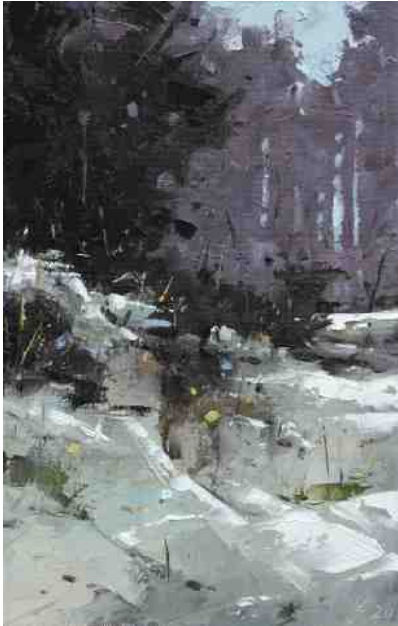
Winterreste I 2020 | Öl/Kt | 23,6 x 15 cm