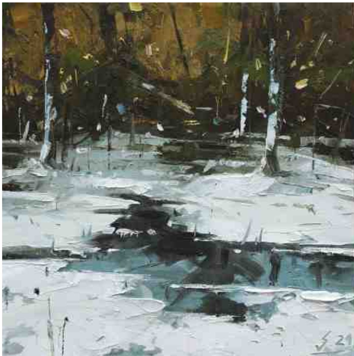
Eisloch II 2021 | Öl/Kt | 20 x 20 cm