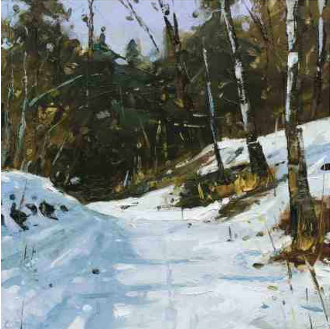
Waldweg 2020 | Öl/Kt | 18 x 18 cm