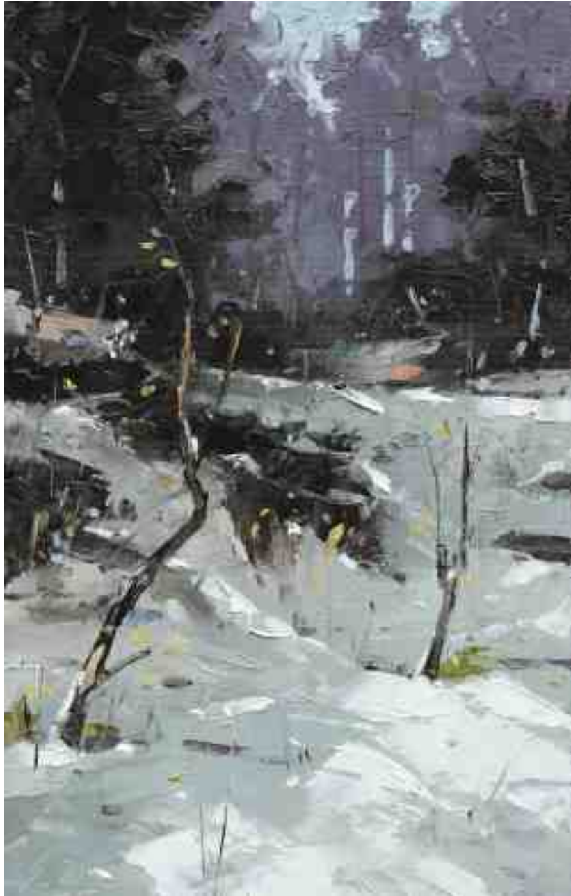
Winterreste II 2020 | Öl/Kt | 23,6 x 15 cm