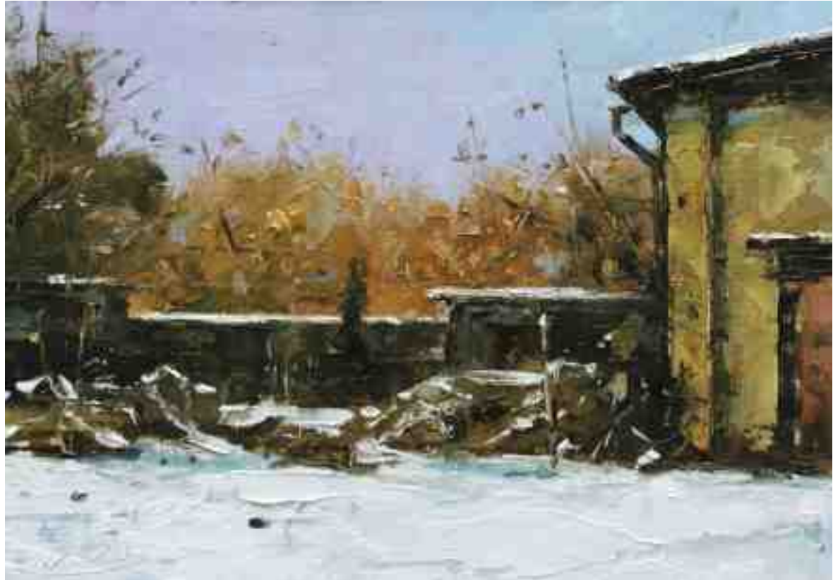
Im Hof 2020 | Öl/Kt | 14 x 20 cm