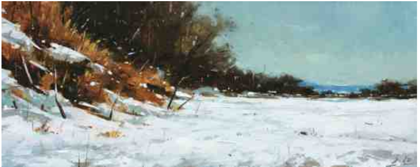
Schnee bei Kassel I 2020 | Öl/Holz | 18 x 45 cm