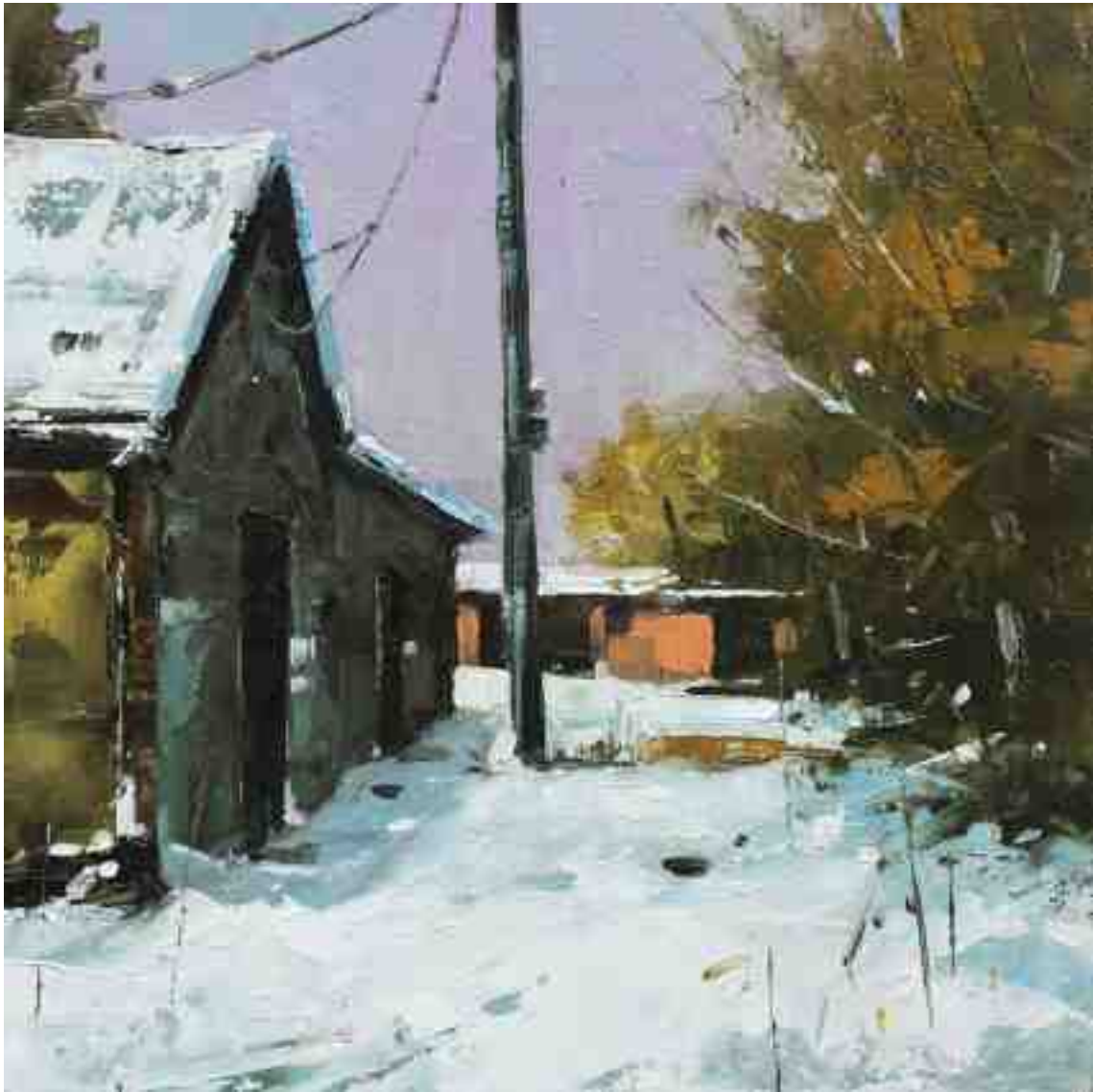
Hinterhof II 2020 | Öl/Kt | 18 x 18 cm