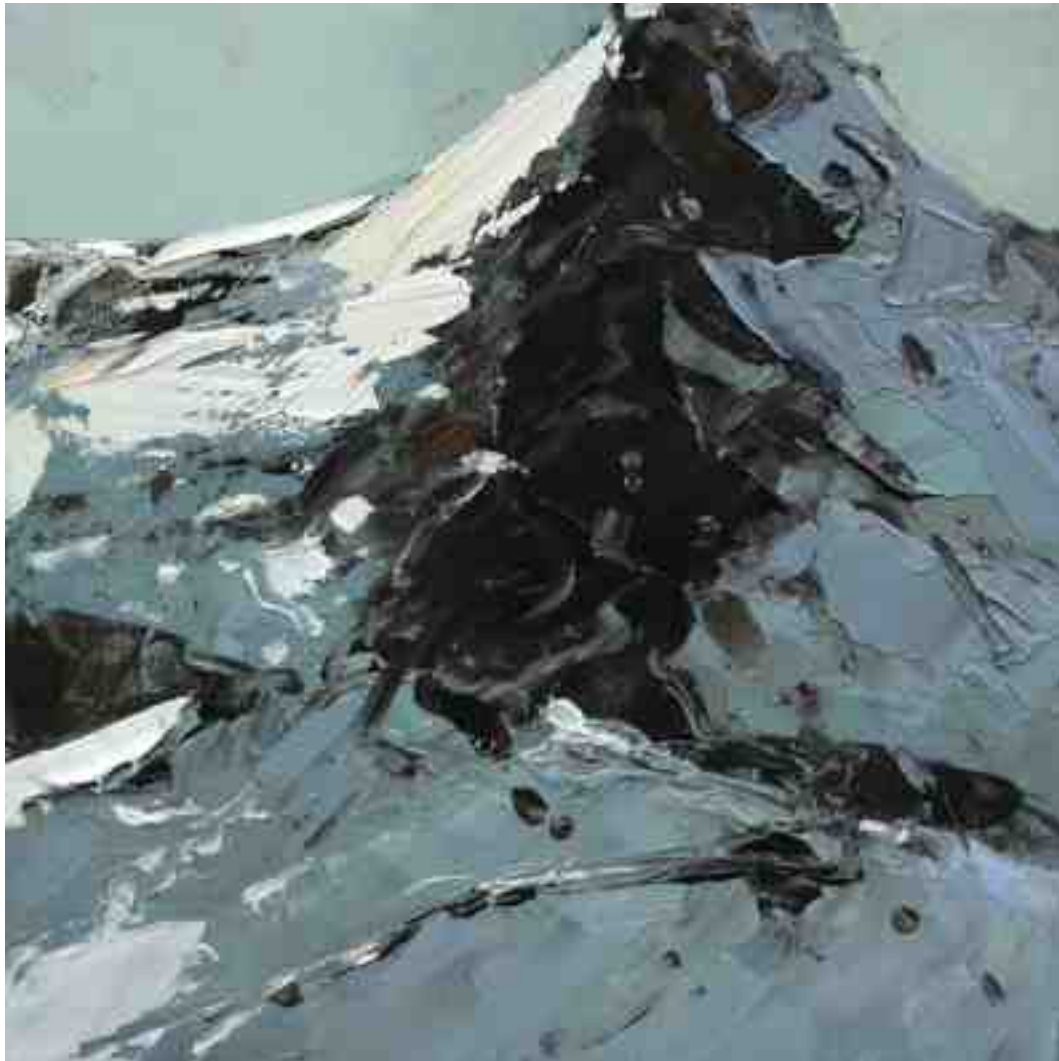
Bergwelten 014 2021 | Öl/Holz | 15 x 15 cm