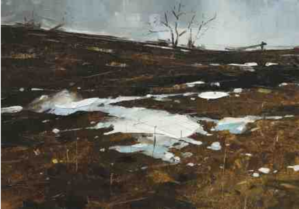
Studie Landschaft 081 2019 | Öl/Kt | 14 x 20 cm