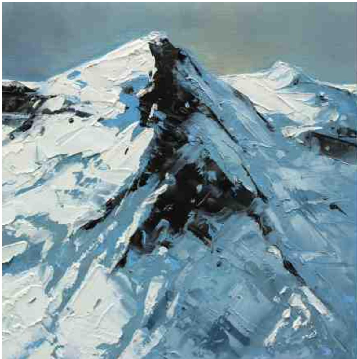
Bergwelten 032 2021 | Öl/Holz | 20 x 20 cm