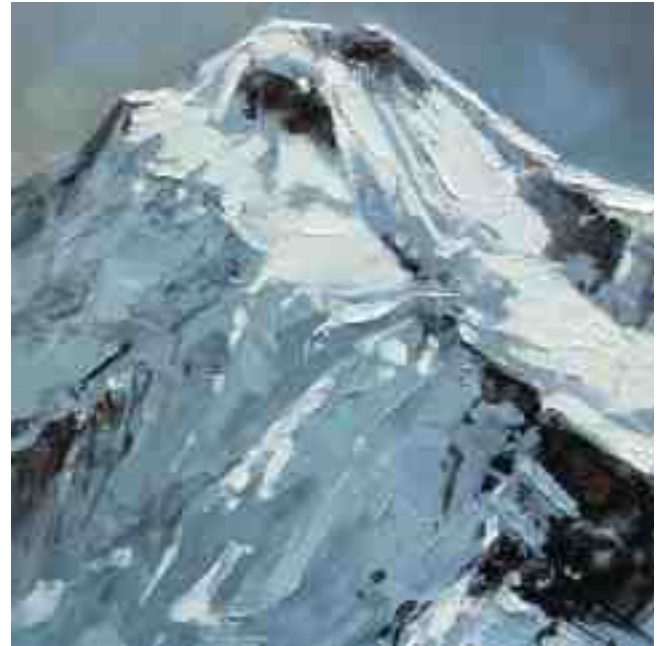
Bergwelten 030 2021 | Öl/Holz | 20 x 20 cm