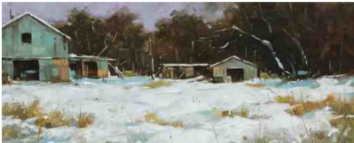
Am Waldrand 2020 | Öl/Holz | 18 x 45 cm