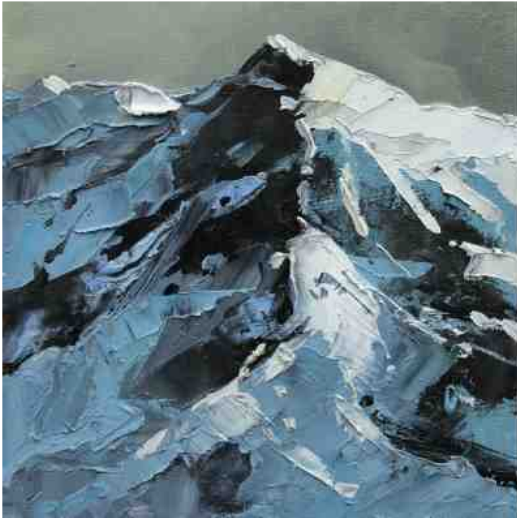
Bergwelten 010 2021 | Öl/Holz | 15 x 15 cm