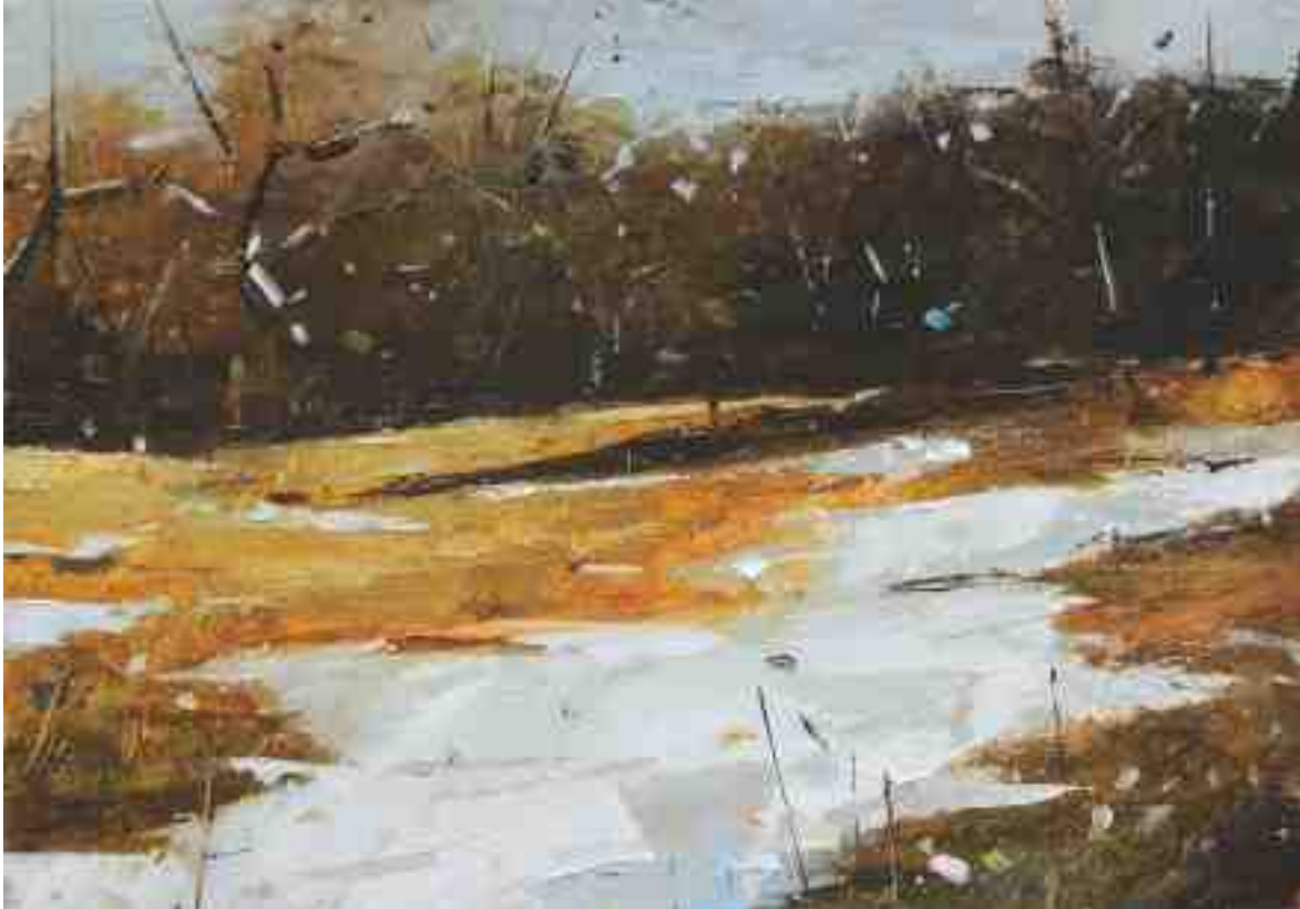
Studie Landschaft 078 2019 | Öl/Kt | 14 x 20 cm