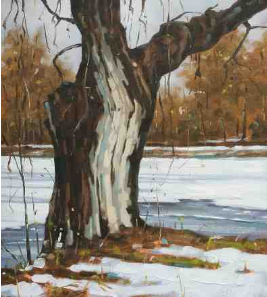
Winter bei Kassel III 2011 | Öl/Holz | 40 x 36 cm