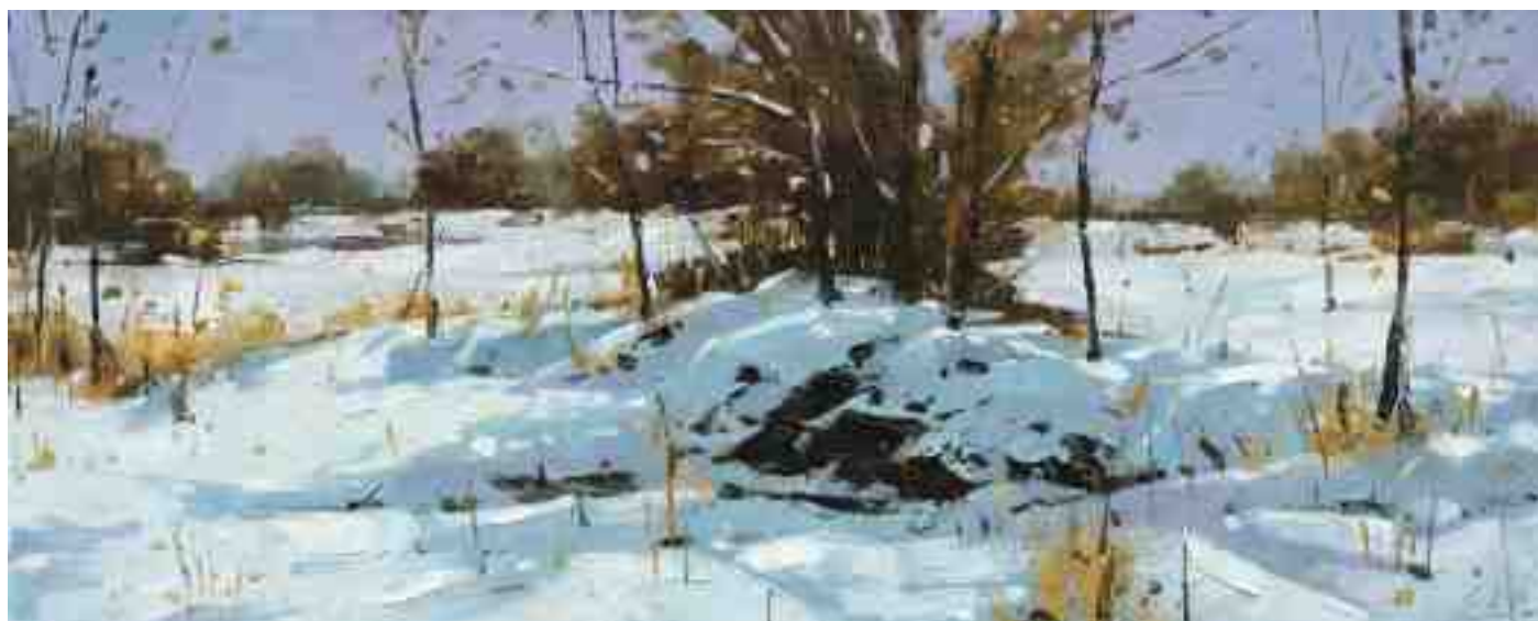
Kassel Dönche V 2020 | Öl/Holz | 18 x 45 cm