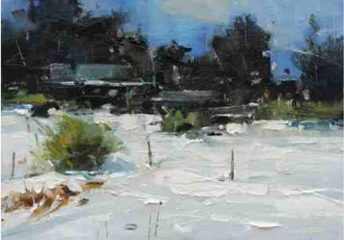
Winterstudie IV 2022 | Öl/Kt | 14 x 20 cm