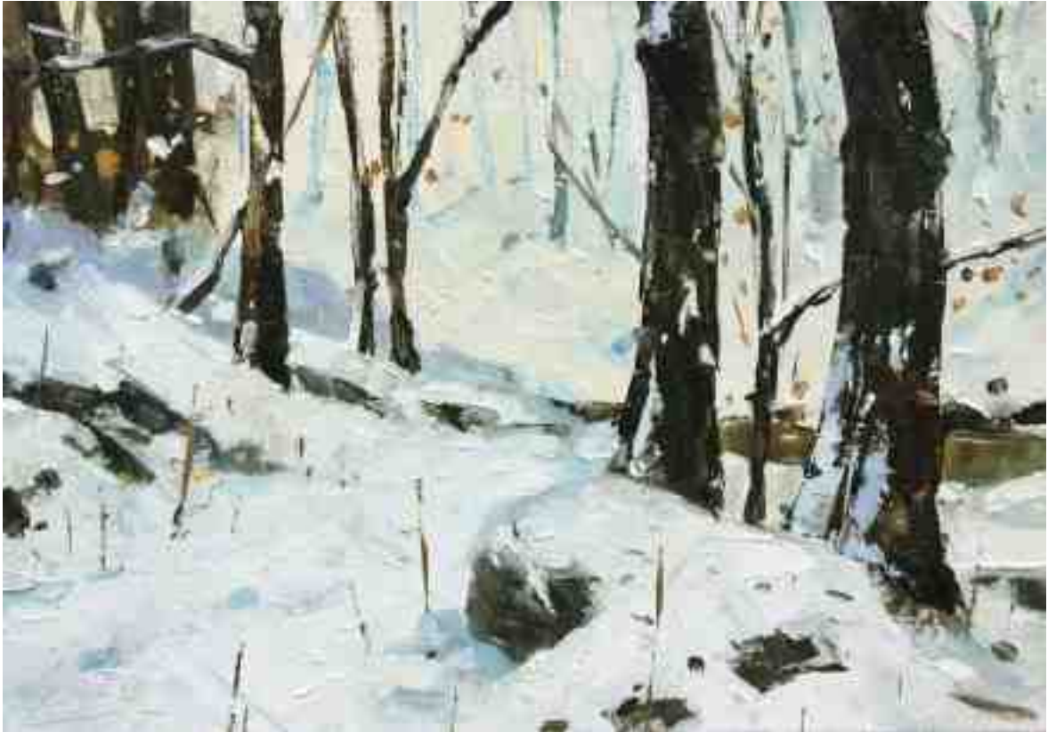
Winterlicht 2020 | Öl/Kt | 14 x 20 cm