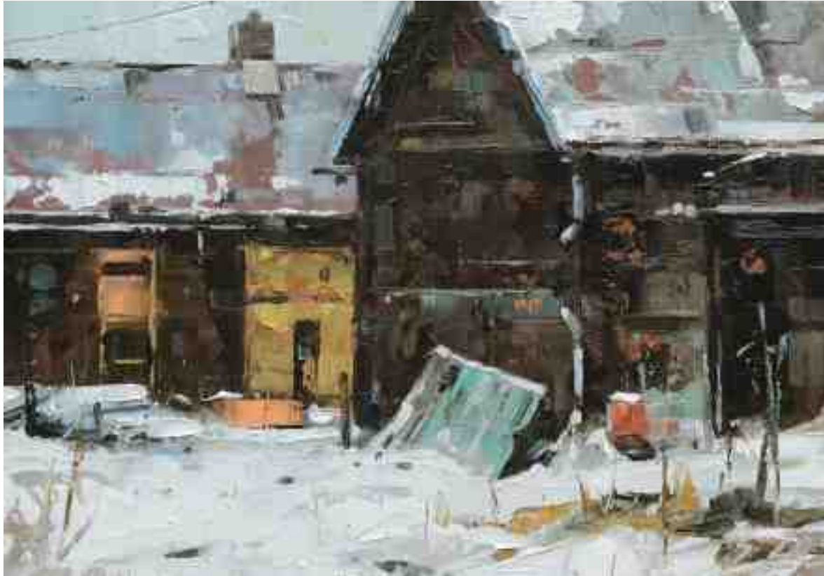
Alter Hof 2020 | Öl/Kt | 14 x 20 cm