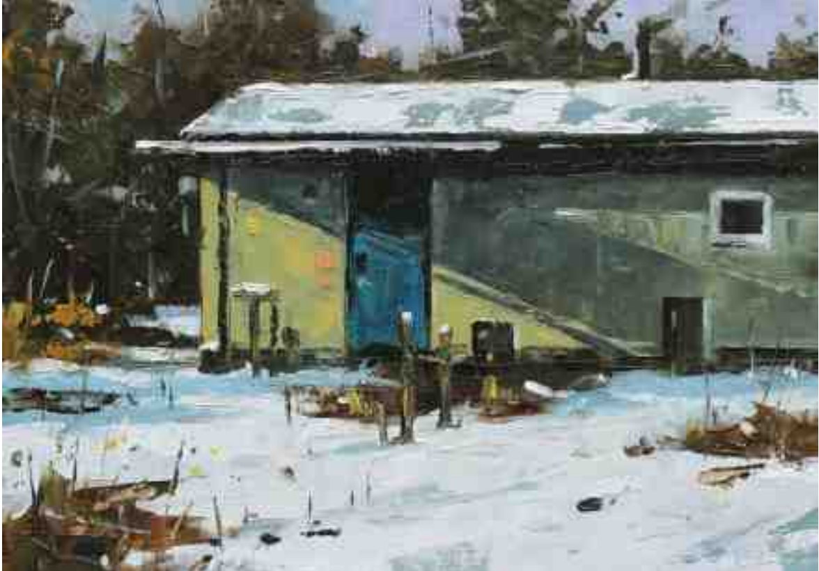
Kleingarten 2020 | Öl/Kt | 14 x 20 cm