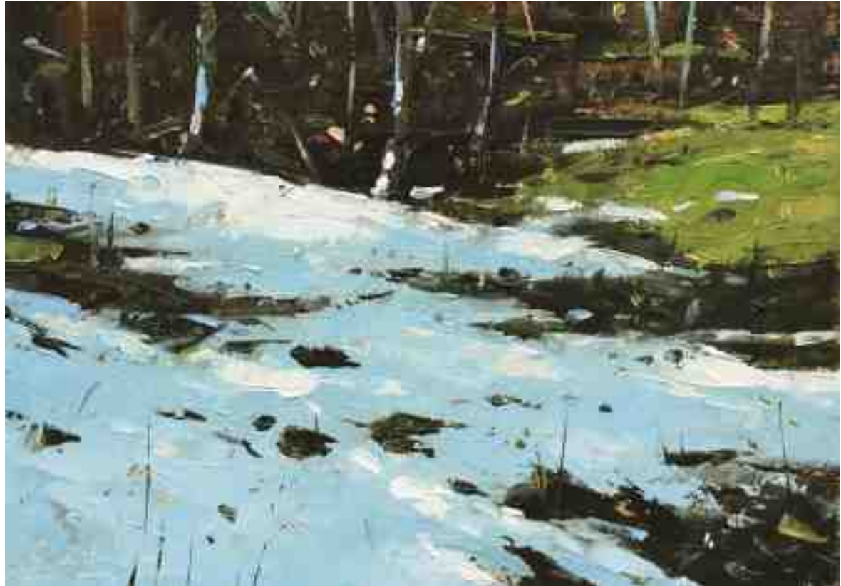
Schneereste I 2020 | Öl/Kt | 14 x 20 cm