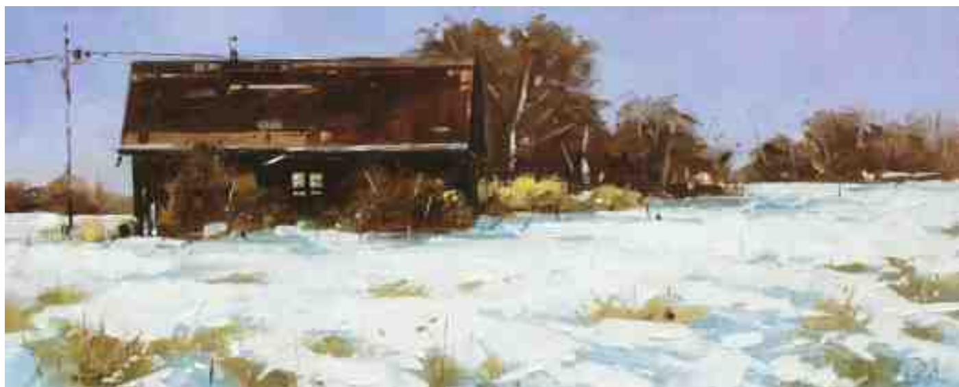
Winterstimmung VI 2020 | Öl/Holz | 18 x 45 cm