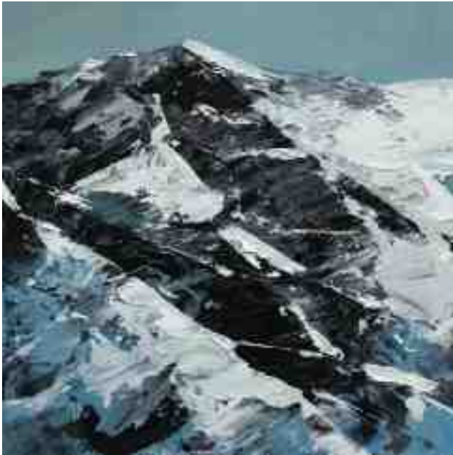
Bergwelten 001 2021 | Öl/Kt | 20 x 20 cm