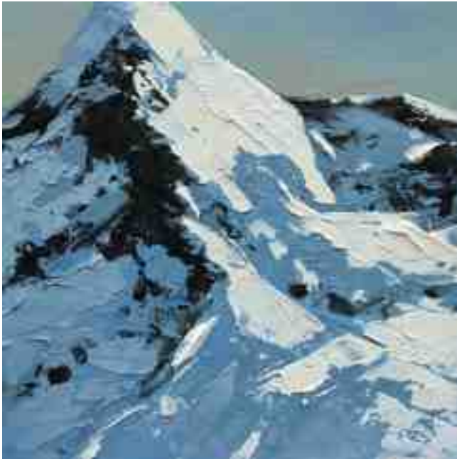
Bergwelten 039 2021 | Öl/Holz | 15 x 15 cm