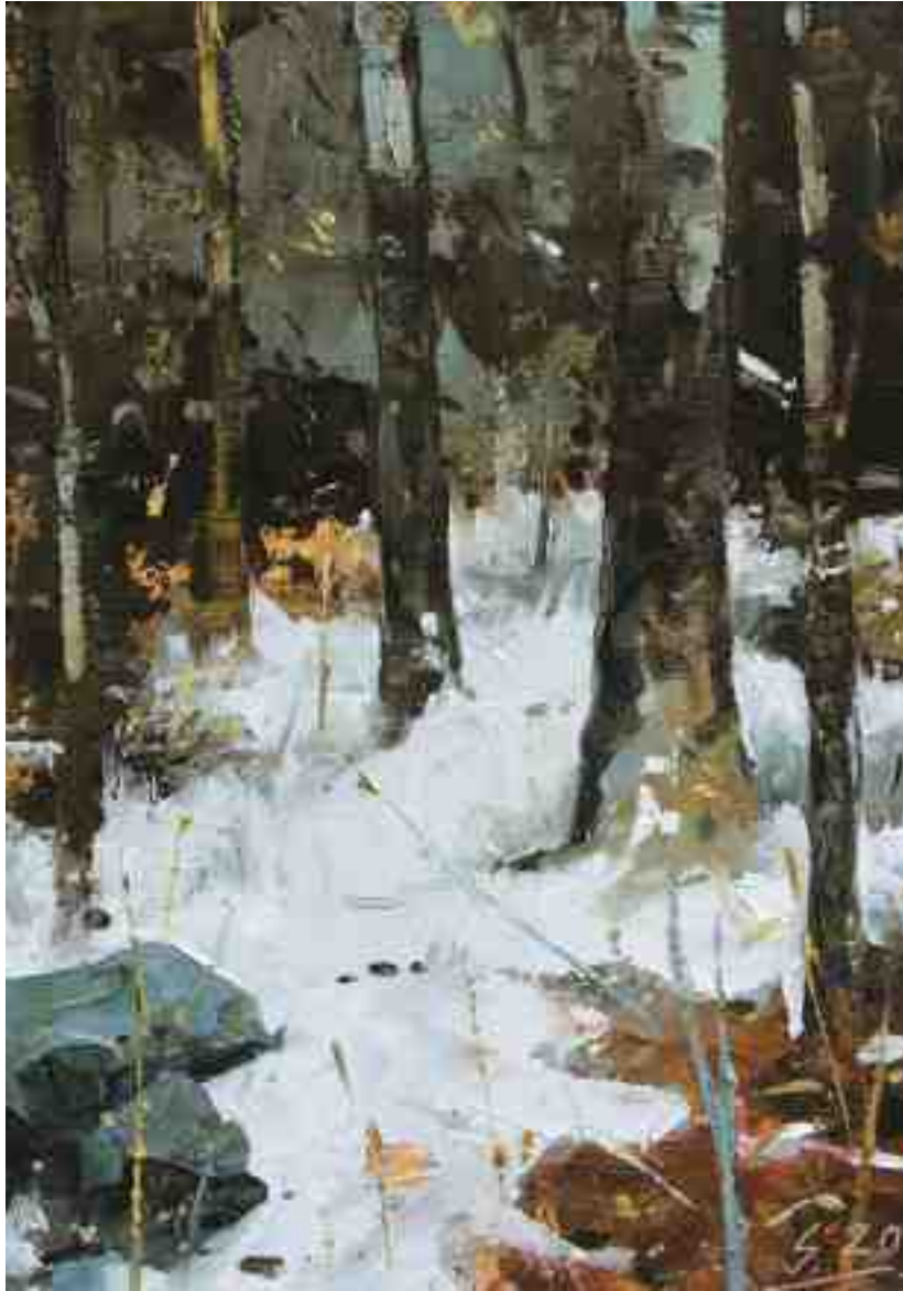
Schnee im Wald II 2020 | Öl/Holz | 20 x 14 cm