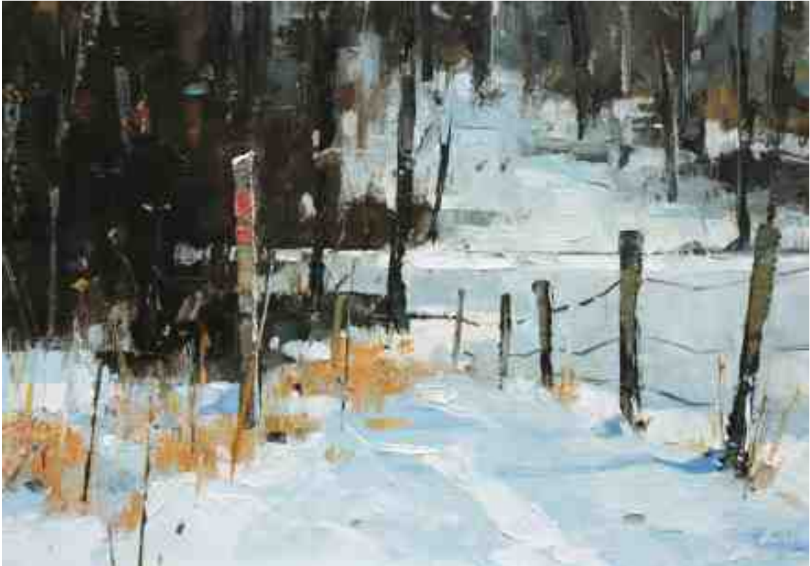
Schnee im Wald V 2020 | Öl/Kt | 14 x 20 cm