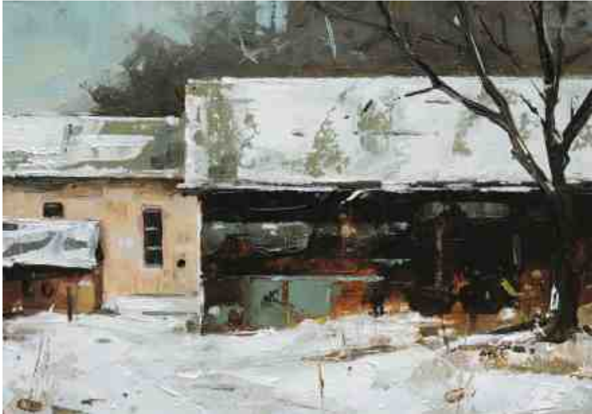
Scheune im Winter II 2020 | Öl/Kt | 14 x 20 cm