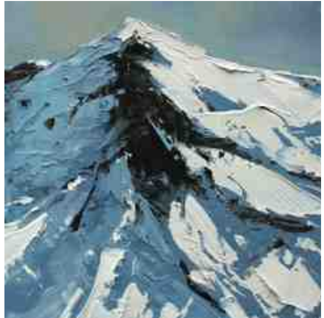
Bergwelten 038 2021 | Öl/Holz | 15 x 15 cm