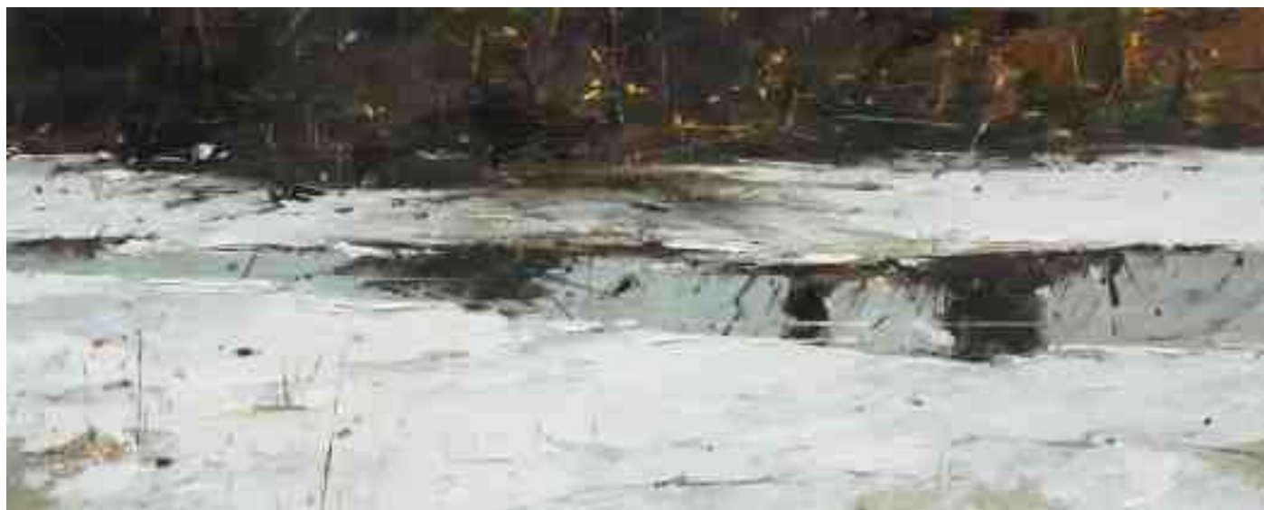
Winterstimmung III 2019 | Öl/Holz | 18 x 45 cm