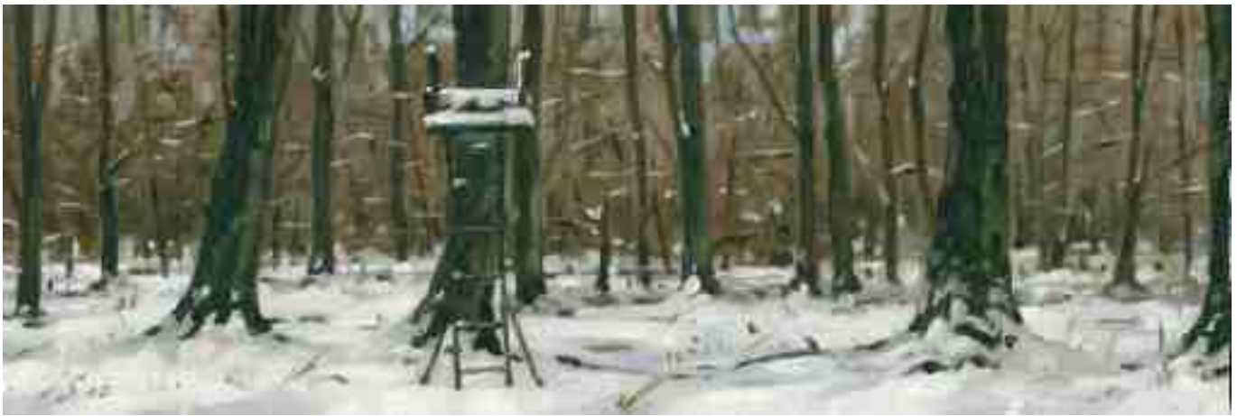
Wald im Winter 2010 | Öl/Lw./Holz | 10 x 30 cm