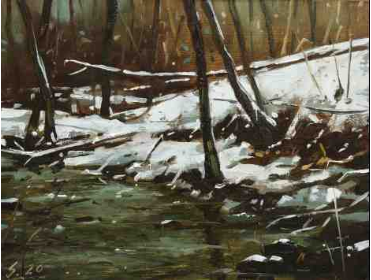
Eis und Schnee II 2020 | Öl/Holz | 19 x 25 cm