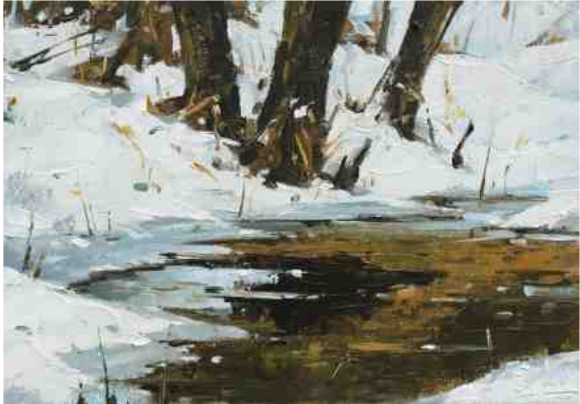
Am Bach IX 2020 | Öl/Kt | 14 x 20 cm