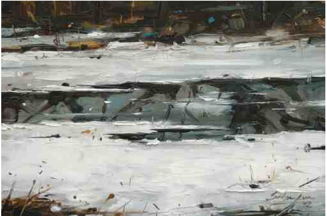
Winterspuren I 2012 | Öl/Holz | 20 x 30 cm