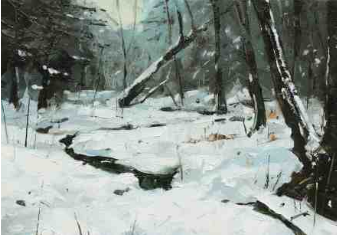
Winterstudie VII 2020 | Öl/Kt | 14 x 20 cm