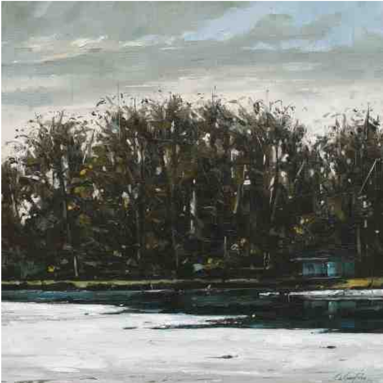
Winter in der Aue 2013 | Öl/Lw. | zweiteilig 50 x 100 cm