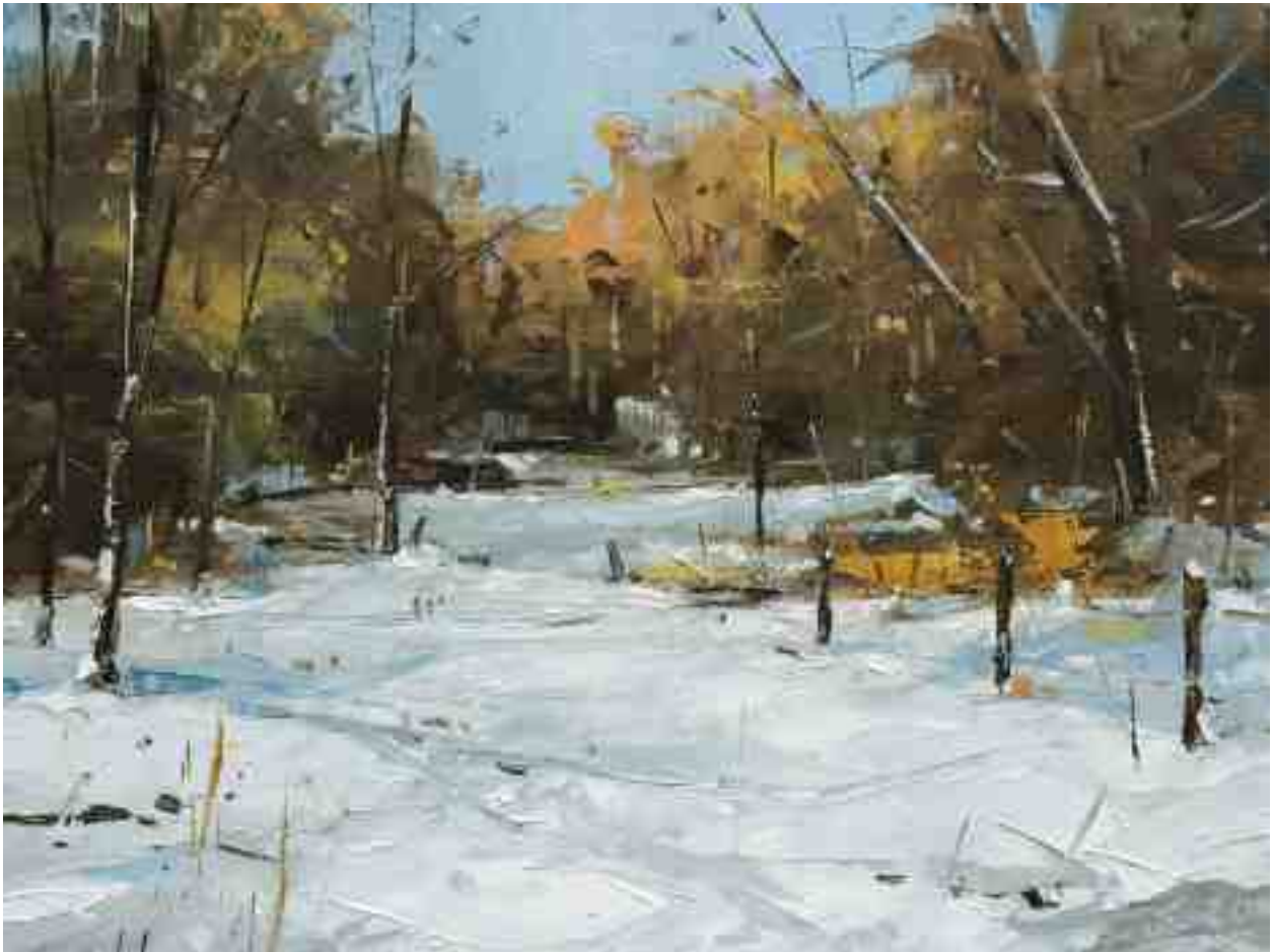
Winter bei Kassel 2020 | Öl/Holz | 18 x 24 cm