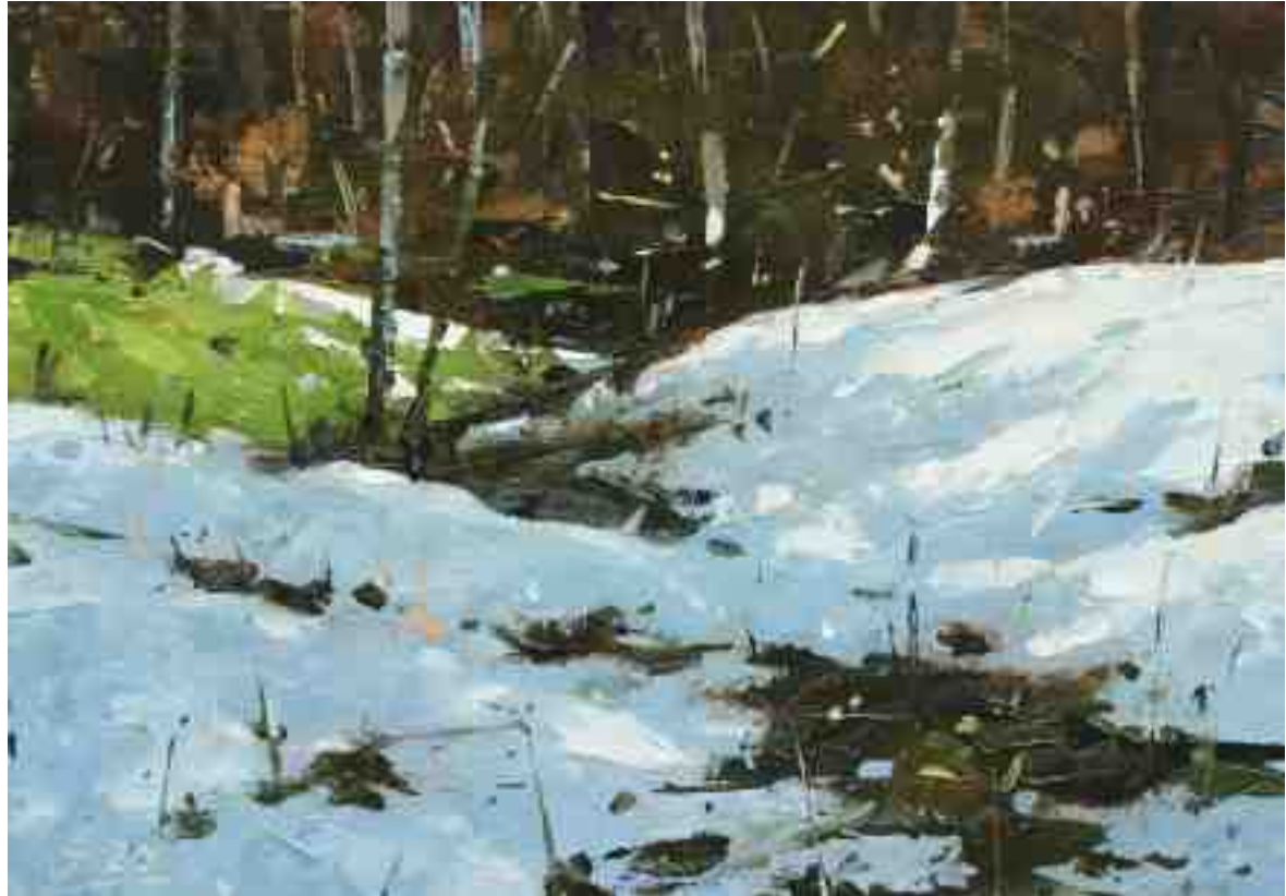
Schneereste III 2020 | Öl/Kt | 14 x 20 cm