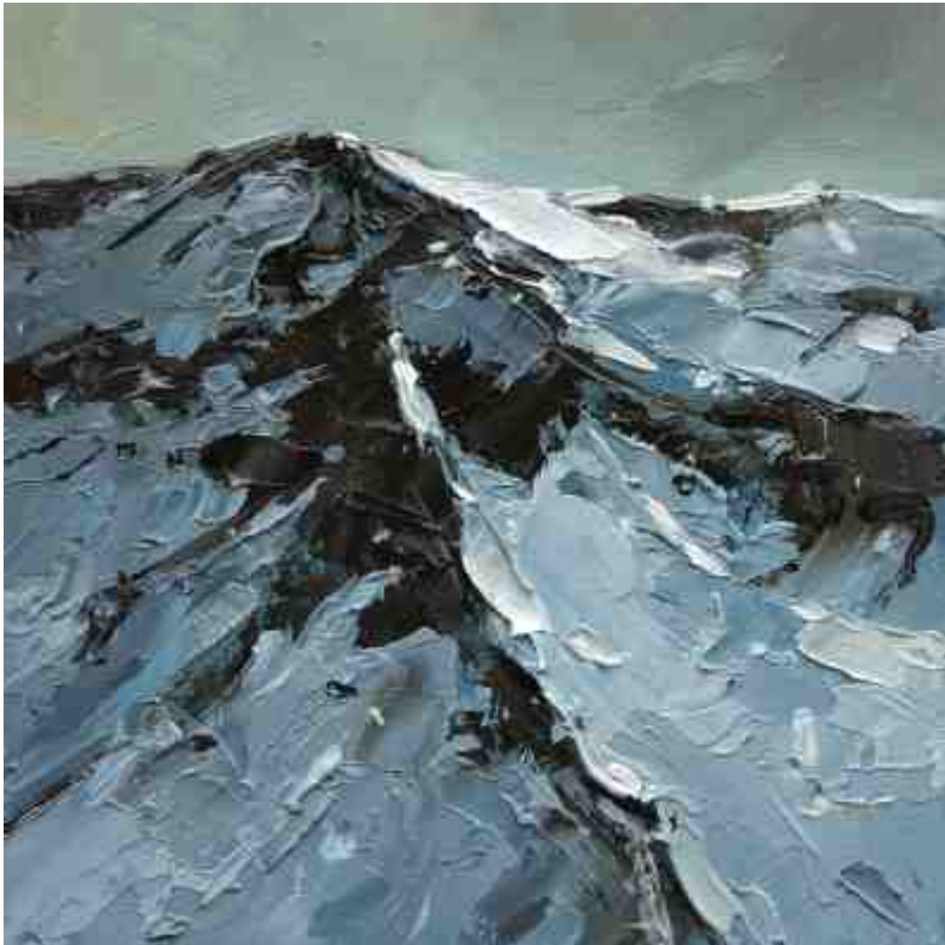
Bergwelten 011 2021 | Öl/Holz | 15 x 15 cm