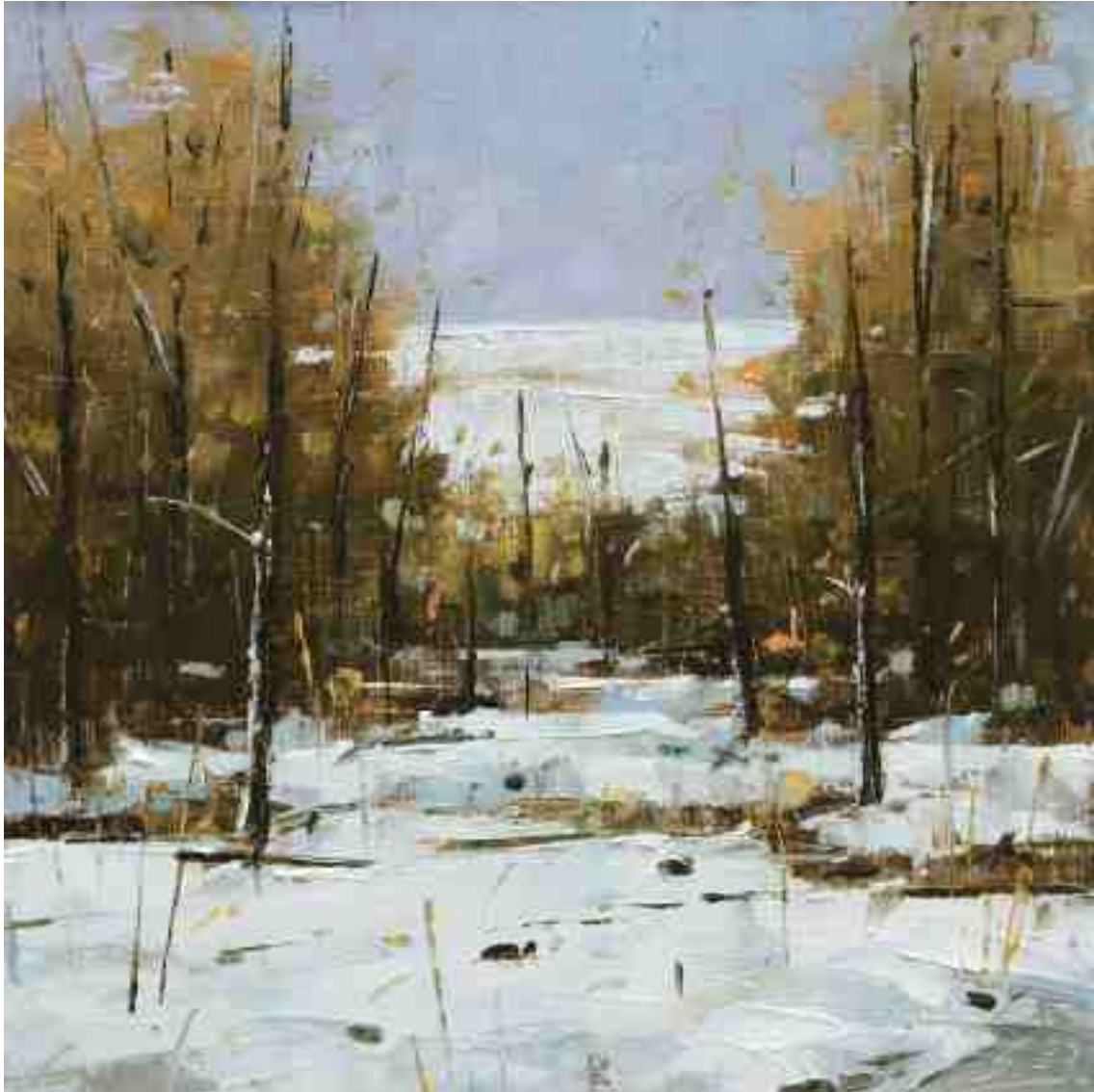
Winterstudie IV 2020 | Öl/Holz | 18 x 18 cm