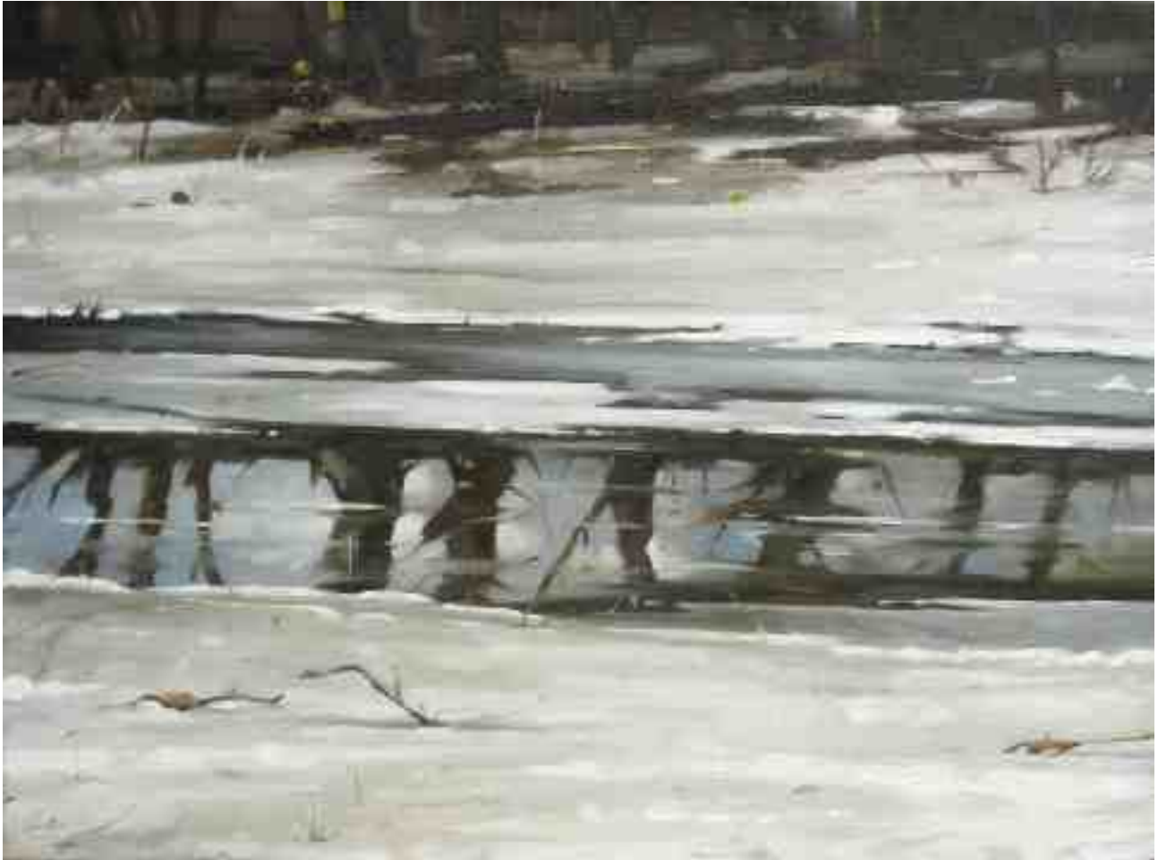
Eis und Schnee 2010 | Öl/Lw. | 45 x 60 cm