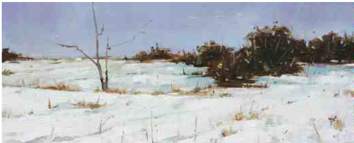
Winterstimmung V 2020 | Öl/Holz | 18 x 45 cm