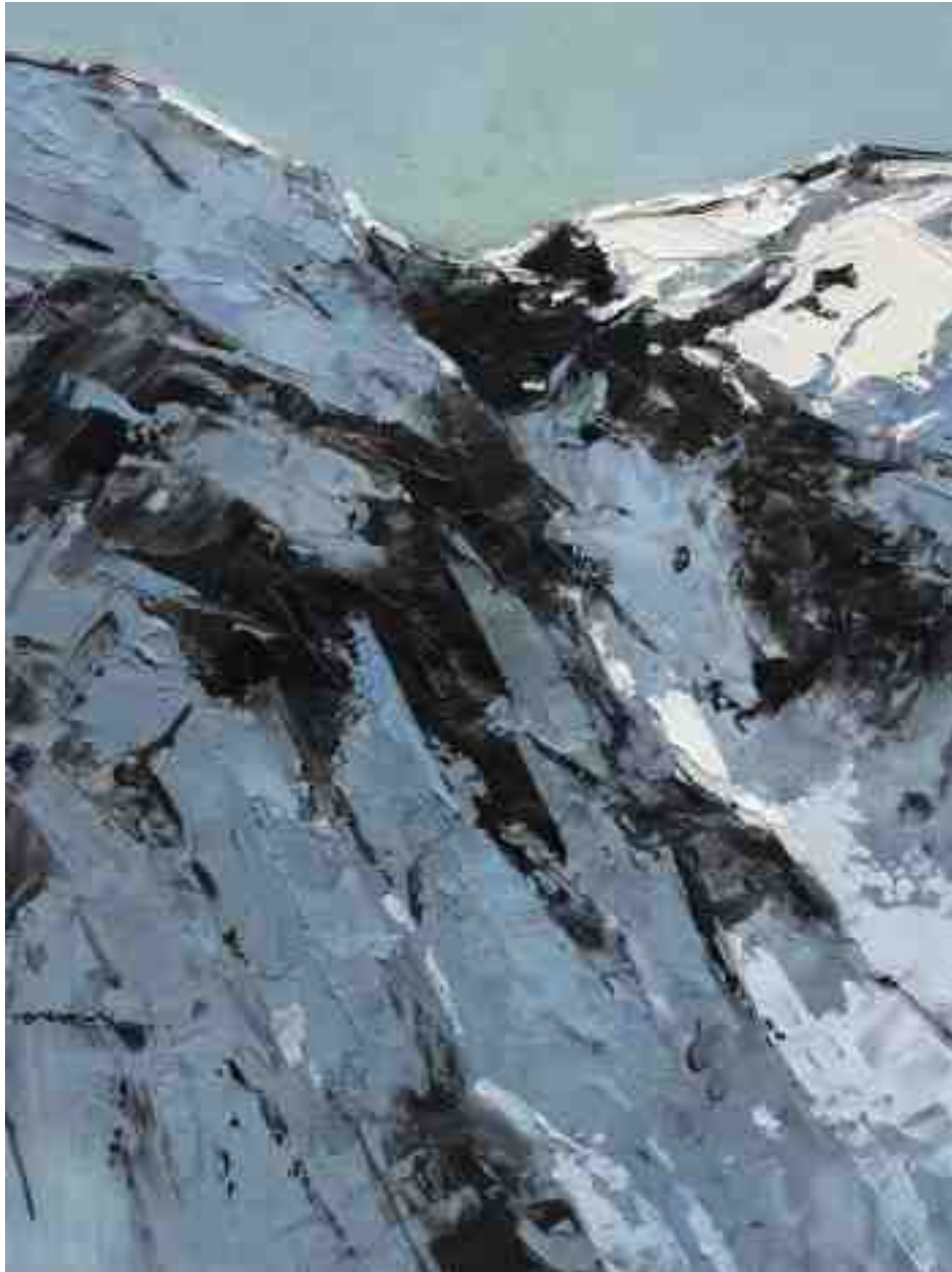
Bergwelten 019 2021 | Öl/Holz | 24 x 18 cm