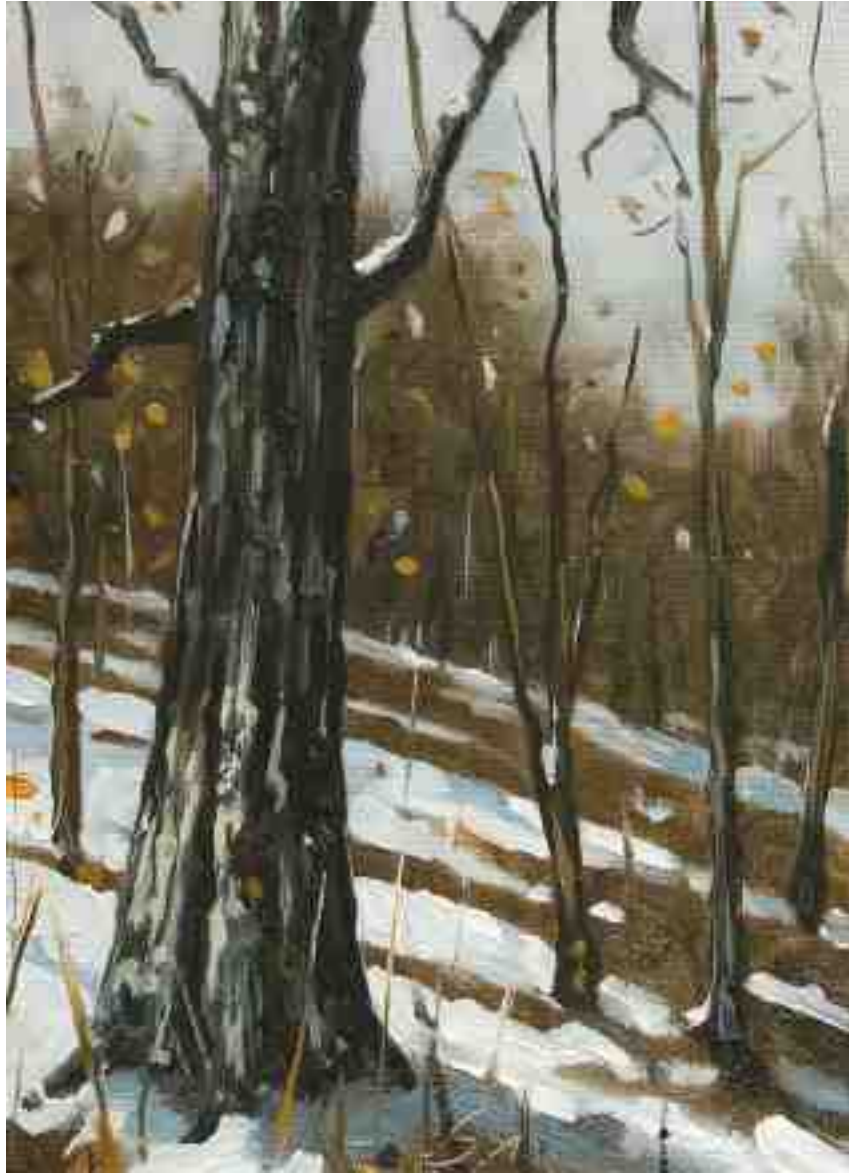
Winterszenen 2011 | Öl/Lw./Holz | 18 x 13 cm