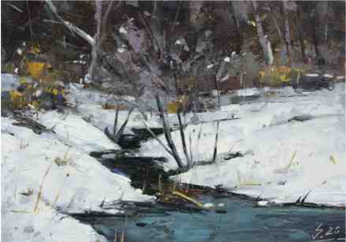
Am Bach XI 2020 | Öl/Kt | 14 x 20 cm