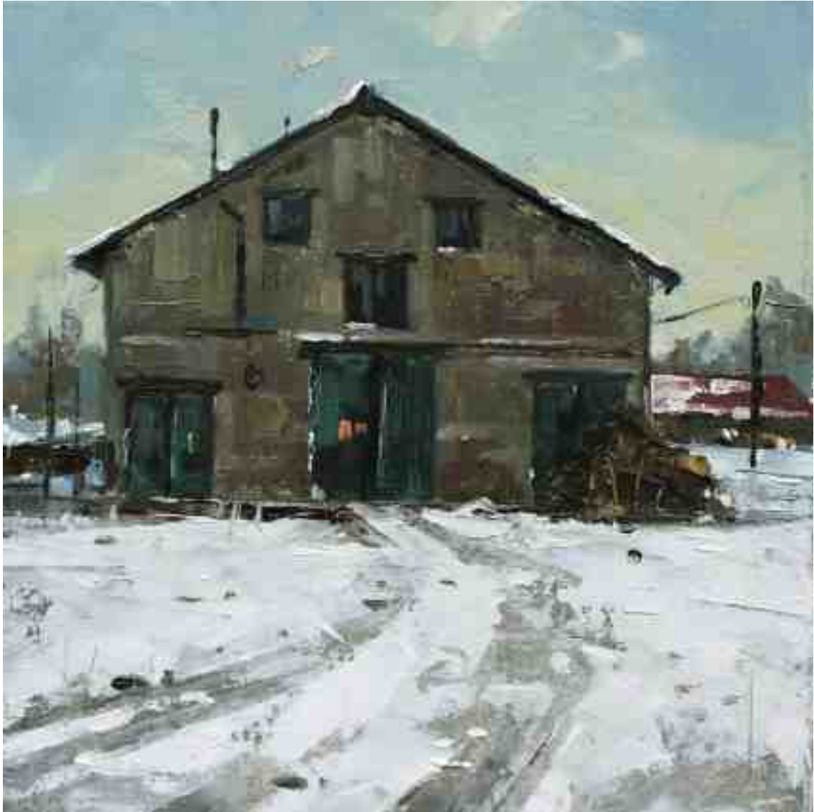
Alte Werkstatt 2020 | Öl/Kt | 18 x 18 cm