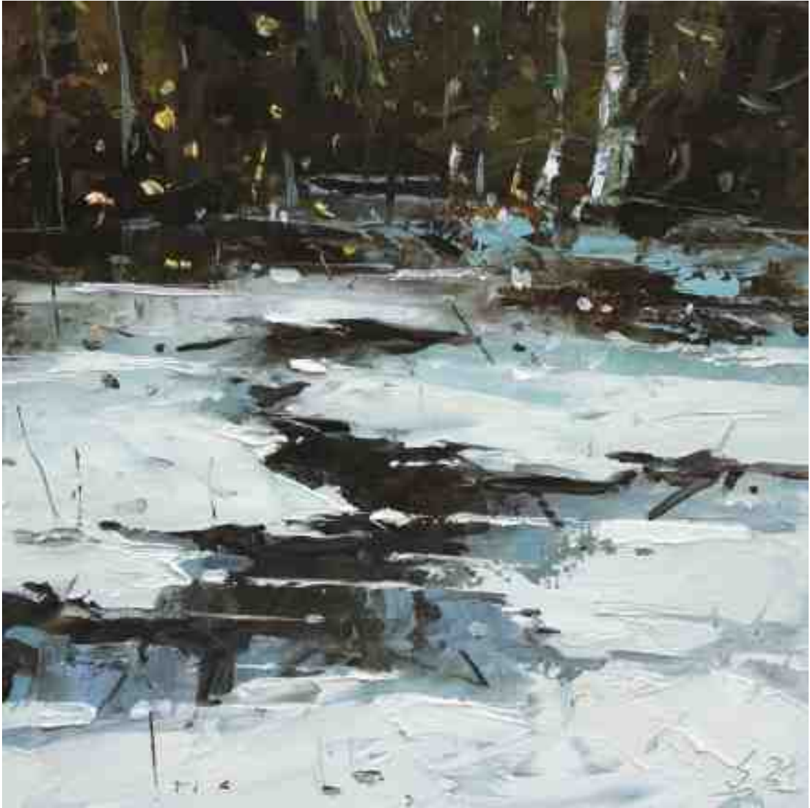
Eisloch III 2021 | Öl/Kt | 20 x 20 cm