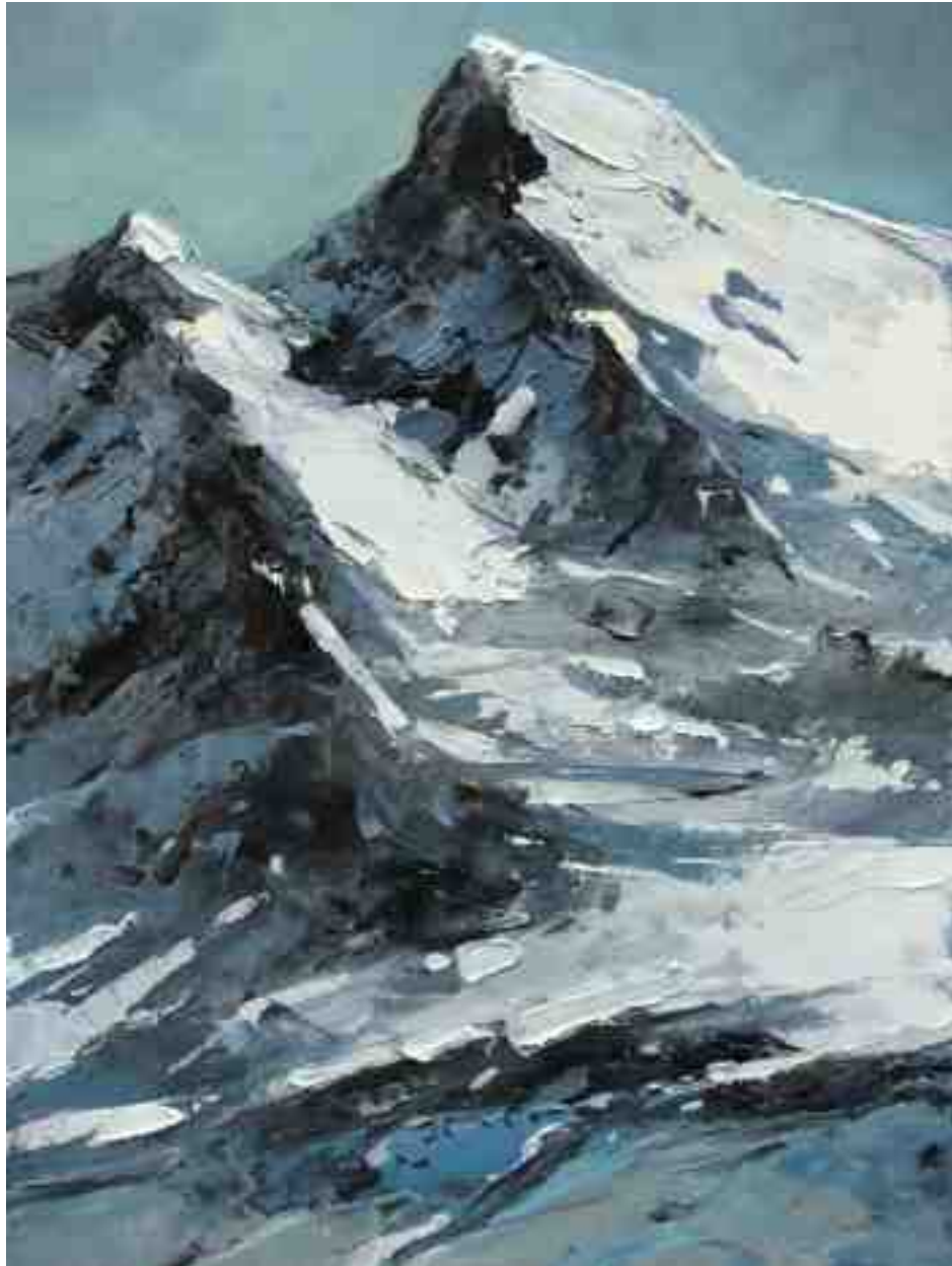
Bergwelten 020 2021 | Öl/Holz | 24 x 18 cm