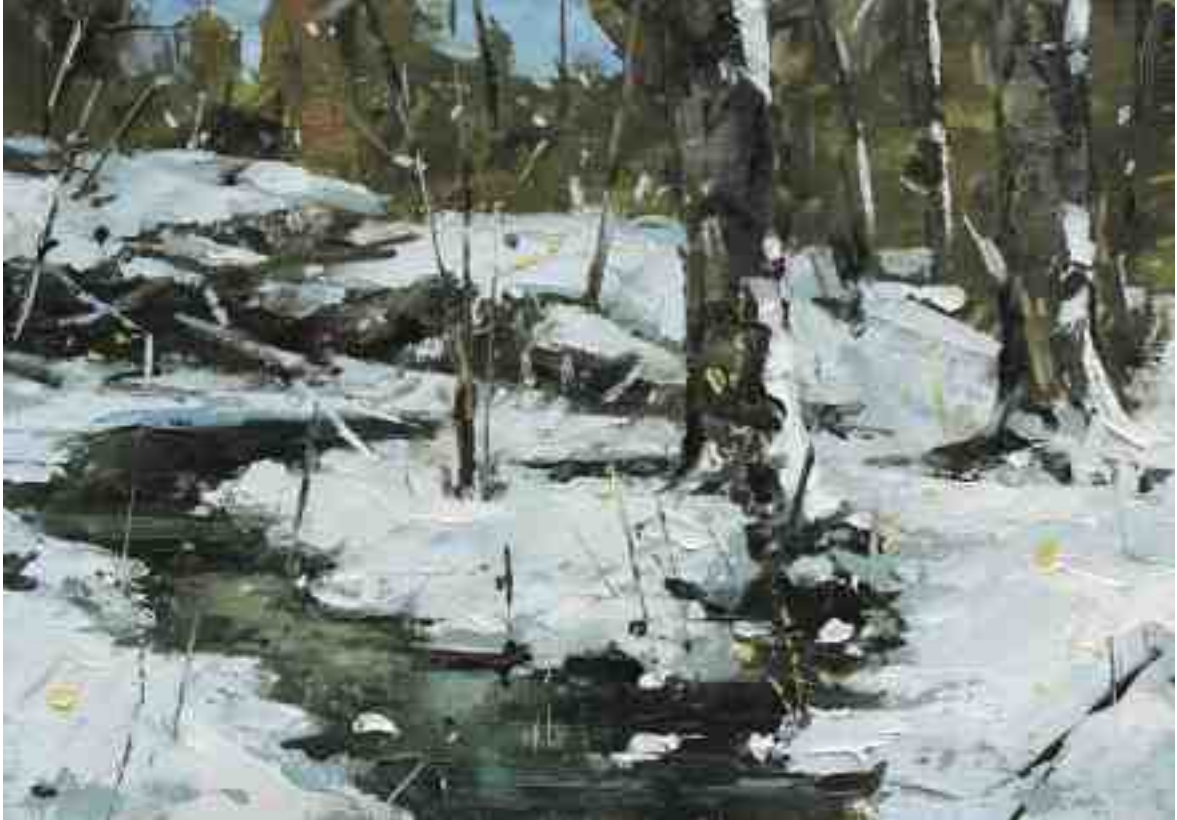
Am Bach X 2020 | Öl/Kt | 14 x 20 cm