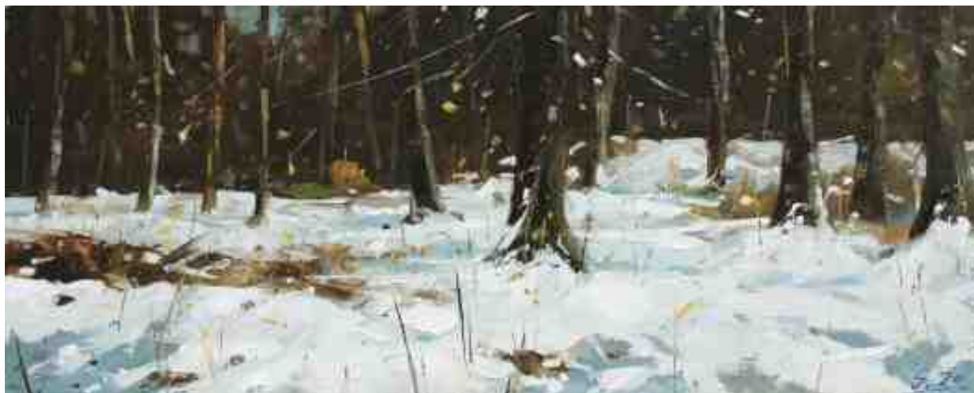
Winter am Waldrand II 2020 | Öl/Holz | 18 x 45 cm