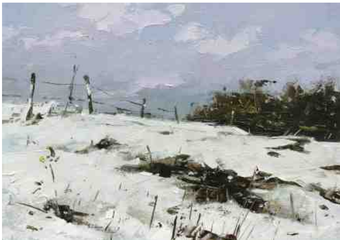
Am Hang 2020 | Öl/Kt | 14 x 20 cm