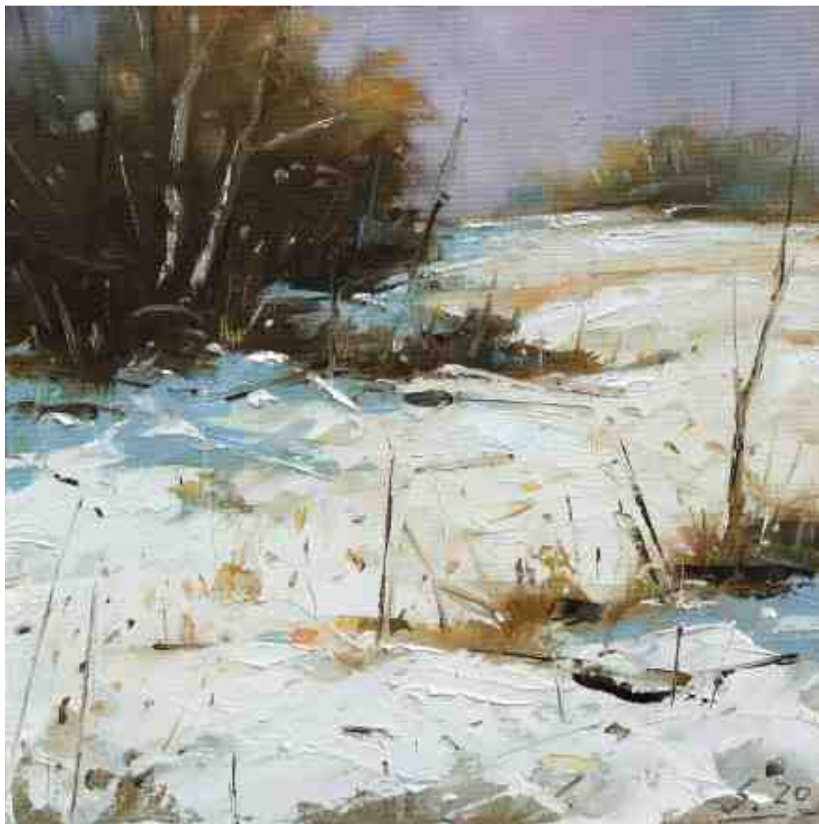
Kassel Dönche IV 2020 | Öl/Lw/Holz | 20 x 20 cm