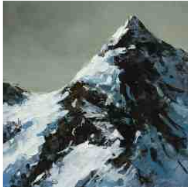
Bergwelten 008 2021 | Öl/Kt | 20 x 20 cm