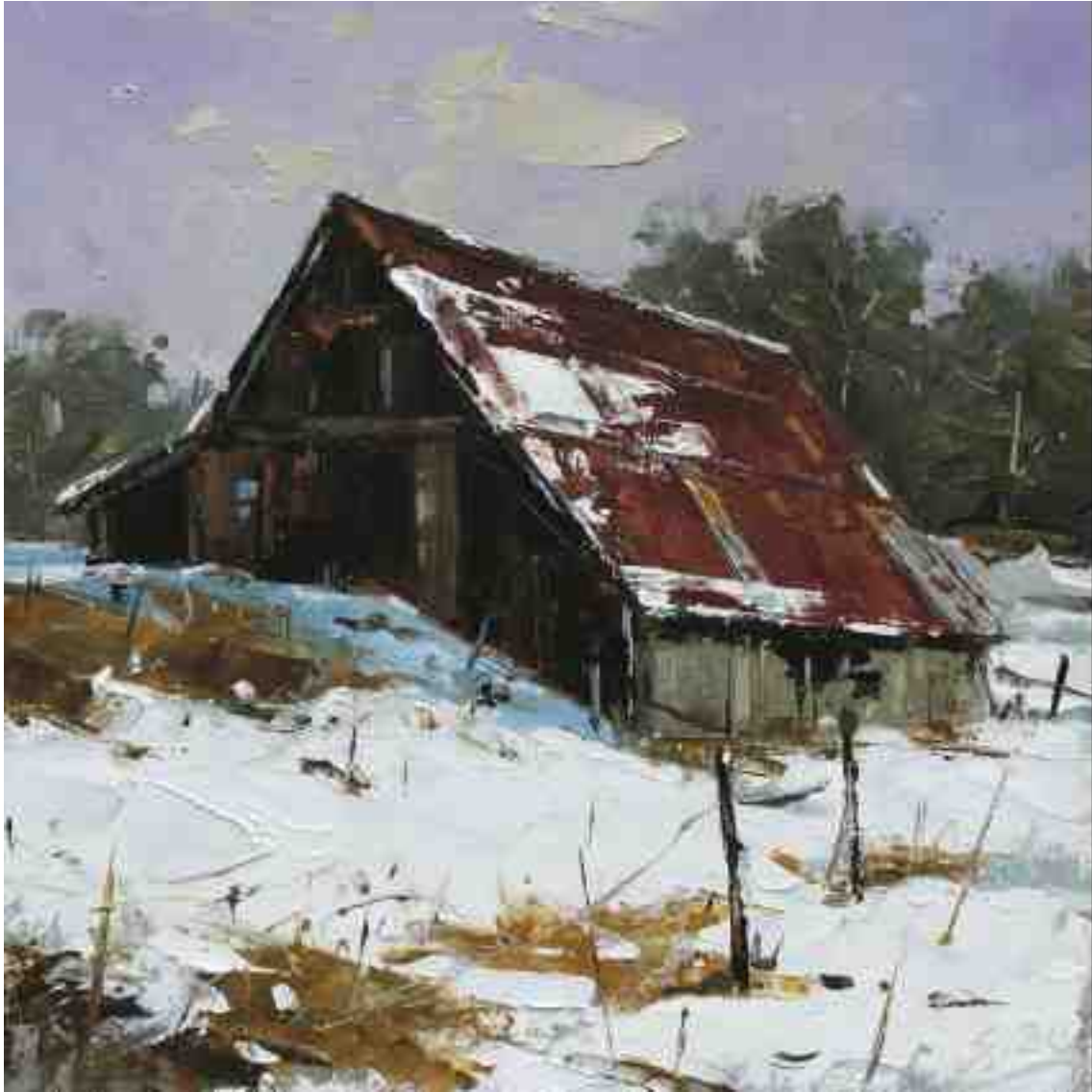
Am Hang 2020 | Öl/Kt | 18 x 18 cm