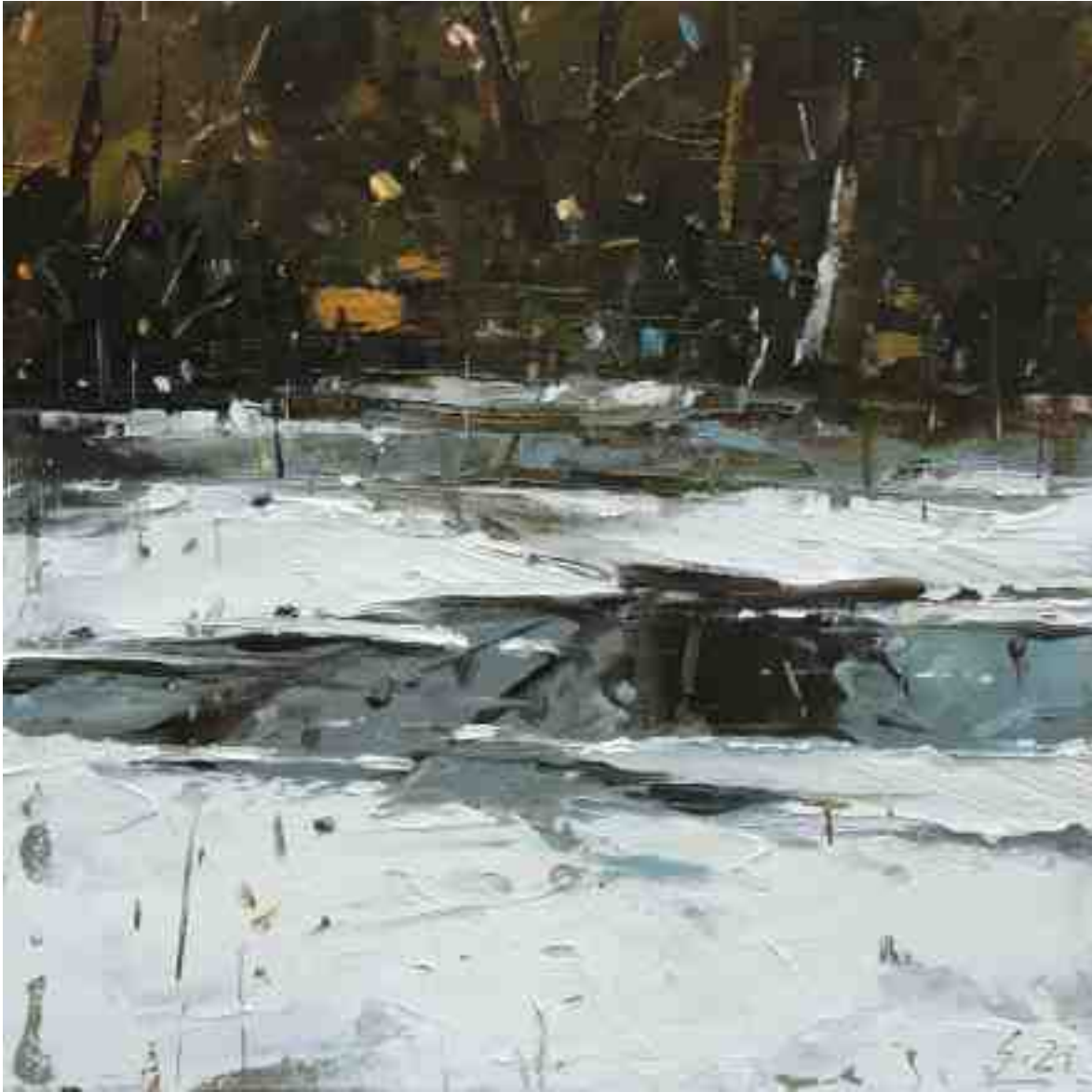
Eisloch I 2021 | Öl/Kt | 20 x 20 cm