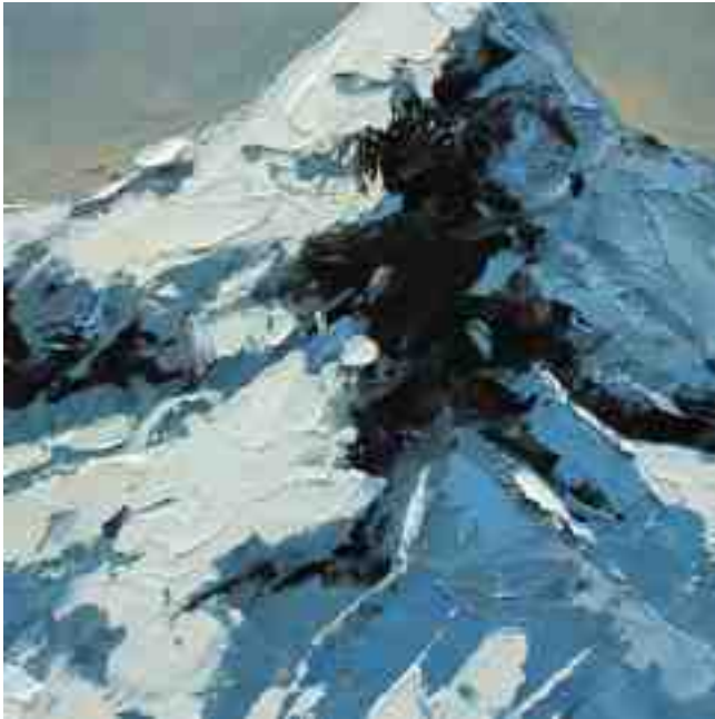
Bergwelten 037 2021 | Öl/Holz | 15 x 15 cm