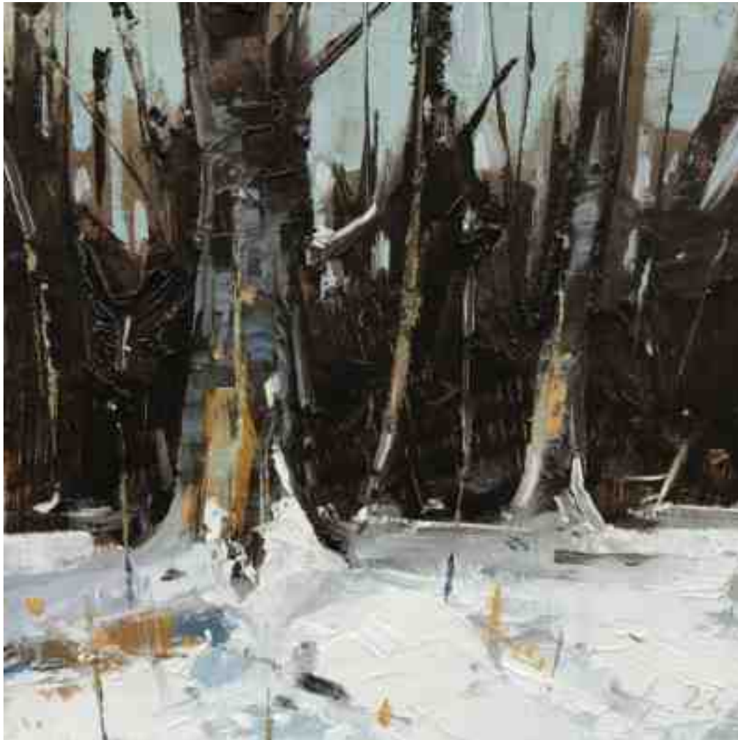
Am Waldrand III 2022 | Öl/Kt | 15 x 15 cm