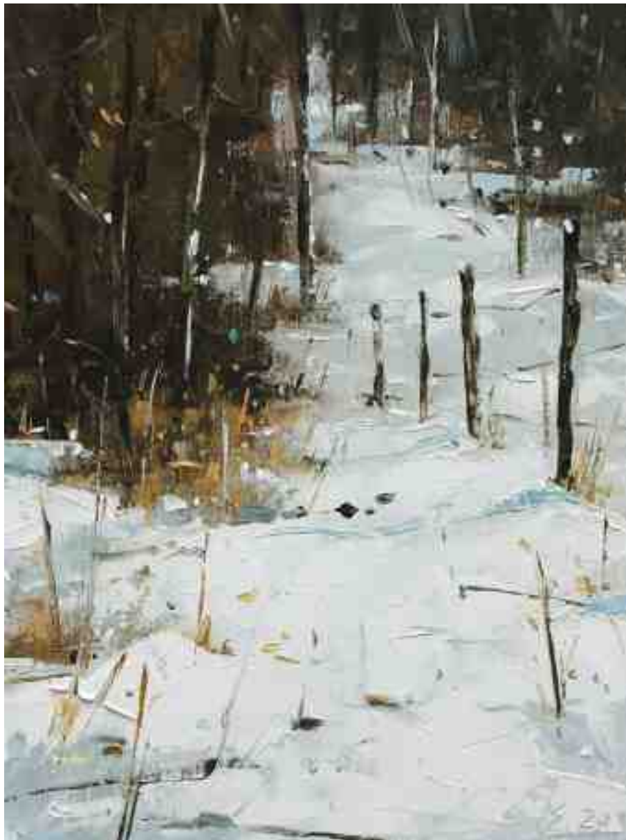
Am Waldrand 2020 | Öl/Holz | 24 x 18 cm