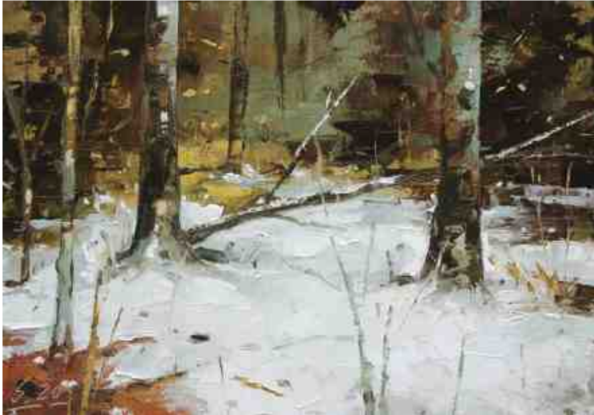
Schnee im Wald III 2020 | Öl/Holz | 14 x 20 cm