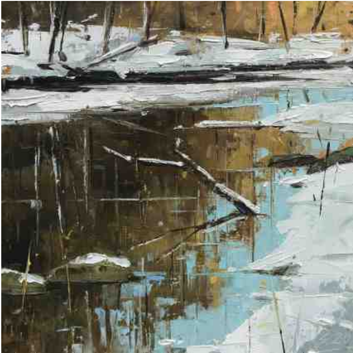
Am Bach V 2020 | Öl/Holz | 18 x 18 cm