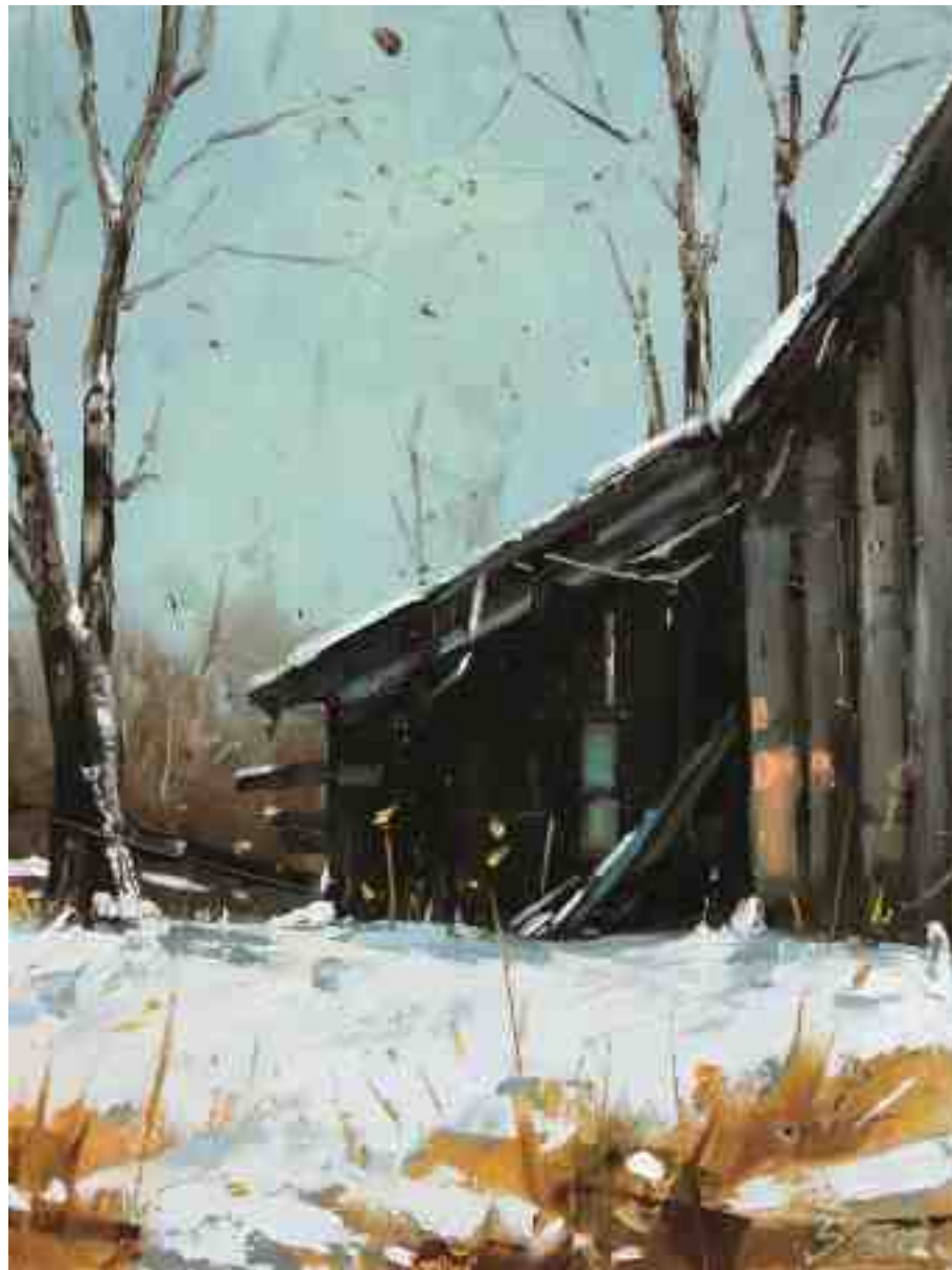
Alte Scheune im Winter I 2020 | Öl/Holz | 24 x 18 cm