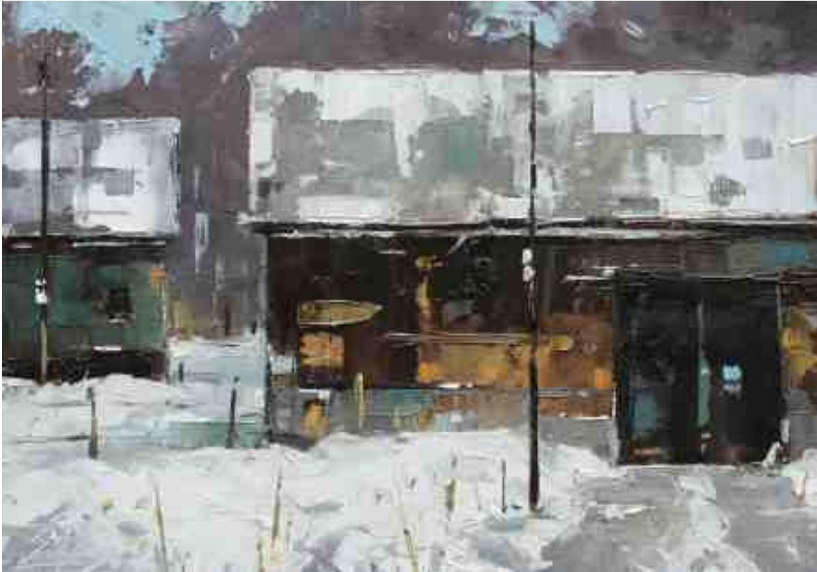
Alte Scheune im Winter IV 2020 | Öl/Kt | 14 x 20 cm