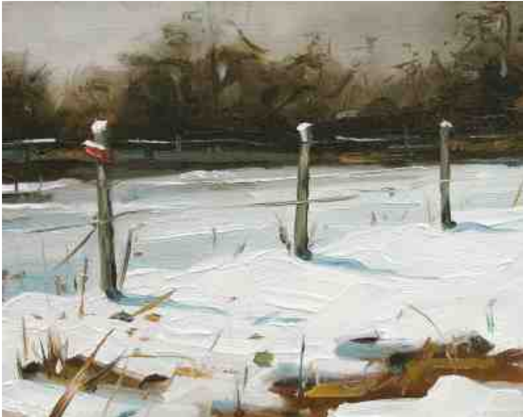
Winterszenen XXIII 2011 | Öl/Holz | 12 x 15 cm