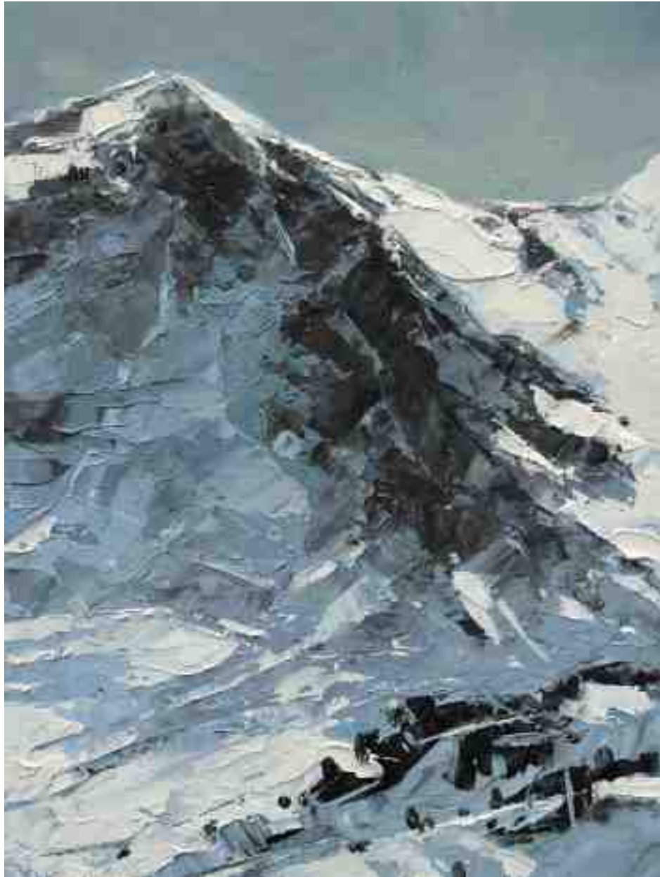
Bergwelten 024 2021 | Öl/Holz | 24 x 18 cm