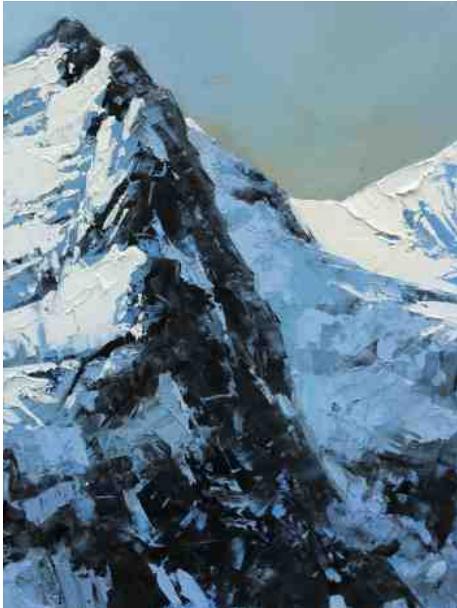
Bergwelten 027 2021 | Öl/Holz | 24 x 18 cm