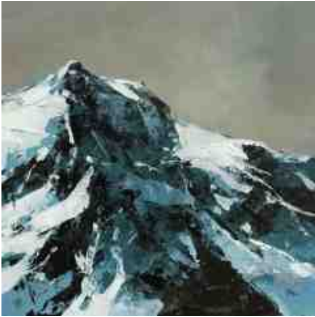
Bergwelten 003 2021 | Öl/Kt | 20 x 20 cm