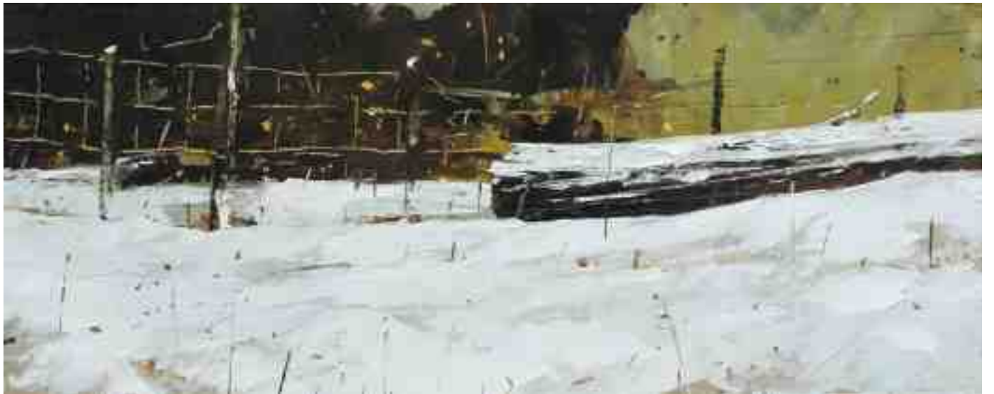
Winterstimmung I 2019 | Öl/Holz | 18 x 45 cm