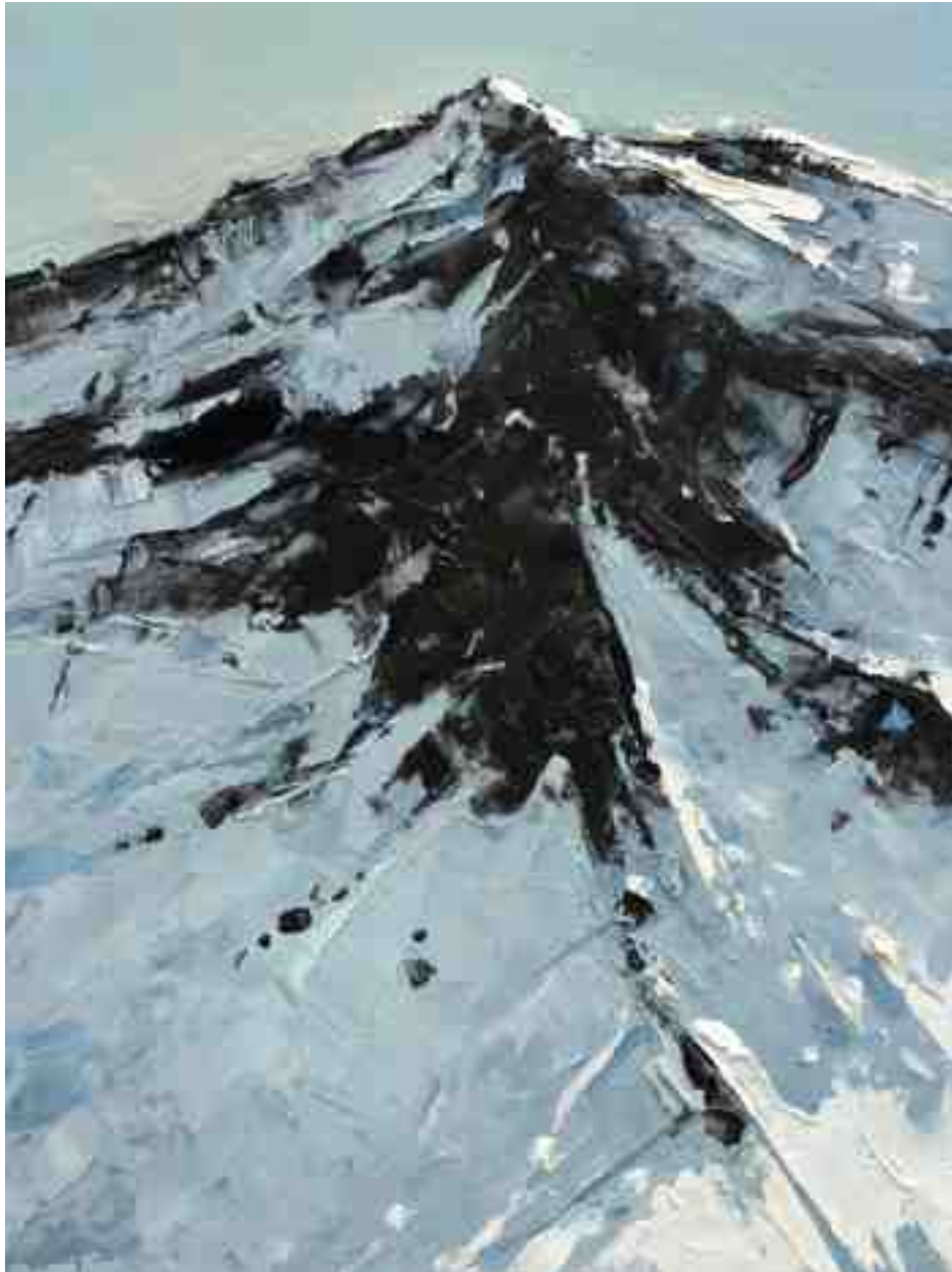
Bergwelten 034 2021 | Öl/Holz | 24 x 18 cm