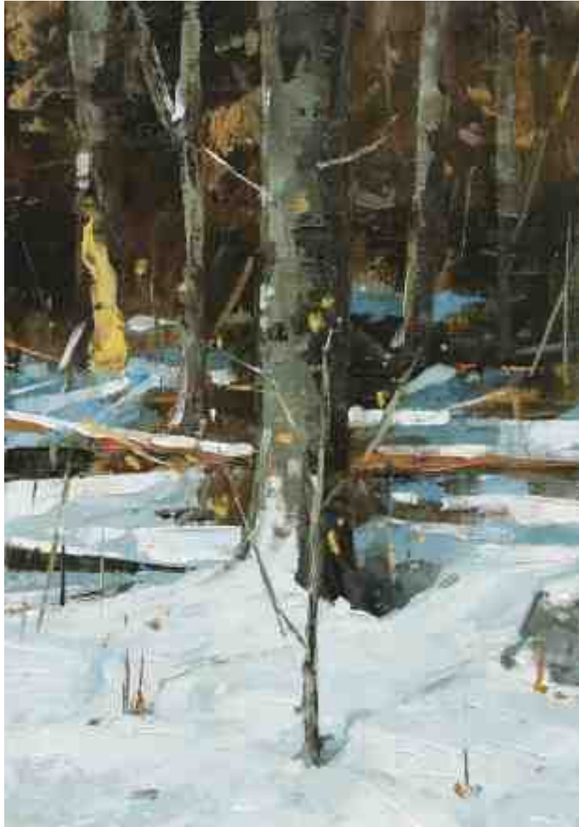
Lichtspiel III 2020 | Öl/Kt | 20 x 14 cm