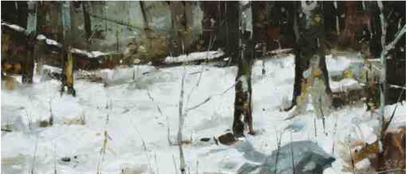
Schnee im Wald I 2020 | Öl/Lw/Holz | 15 x 35 cm