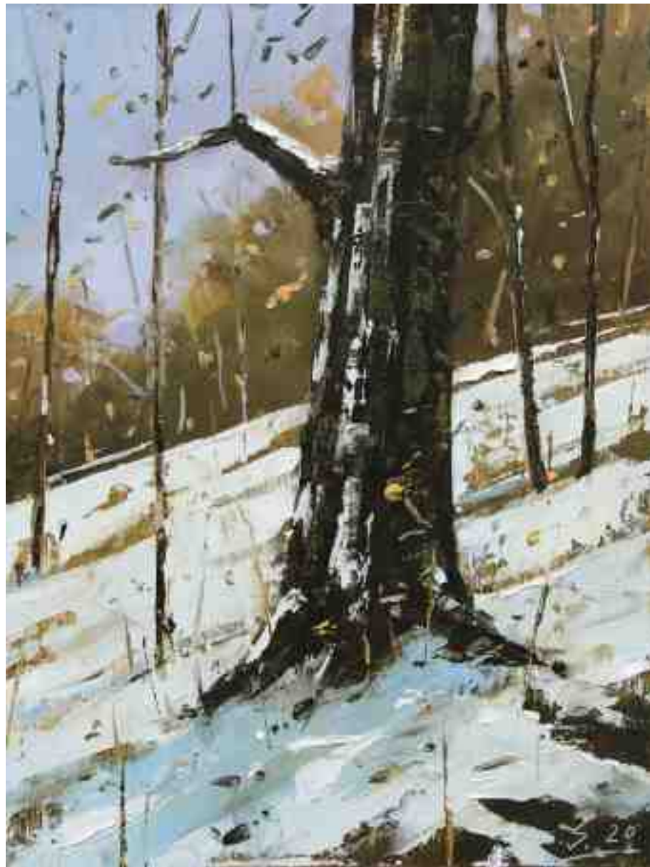
Baum im Winter 2020 | Öl/Holz | 24 x 18 cm