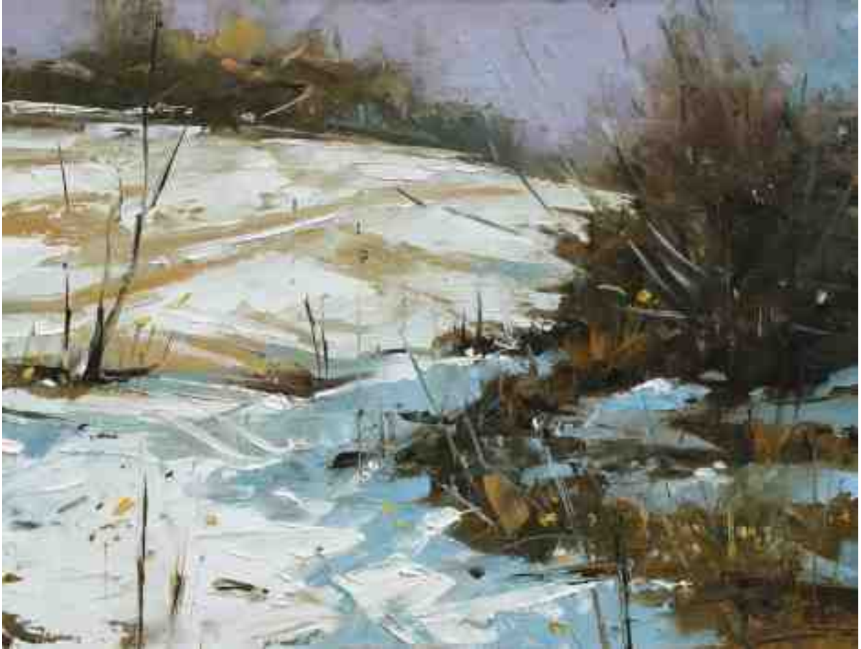
Kassel Dönche II 2020 | Öl/Holz | 19 x 25 cm