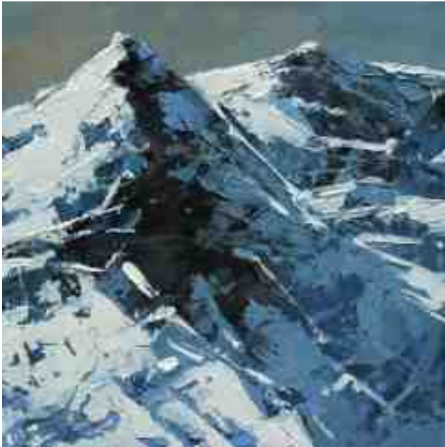
Bergwelten 025 2021 | Öl/Holz | 15 x 15 cm