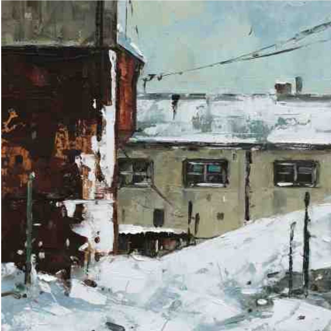
Hinterhof I 2020 | Öl/Kt | 18 x 18 cm