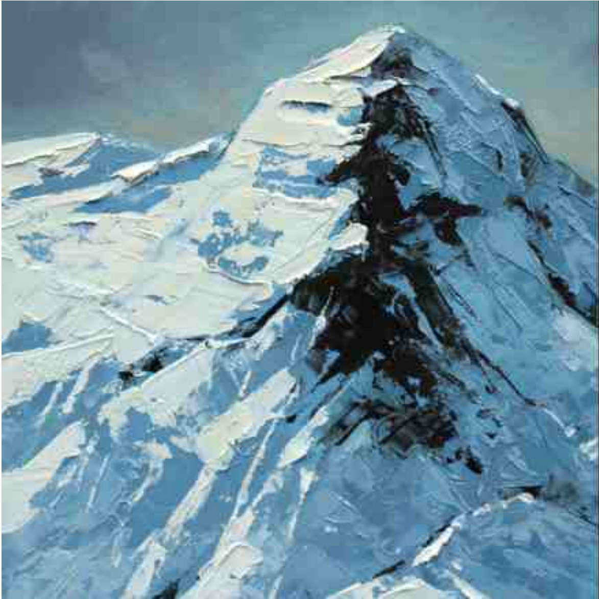
Bergwelten 031 2021 | Öl/Holz | 20 x 20 cm