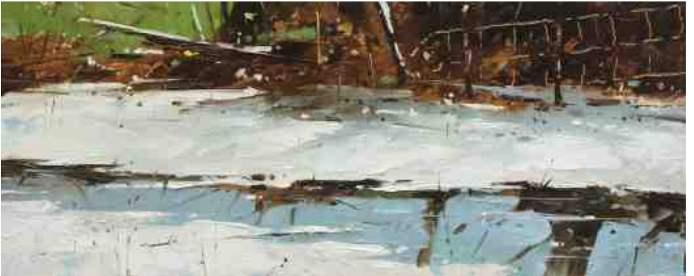
Winterstimmung IV 2020 | Öl/Holz | 18 x 45 cm