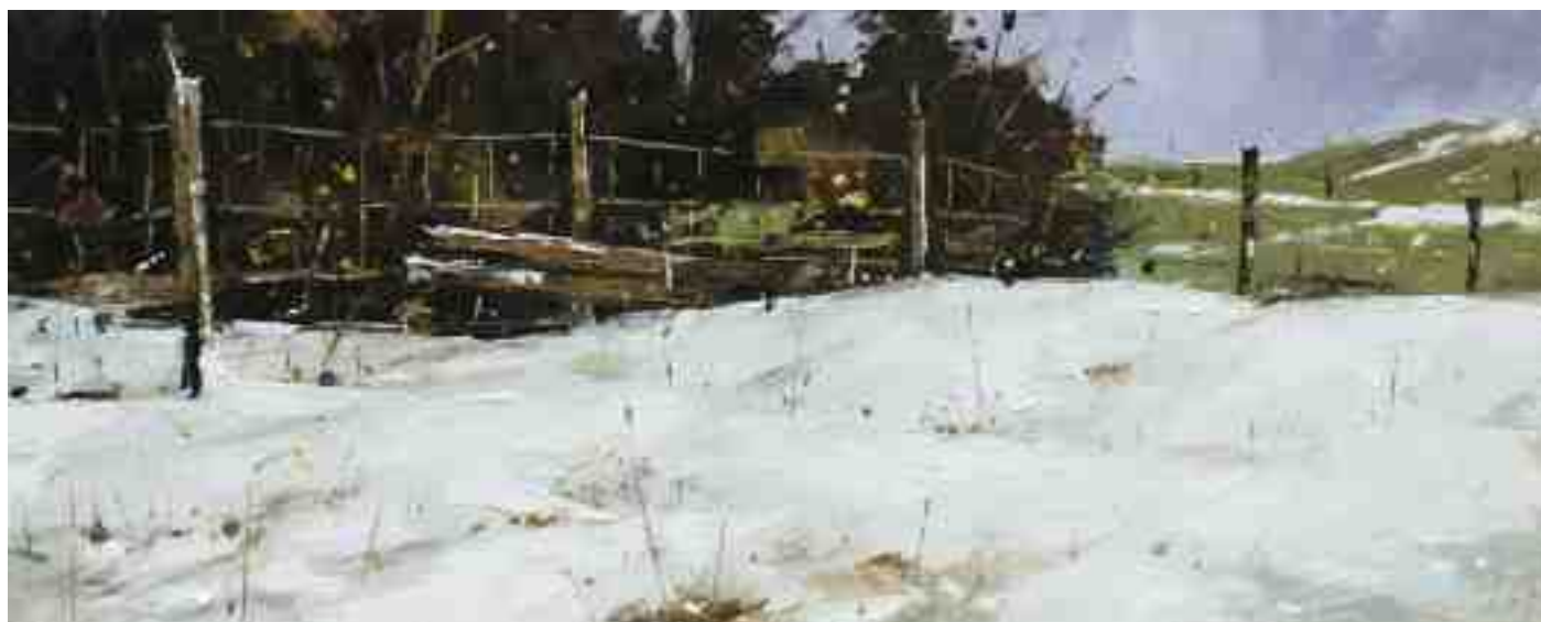
Winterstimmung II 2019 | Öl/Holz | 18 x 45 cm