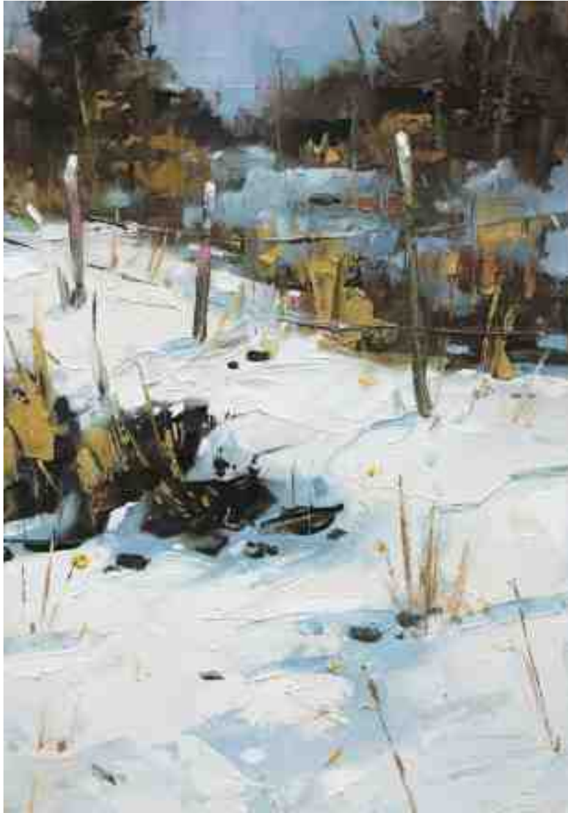
Im Sonnenlicht III 2020 | Öl/Kt | 20 x 14 cm