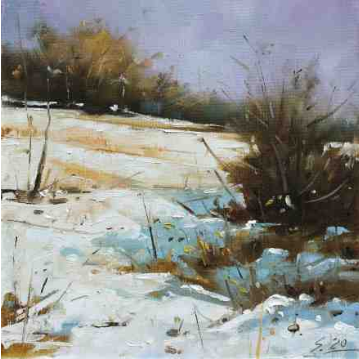
Kassel Dönche III 2020 | Öl/Lw/Holz | 20 x 20 cm