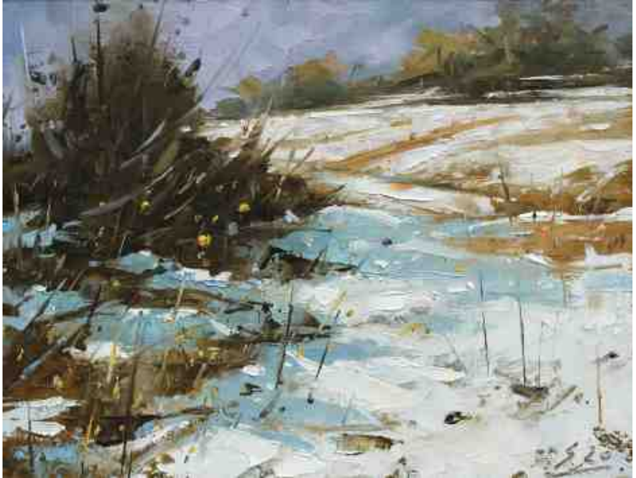
Kassel Dönche I 2020 | Öl/Holz | 19 x 25 cm