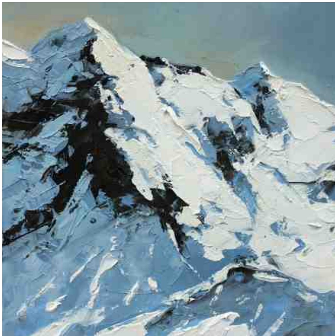
Bergwelten 036 2021 | Öl/Holz | 20 x 20 cm