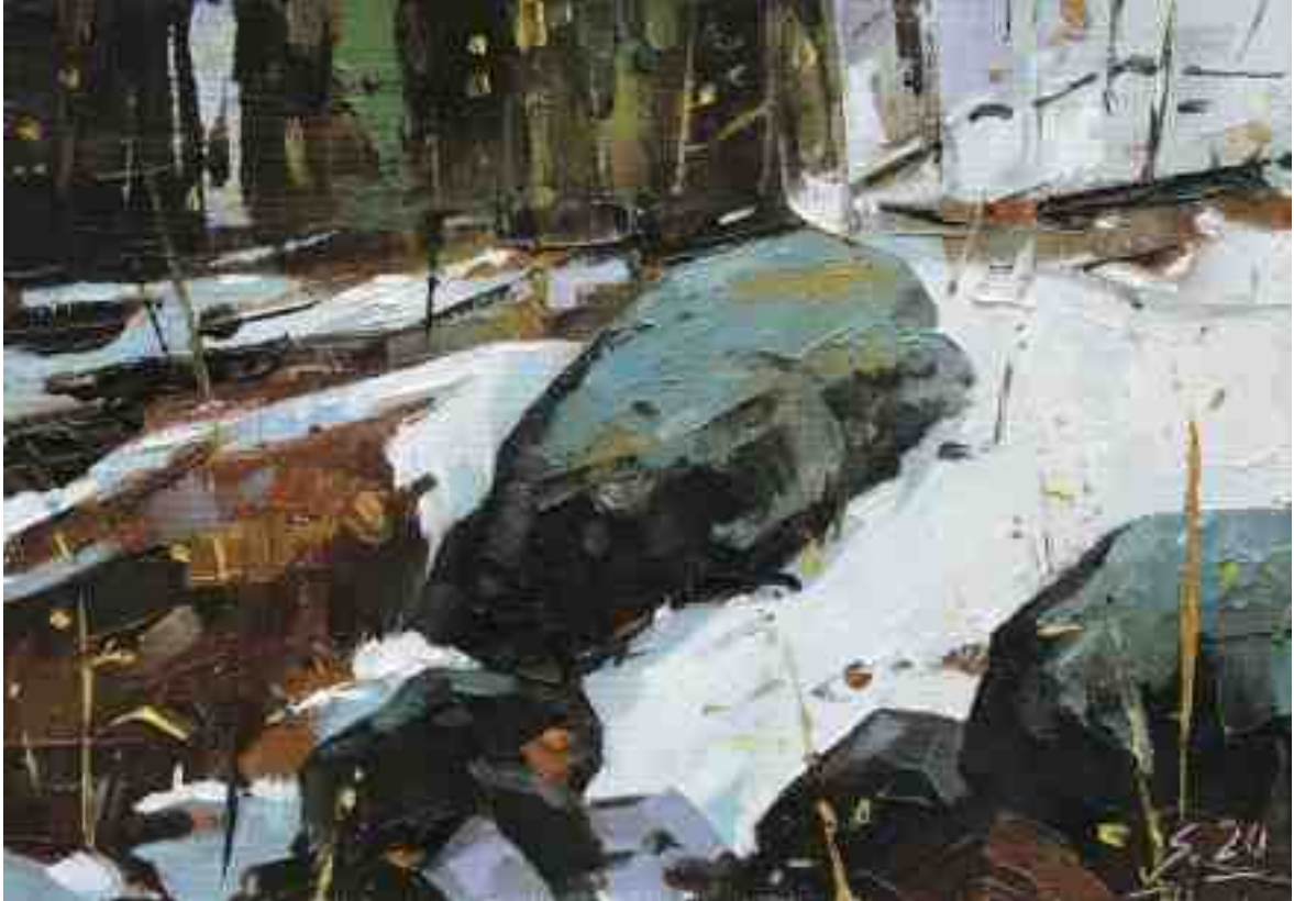
Steine am Hang I 2020 | Öl/Lw/Holz | 14 x 20 cm