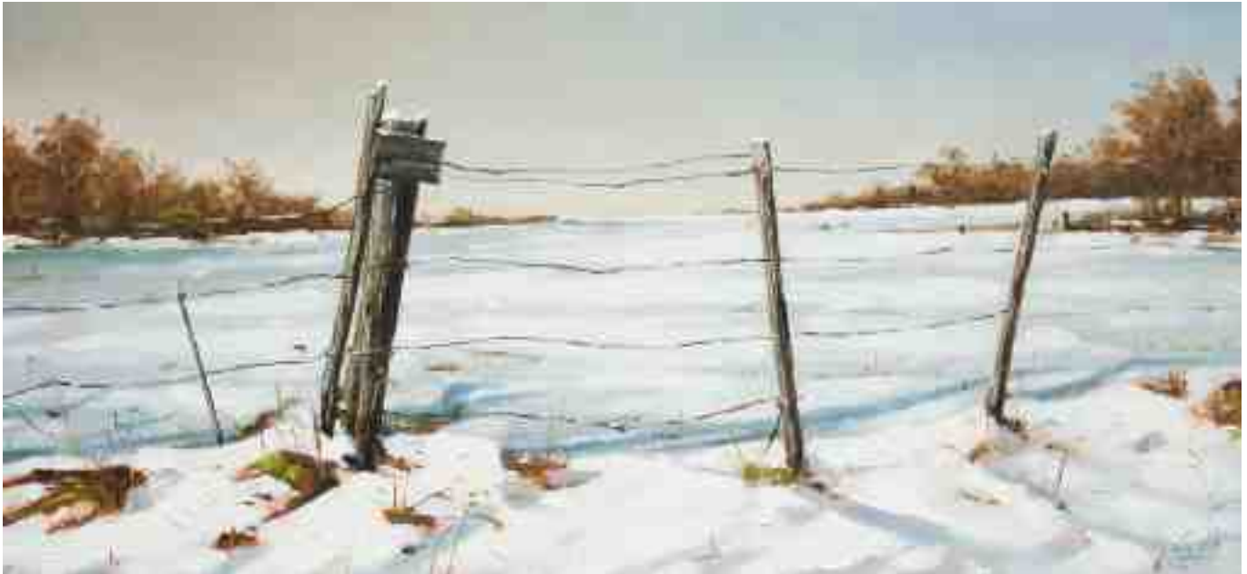
Winter bei Kassel IV 2011 | Öl/Holz | 30 x 65 cm