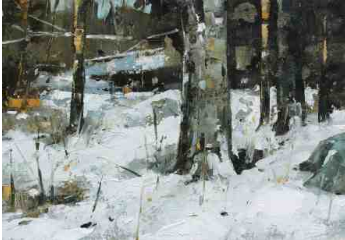
Schnee im Wald VII 2020 | Öl/Kt | 14 x 20 cm