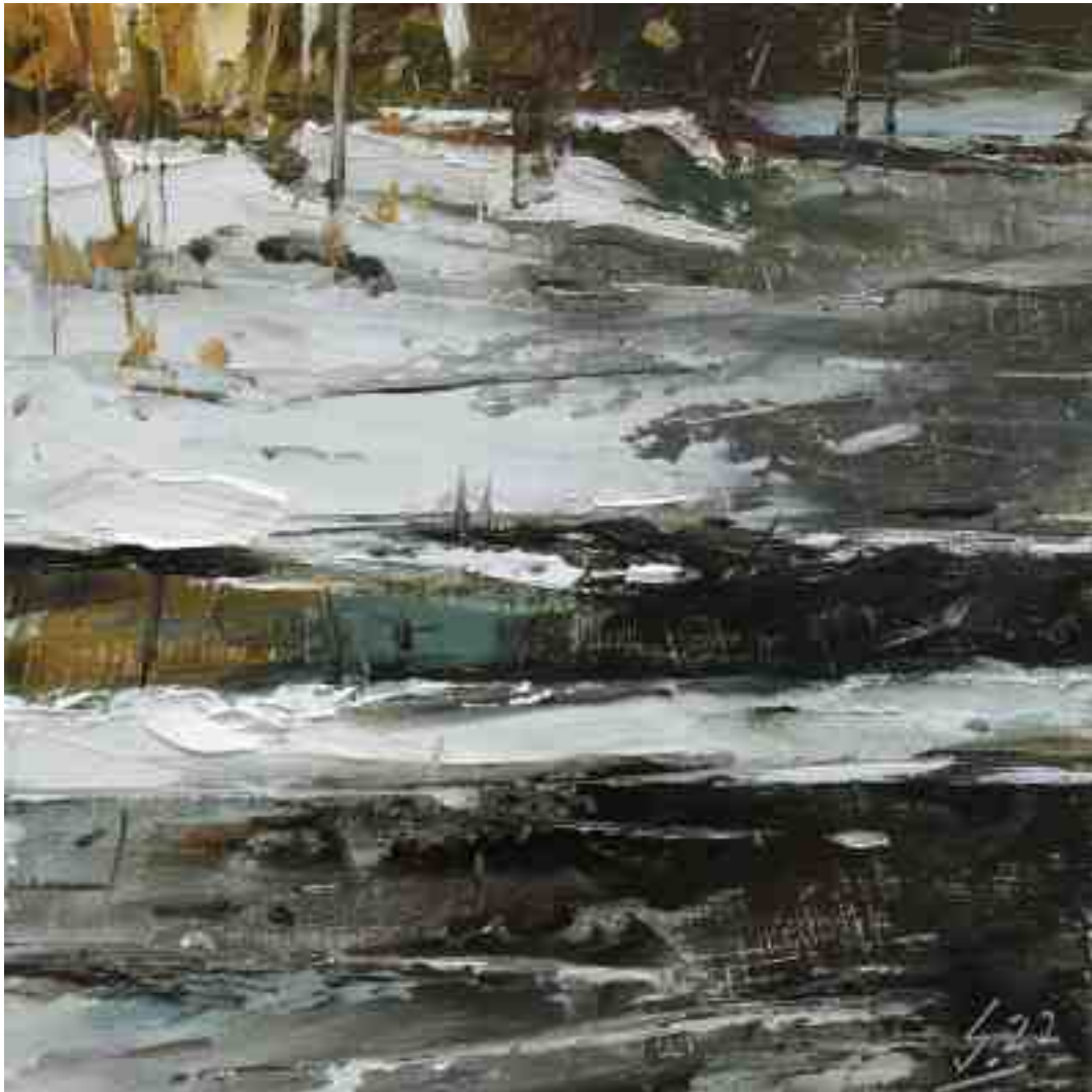
Eisloch V 2022 | Öl/Holz | 15 x 15 cm