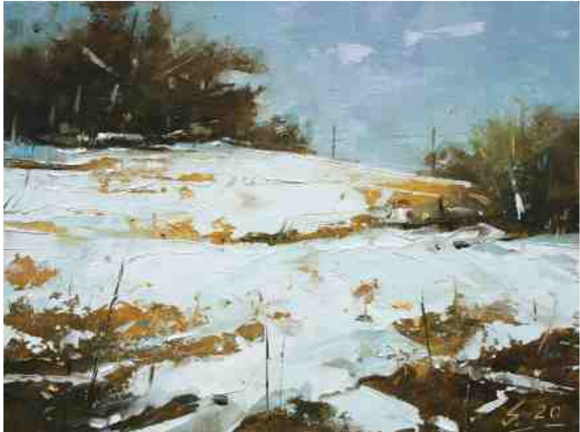
Winterstudie I 2020 | Öl/Kt | 15 x 20 cm