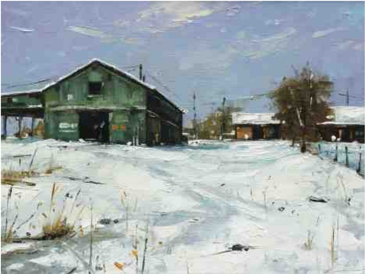
Aussiedlerhof 2020 | Öl/Holz | 18 x 24 cm