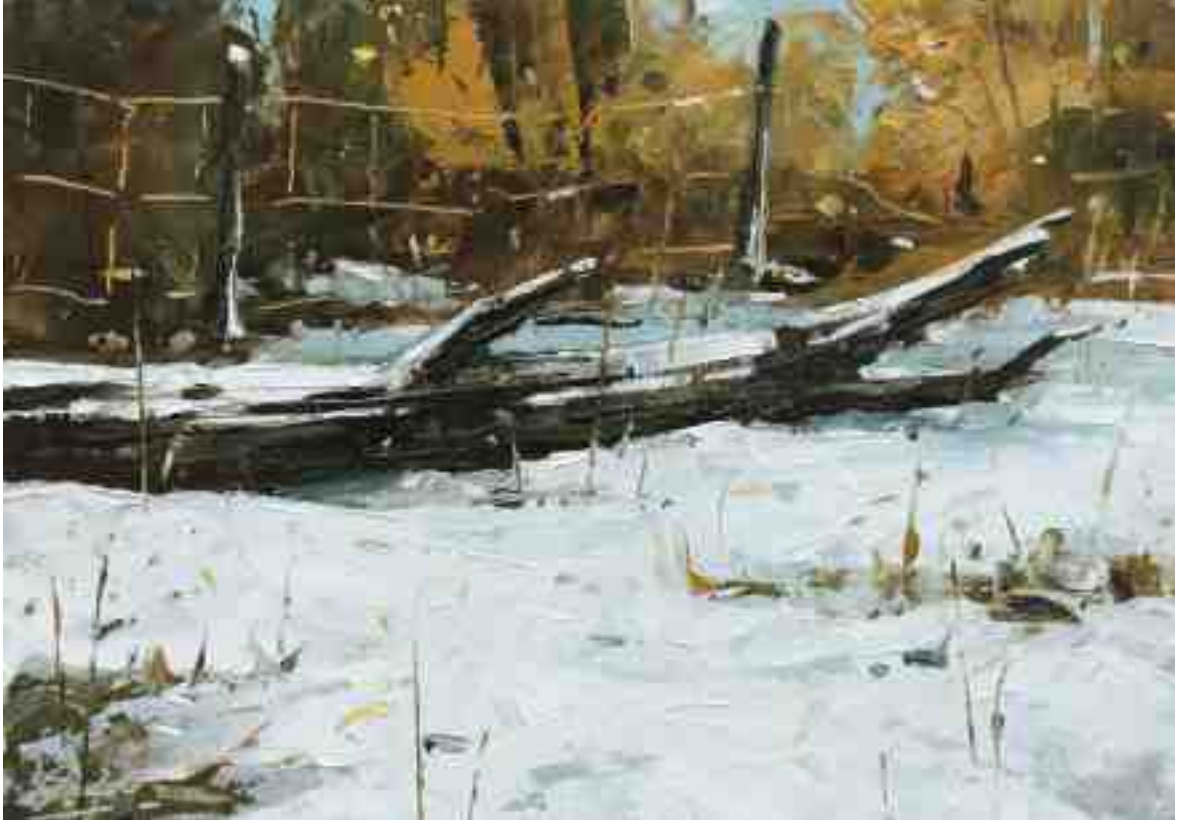
Winterstudie IV 2020 | Öl/Kt | 14 x 20 cm