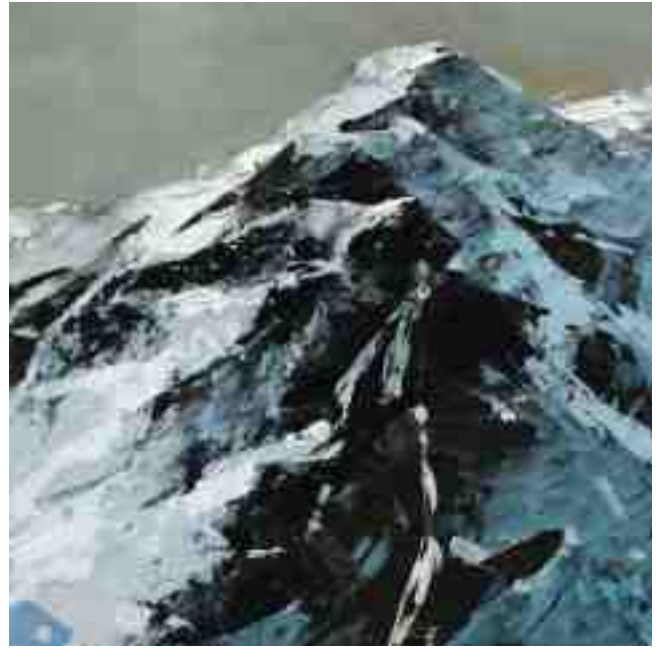
Bergwelten 005 2021 | Öl/Kt | 20 x 20 cm