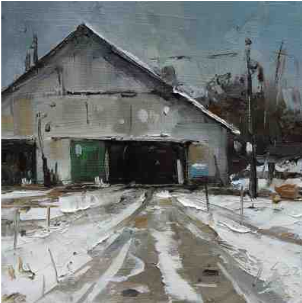
Alte Scheune im Winter V 2022 | Öl/Holz | 15 x 15 cm