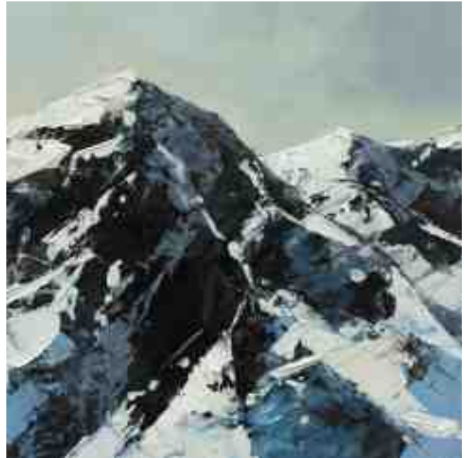
Bergwelten 006 2021 | Öl/Kt | 20 x 20 cm