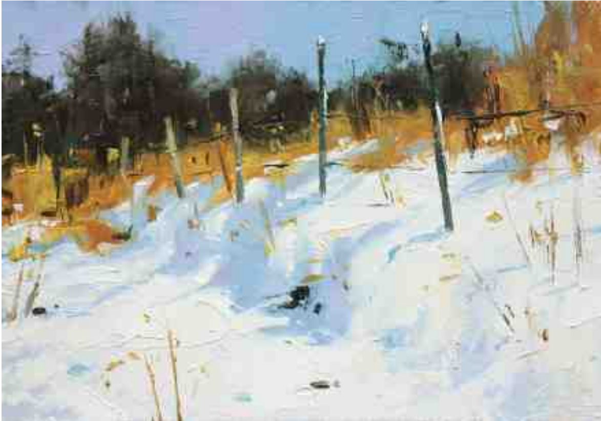
Im Sonnenlicht I 2020 | Öl/Kt | 14 x 20 cm