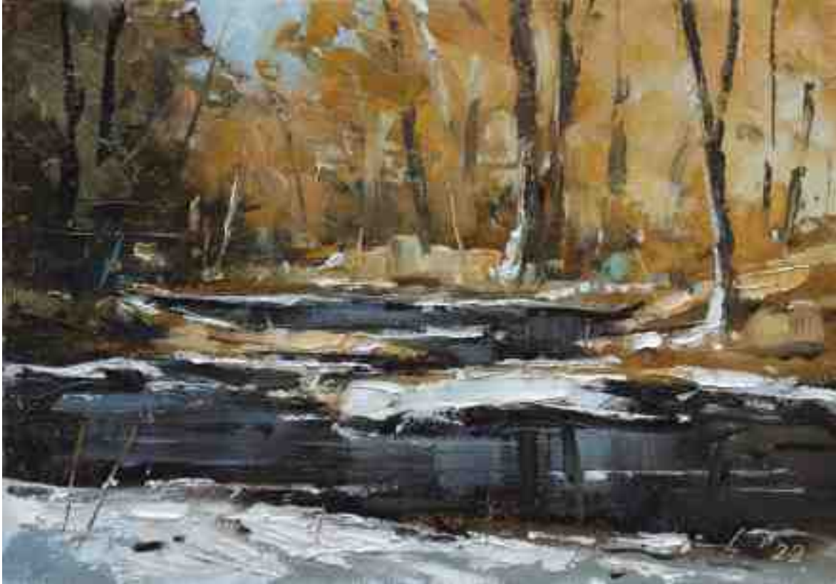
Am Bach X 2022 | Öl/Kt | 14 x 20 cm