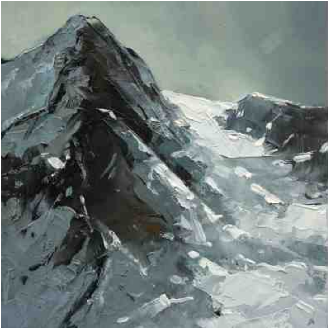
Bergwelten 013 2021 | Öl/Holz | 15 x 15 cm