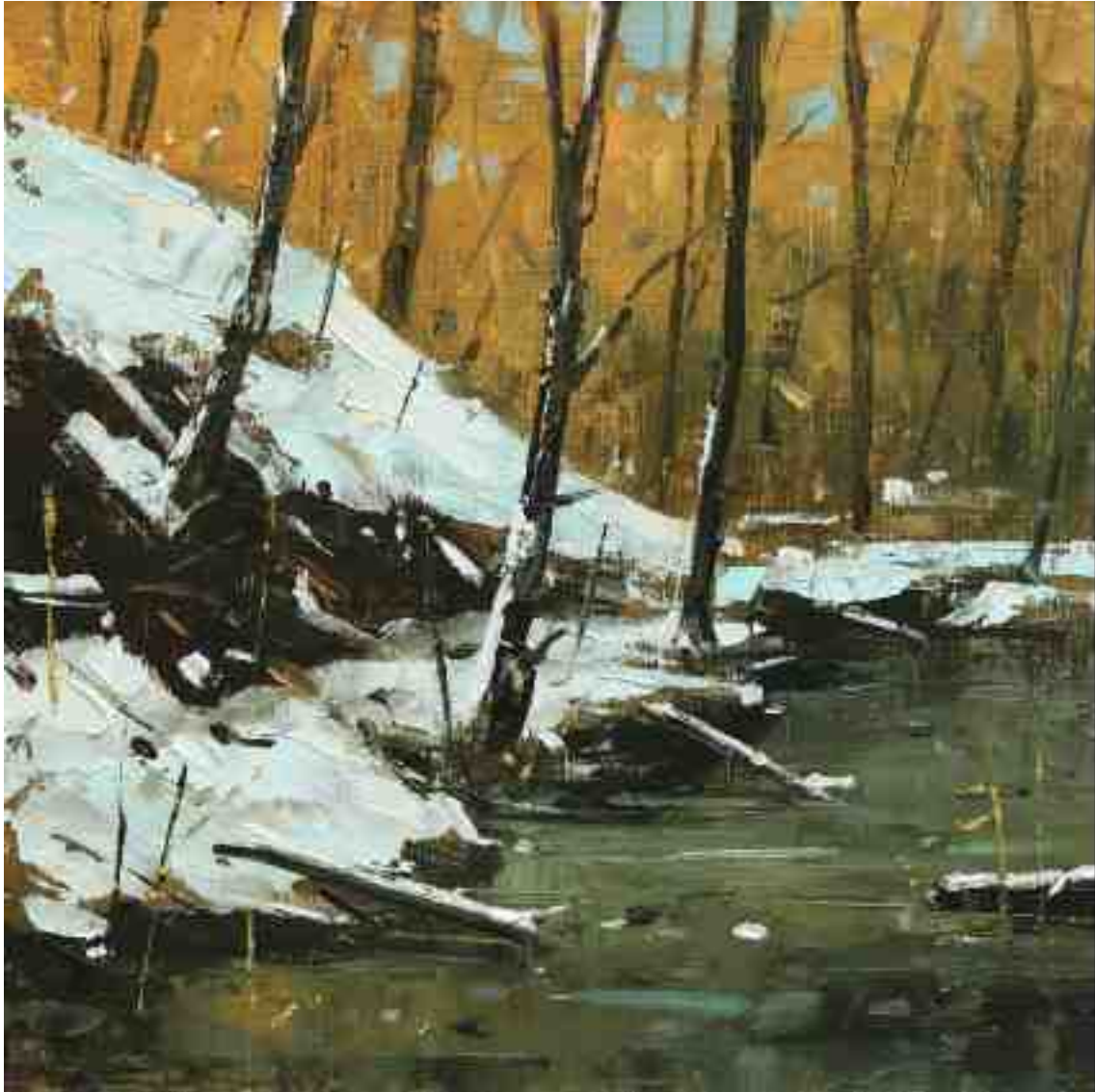
Am Bach III 2020 | Öl/Holz | 18 x 18 cm