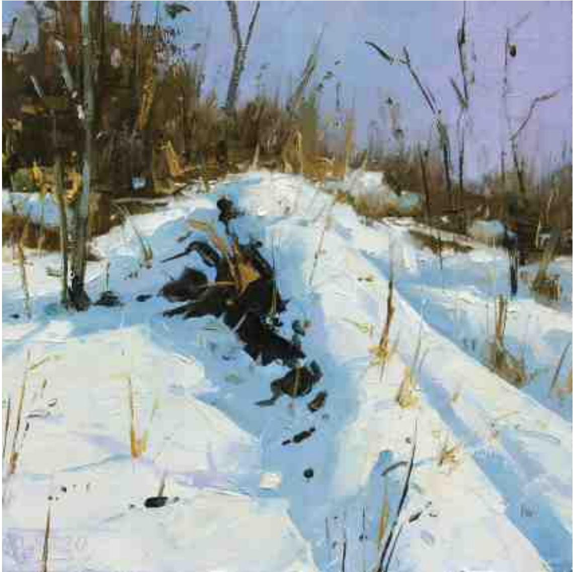
Im Sonnenlicht II 2020 | Öl/Kt | 18 x 18 cm