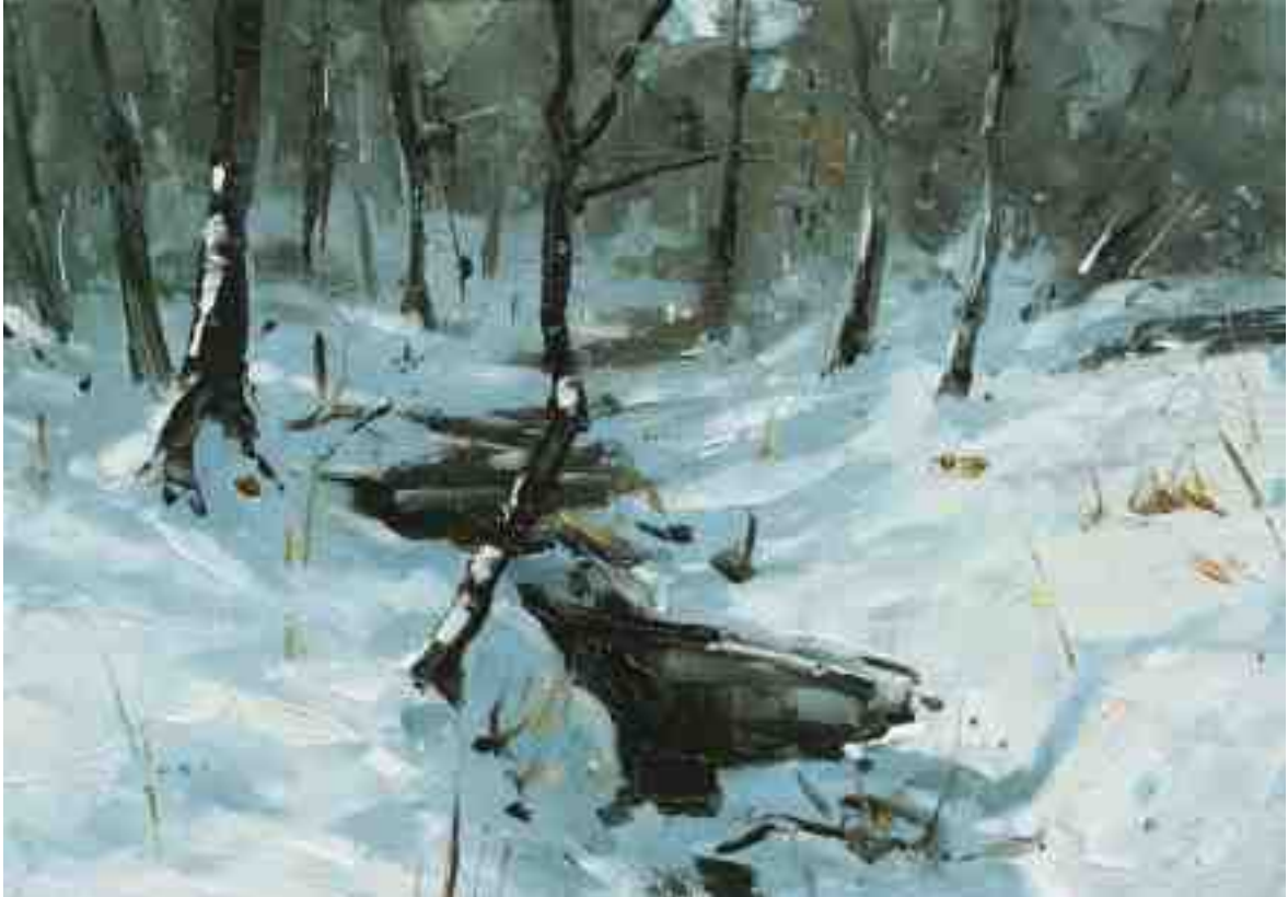
Winterstudie VI 2020 | Öl/Kt | 14 x 20 cm