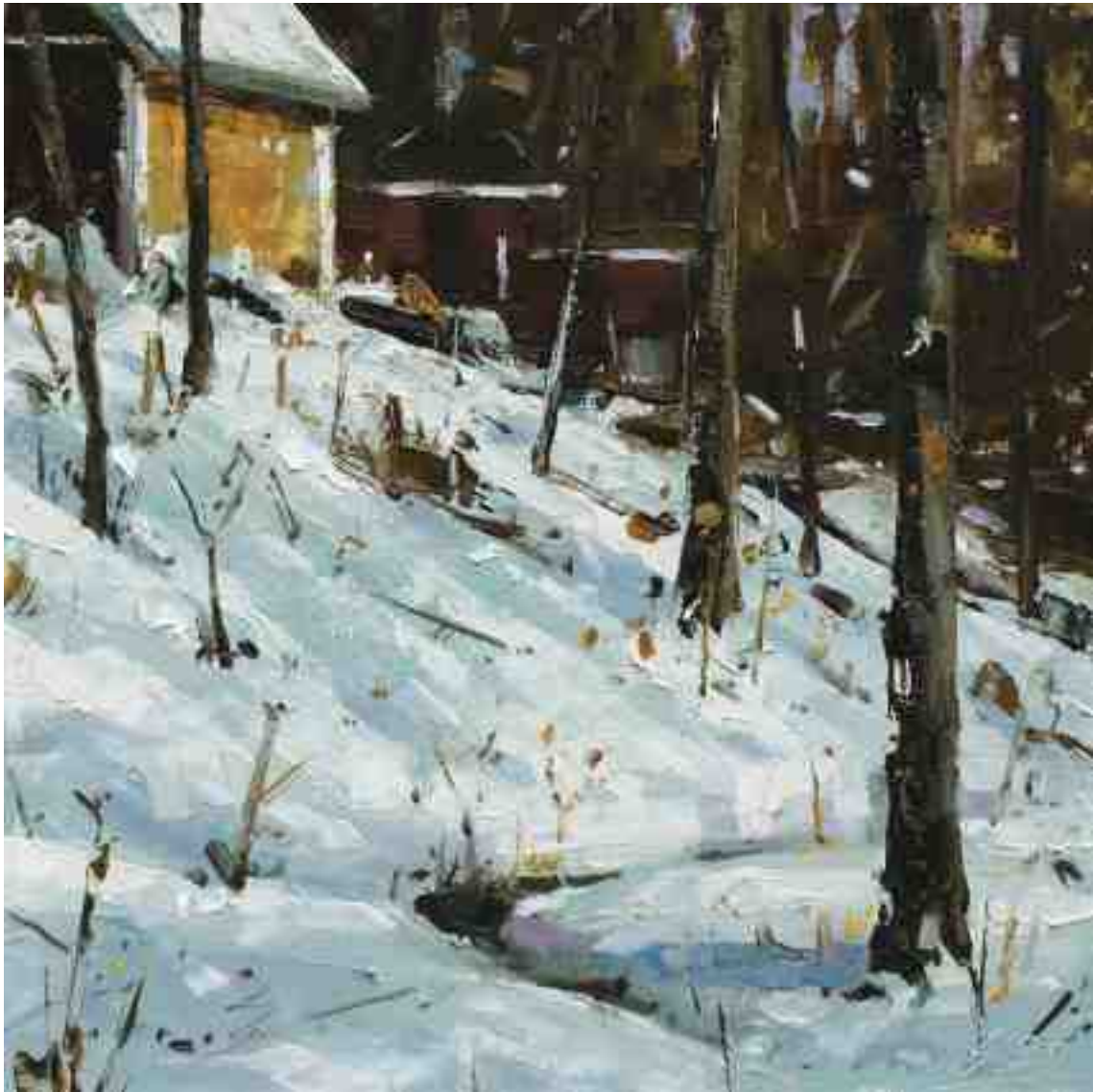
Im Wald III 2020 | Öl/Kt | 18 x 18 cm