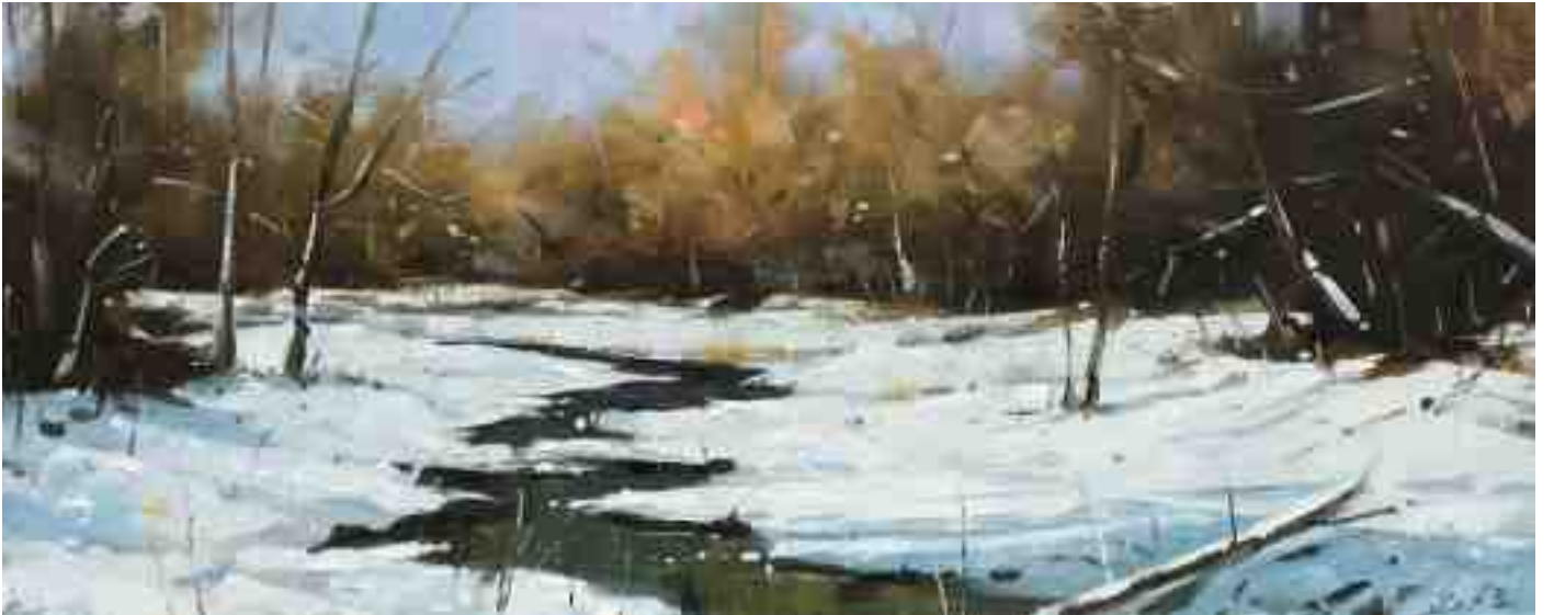
Am Bach 2020 | Öl/Holz | 18 x 45 cm