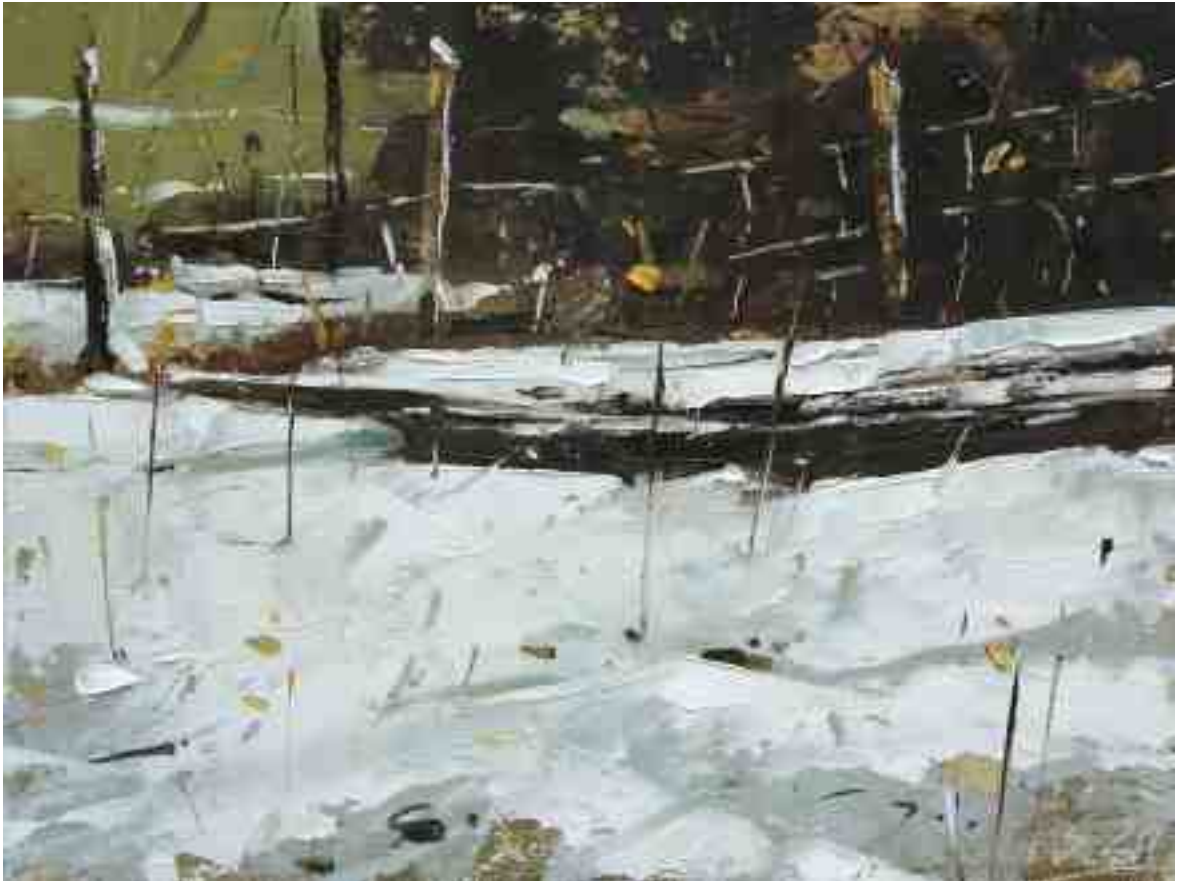
Winterstudie II 2020 | Öl/Kt | 15 x 20 cm