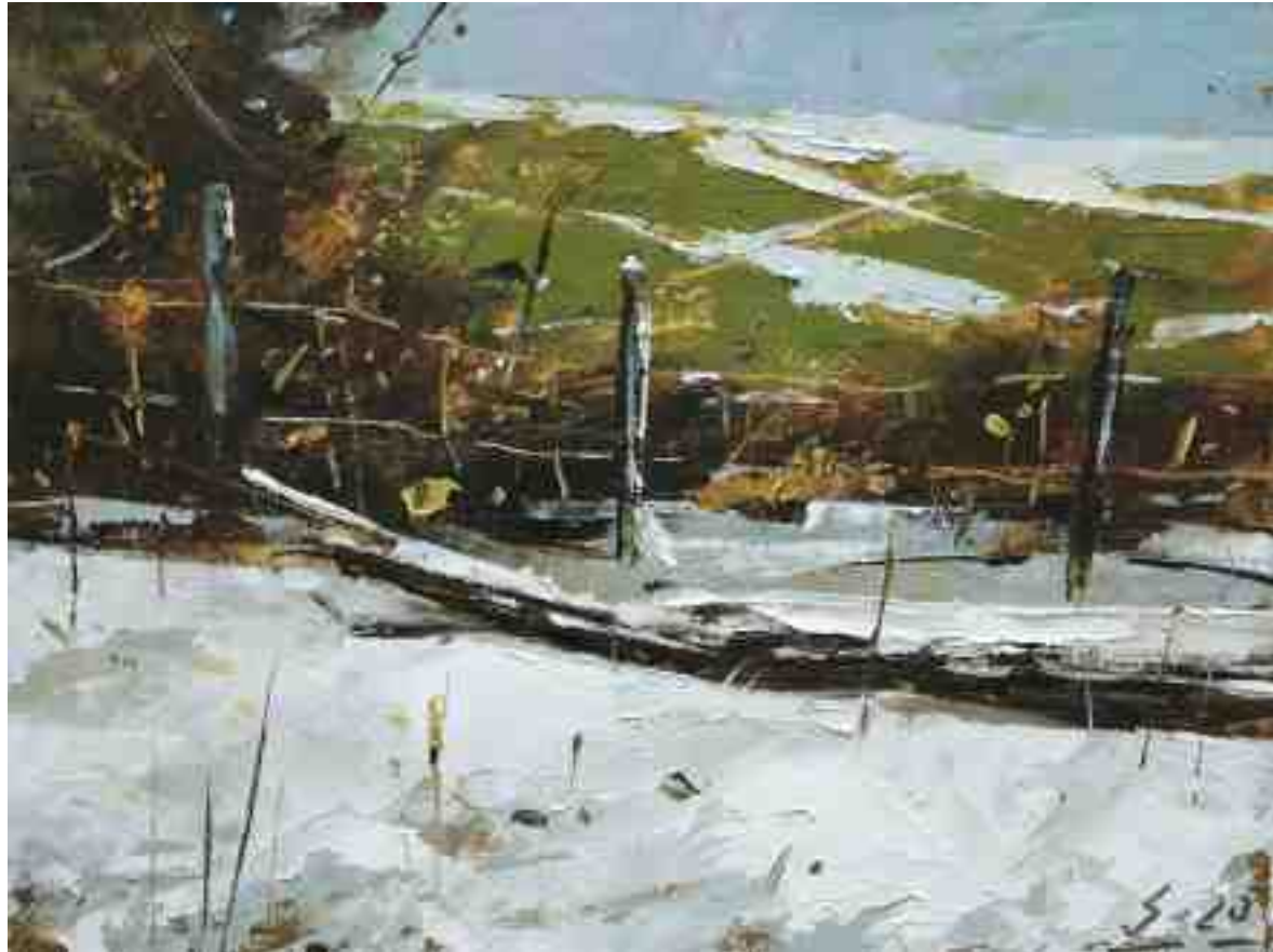
Winterstudie III 2020 | Öl/Kt | 15 x 20 cm