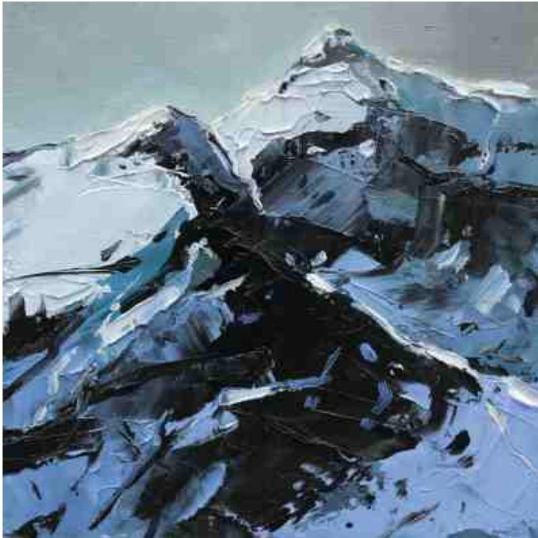
Bergwelten 012 2021 | Öl/Holz | 15 x 15 cm