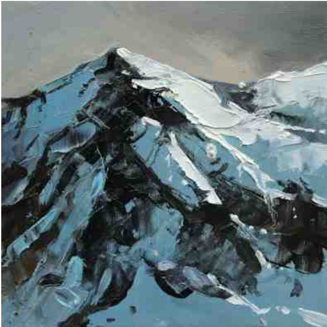
Bergwelten 009 2021 | Öl/Holz | 15 x 15 cm