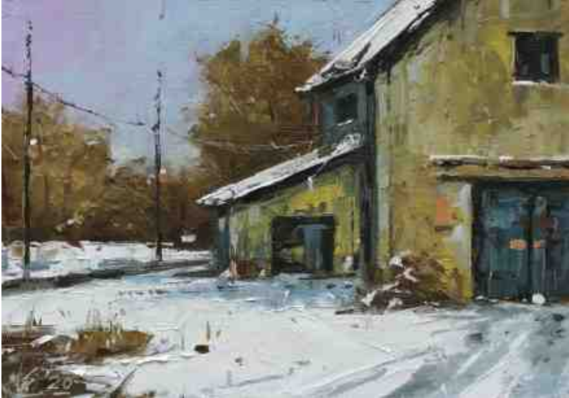
Altes Gebäude 2020 | Öl/Kt | 14 x 20 cm