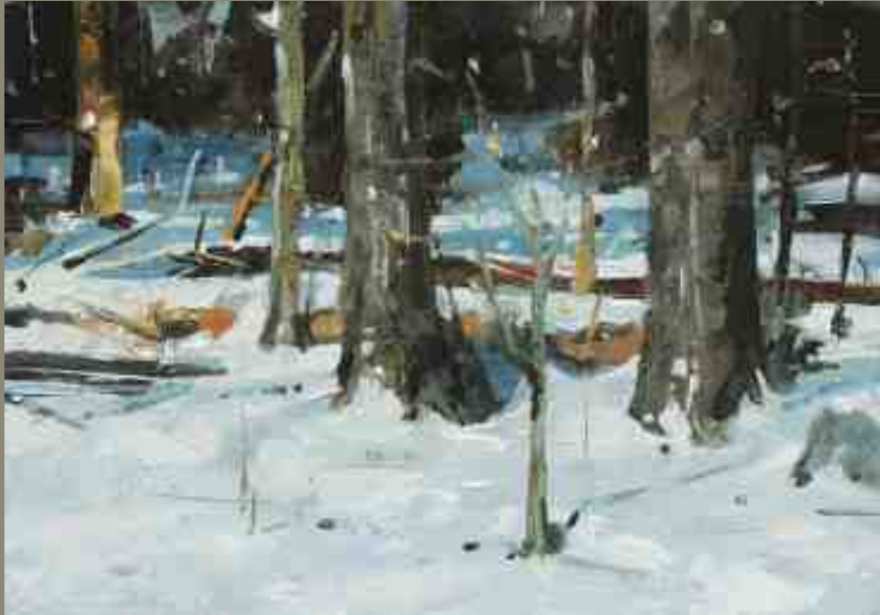
Ralf Scherfose Wintertage