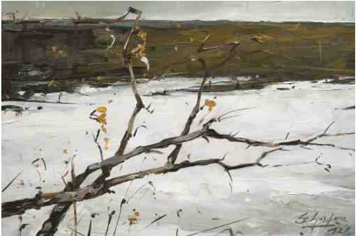
Winterspuren II 2012 | Öl/Holz | 20 x 30 cm