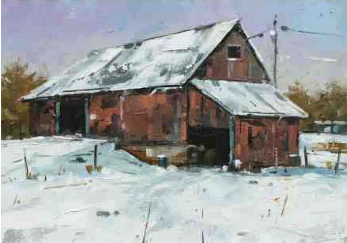
Alte Scheune im Winter III 2020 | Öl/Kt | 14 x 20 cm