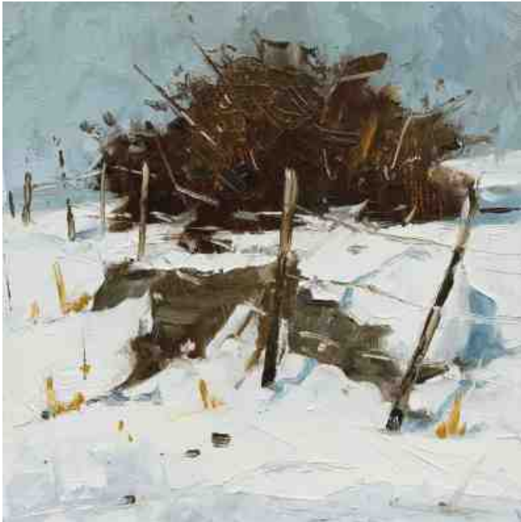
Winterstudie III 2022 | Öl/Kt | 15 x 15 cm