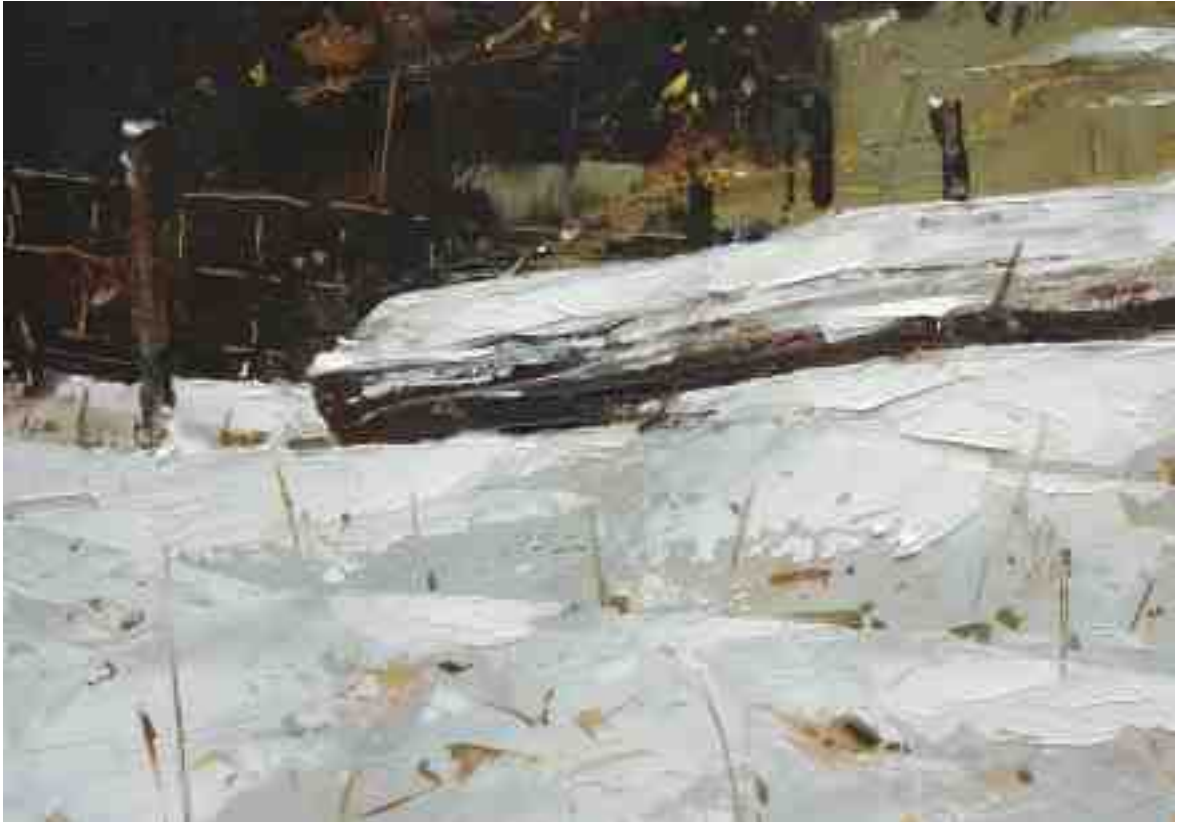
Studie Landschaft 100 2019 | Öl/Kt | 14 x 20 cm