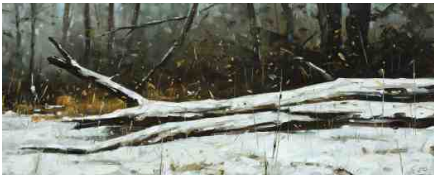
Winter am Waldrand I 2020 | Öl/Holz | 18 x 45 cm