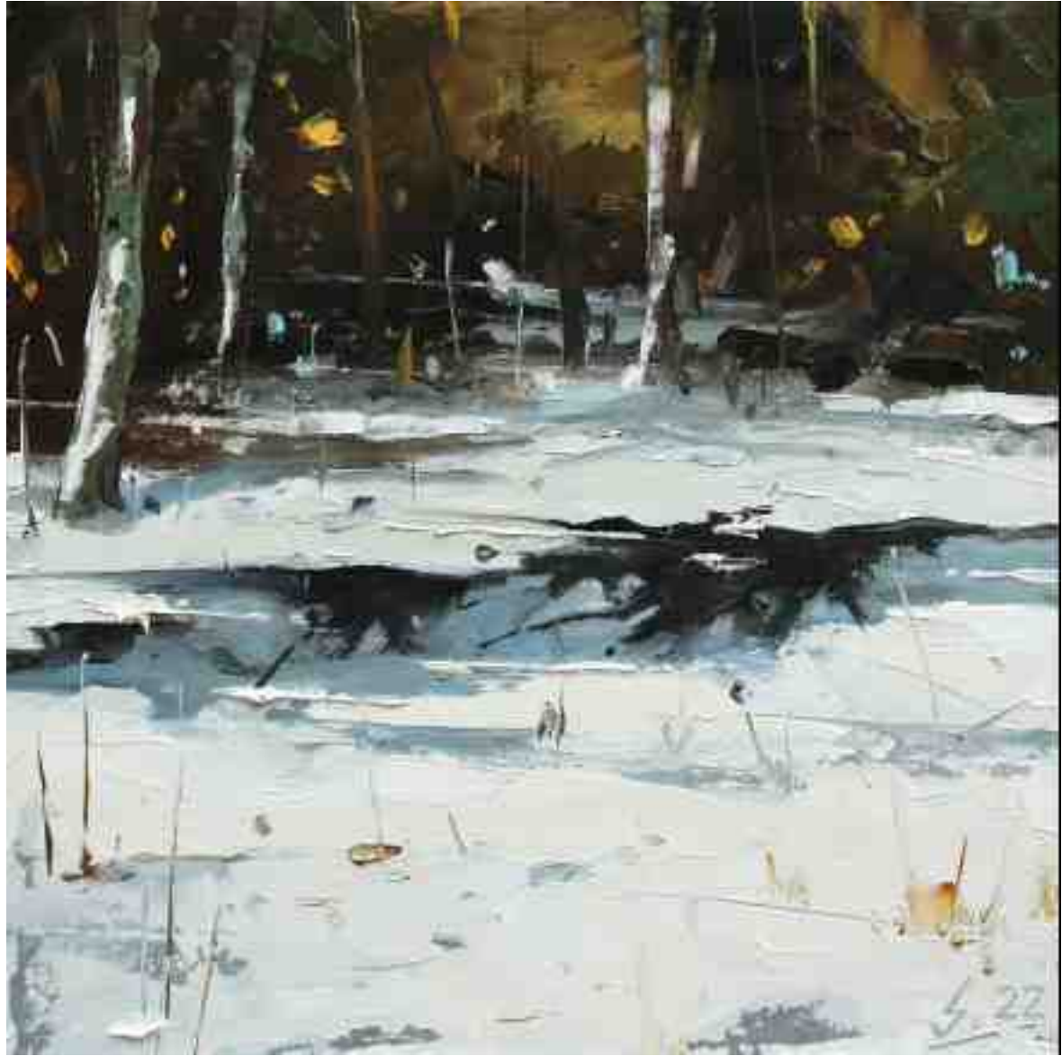
Eisloch IV 2021 | Öl/Kt | 20 x 20 cm