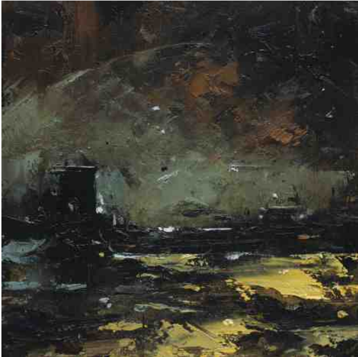
Landschaftsstudie 012 2019 | Öl/Kt | 18 x 18 cm