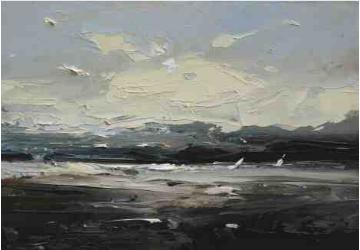
Landschaftsstudie 033 2019 | Öl/Kt | 14 x 20 cm