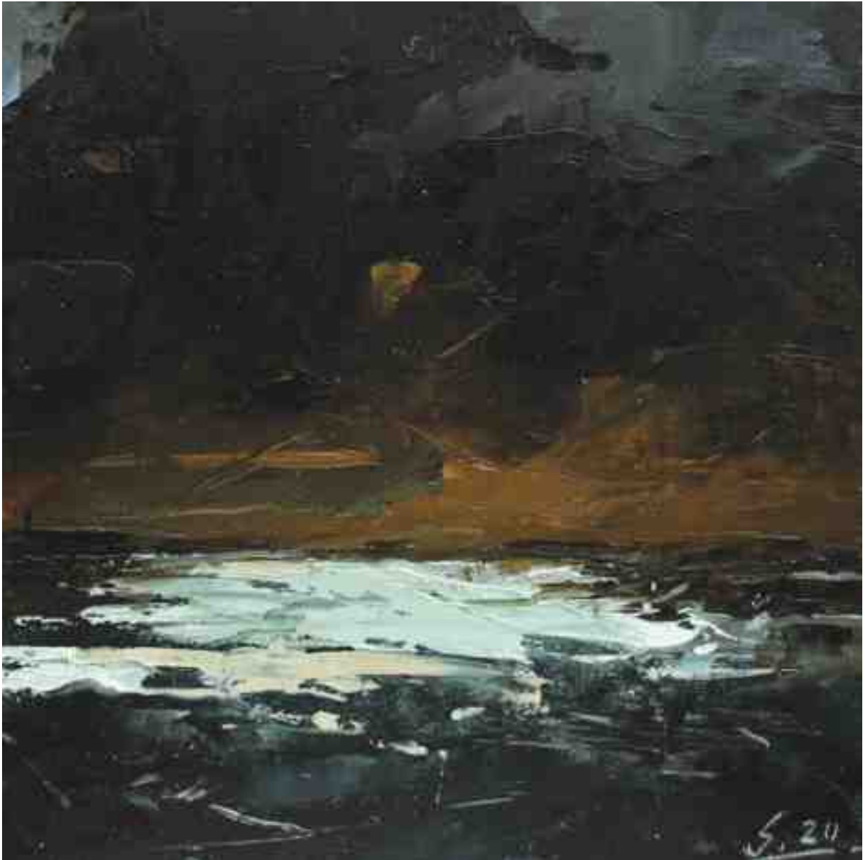
Küste X 2020 | Öl/Kt | 17 x 17 cm