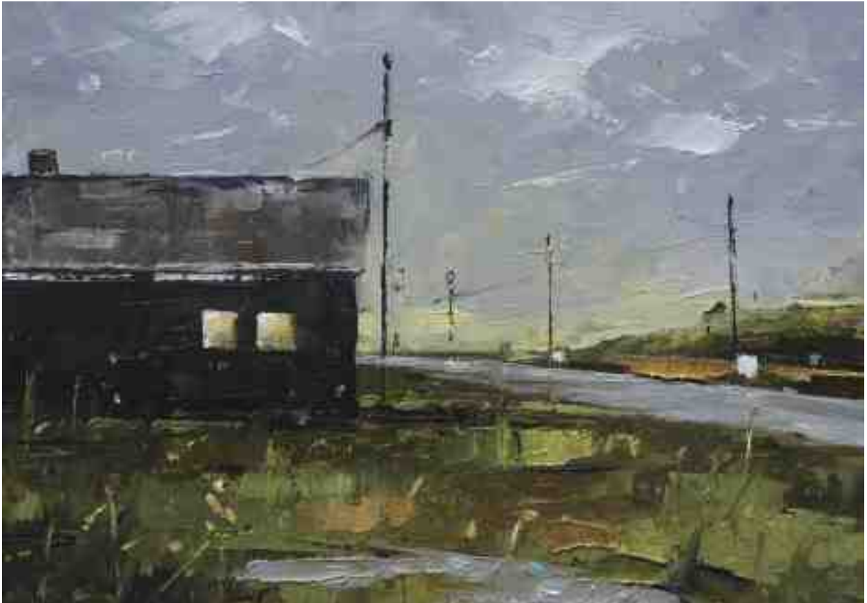
Landschaftsstudie 057 2019 | Öl/Kt | 14 x 20 cm