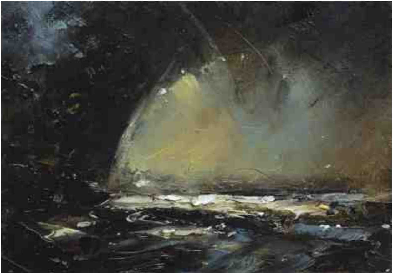
Landschaftsstudie 003 2019 | Öl/Kt | 14 x 20 cm