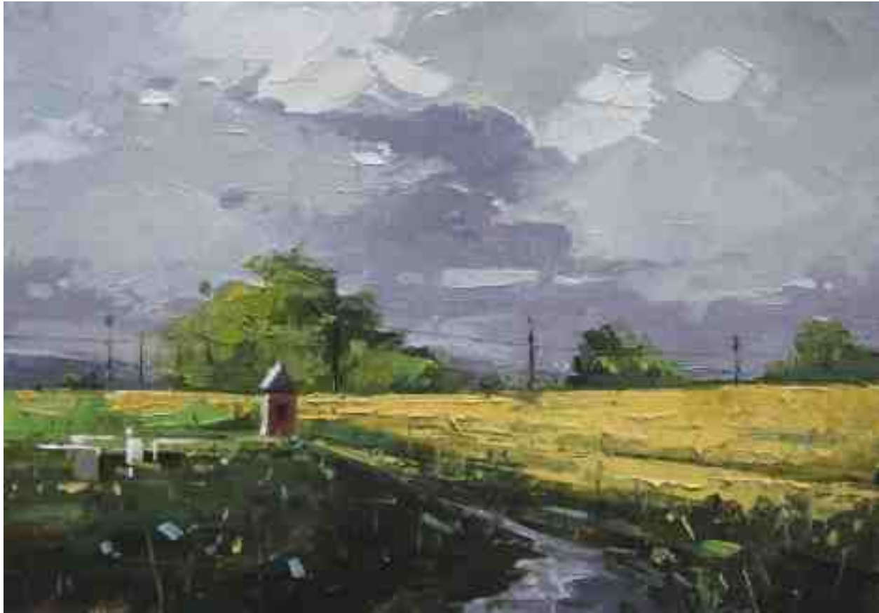
Landschaftsstudie 072 2019 | Öl/Kt | 14 x 20 cm