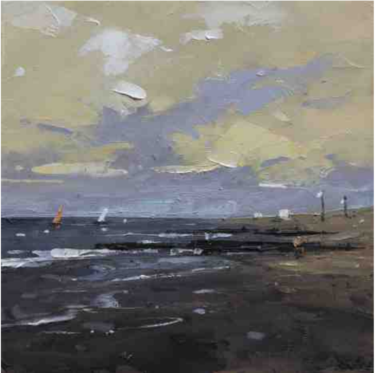
Landschaftsstudie 087 2019 | Öl/Kt | 18 x 18 cm