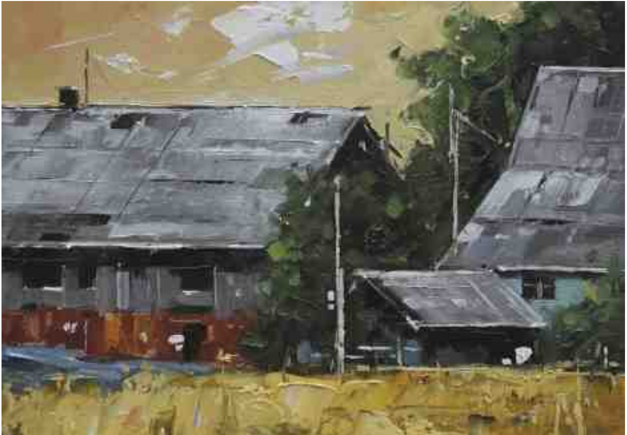
Landschaftsstudie 071 2019 | Öl/Kt | 14 x 20 cm