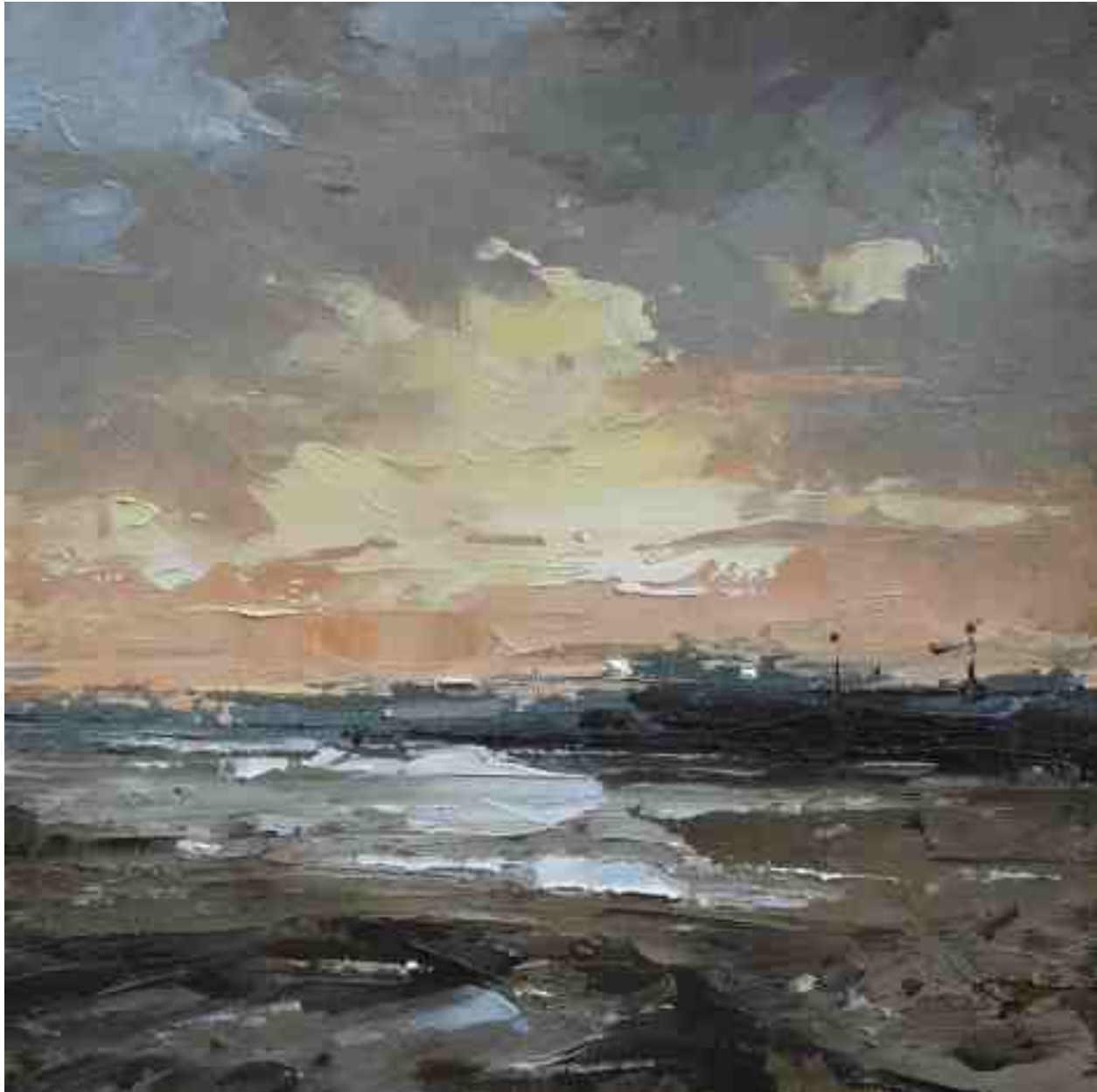
Landschaftsstudie 028 2019 | Öl/Kt | 18 x 18 cm