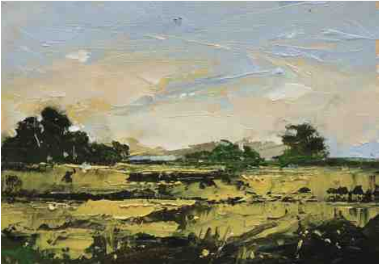
Landschaftsstudie 023 2019 | Öl/Kt | 14 x 20 cm