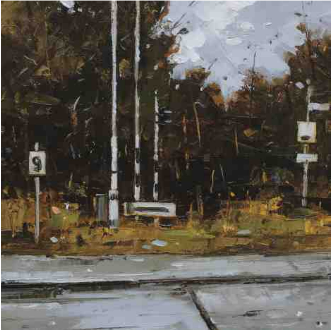
Landschaftsstudie 097 2019 | Öl/Kt | 18 x 18 cm