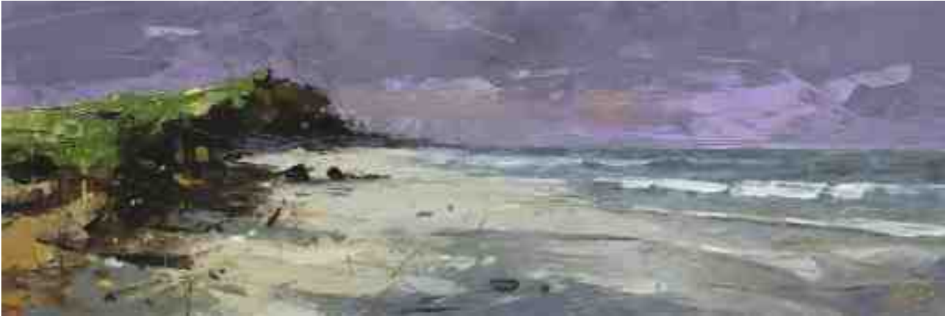
Küste XXXII 2020 | Öl/Kt | 10 x 30 cm