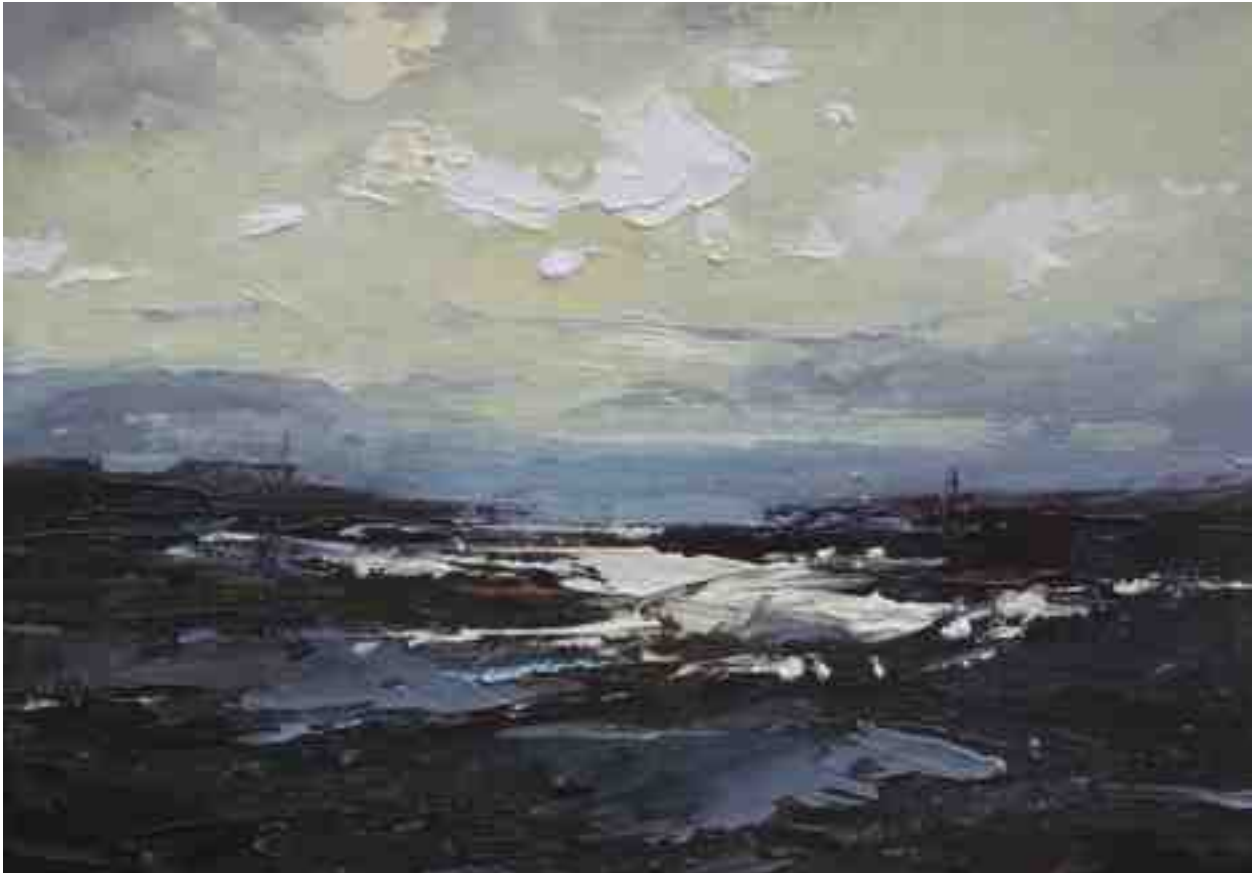
Landschaftsstudie 043 2019 | Öl/Kt | 14 x 20 cm