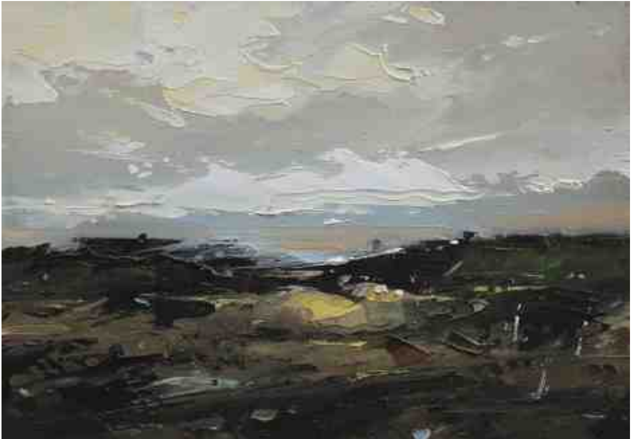
Landschaftsstudie 031 2019 | Öl/Kt | 14 x 20 cm