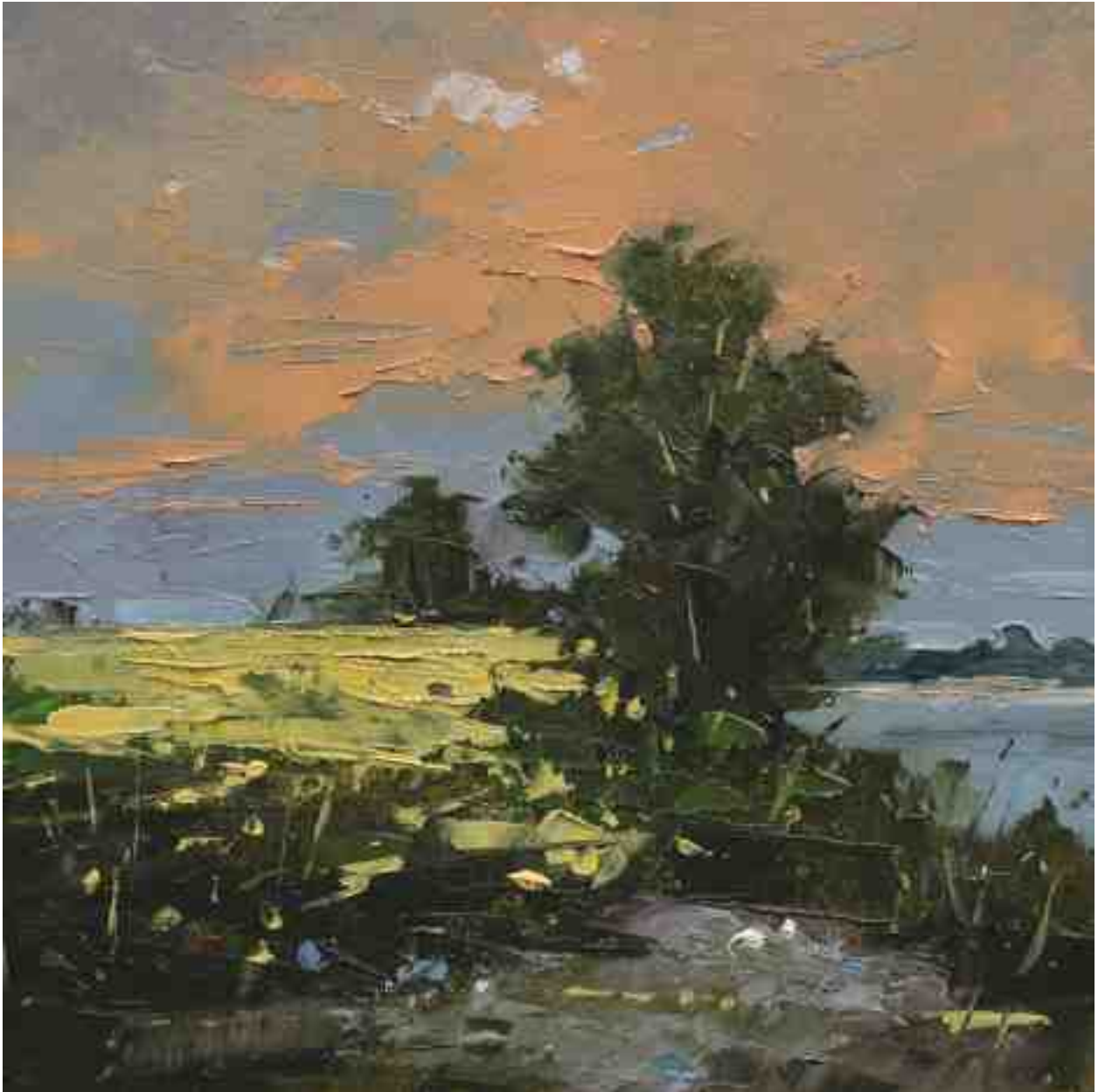
Landschaftsstudie 055 2019 | Öl/Kt | 18 x 18 cm