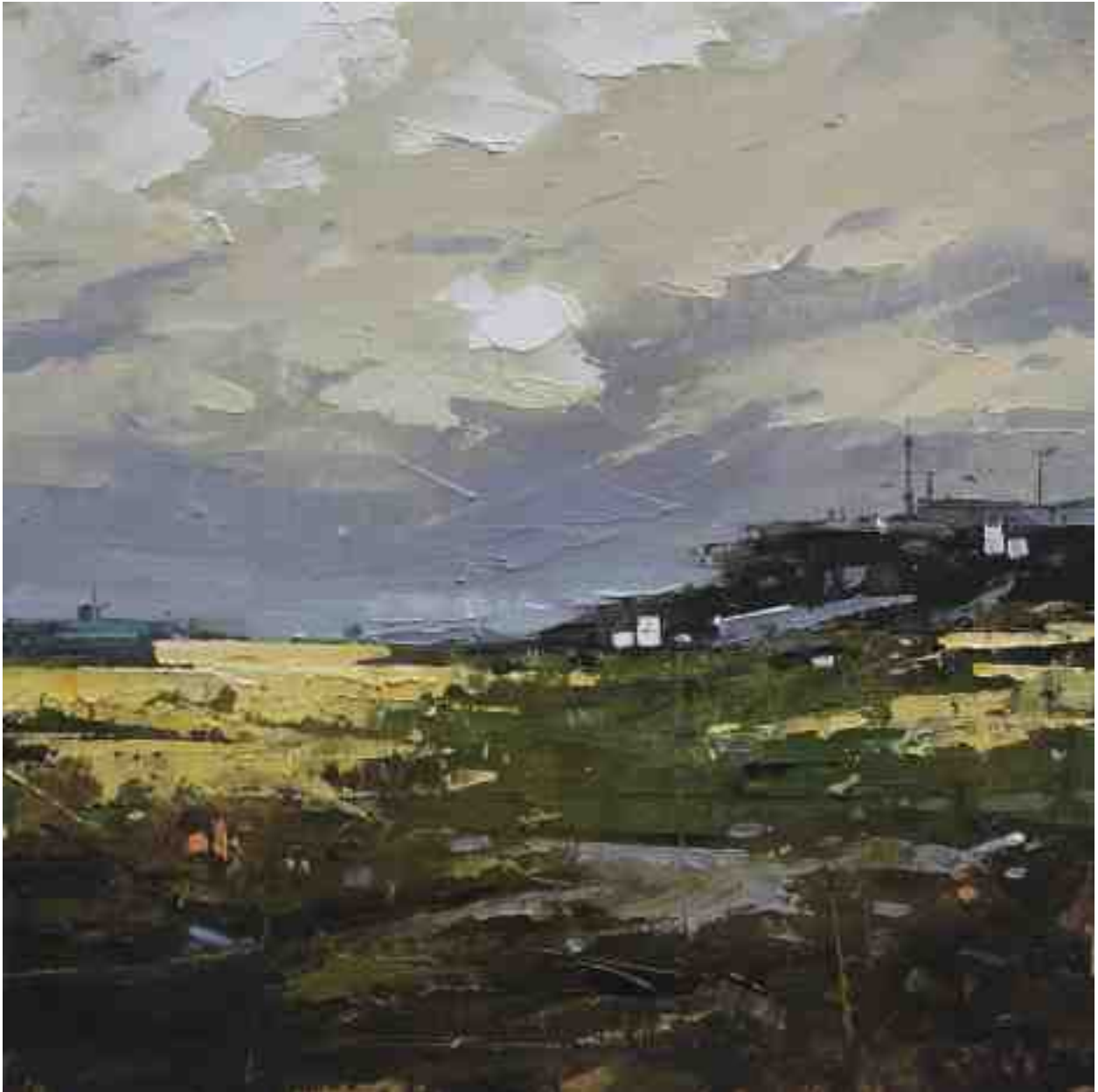
Landschaftsstudie 089 2019 | Öl/Kt | 18 x 18 cm