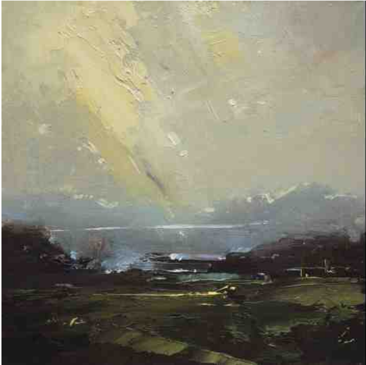
Landschaftsstudie 050 2019 | Öl/Kt | 18 x 18 cm