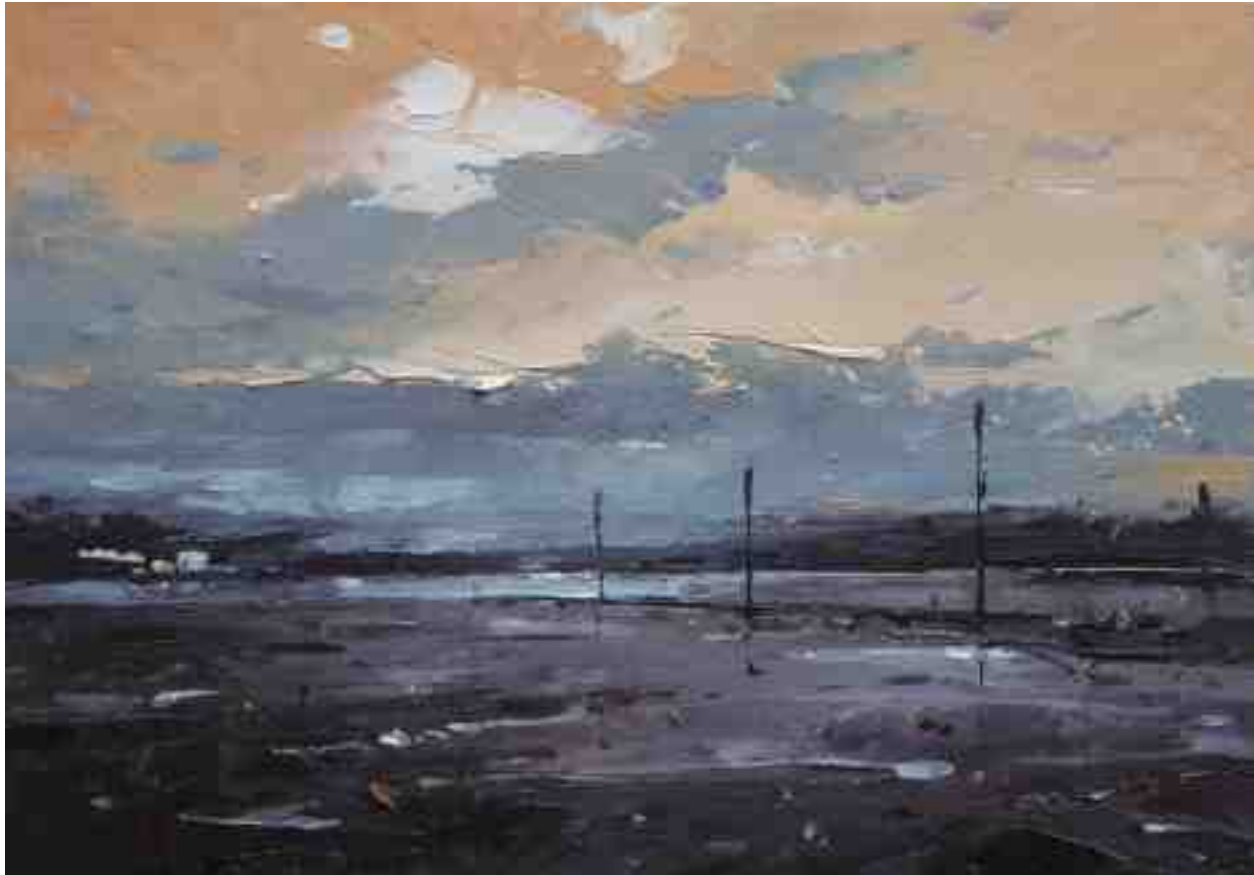
Landschaftsstudie 074 2019 | Öl/Kt | 14 x 20 cm