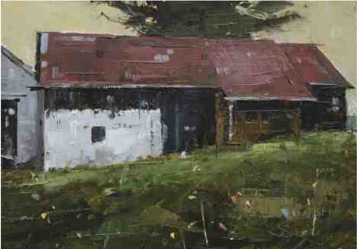
Landschaftsstudie 059 2019 | Öl/Kt | 14 x 20 cm