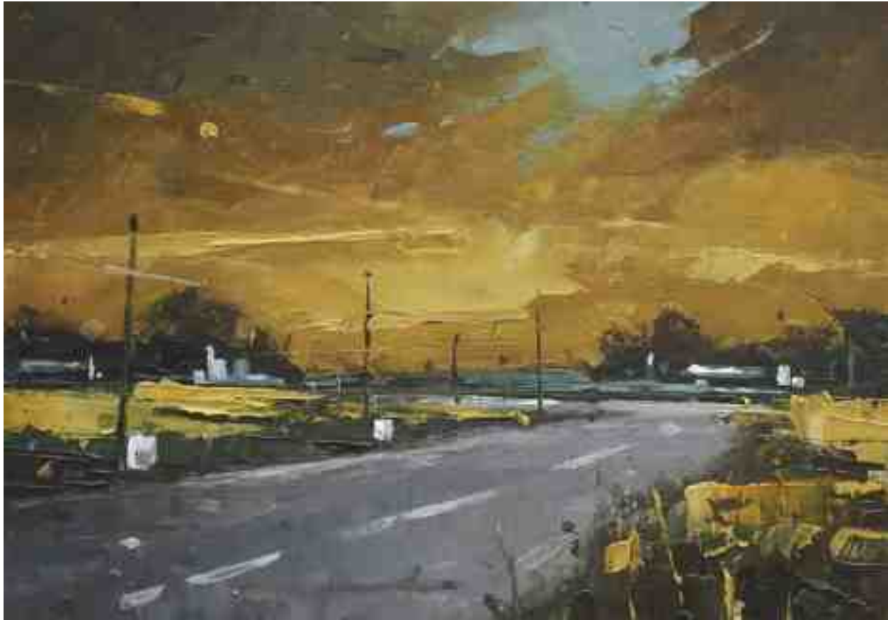
Landschaftsstudie 070 2019 | Öl/Kt | 14 x 20 cm