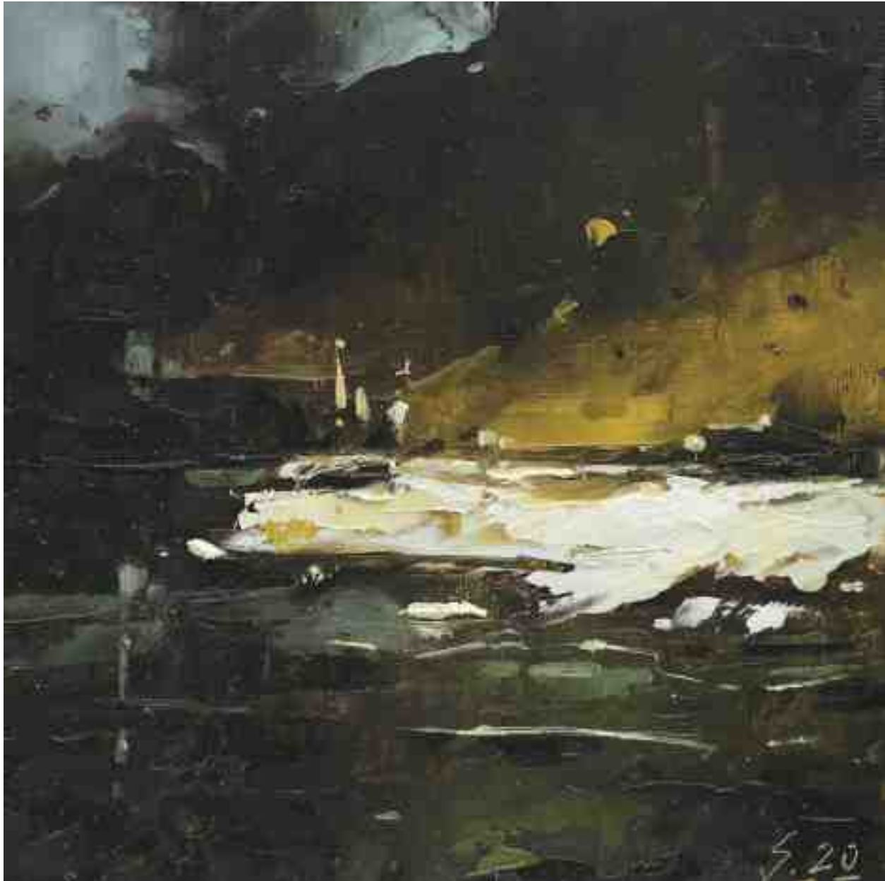
Küste XIII 2020 | Öl/Kt | 17 x 17 cm