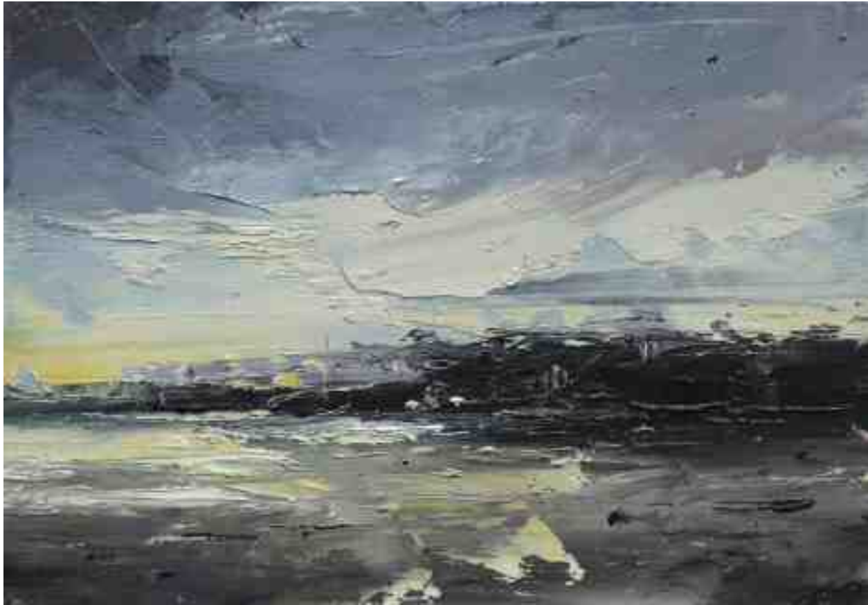
Landschaftsstudie 004 2019 | Öl/Kt | 14 x 20 cm