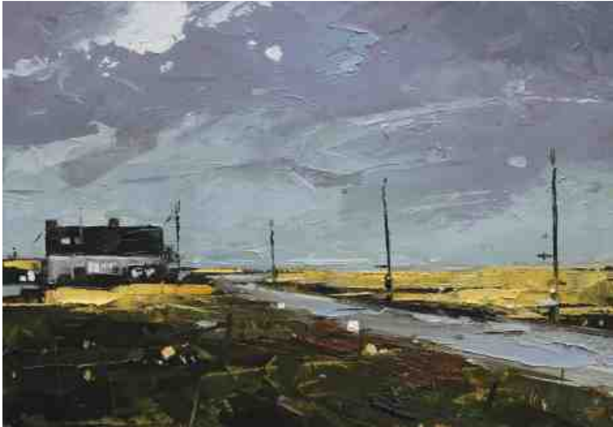
Landschaftsstudie 092 2019 | Öl/Kt | 14 x 20 cm