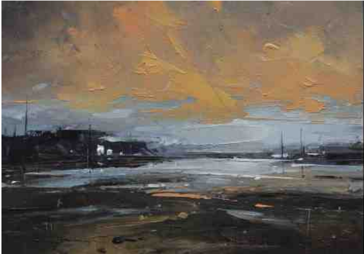
Landschaftsstudie 068 2019 | Öl/Kt | 14 x 20 cm