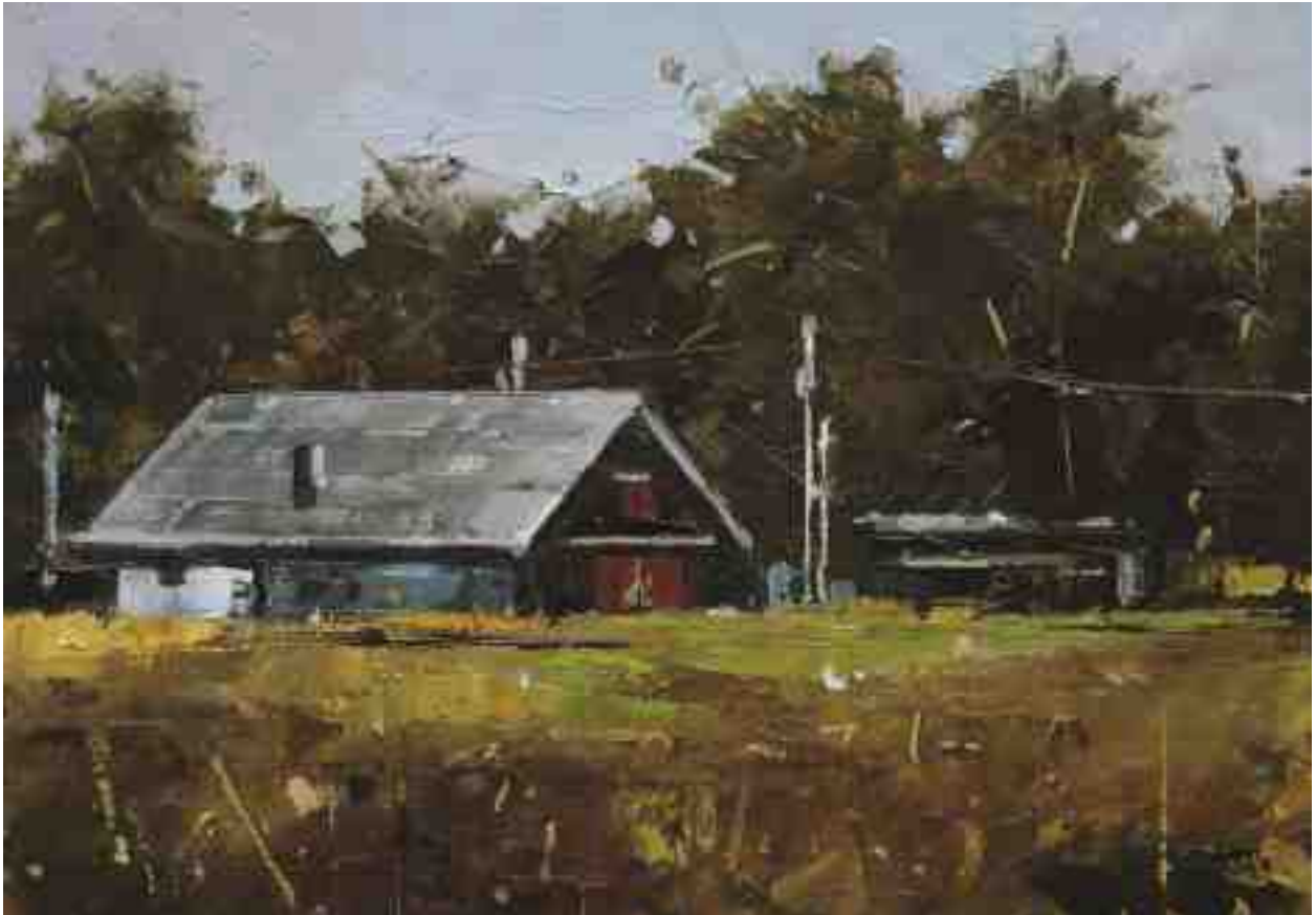
Landschaftsstudie 099 2019 | Öl/Kt | 14 x 20 cm