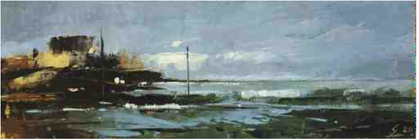
Küste XXIX 2020 | Öl/Kt | 10 x 30 cm