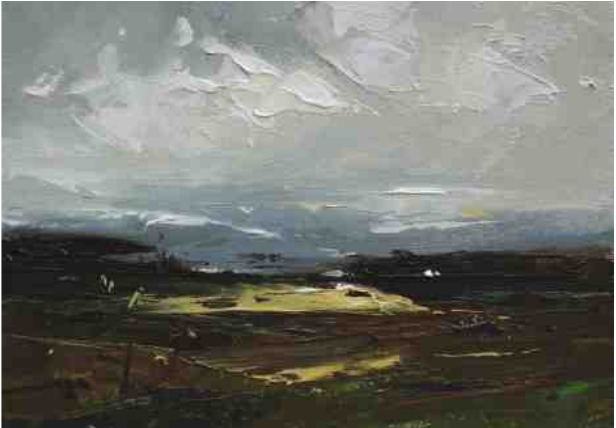
Landschaftsstudie 037 2019 | Öl/Kt | 14 x 20 cm