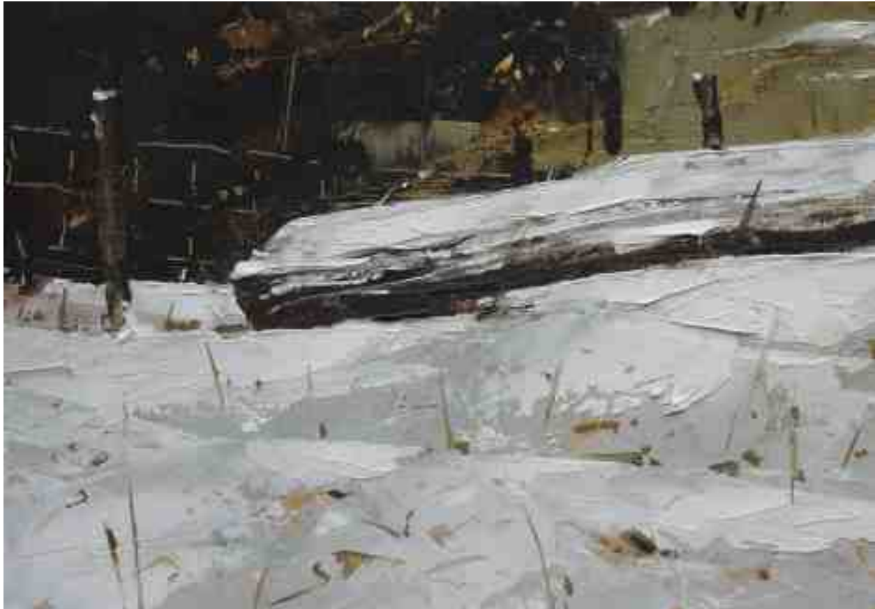
Landschaftsstudie 100 2019 | Öl/Kt | 14 x 20 cm