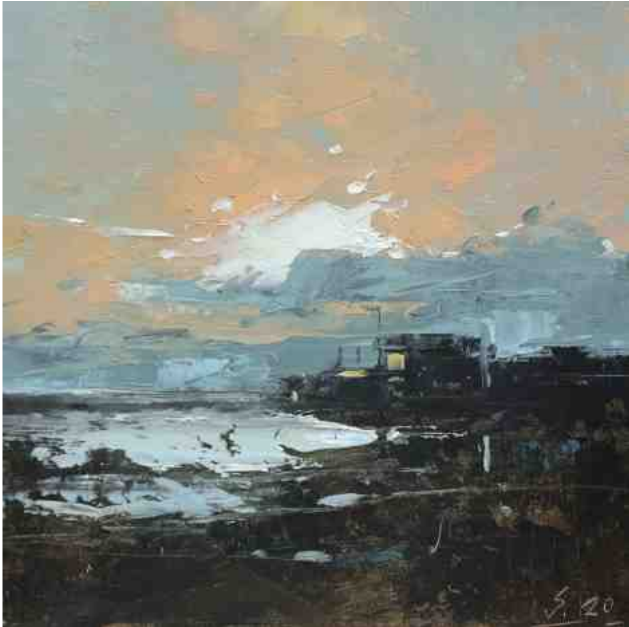
Küste XVII 2020 | Öl/Kt | 17 x 17 cm