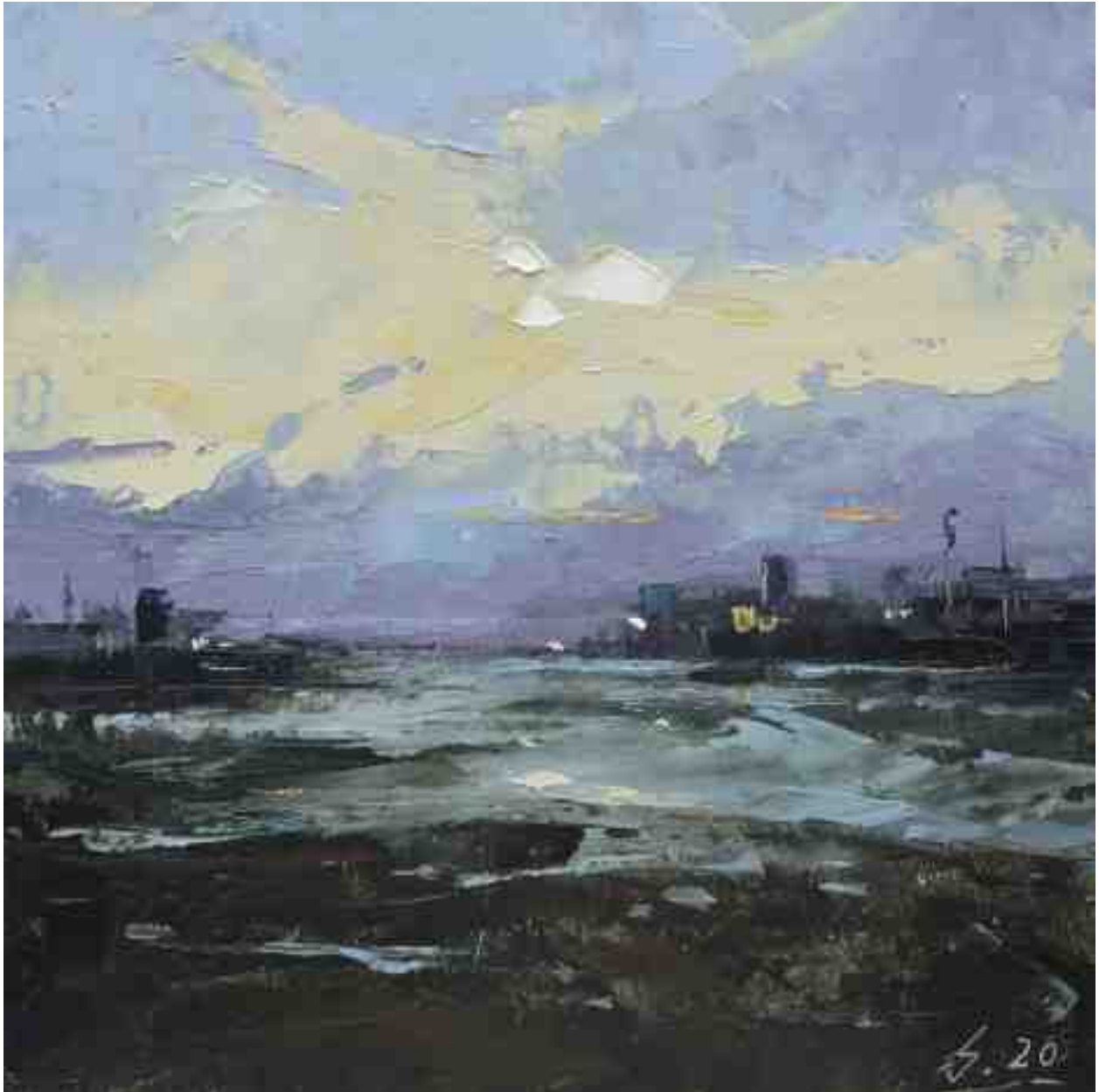
Küste XVIII 2020 | Öl/Kt | 17 x 17 cm