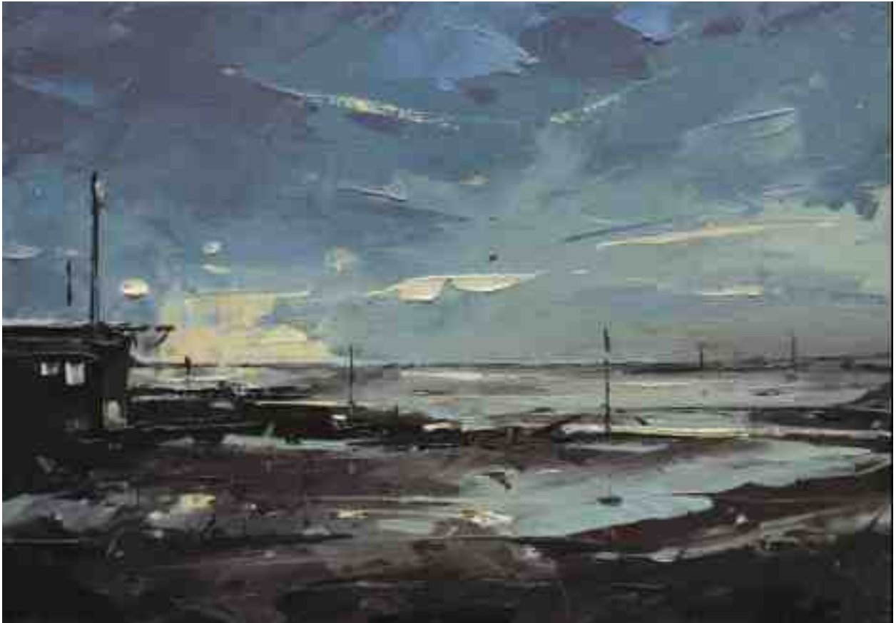
Landschaftsstudie 093 2019 | Öl/Kt | 14 x 20 cm