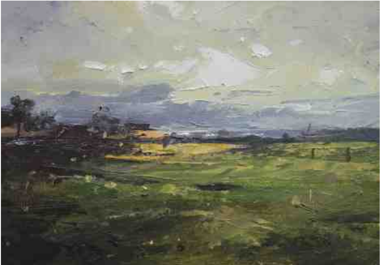
Landschaftsstudie 041 2019 | Öl/Kt | 14 x 20 cm