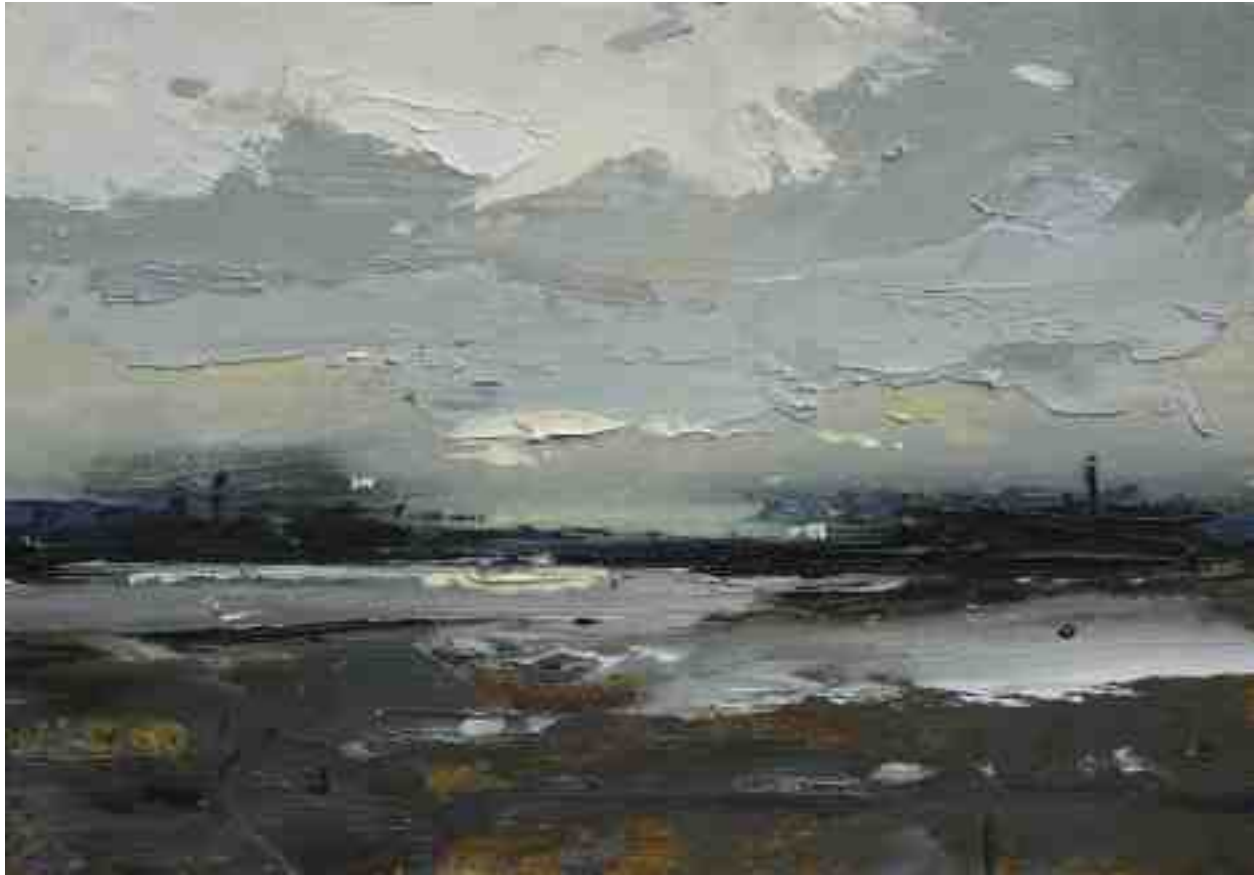
Landschaftsstudie 036 2019 | Öl/Kt | 14 x 20 cm