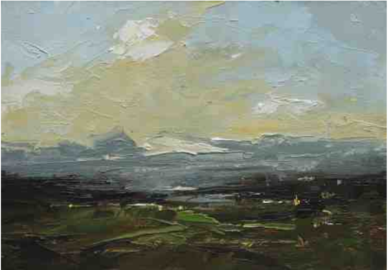
Landschaftsstudie 015 2019 | Öl/Kt | 14 x 20 cm