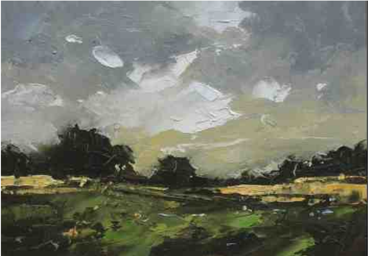
Landschaftsstudie 019 2019 | Öl/Kt | 14 x 20 cm