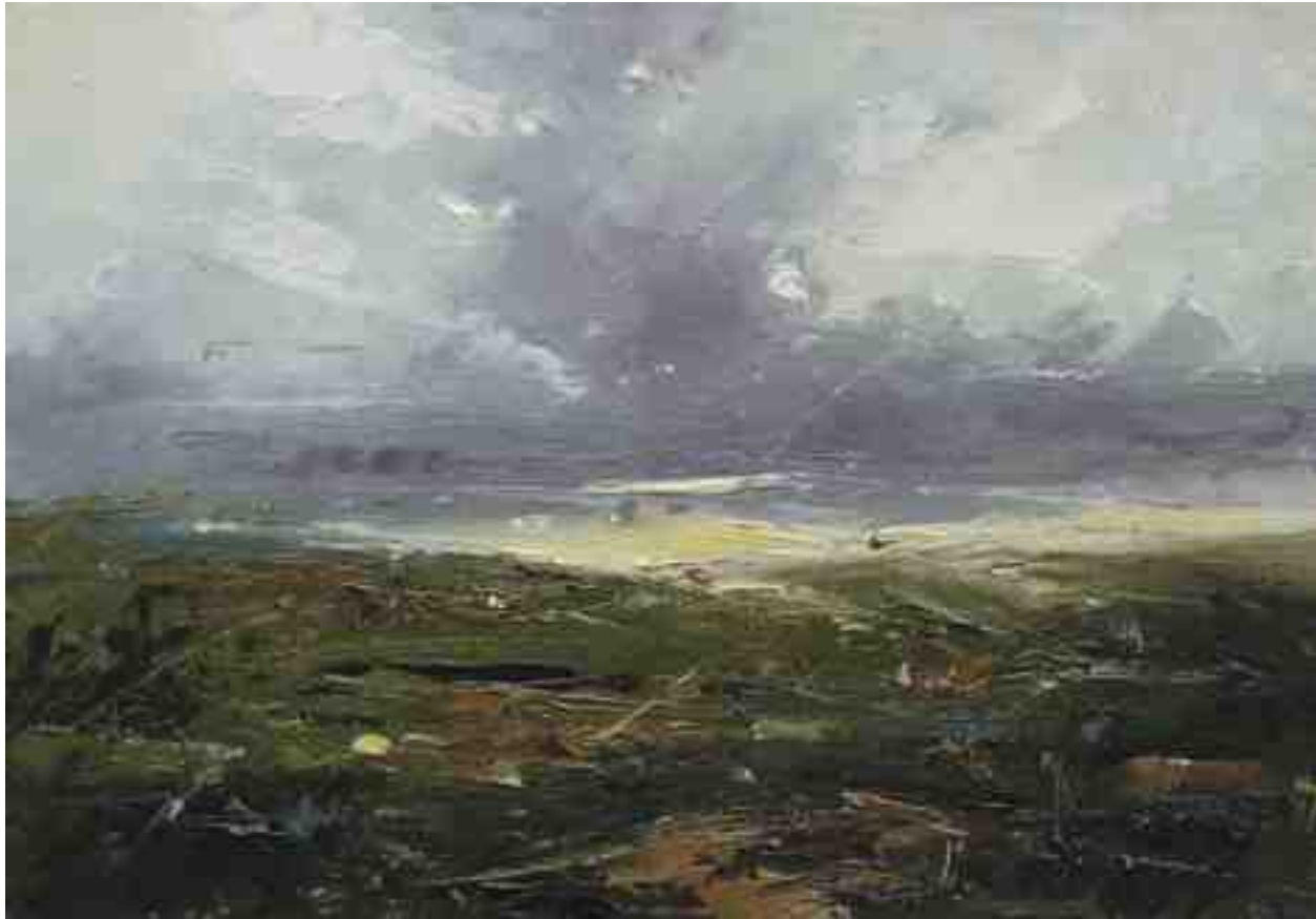
Landschaftsstudie 008 2019 | Öl/Kt | 14 x 20 cm