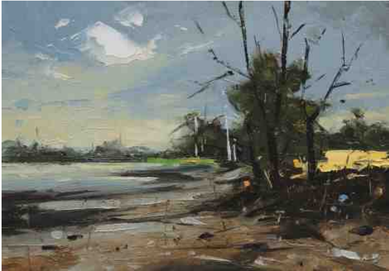
Landschaftsstudie 086 2019 | Öl/Kt | 14 x 20 cm