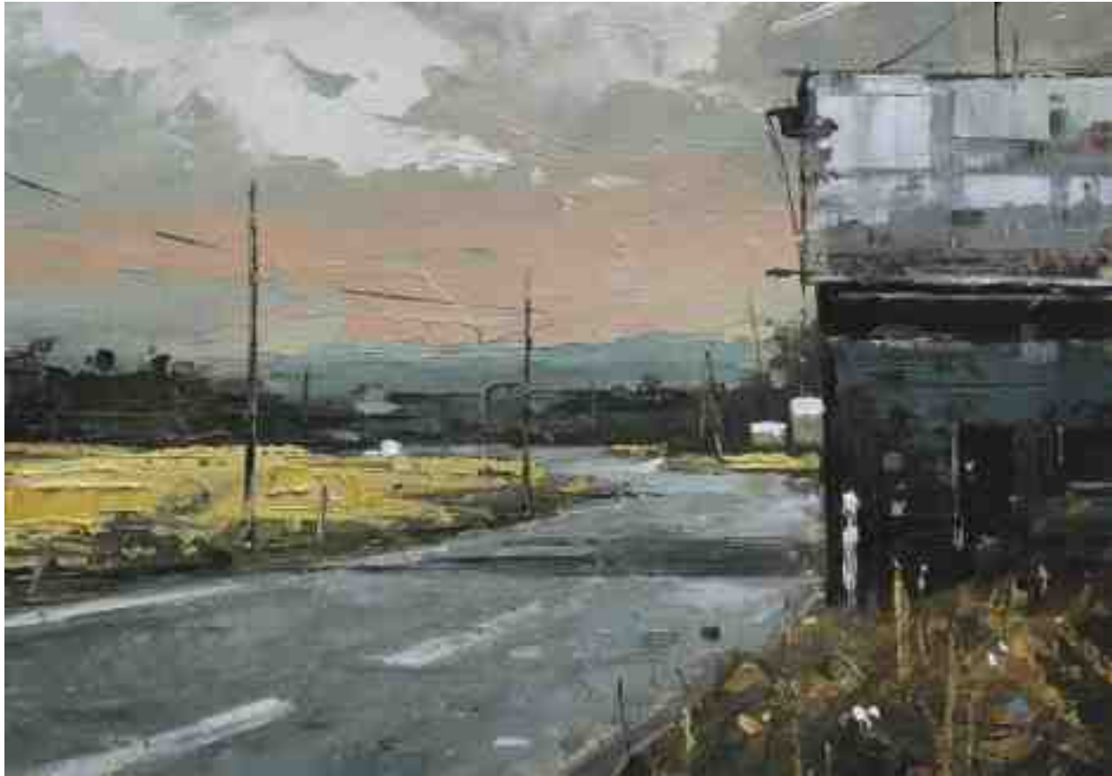
Landschaftsstudie 064 2019 | Öl/Kt | 14 x 20 cm