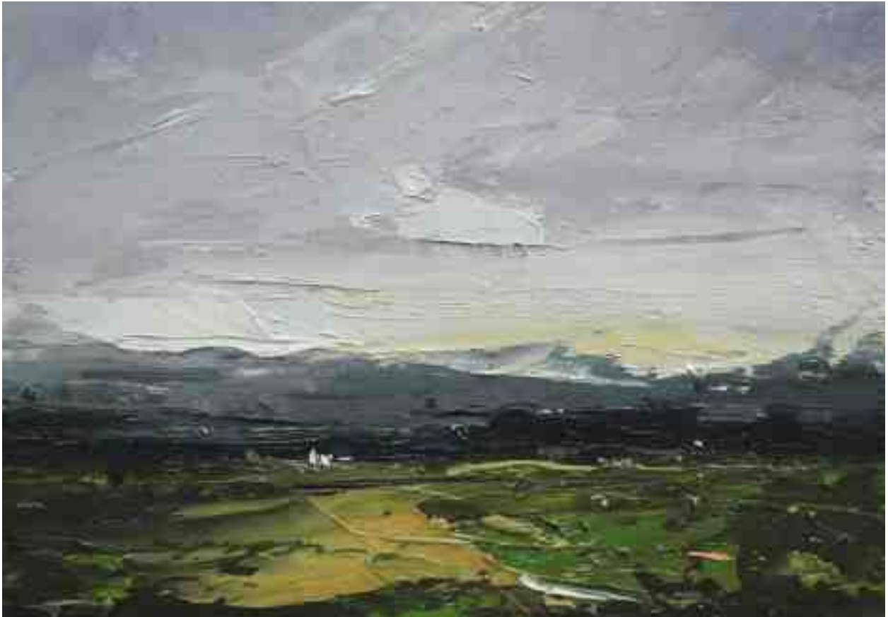
Landschaftsstudie 009 2019 | Öl/Kt | 14 x 20 cm