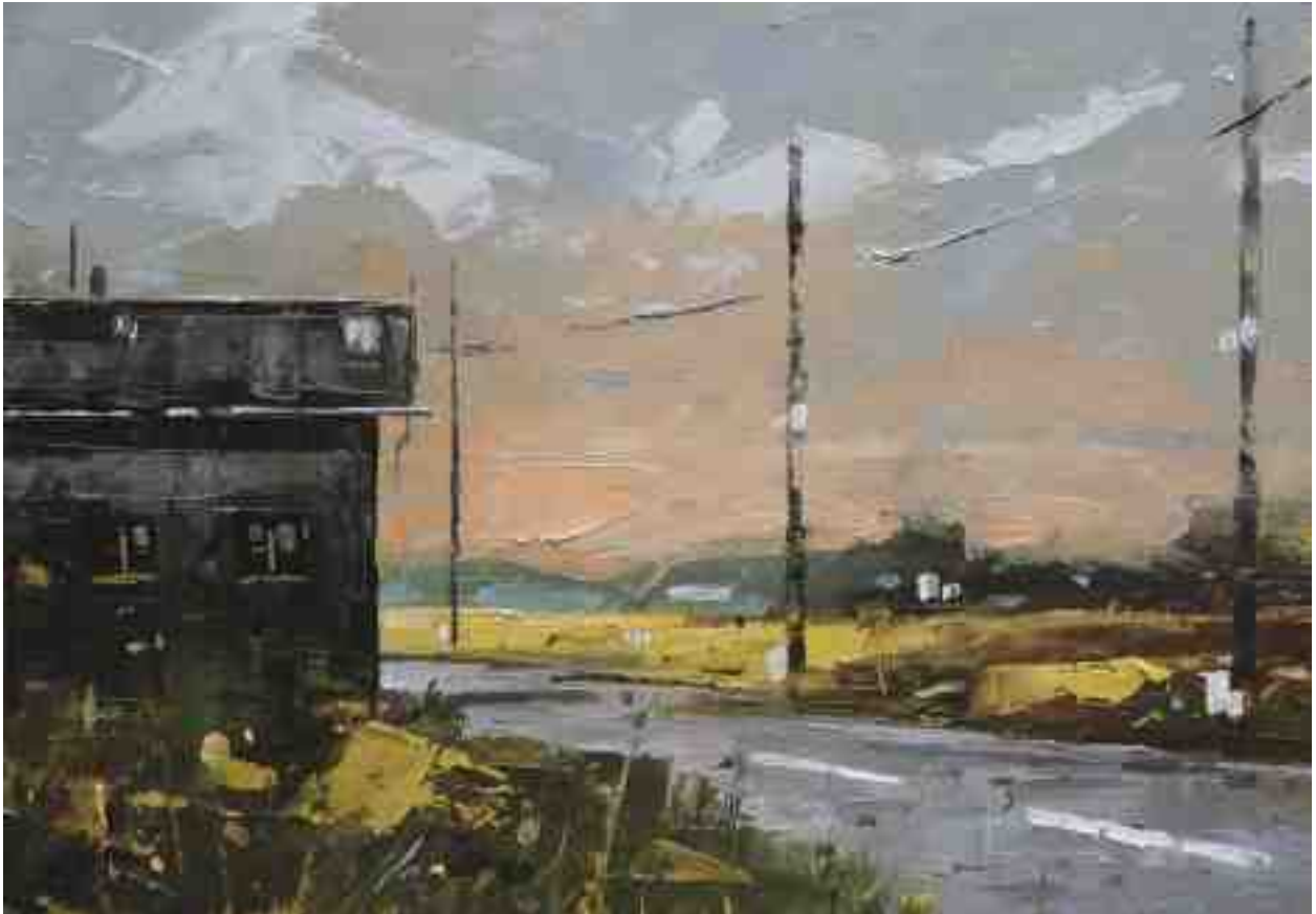
Landschaftsstudie 079 2019 | Öl/Kt | 14 x 20 cm