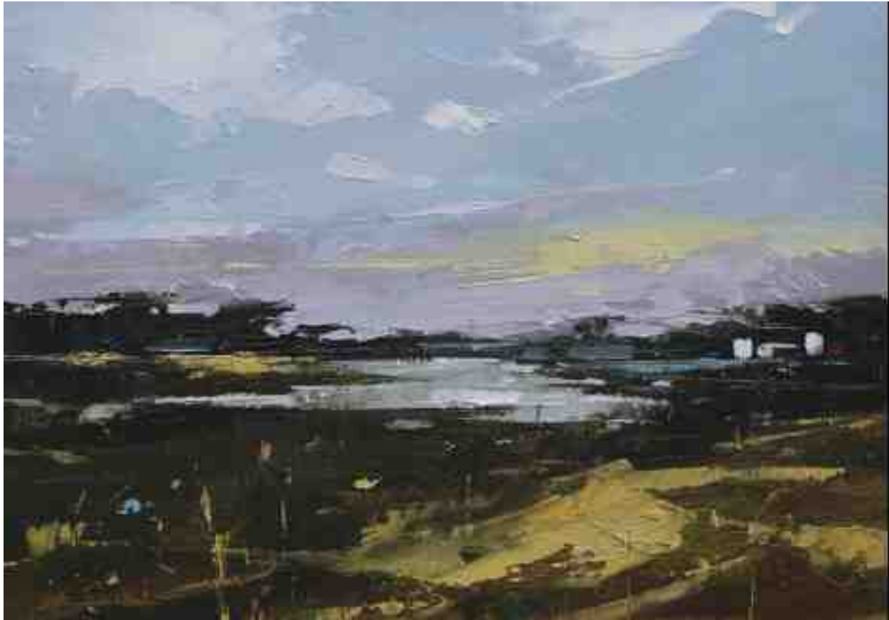
Landschaftsstudie 066 2019 | Öl/Kt | 14 x 20 cm