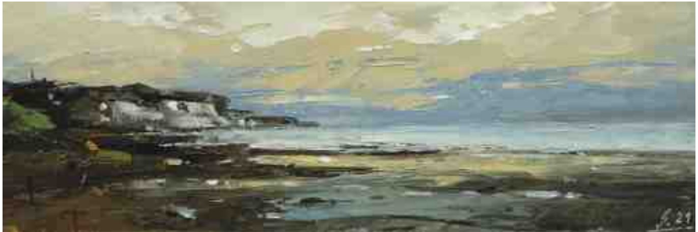
Küste XXXV 2020 | Öl/Kt | 10 x 30 cm