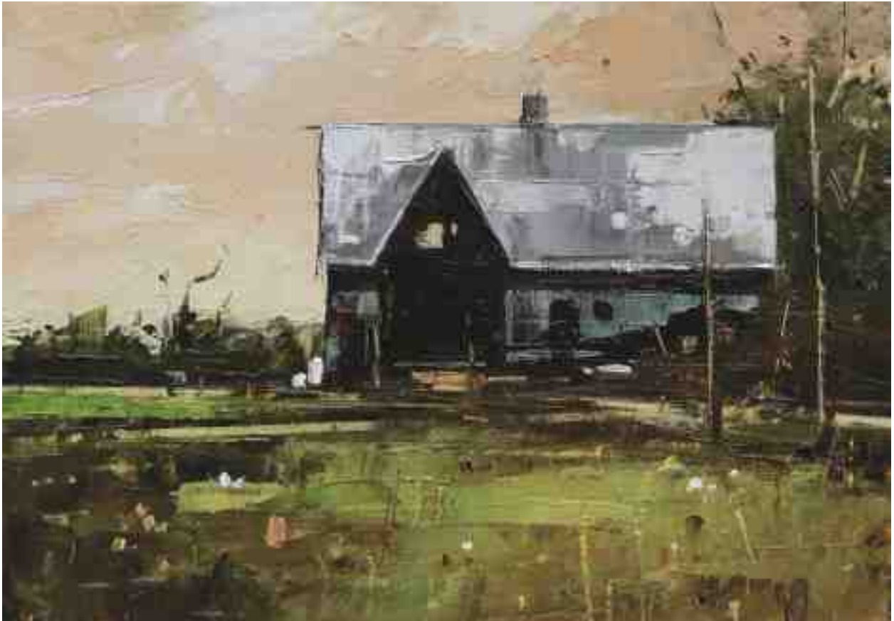
Landschaftsstudie 063 2019 | Öl/Kt | 14 x 20 cm