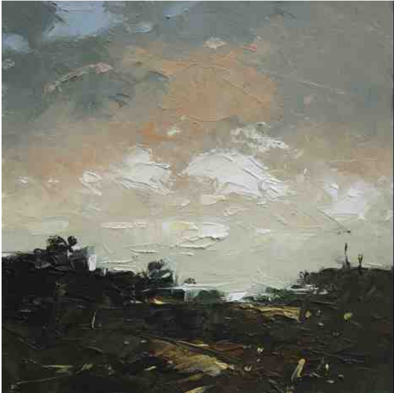
Landschaftsstudie 030 2019 | Öl/Kt | 18 x 18 cm