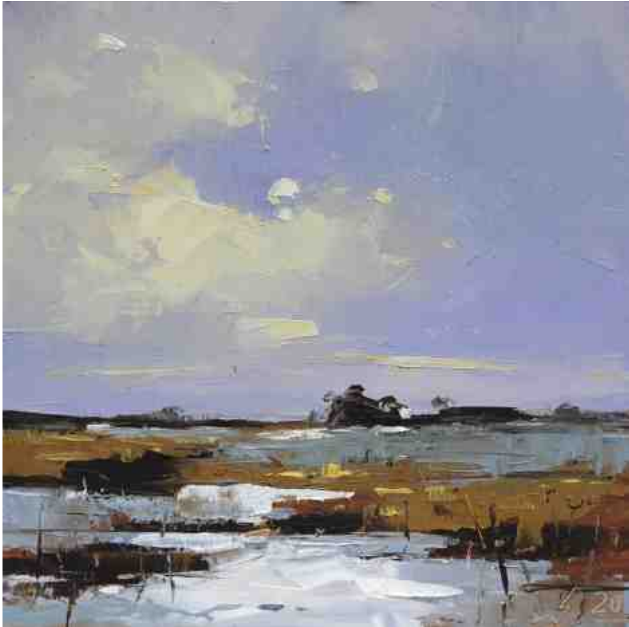
Küste XIX 2020 | Öl/Kt | 17 x 17 cm