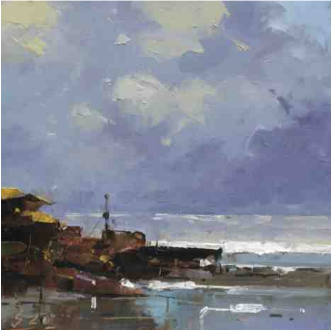
Küste XX 2020 | Öl/Kt | 17 x 17 cm