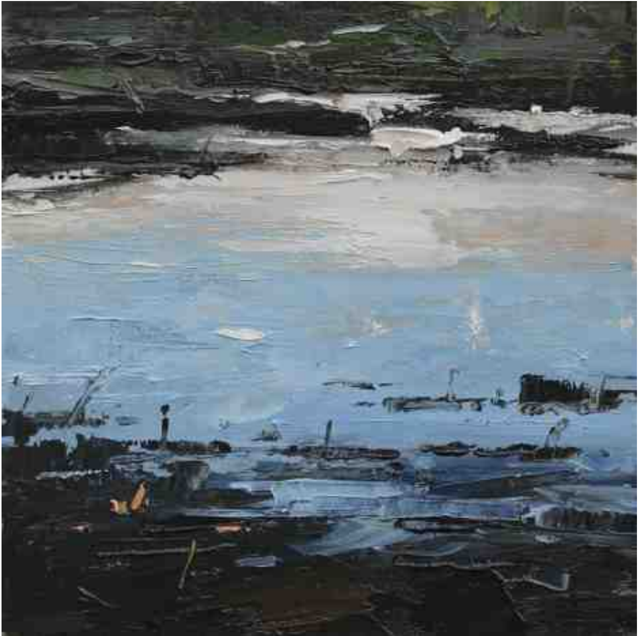
Landschaftsstudie 039 2019 | Öl/Kt | 18 x 18 cm