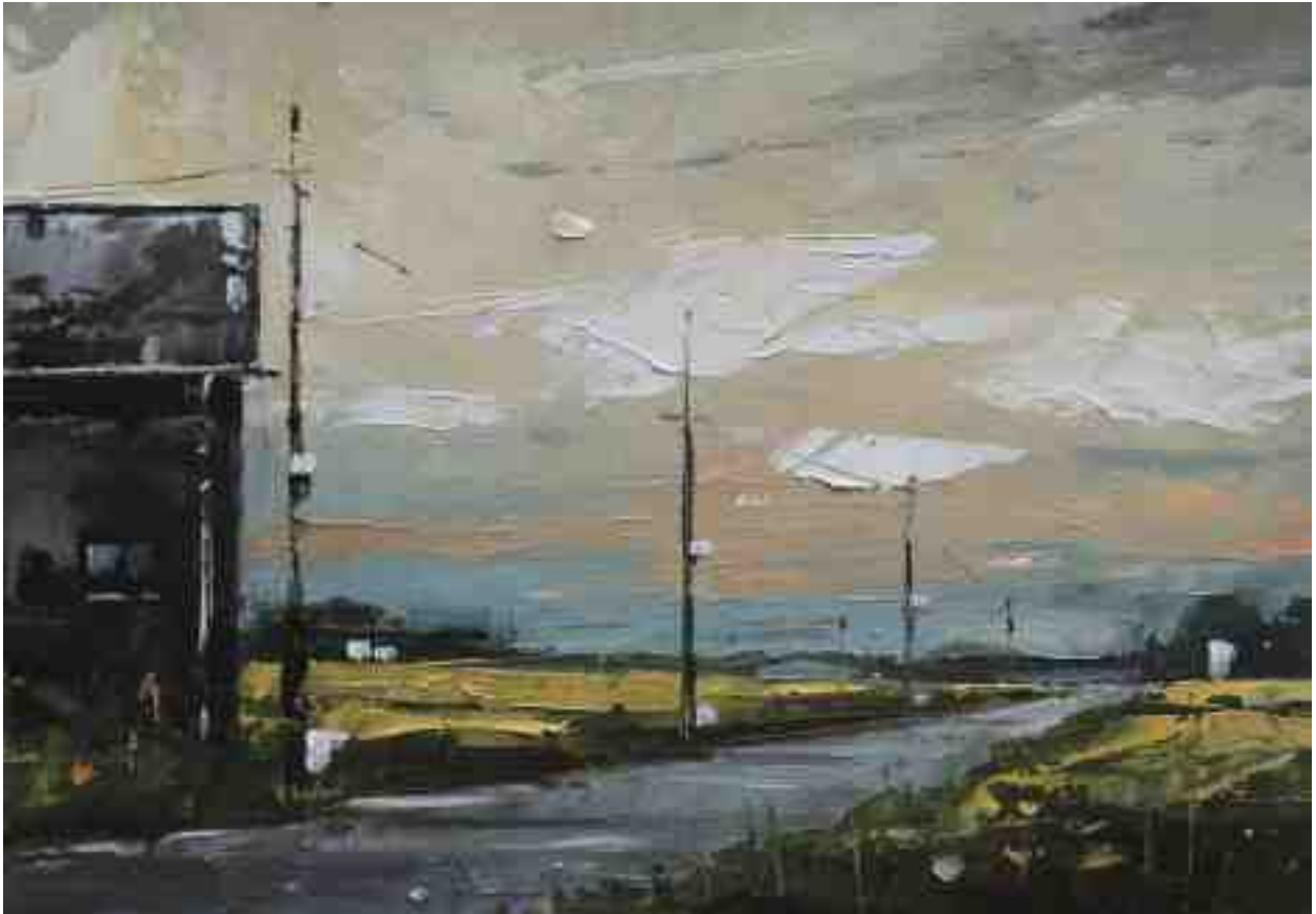
Landschaftsstudie 077 2019 | Öl/Kt | 14 x 20 cm