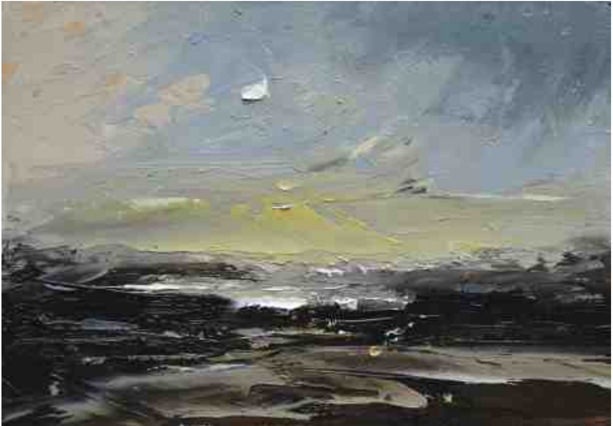
Landschaftsstudie 001 2019 | Öl/Kt | 14 x 20 cm