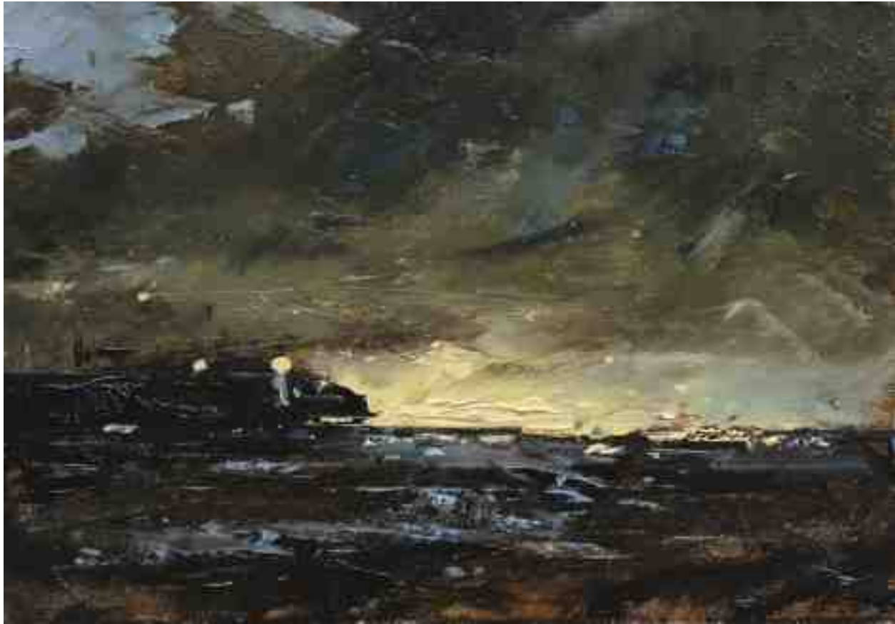
Landschaftsstudie 022 2019 | Öl/Kt | 14 x 20 cm