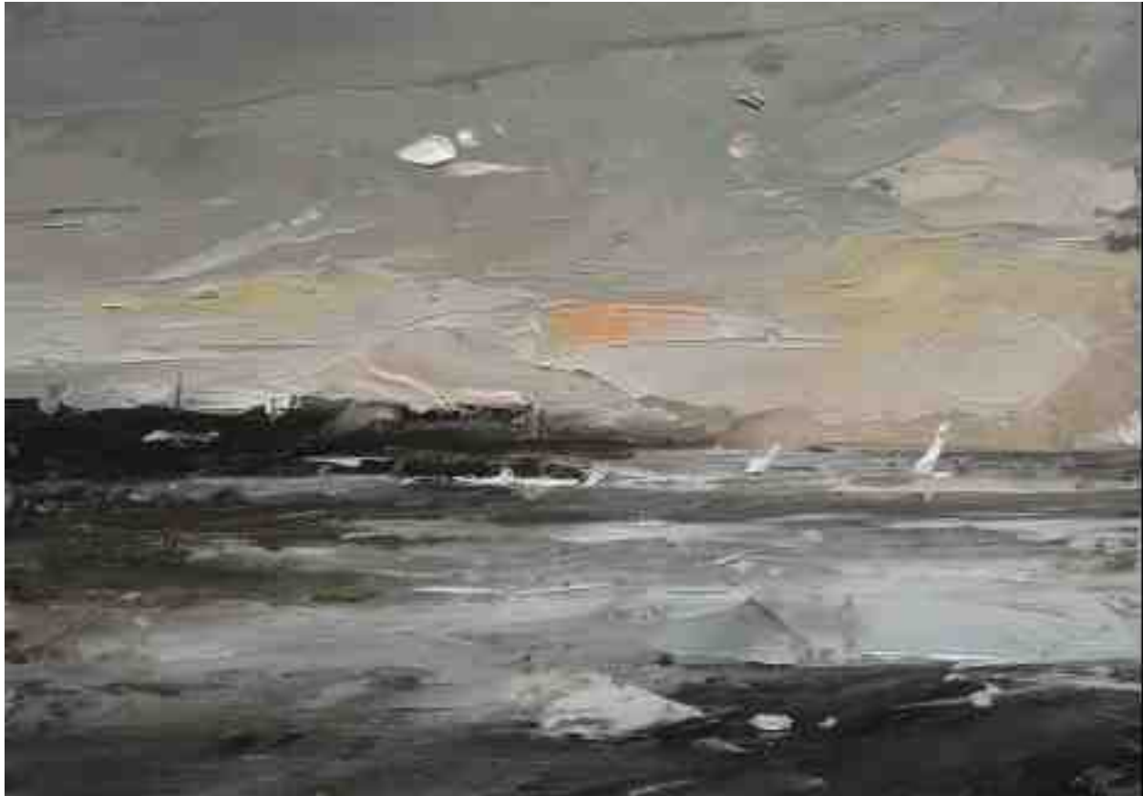
Landschaftsstudie 026 2019 | Öl/Kt | 14 x 20 cm