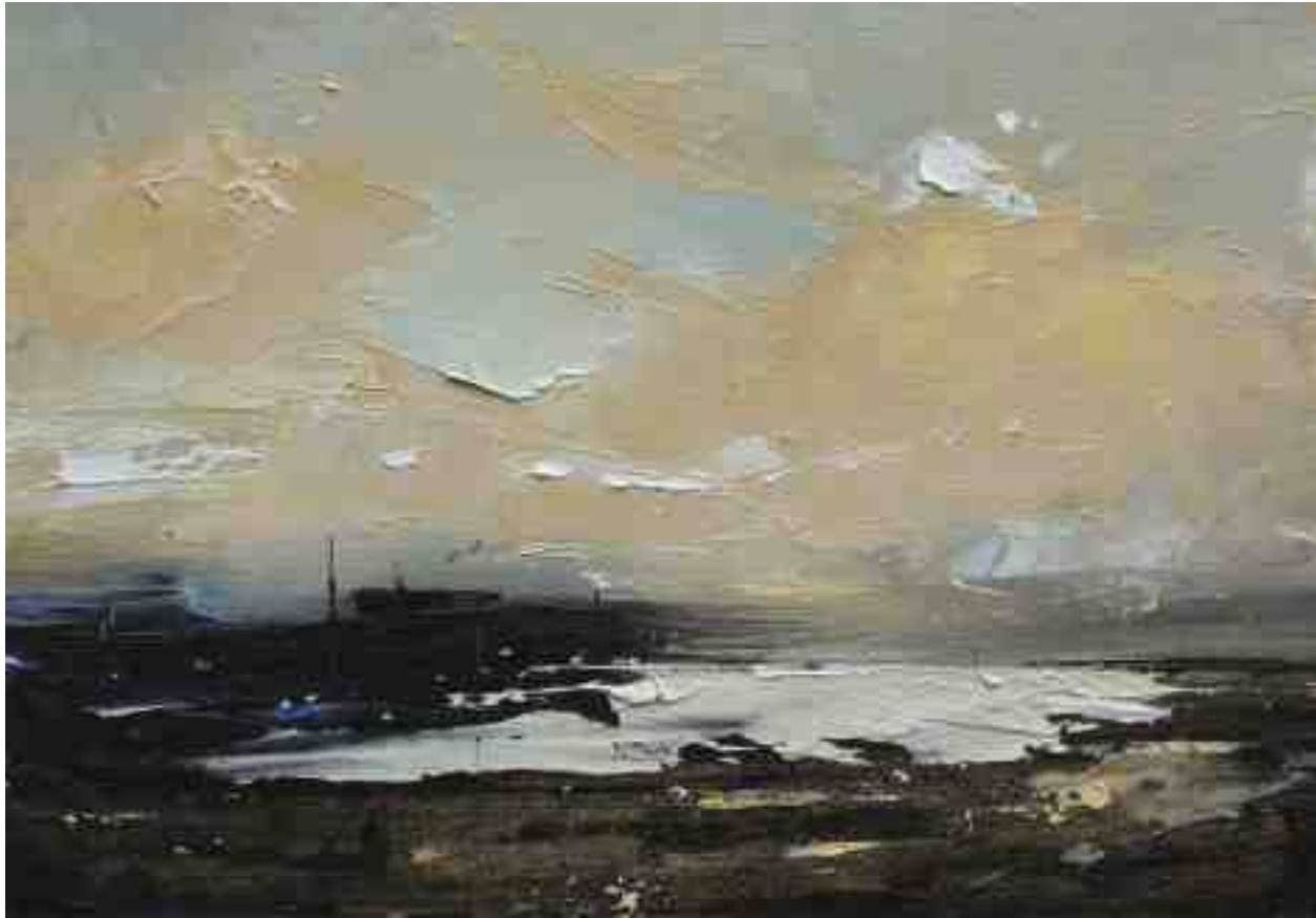
Landschaftsstudie 020 2019 | Öl/Kt | 14 x 20 cm