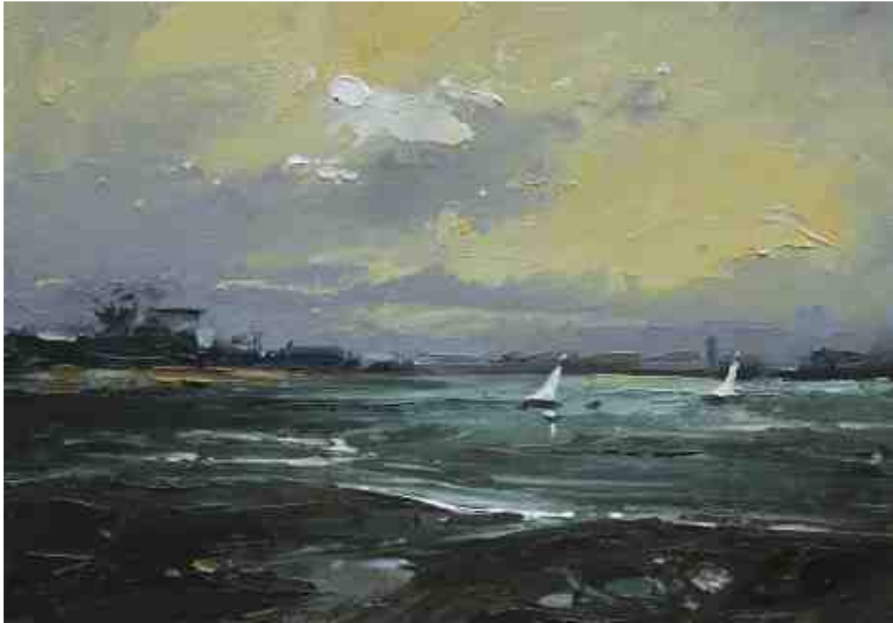
Landschaftsstudie 056 2019 | Öl/Kt | 14 x 20 cm