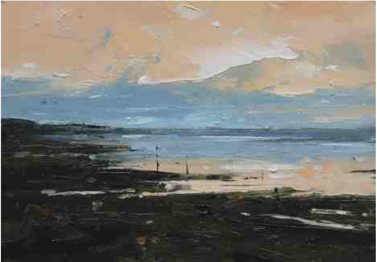
Landschaftsstudie 085 2019 | Öl/Kt | 14 x 20 cm