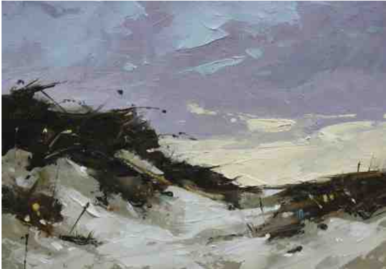
Landschaftsstudie 096 2019 | Öl/Kt | 14 x 20 cm