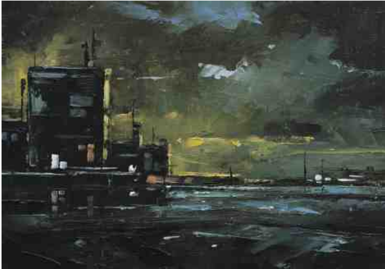
Landschaftsstudie 076 2019 | Öl/Kt | 14 x 20 cm