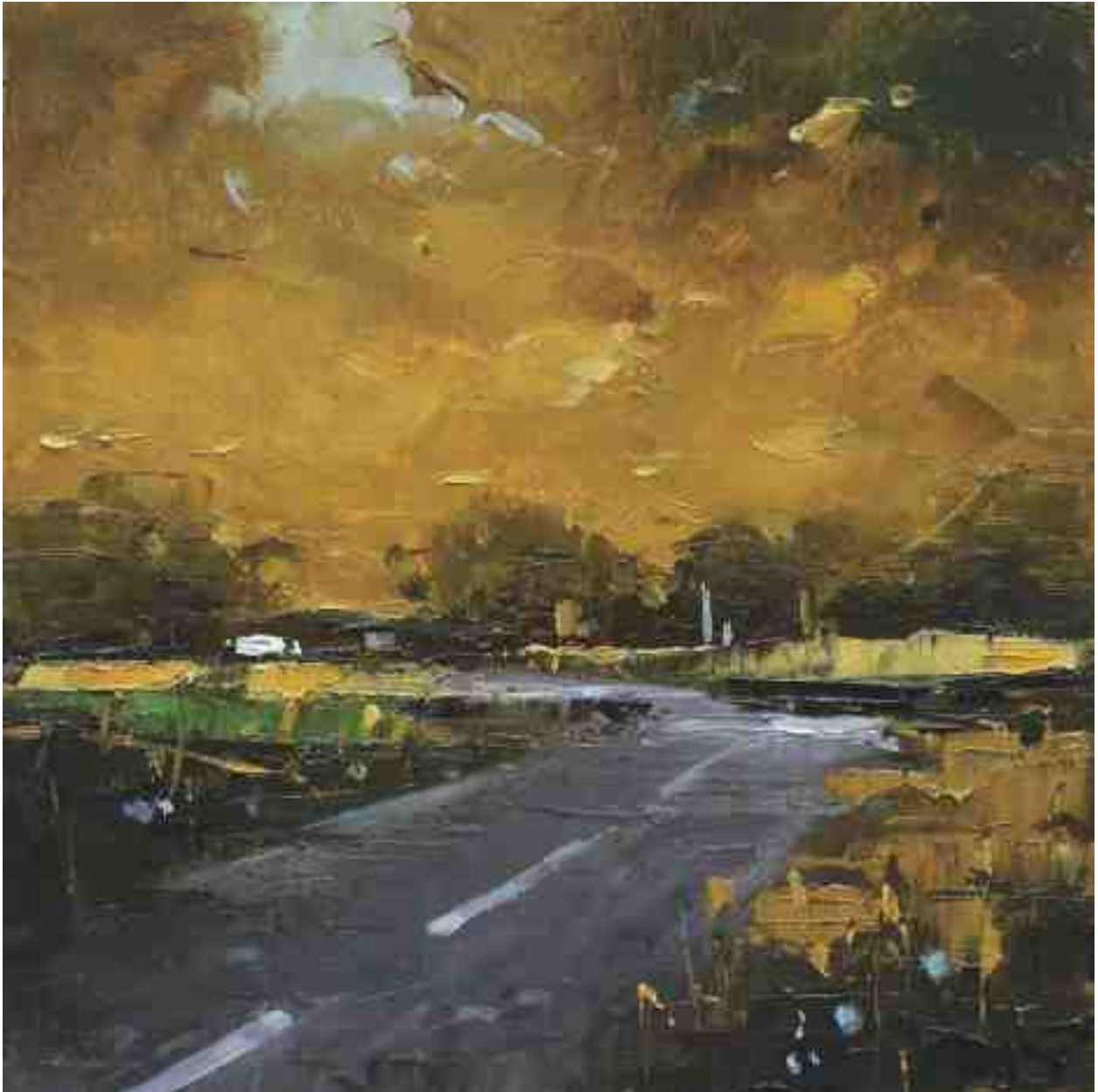
Landschaftsstudie 053 2019 | Öl/Kt | 18 x 18 cm