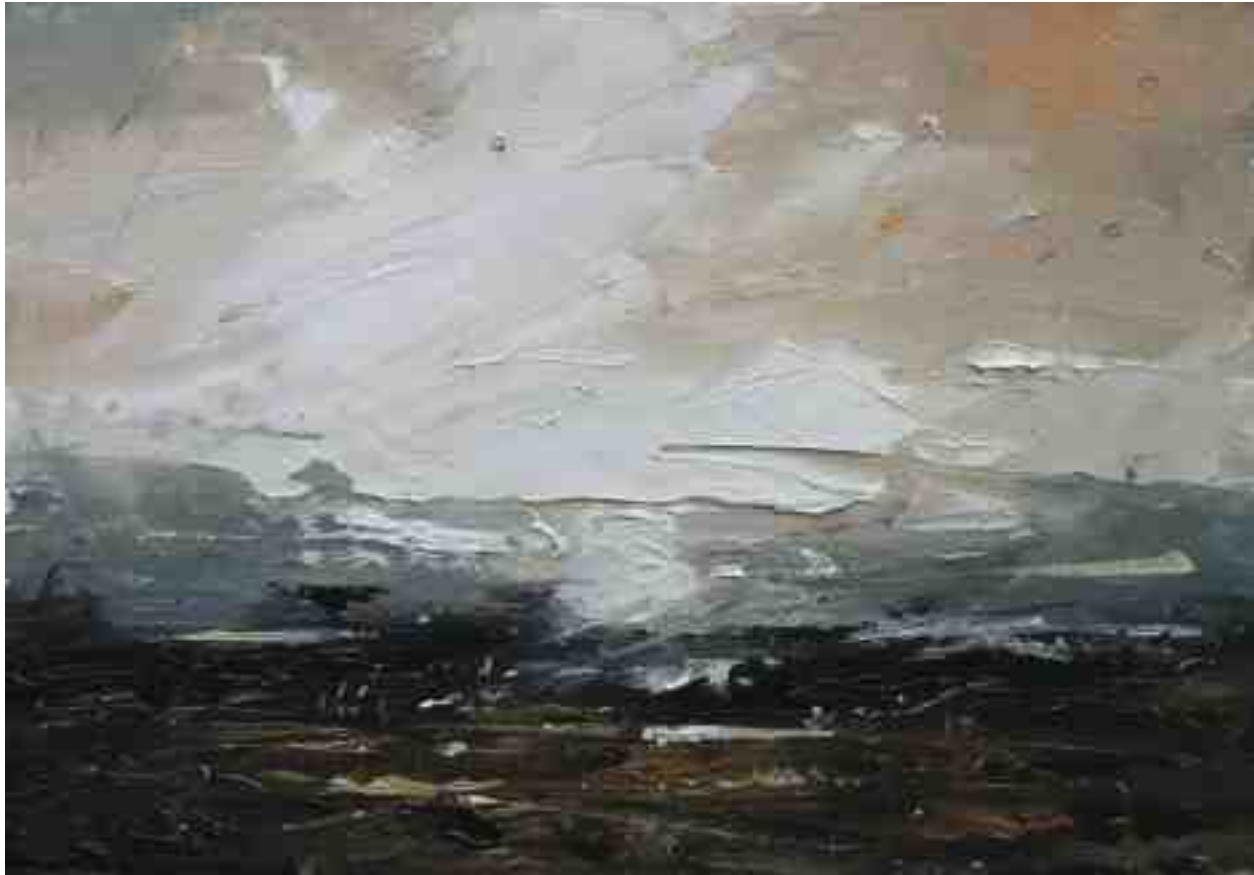
Landschaftsstudie 006 2019 | Öl/Kt | 14 x 20 cm