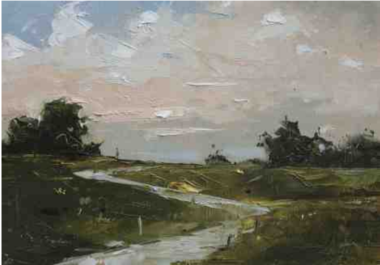
Landschaftsstudie 034 2019 | Öl/Kt | 14 x 20 cm