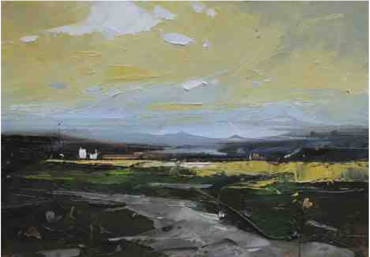
Landschaftsstudie 069 2019 | Öl/Kt | 14 x 20 cm