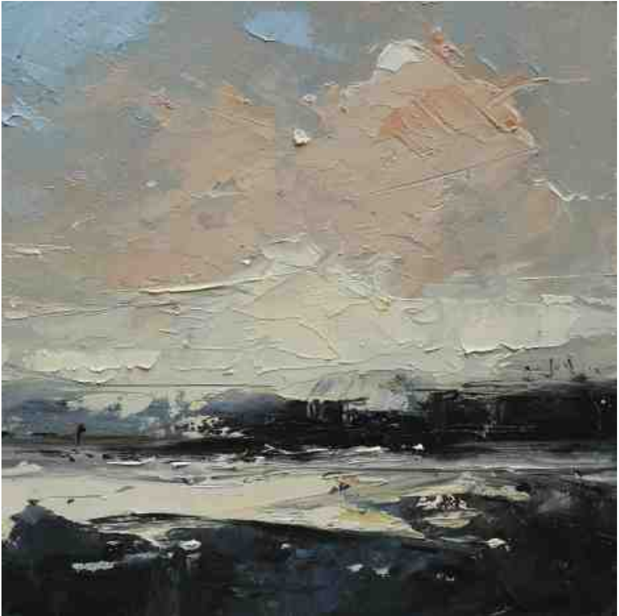
Landschaftsstudie 011 2019 | Öl/Kt | 18 x 18 cm