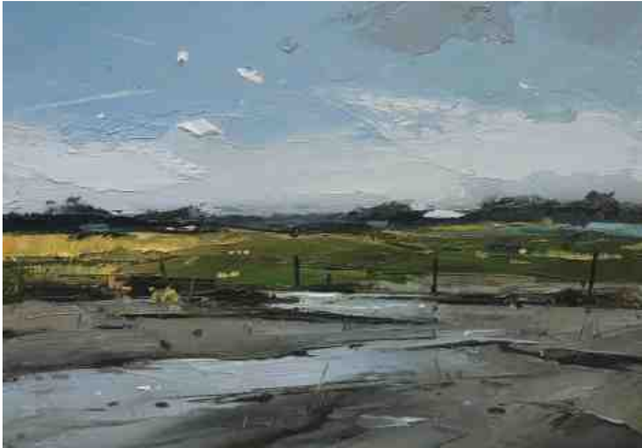
Landschaftsstudie 094 2019 | Öl/Kt | 14 x 20 cm