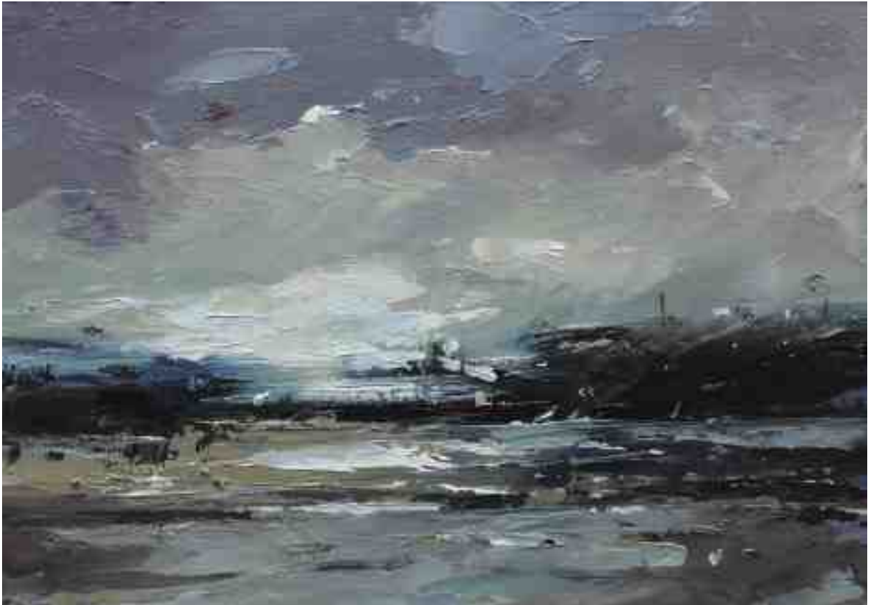
Landschaftsstudie 017 2019 | Öl/Kt | 14 x 20 cm