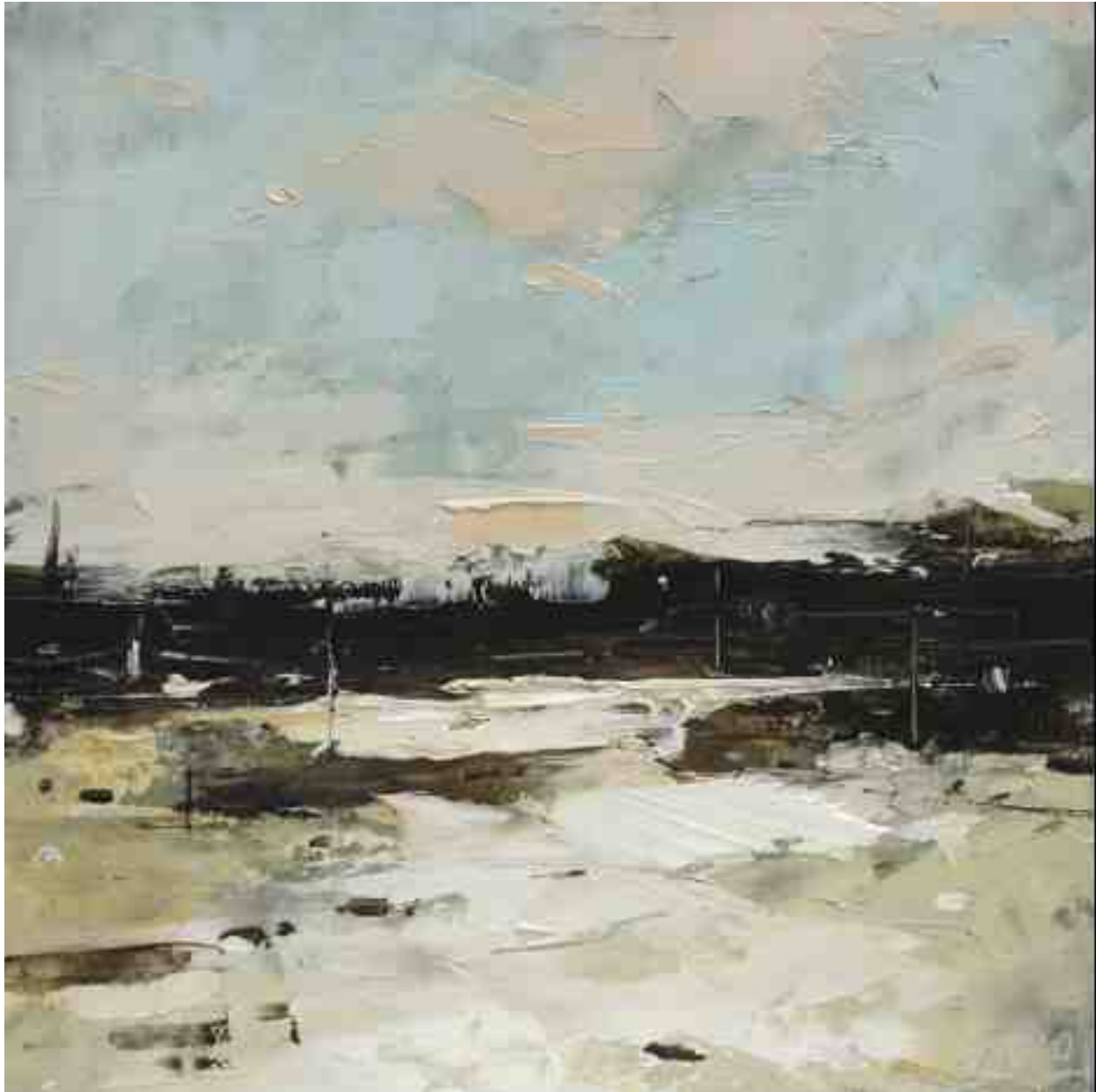
Küste XV 2020 | Öl/Kt | 17 x 17 cm