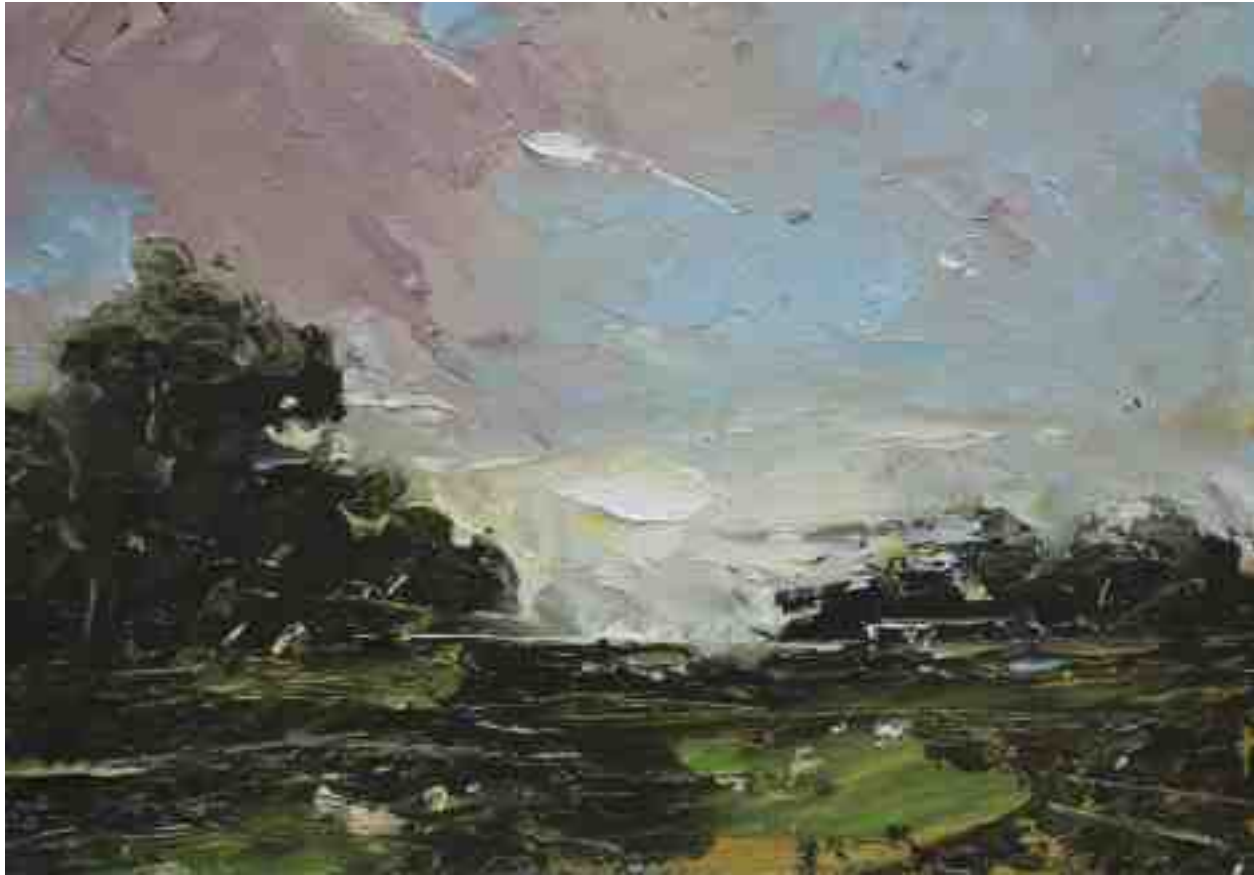
Landschaftsstudie 002 2019 | Öl/Kt | 14 x 20 cm