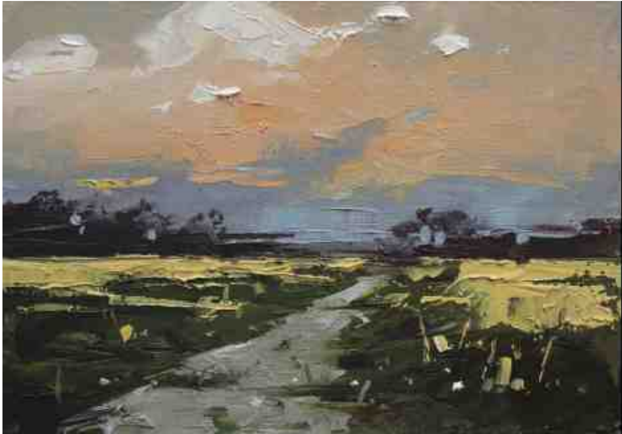
Landschaftsstudie 044 2019 | Öl/Kt | 14 x 20 cm