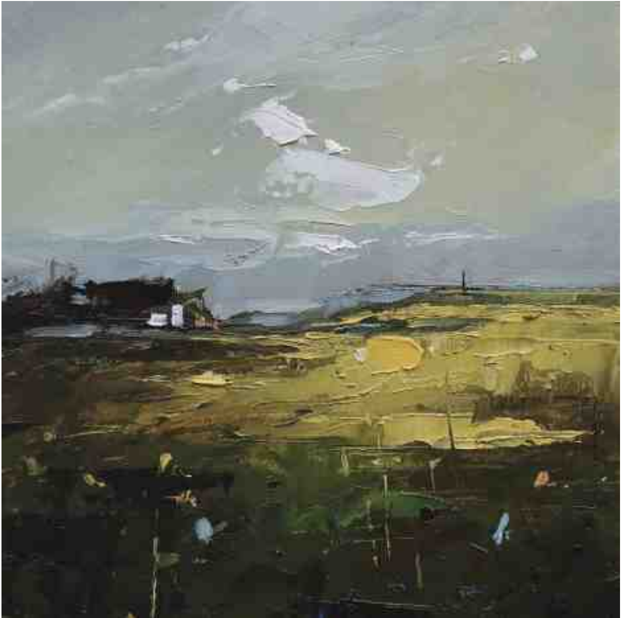
Landschaftsstudie 047 2019 | Öl/Kt | 18 x 18 cm