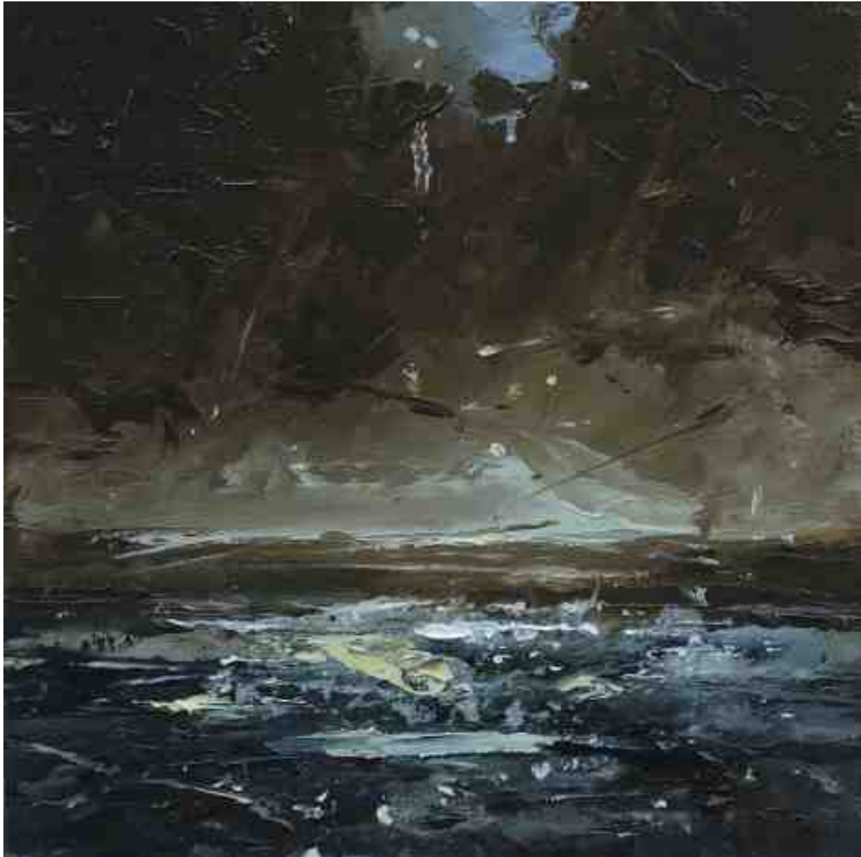
Landschaftsstudie 014 2019 | Öl/Kt | 18 x 18 cm