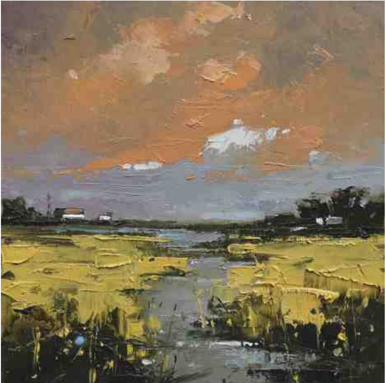
Landschaftsstudie 051 2019 | Öl/Kt | 18 x 18 cm