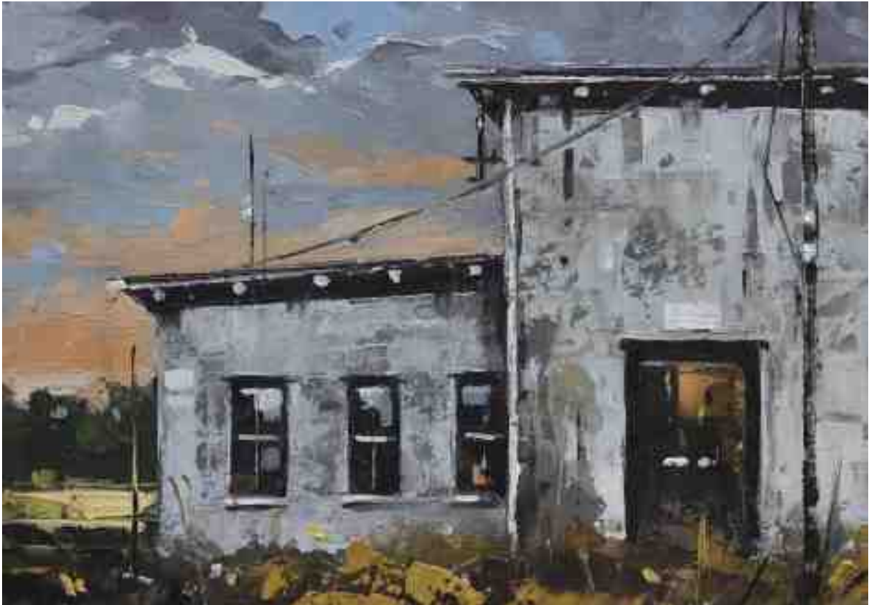
Landschaftsstudie 075 2019 | Öl/Kt | 14 x 20 cm