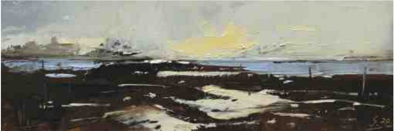
Küste XXXIII 2020 | Öl/Kt | 10 x 30 cm