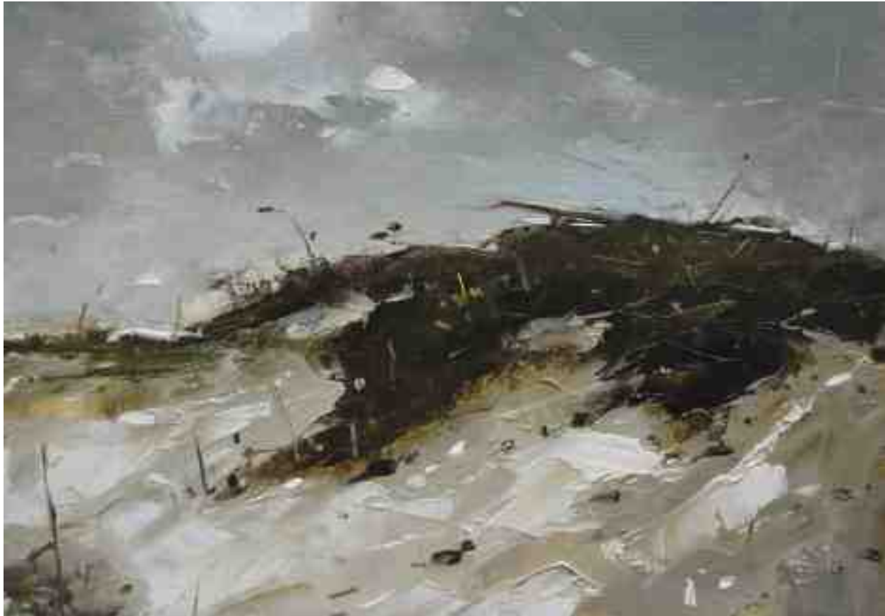
Landschaftsstudie 084 2019 | Öl/Kt | 14 x 20 cm