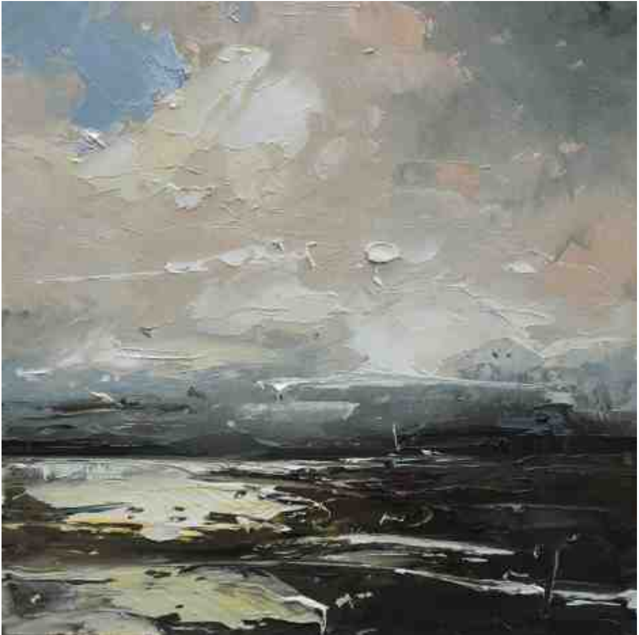
Landschaftsstudie 013 2019 | Öl/Kt | 18 x 18 cm