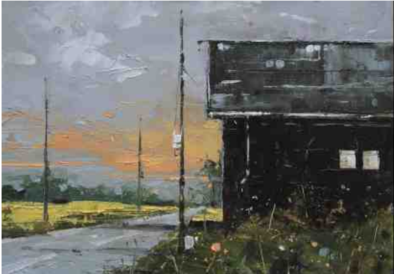
Landschaftsstudie 058 2019 | Öl/Kt | 14 x 20 cm