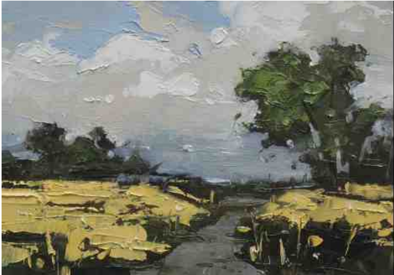
Landschaftsstudie 046 2019 | Öl/Kt | 14 x 20 cm