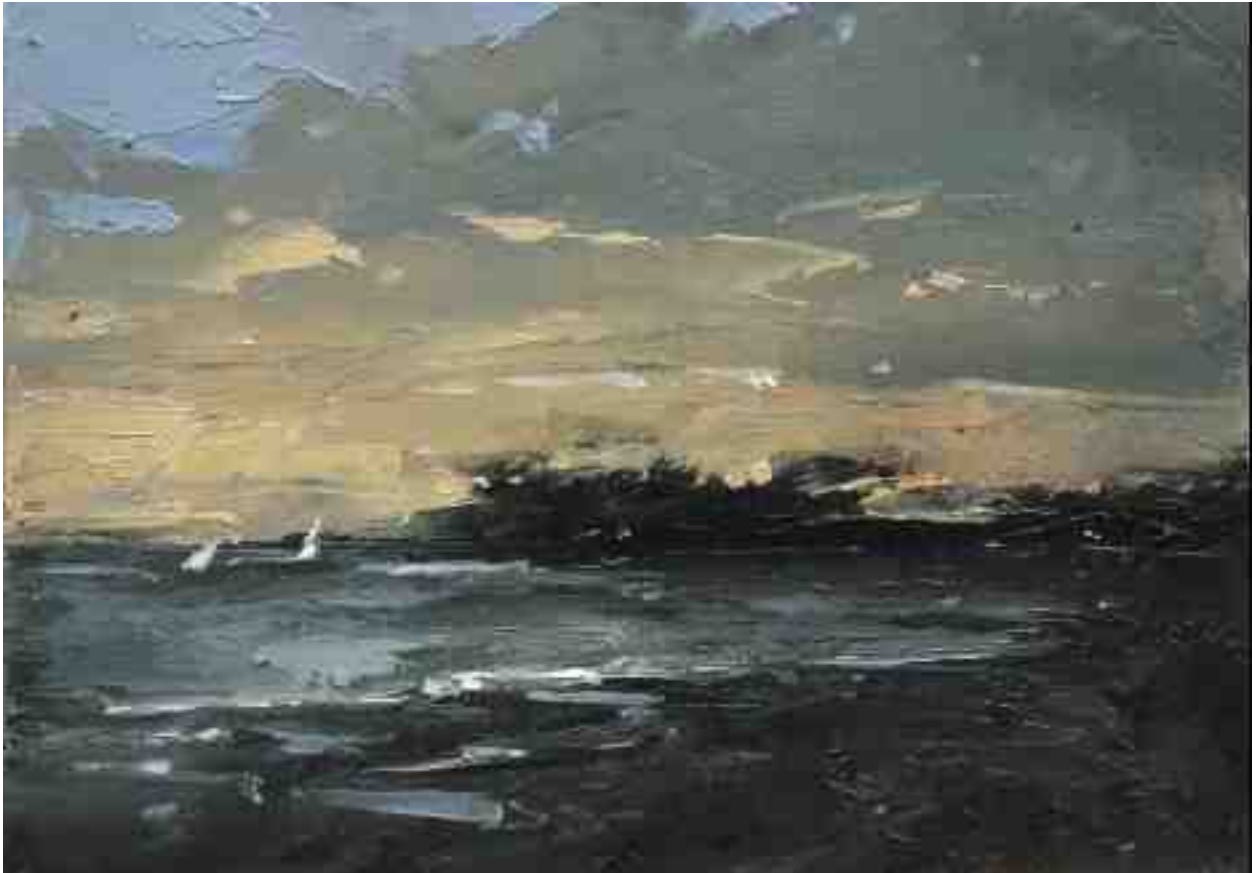
Landschaftsstudie 025 2019 | Öl/Kt | 14 x 20 cm