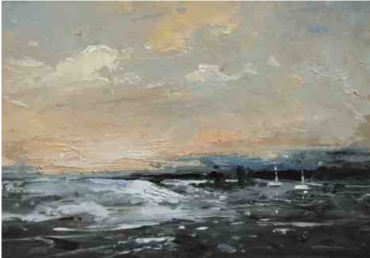
Landschaftsstudie 024 2019 | Öl/Kt | 14 x 20 cm