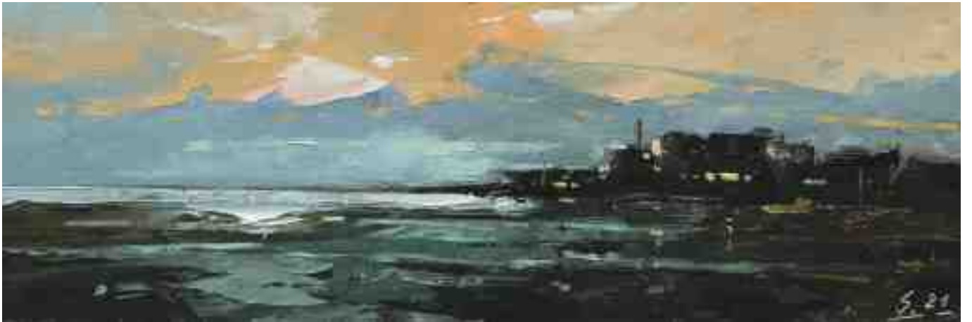
Küste XXXVI 2020 | Öl/Kt | 10 x 30 cm