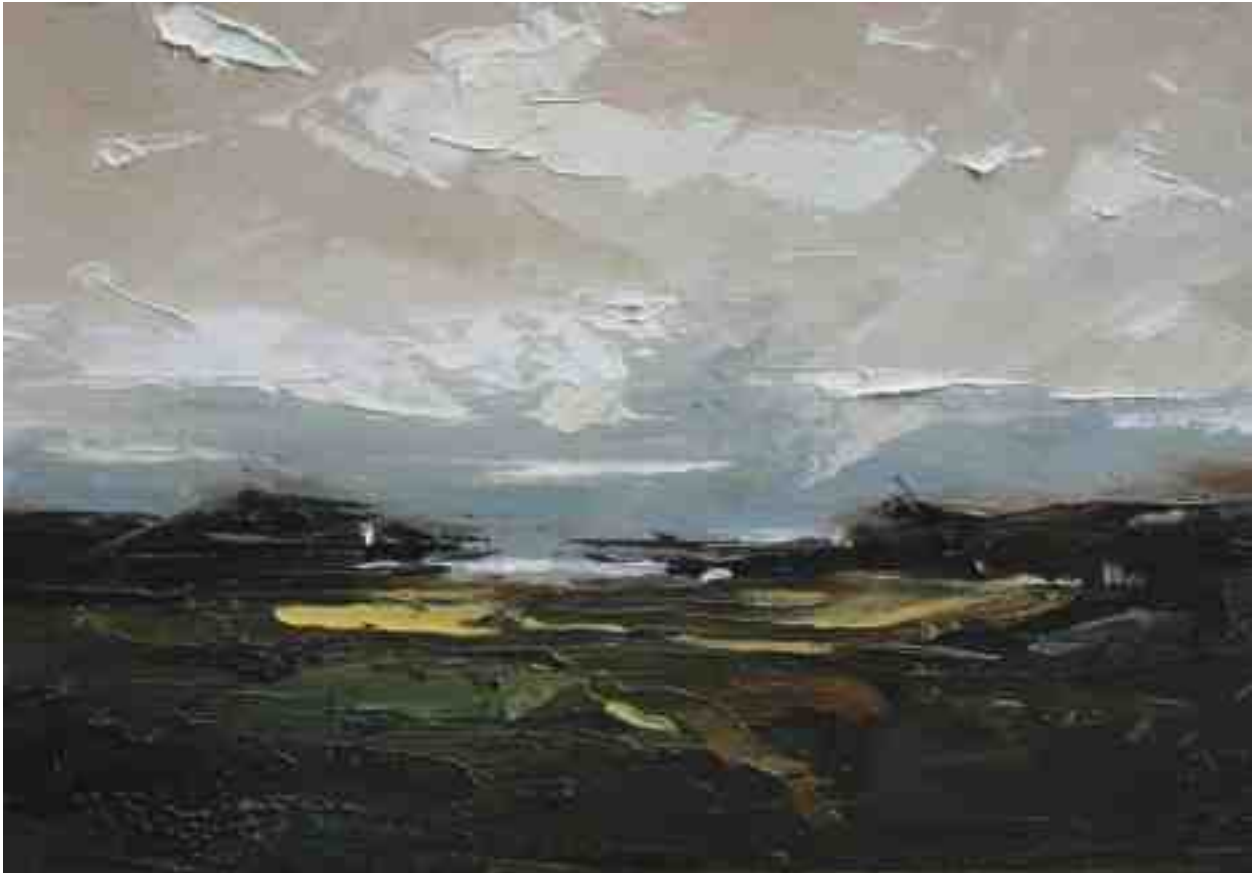
Landschaftsstudie 035 2019 | Öl/Kt | 14 x 20 cm