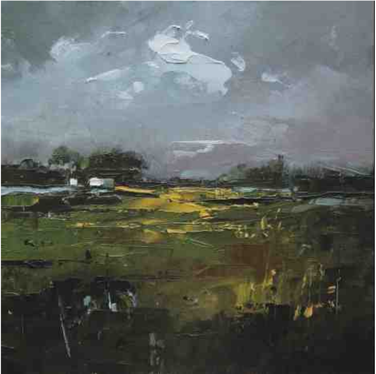
Landschaftsstudie 049 2019 | Öl/Kt | 18 x 18 cm