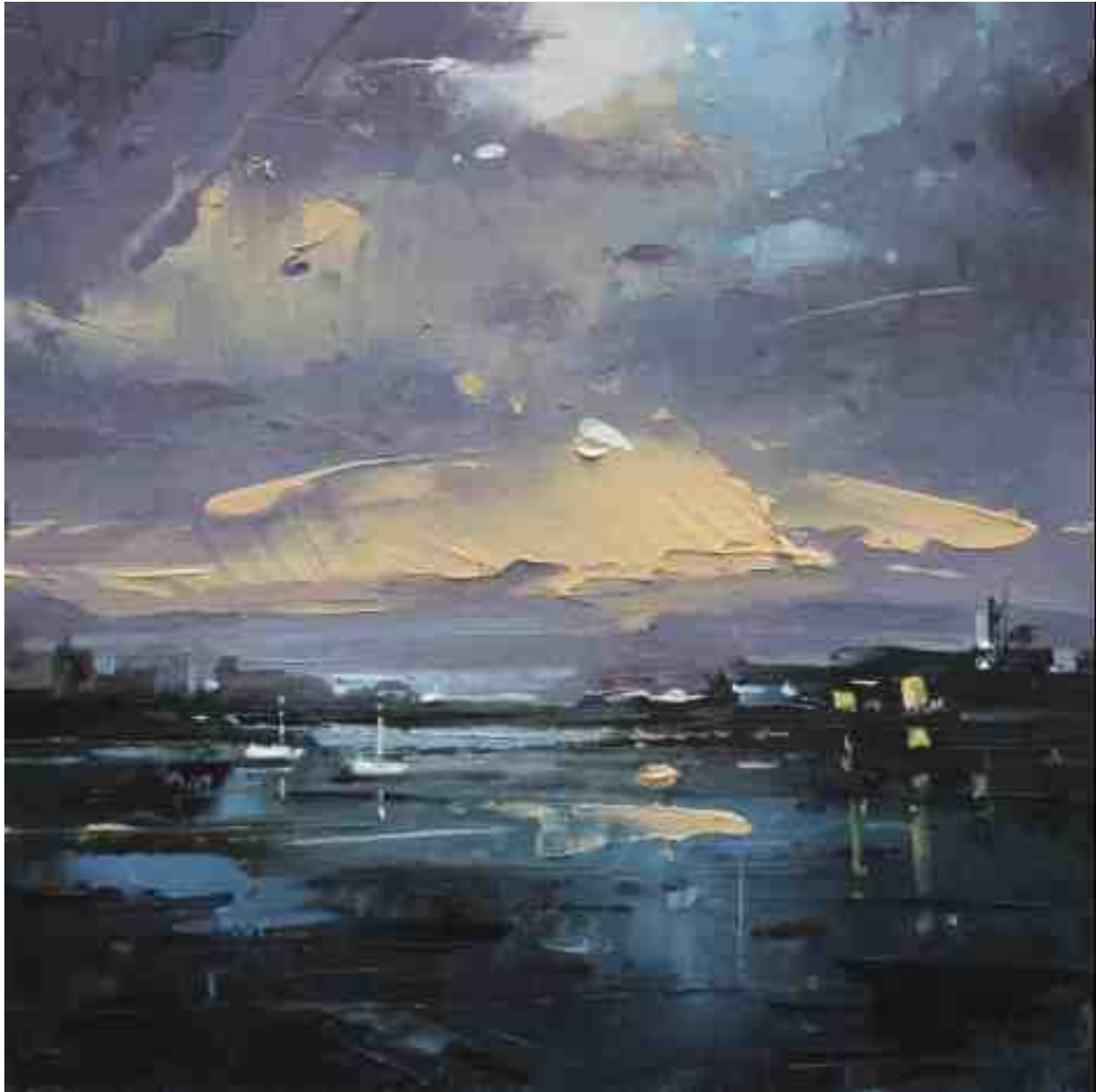
Landschaftsstudie 088 2019 | Öl/Kt | 18 x 18 cm