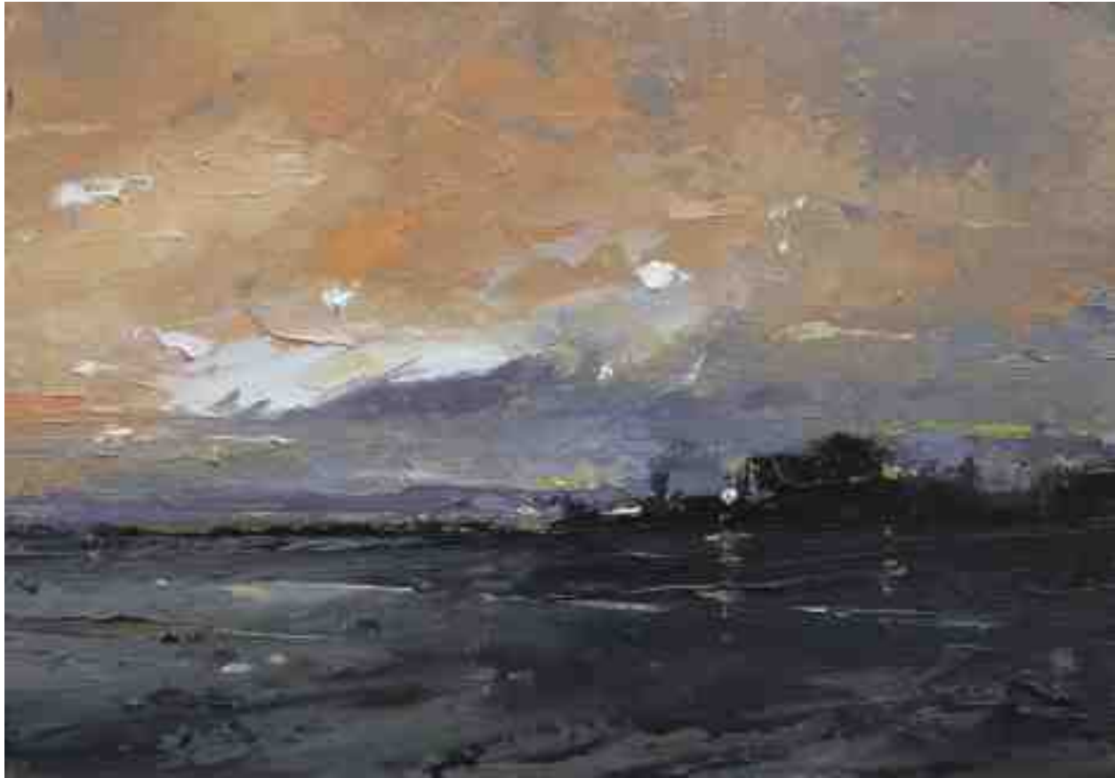
Landschaftsstudie 042 2019 | Öl/Kt | 14 x 20 cm