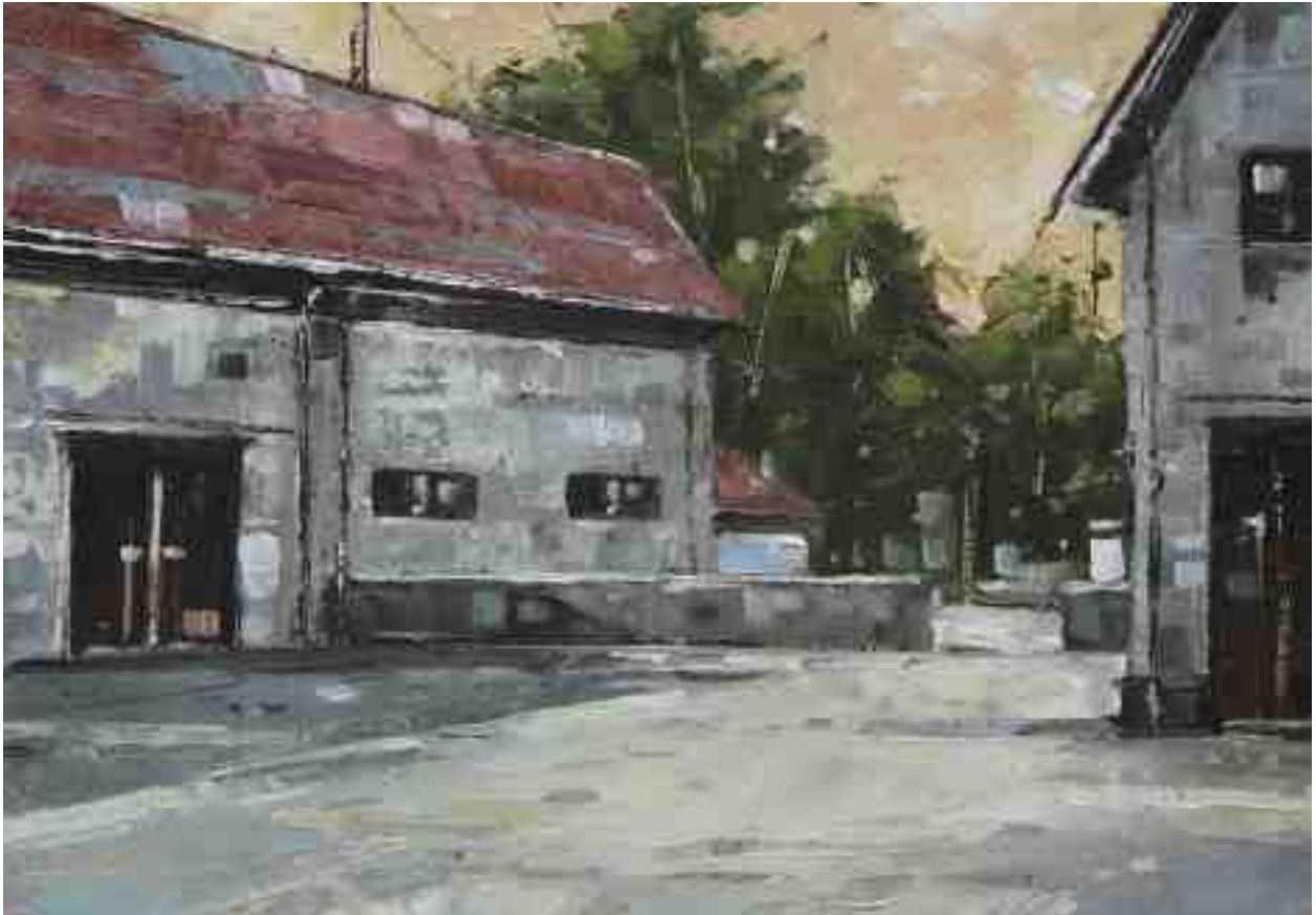
Landschaftsstudie 065 2019 | Öl/Kt | 14 x 20 cm