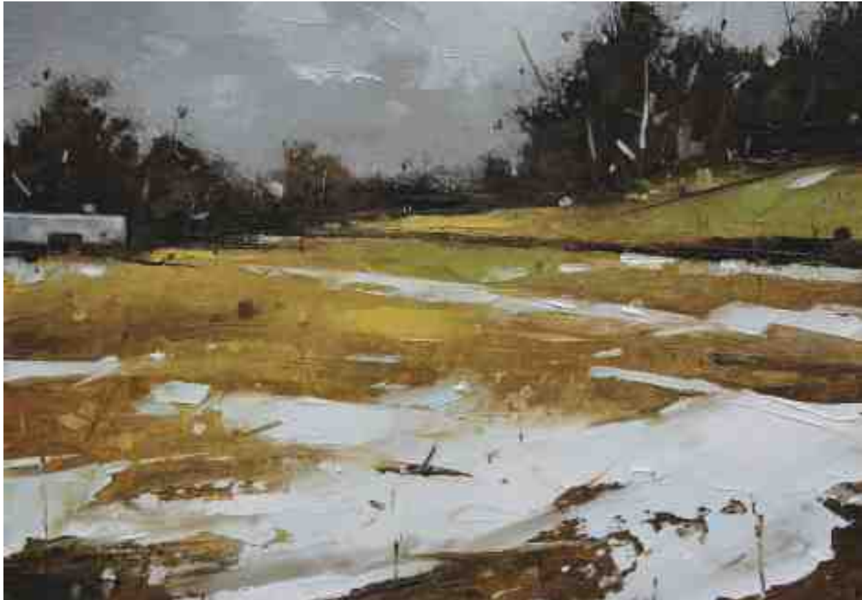
Landschaftsstudie 080 2019 | Öl/Kt | 14 x 20 cm