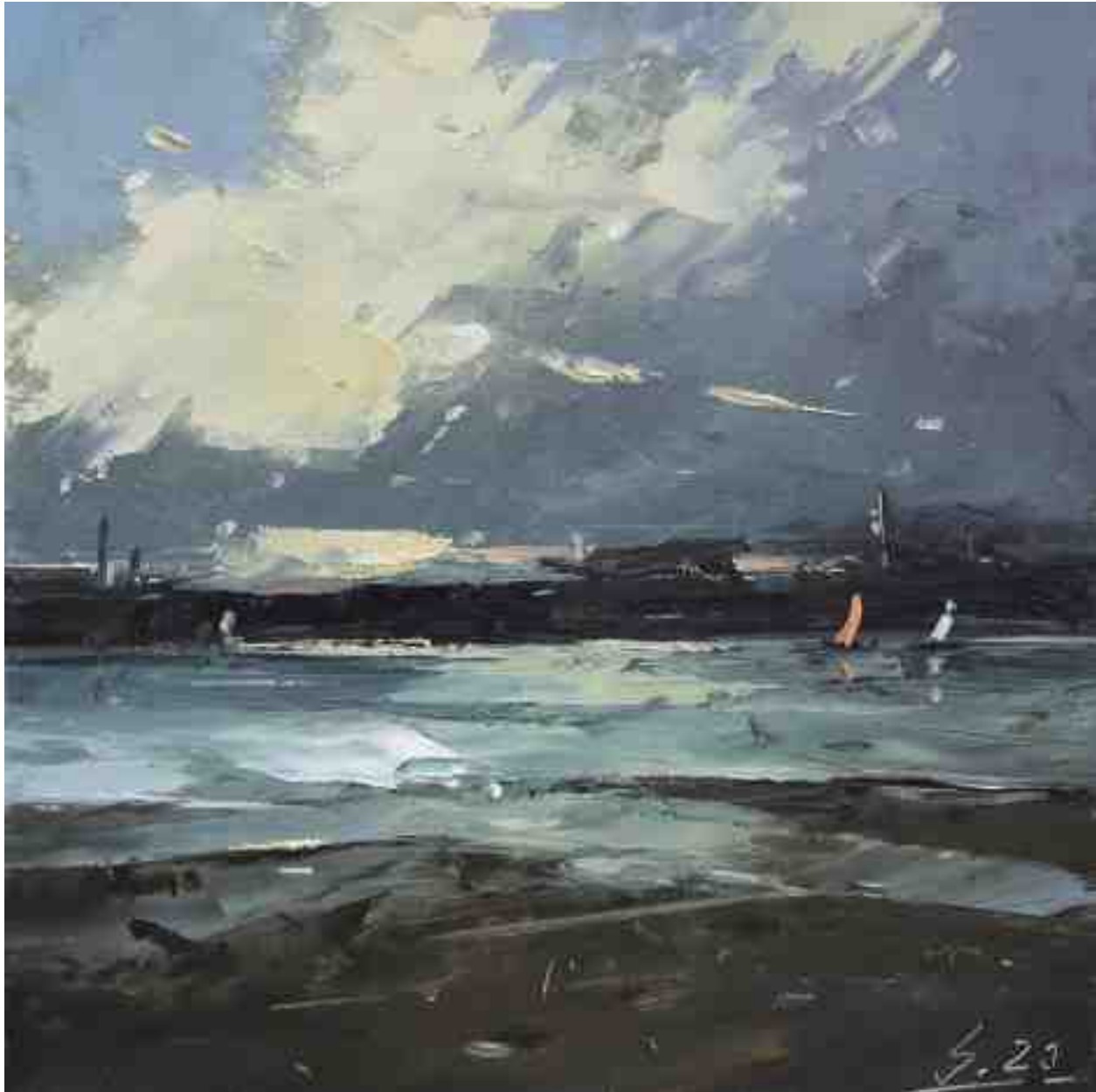
Küste XI 2020 | Öl/Kt | 17 x 17 cm