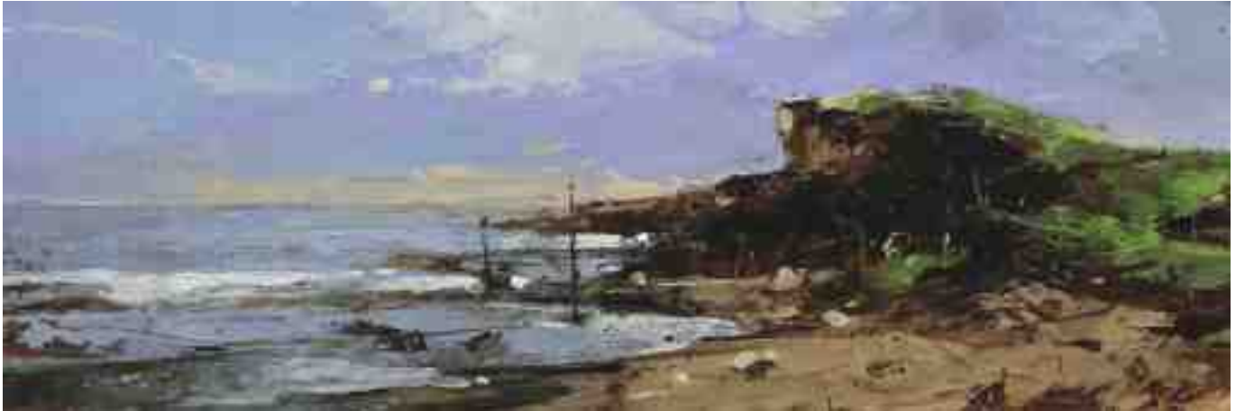
Küste XXXIV 2020 | Öl/Kt | 10 x 30 cm