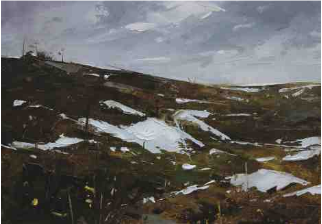
Landschaftsstudie 095 2019 | Öl/Kt | 14 x 20 cm