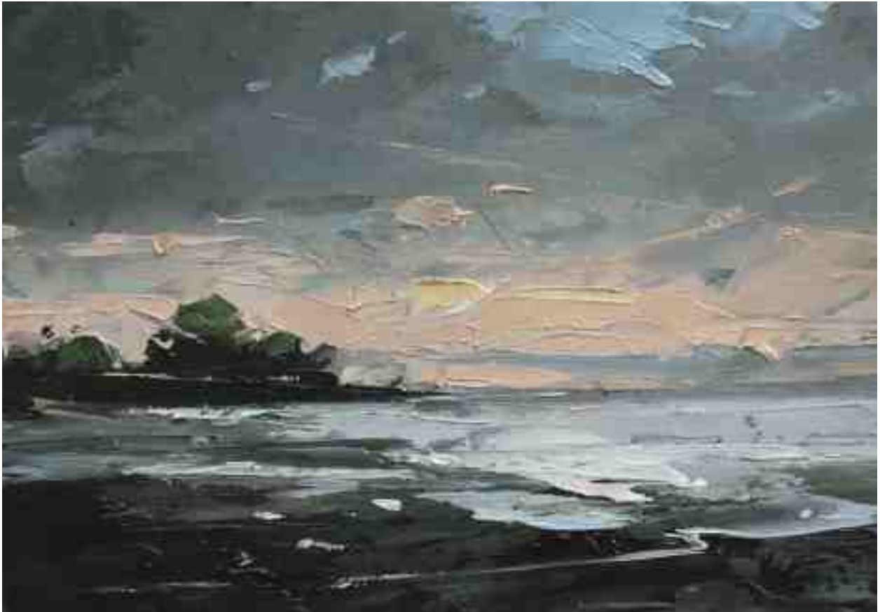
Landschaftsstudie 027 2019 | Öl/Kt | 14 x 20 cm