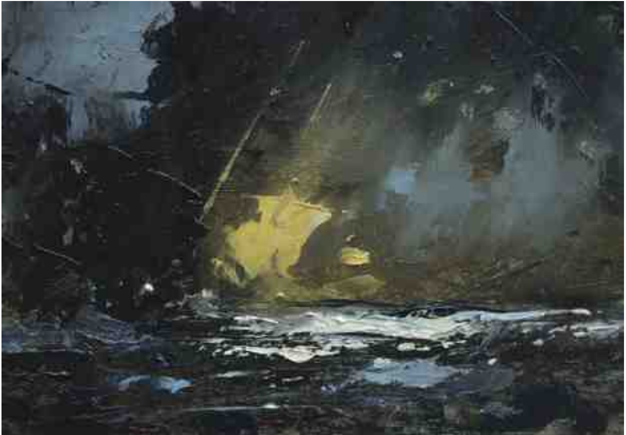
Landschaftsstudie 007 2019 | Öl/Kt | 14 x 20 cm