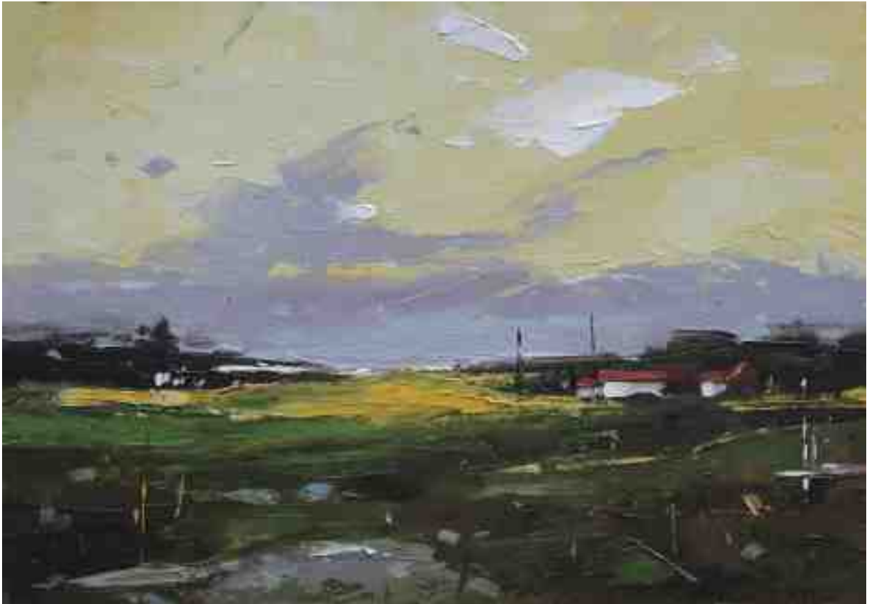
Landschaftsstudie 073 2019 | Öl/Kt | 14 x 20 cm