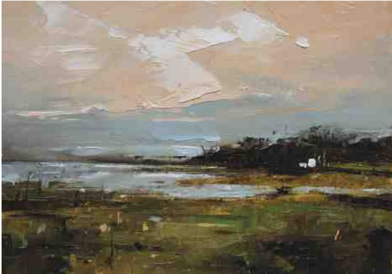
Landschaftsstudie 082 2019 | Öl/Kt | 14 x 20 cm