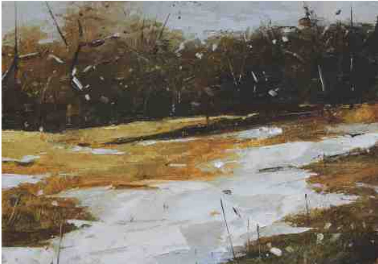
Landschaftsstudie 078 2019 | Öl/Kt | 14 x 20 cm