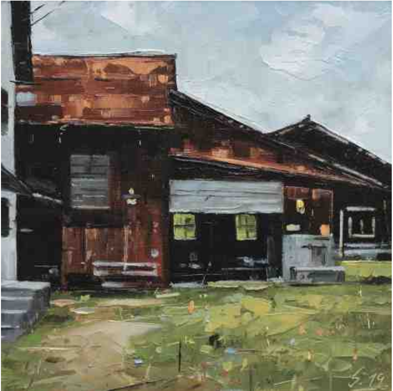
Landschaftsstudie 101 2019 | Öl/Holz | 18 x 18 cm