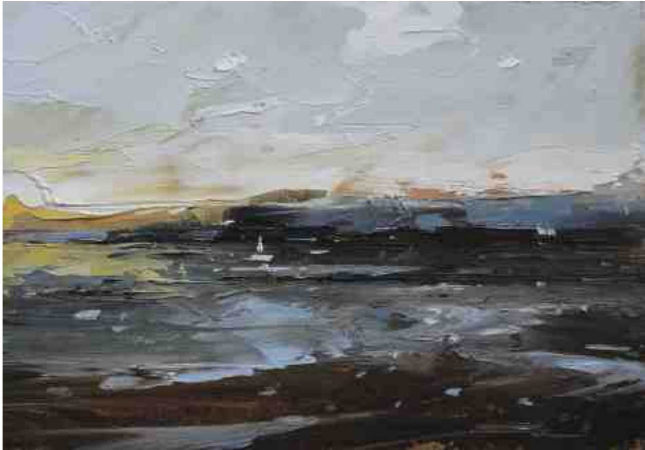
Landschaftsstudie 032 2019 | Öl/Kt | 14 x 20 cm