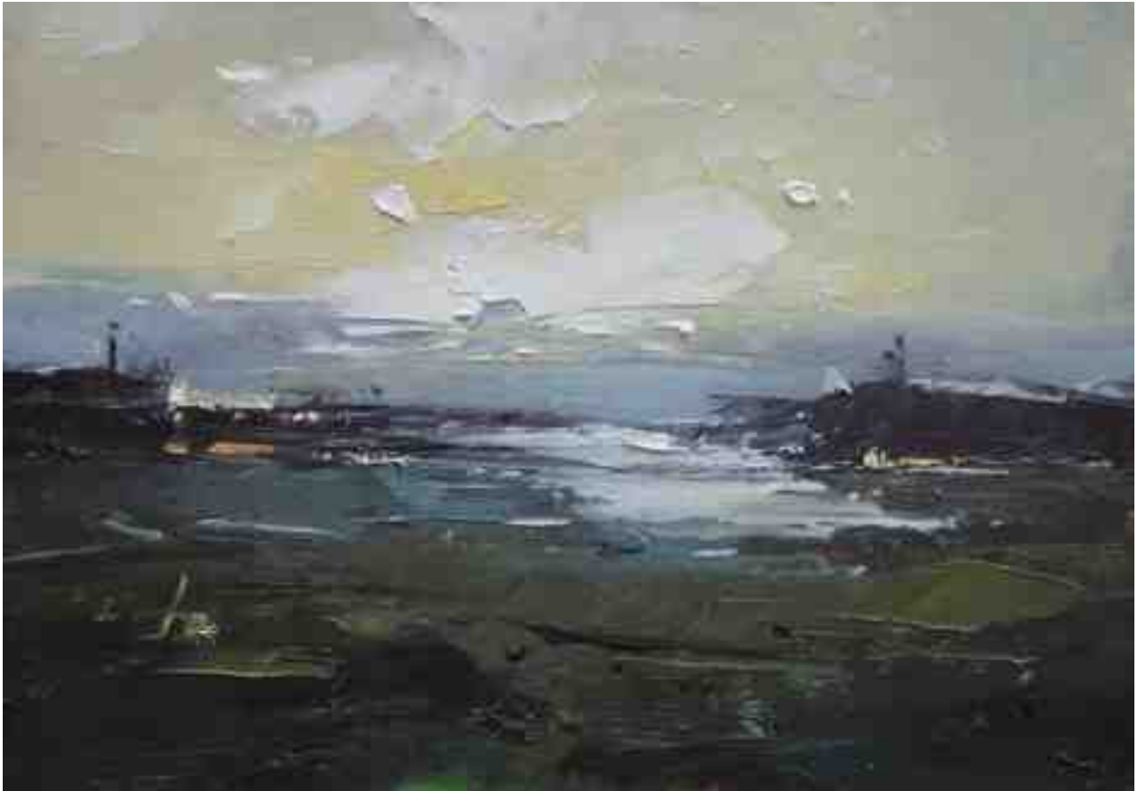
Landschaftsstudie 045 2019 | Öl/Kt | 14 x 20 cm