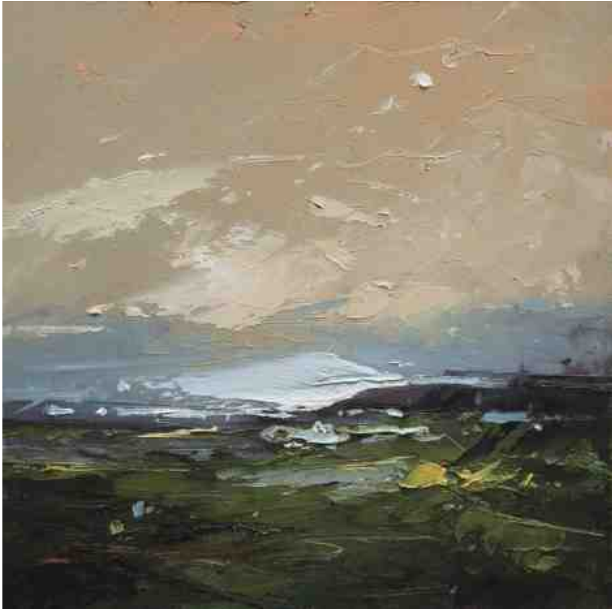
Landschaftsstudie 048 2019 | Öl/Kt | 18 x 18 cm