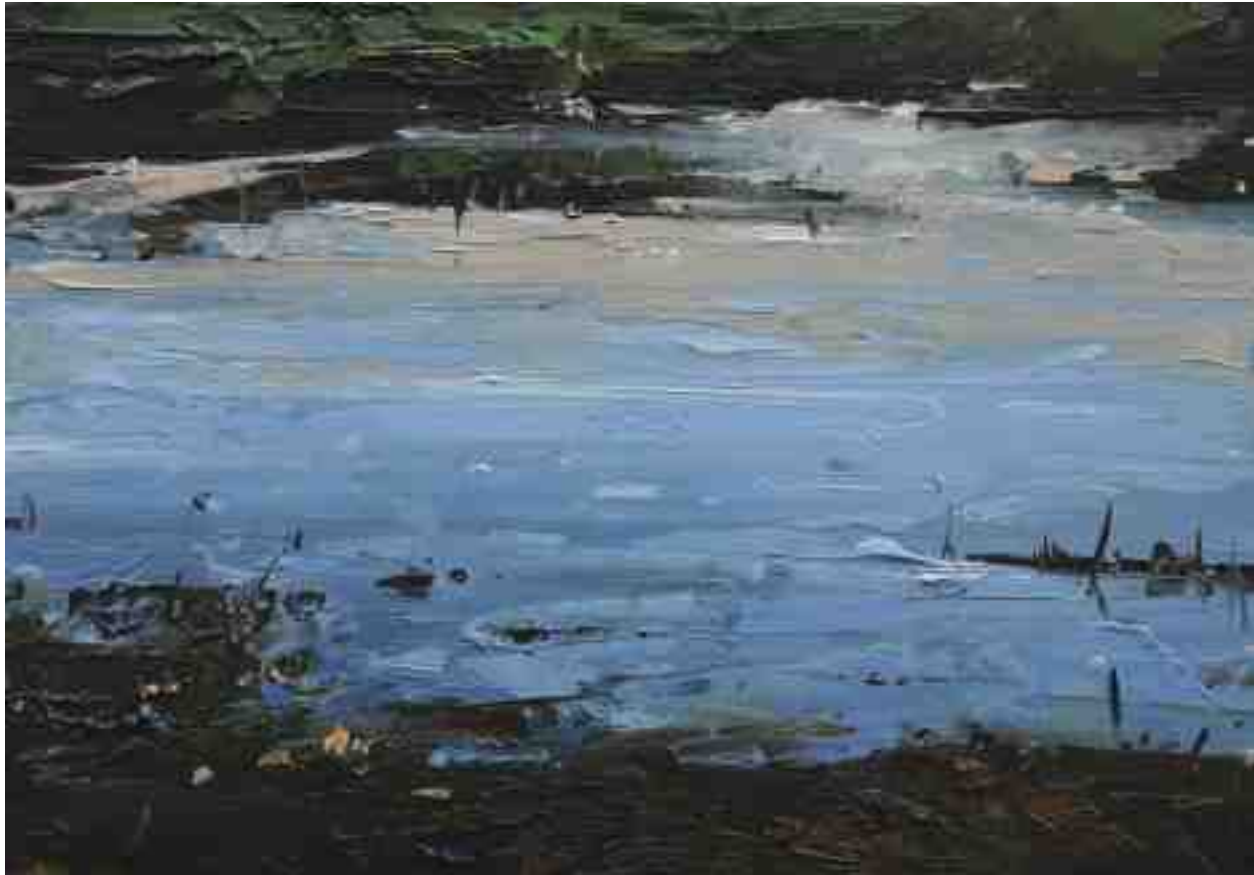
Landschaftsstudie 040 2019 | Öl/Kt | 14 x 20 cm