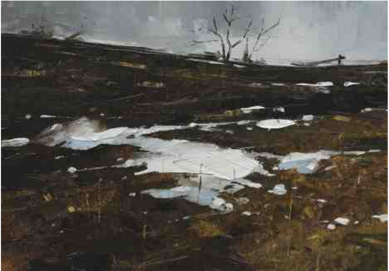
Landschaftsstudie 081 2019 | Öl/Kt | 14 x 20 cm