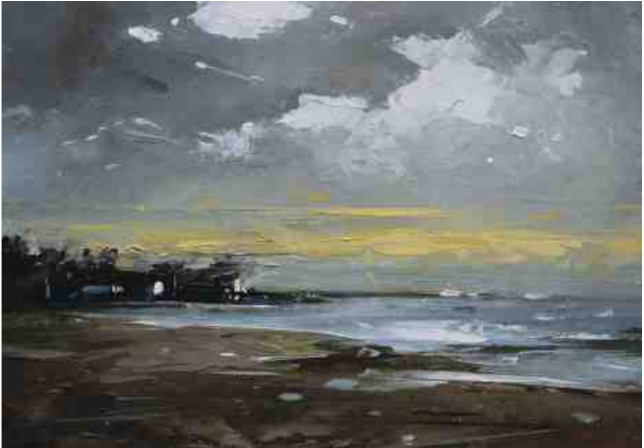
Landschaftsstudie 067 2019 | Öl/Kt | 14 x 20 cm