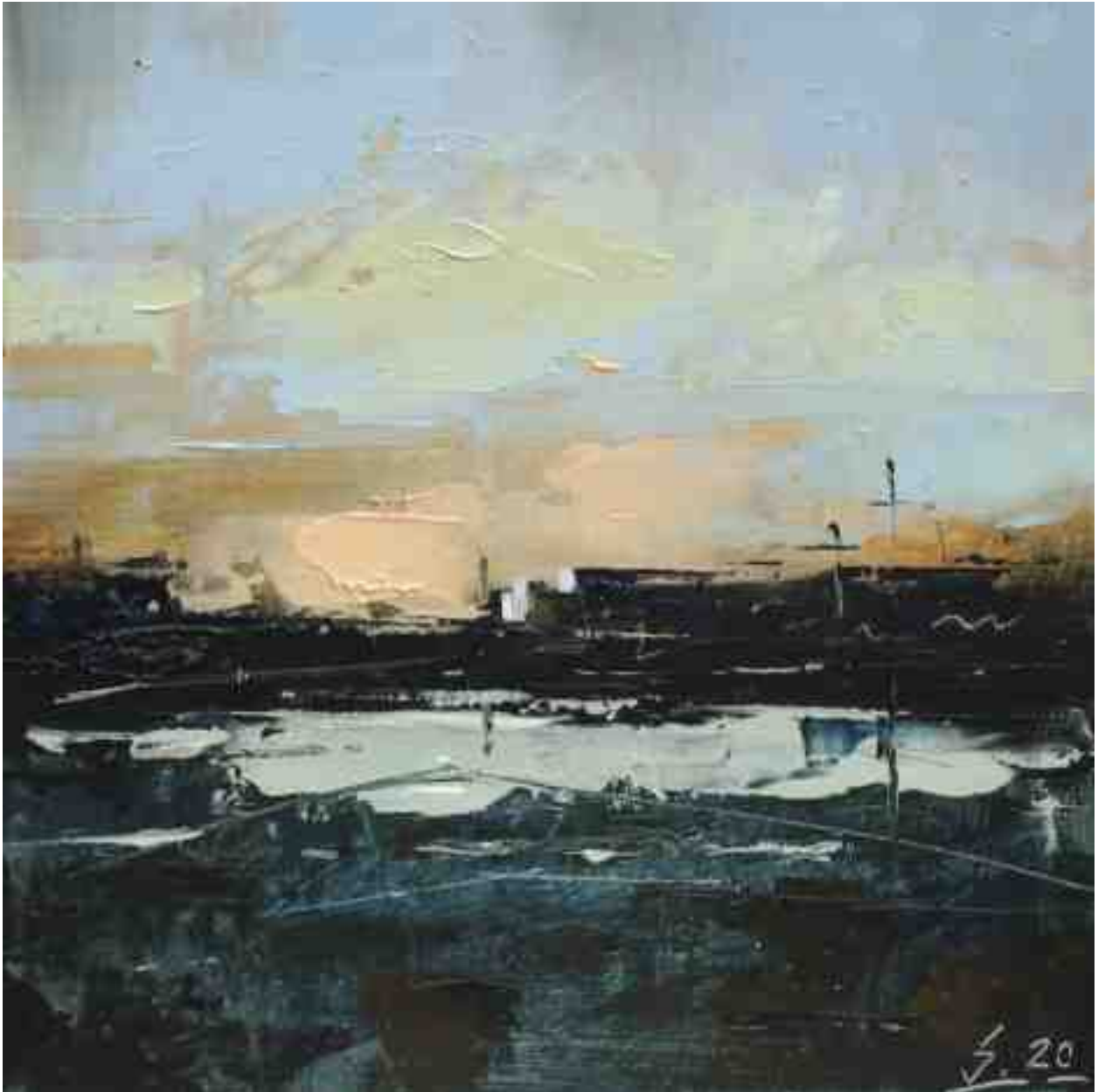
Küste XII 2020 | Öl/Kt | 17 x 17 cm