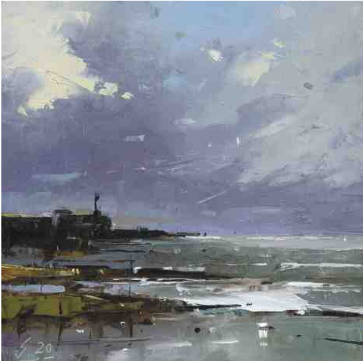
Küste XXI 2020 | Öl/Kt | 17 x 17 cm