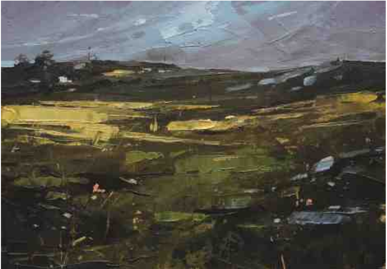
Landschaftsstudie 091 2019 | Öl/Kt | 14 x 20 cm