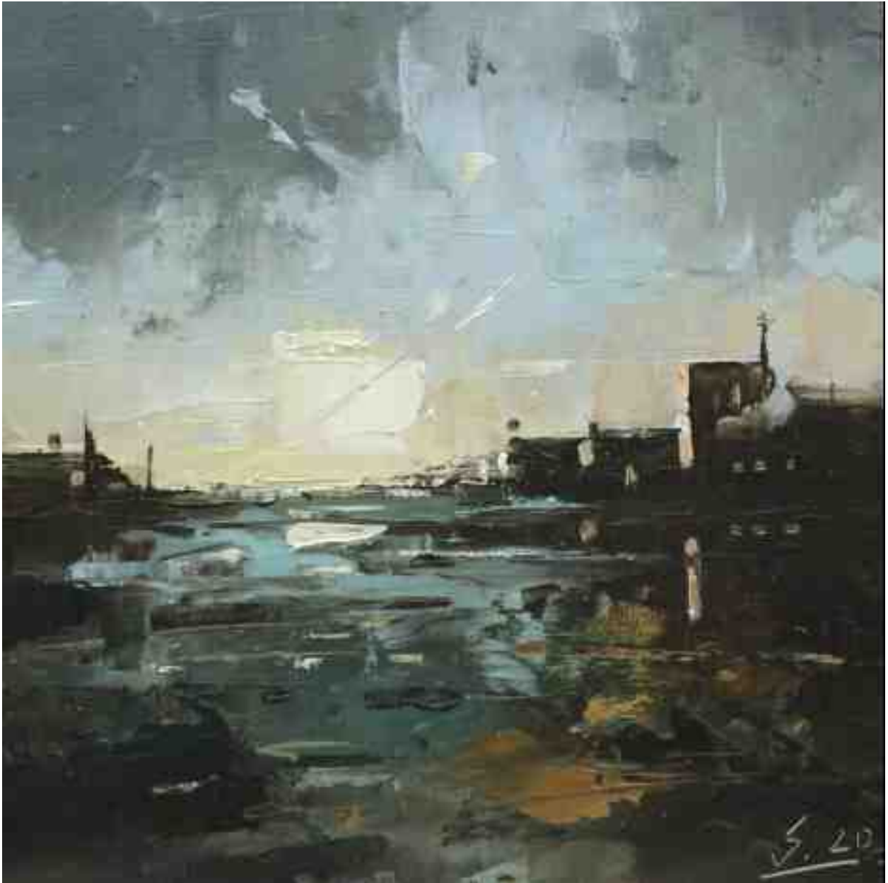
Küste XIV 2020 | Öl/Kt | 17 x 17 cm