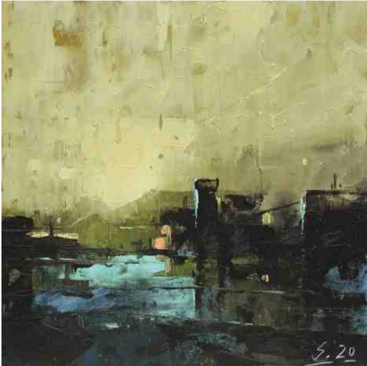
Küste IX 2020 | Öl/Kt | 17 x 17 cm