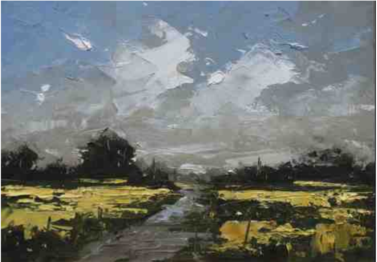
Landschaftsstudie 021 2019 | Öl/Kt | 14 x 20 cm