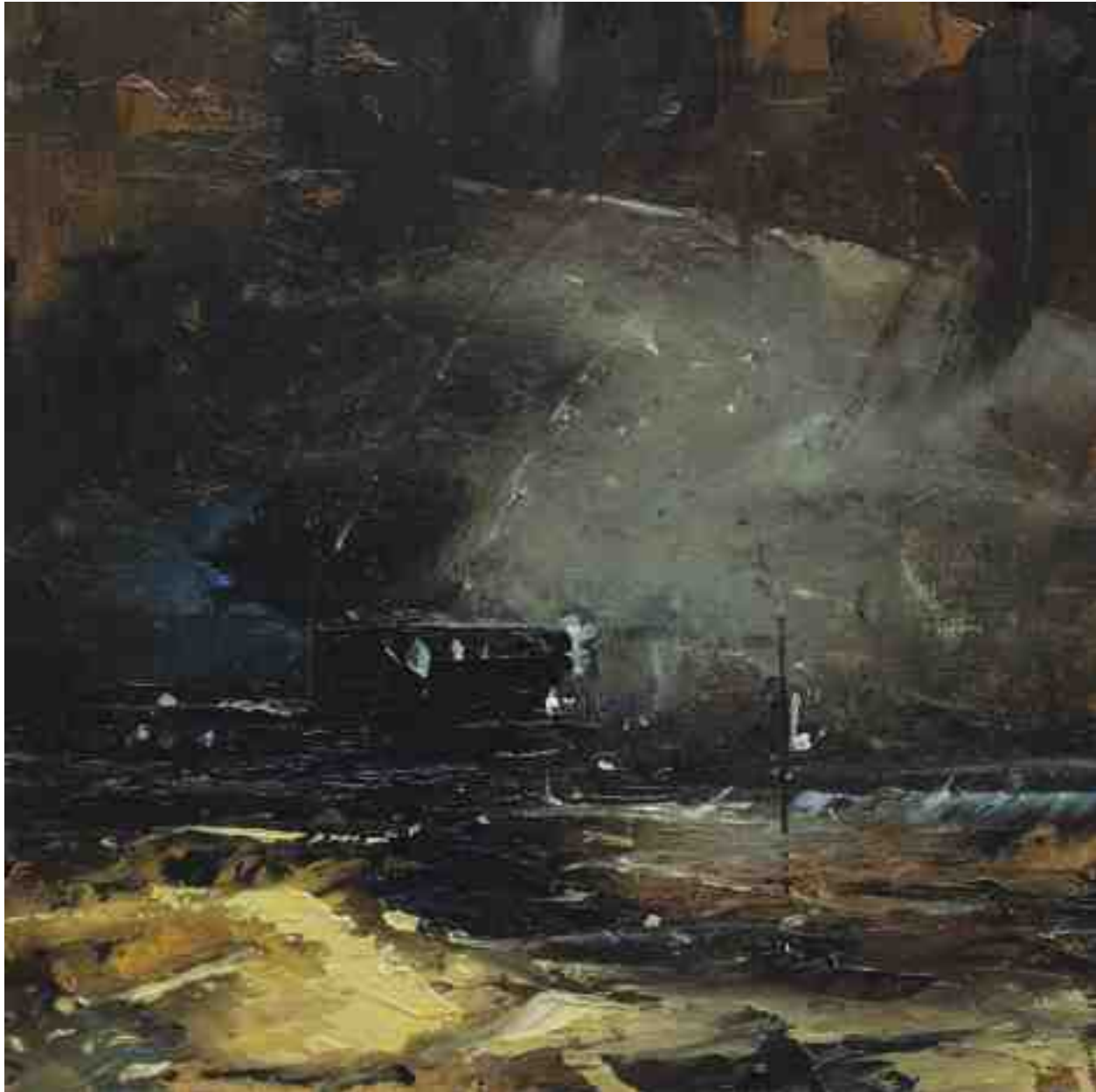
Landschaftsstudie 010 2019 | Öl/Kt | 18 x 18 cm