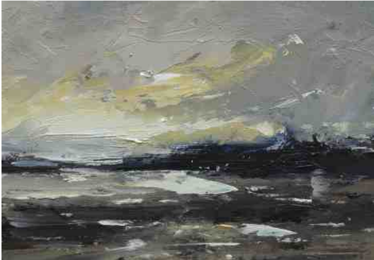
Landschaftsstudie 016 2019 | Öl/Kt | 14 x 20 cm