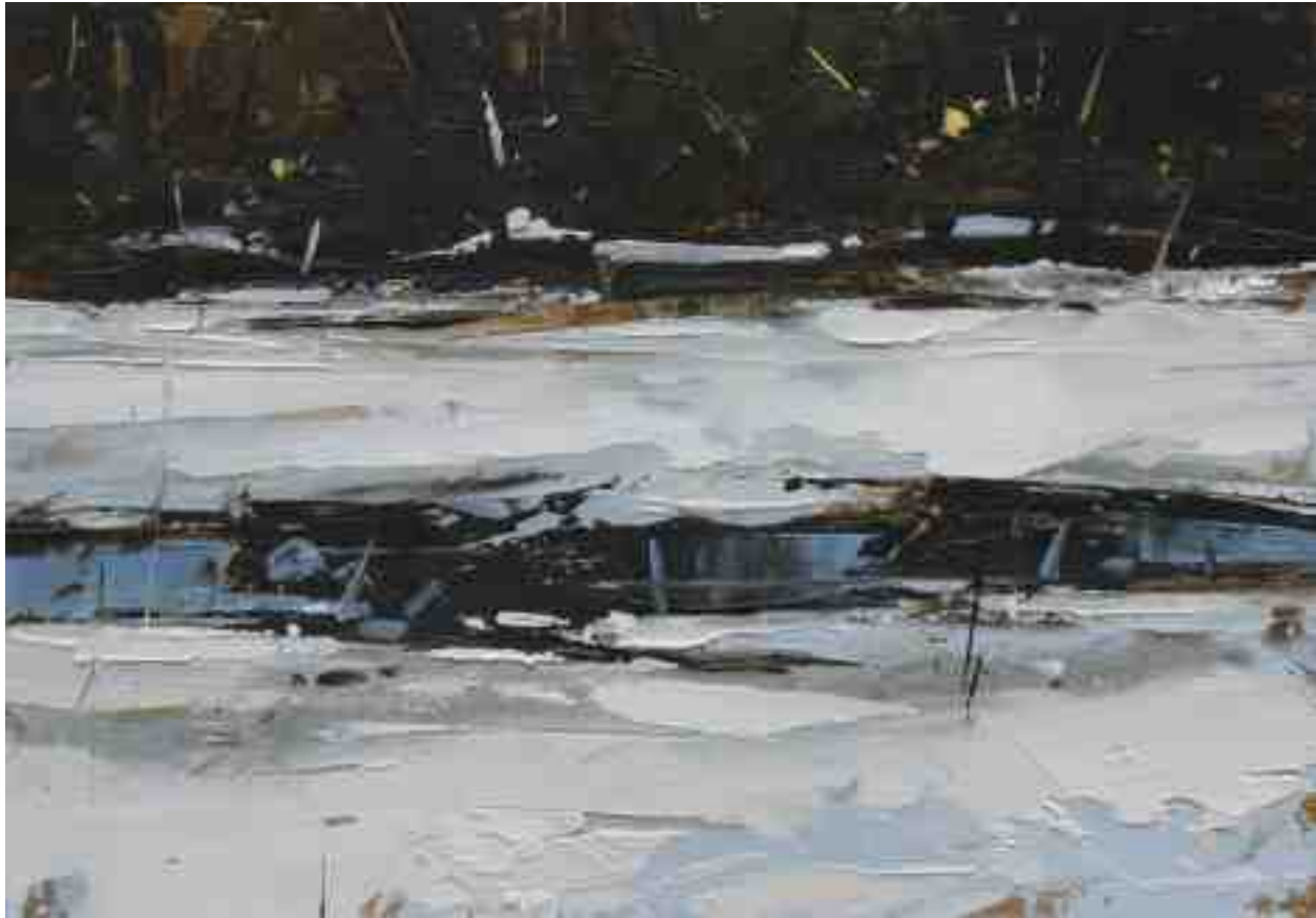
Landschaftsstudie 090 2019 | Öl/Kt | 14 x 20 cm