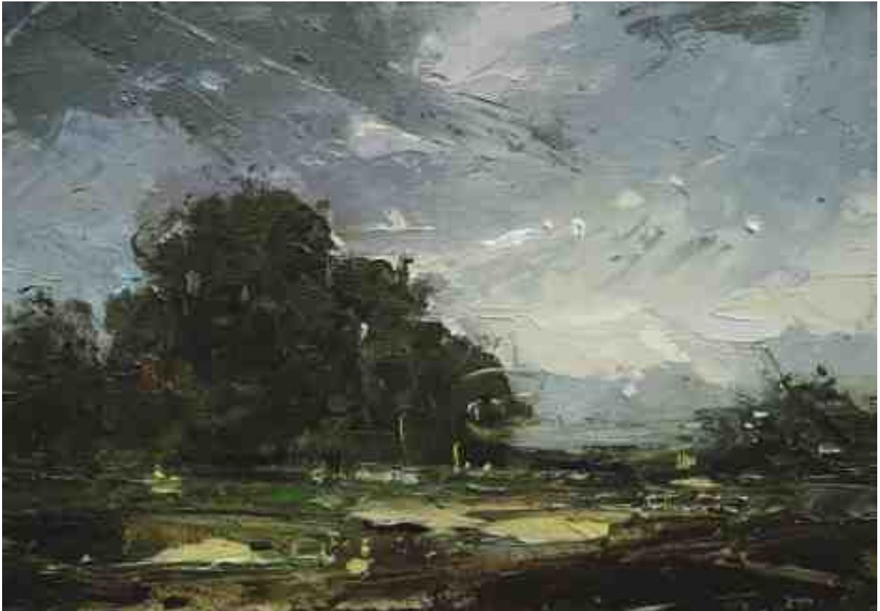
Landschaftsstudie 005 2019 | Öl/Kt | 14 x 20 cm