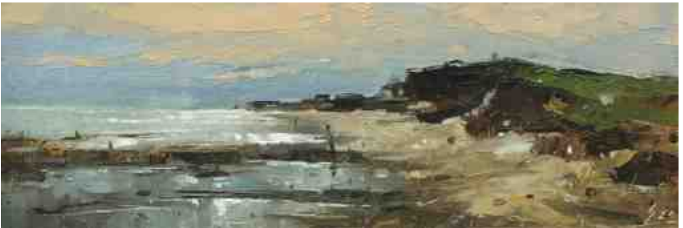
Küste XXX 2020 | Öl/Kt | 10 x 30 cm