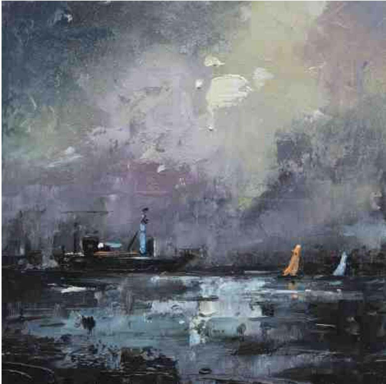
Landschaftsstudie 054 2019 | Öl/Kt | 18 x 18 cm