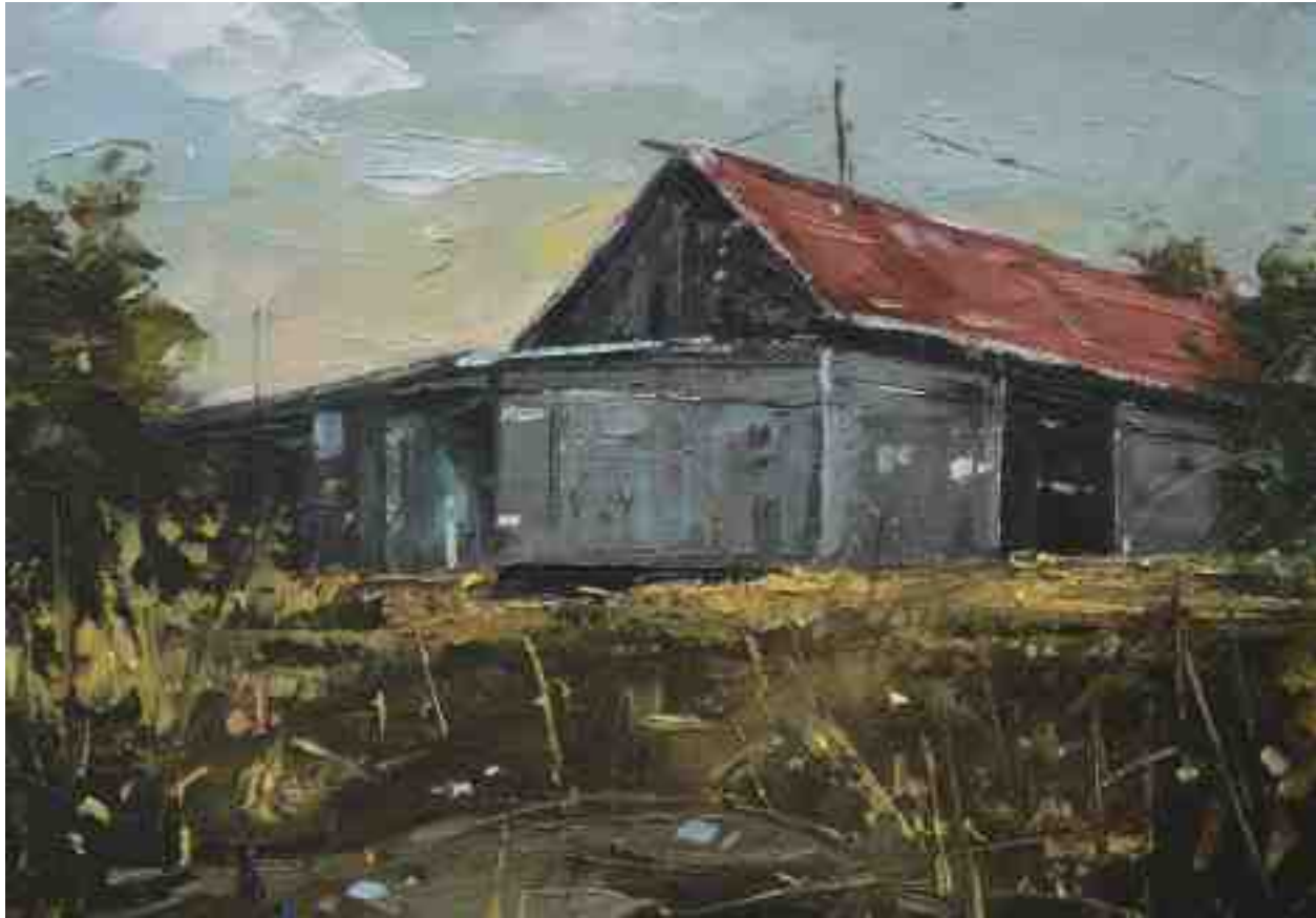
Landschaftsstudie 062 2019 | Öl/Kt | 14 x 20 cm