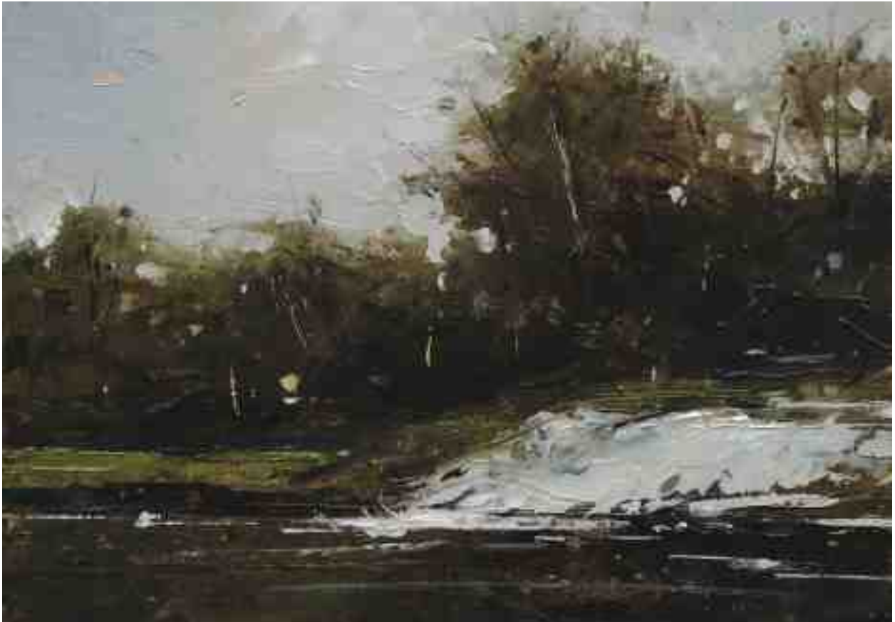
Landschaftsstudie 083 2019 | Öl/Kt | 14 x 20 cm