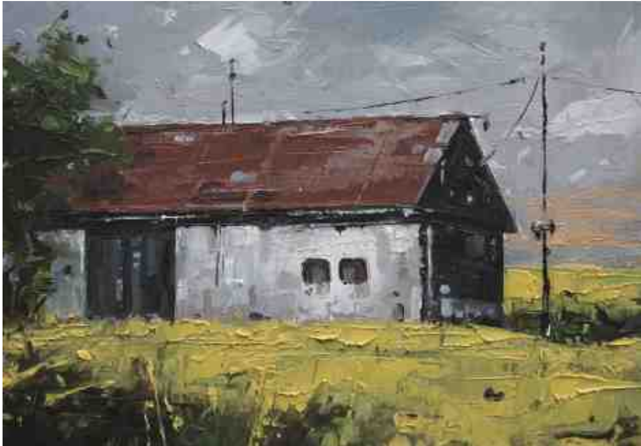
Landschaftsstudie 060 2019 | Öl/Kt | 14 x 20 cm