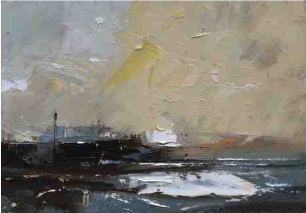
Landschaftsstudie 018 2019 | Öl/Kt | 14 x 20 cm