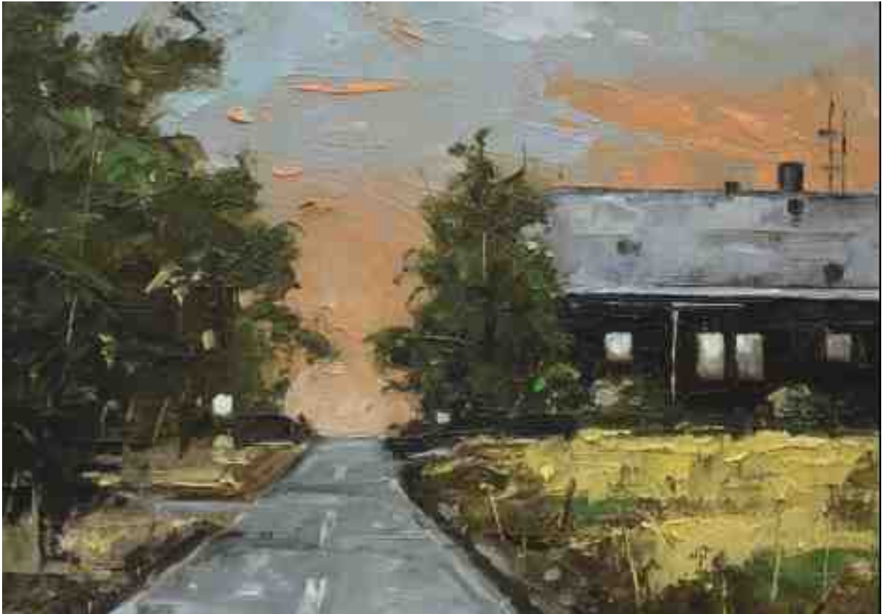
Landschaftsstudie 061 2019 | Öl/Kt | 14 x 20 cm