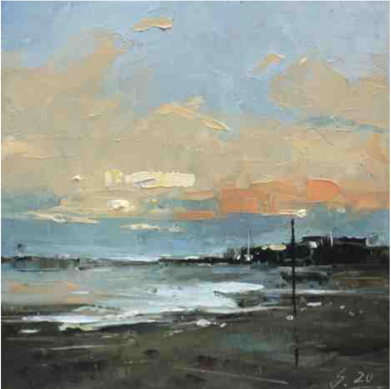
Küste XVI 2020 | Öl/Kt | 17 x 17 cm