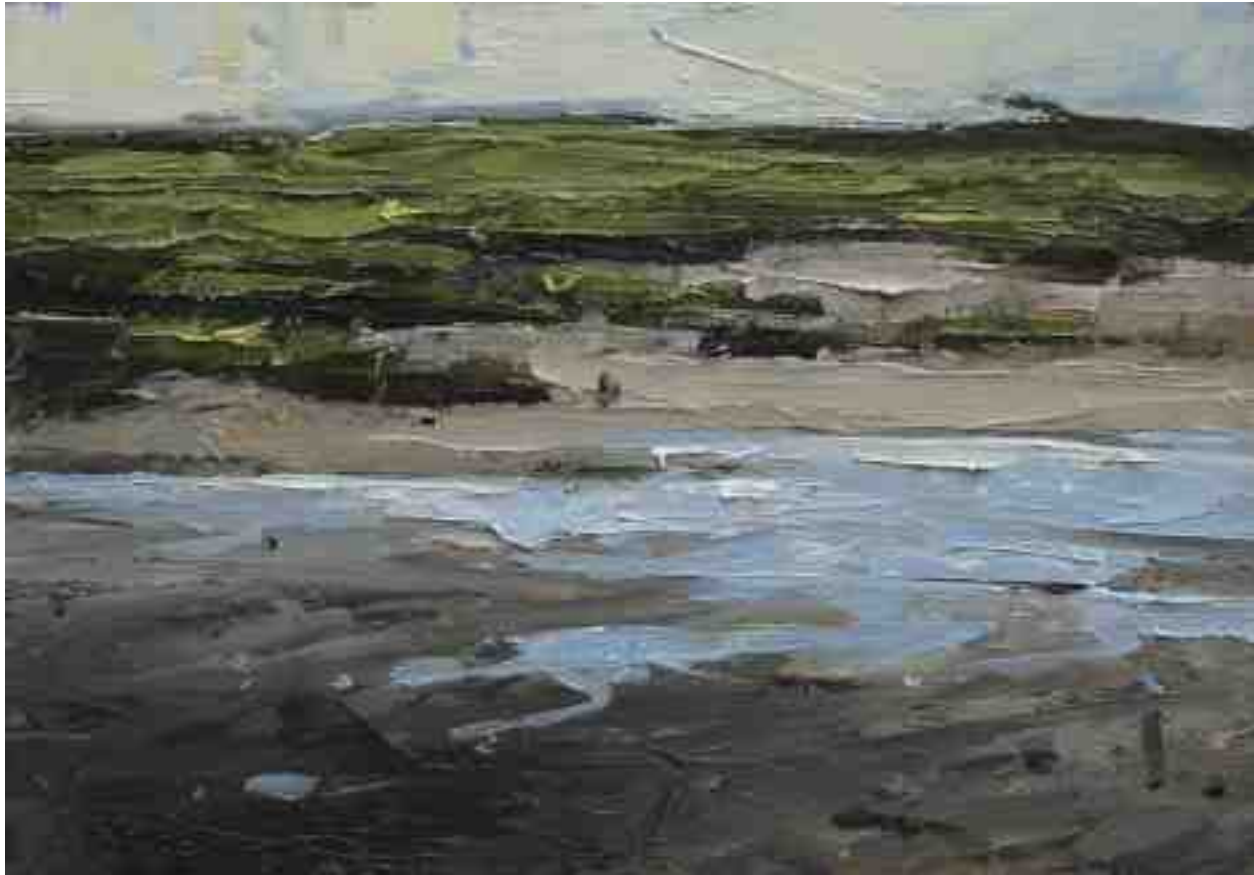
Landschaftsstudie 038 2019 | Öl/Kt | 14 x 20 cm