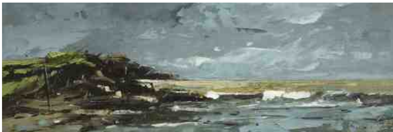
Küste XXXI 2020 | Öl/Kt | 10 x 30 cm