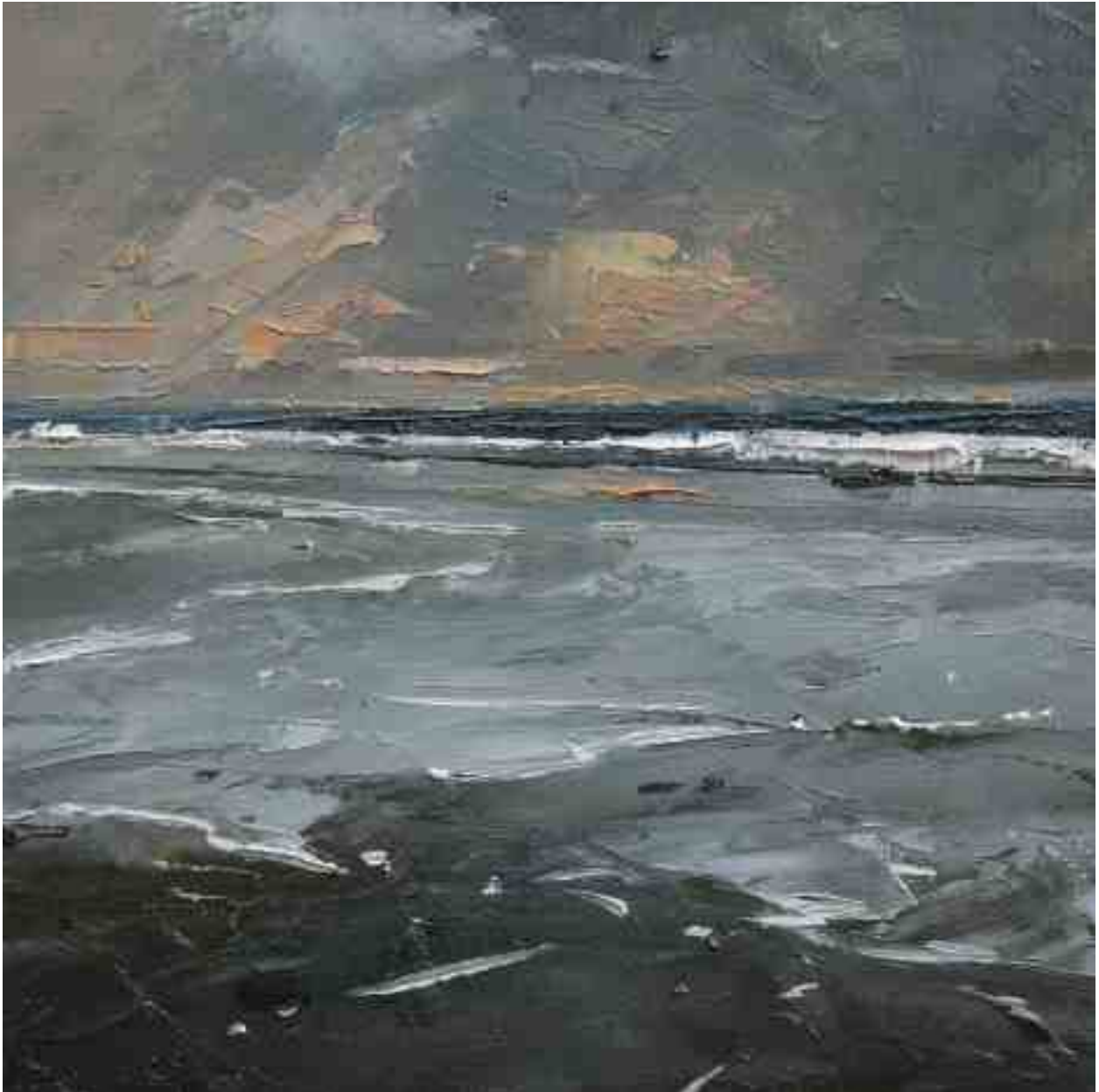
Landschaftsstudie 029 2019 | Öl/Kt | 18 x 18 cm