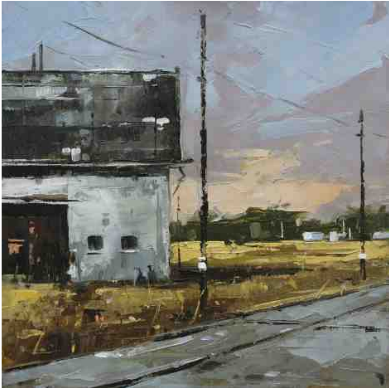
Landschaftsstudie 098 2019 | Öl/Kt | 18 x 18 cm